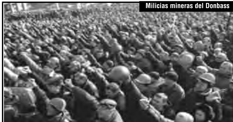
Milicias mineras del Donbass