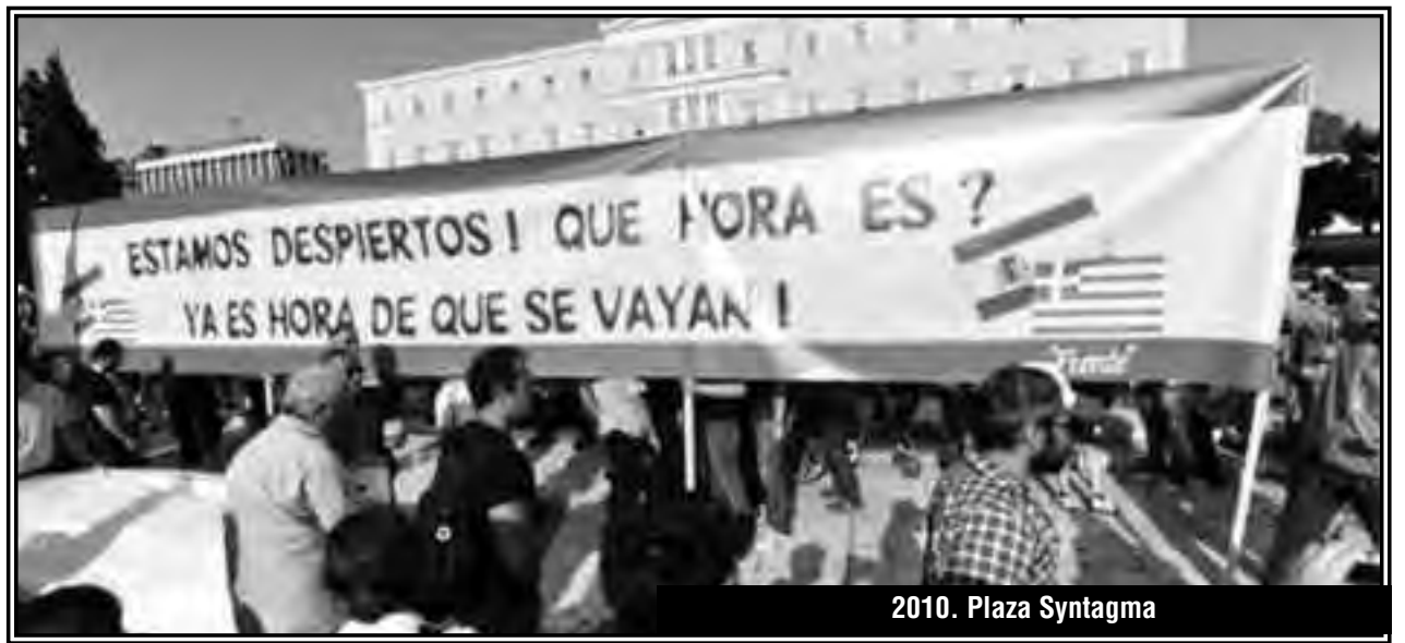
2010. Plaza Syntagma

El plebiscito fue un gran chantaje contra las masas. Y la nueva izquierda mundial, fue CÓMPlice