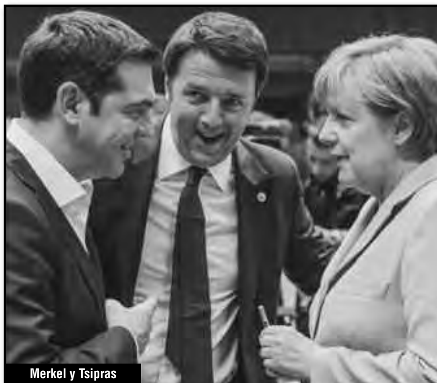
Merkel y Tsipras

¿Qué discuten entre ellos? Cuánto pueden sacarle de jubilación, salario, trabajo, salud y vida a los trabajadores, antes de que éstos retomen abiertamente el camino de la revolución. Lo que discuten es si las condiciones de hoy dan para quitarle uno o dos dedos o directamente una mano a los explotados.