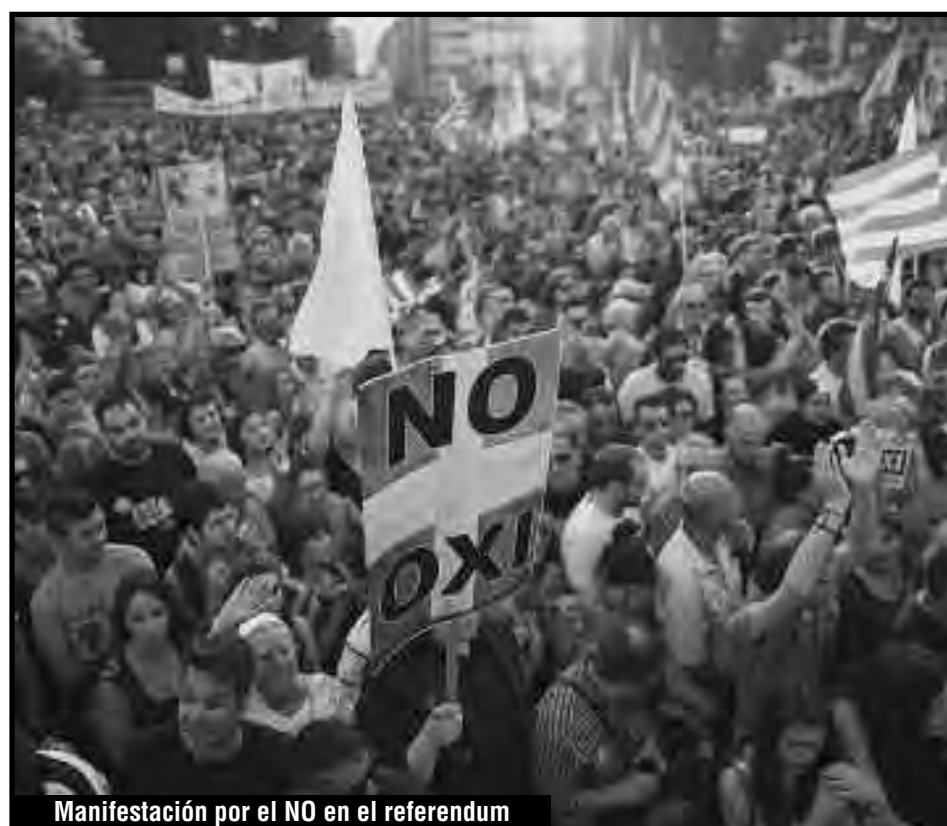
Manifestación por el NO en el referendun

La clase obrera puede utilizar los parlamentos burgueses como tribuna de denuncia en las filas del enemigo y preparar sus combates. Esto también sucede en el caso de la libertad de expresión, para organizar sindicatos, etc. Pero las instituciones bonapartistas de dominio de la burguesía, como es su justicia, sus fuerzas policiales, y en este caso los referéndums, no pueden ser utilizadas por los trabajadores, porque son medidas bonapartistas y antidemocráticas, aún desde el punto de