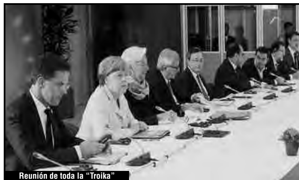
Reunión de toda la "Troika"

Romperán las "alas izquierda" con Syriza votando en contra junto a los "nacionalistas", pero surgirá una absoluta mayoría del "SI" y el "NO", que impondrán las peores penurias contra las masas.