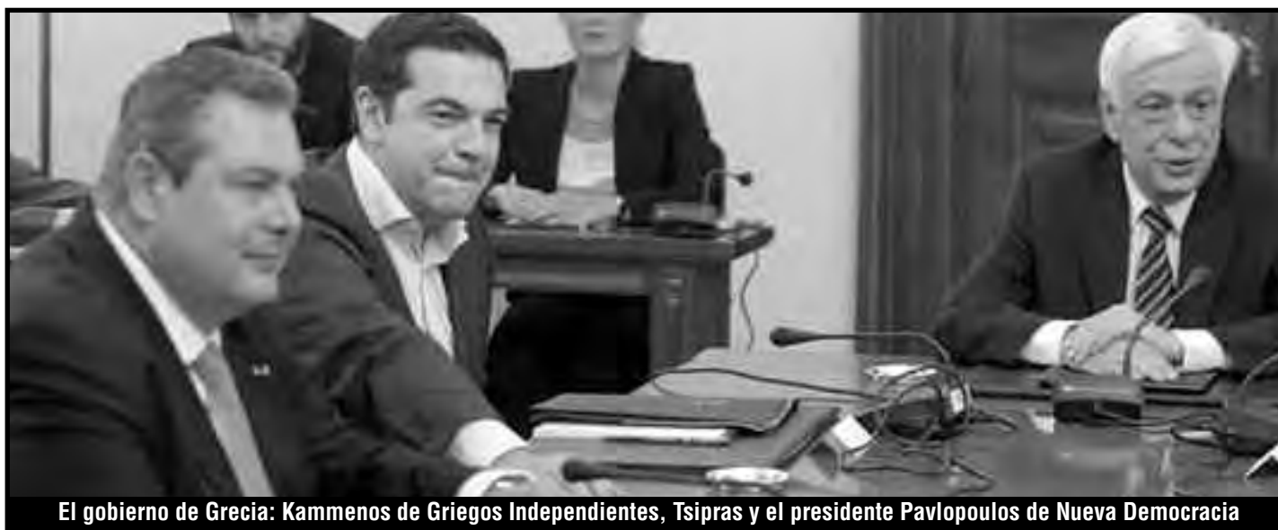
El gobierno de Grecia: Kammenos de Griegos Independientes, Tsipras y el presidente Pavlopoulos de Nueva Democracia

Con la juventud rebelde y su comité de autodefensa se defendió a los inmigrantes de la golviza de las bandas fascistas. La clase media arruinada del campo fue a vender directamente sus productos a la ciudad, para romper la cadena de distribución que encarecía sus mercancías, para que el pueblo coma. La alianza obrera y popular estaba al alcance de la mano y aún lo está ante los ahorros de las clases medias arruinadas expropiados con el "corralito". La juventud puso sus mártires, como Alexis Grigoropulos -fusilado por la policía asesina de Karamanlis- y Pavlos Fyssas, asesinado por las bandas fascistas de Amanecer Dorado.