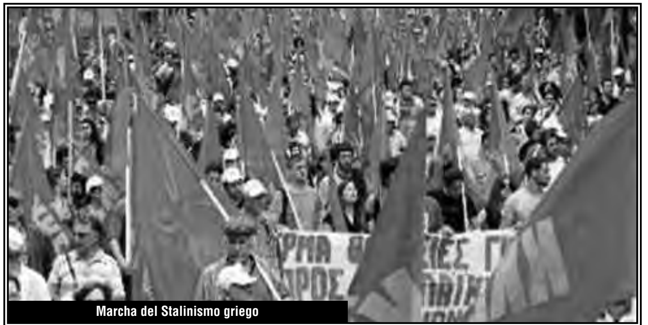
Marcha del Stalinismo griego

El PTS anunciaba la madre de todas las batallas contra el plebiscito, pero se quedó en la "vereda del NO", dándole ideología por izquierda a Syriza. Luego de insistir correctamente de que por la polí-