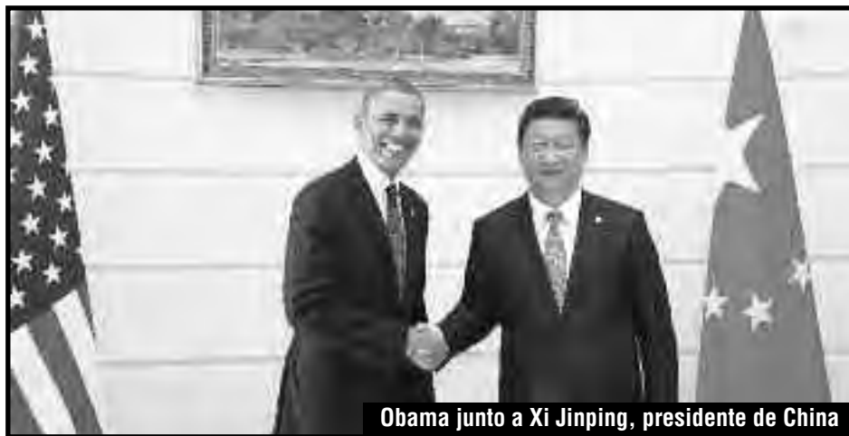
Obama junto a Xi Jinping, presidente de China

La crisis griega esta vez empalma con el estallido de la bolsa china, que preanuncia que el estancamiento de su economía es producto de una nueva relocalización de las transnacionales a zonas del planeta donde la mano de obra es más barata. Es el indicio de que el capital está saliendo del proceso productivo, donde le ha caído la tasa de ganancia. Bancos paralelos a la banca oficial y sin control han dado