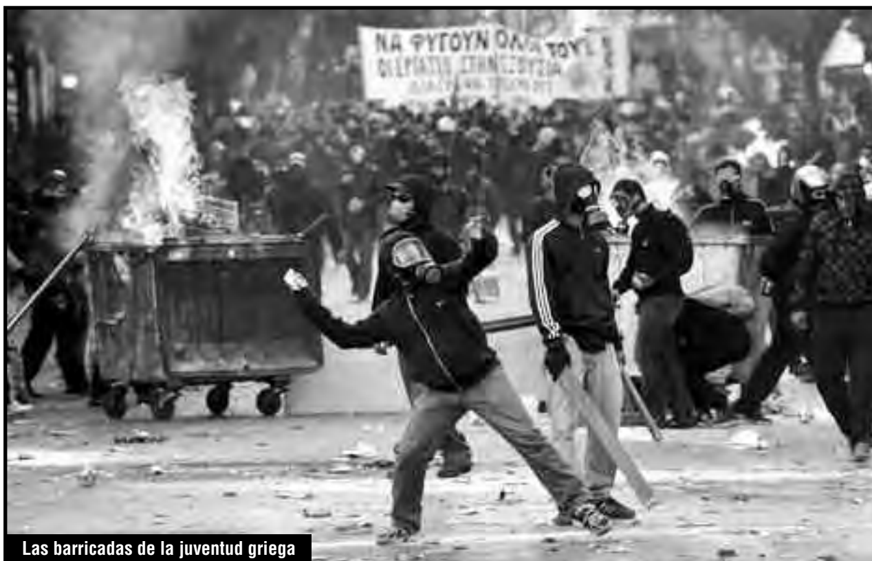
Las barricadas de la juventud griega

Ese poder de los consejos de obreros y soldados griegos, sería la única alternativa solidaria a los trabajadores del estado español contra la mentira de PODEMOS y su promesa de “una nueva revolución democrática” llevada adelante con la monarquía de los Borbones reformada.