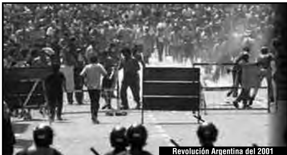
Revolución Argentina del 2001

El reformismo preparó a la clase obrera para una lucha de presión con votos en urnas para "parar la ofensiva del gran capital". Éste sacó su látigo, y dijo "así se resuelve esta cuestión". Disciplinó a su agente Syriza y a Tsipras, y lo mandó a atacar a la clase