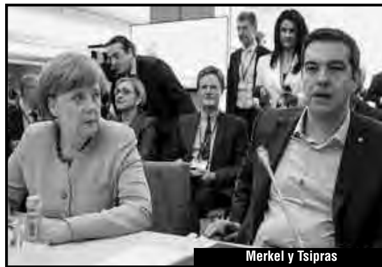
Merkel y Tsipras

En esa misma declaración afirmábamos: "El plebiscito es un engaño antidemocrático, porque éste no es el enfrentamiento de un 'programa de los trabajadores' contra el 'programa de los capitalistas'. El NO de Syriza y el SÍ de la Merkel son dos políticas de los bandidos imperialistas para que sea la clase obrera la que pague la crisis...". Asimismo planteábamos: "El plebiscito es totalmente antidemocrático y bonapartista. Les