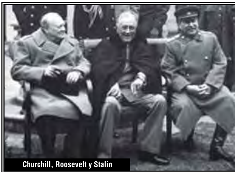
Churchill, Roosevelt y Stalin

Ellos plantean que es "táctico" que "se suspenda la lucha de clases" y que "el proletariado limite sus demandas para hacer un bloque con la burguesía". Ellos, desde Lasalle hasta los renegados del trotskismo de hoy, pasando por Bernstein, Kautsky, Martov y Stalin, a todo responden que es algo "táctico".