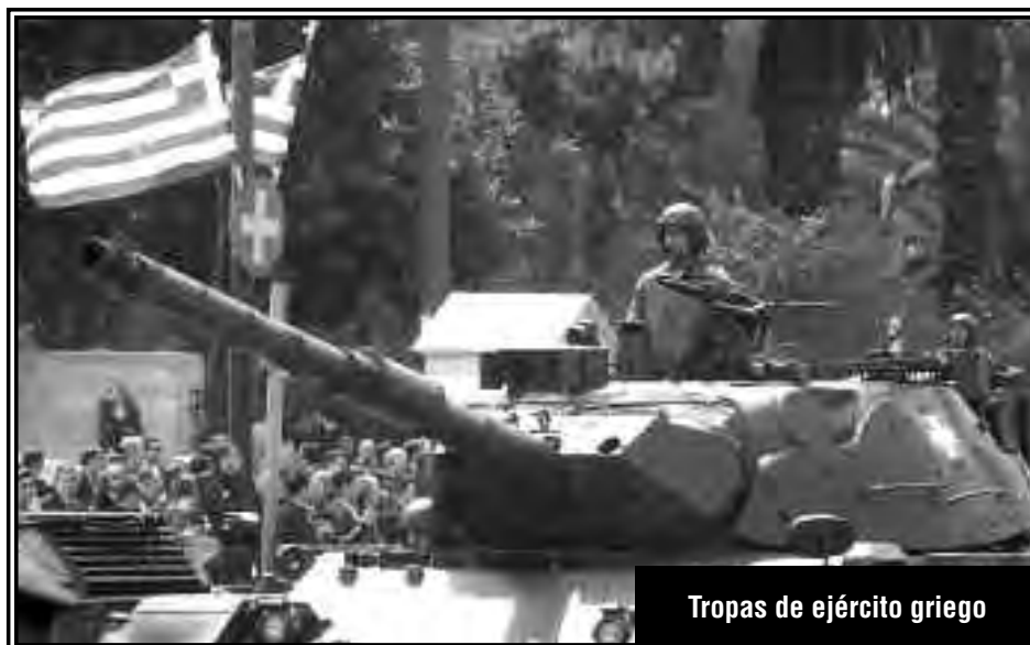
Tropas de ejército griego

Esta es la única forma de plantear el actual momento de Grecia desde un punto de vista estratégico. Todo lo demás es verso reformista.