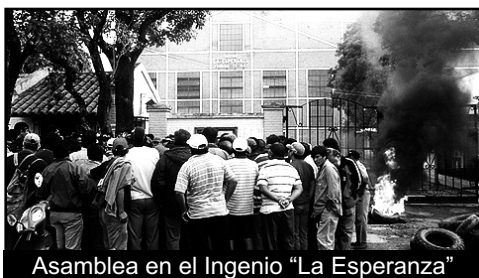
Asamblea en el Ingenio "La Esperanza"

Ellos vienen por todo; nosotros tenemos que ir por todos ellos