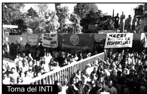
Toma del INTI

¡HAY QUE RETOMAR EL COMBATE DE DICIEMBRE!