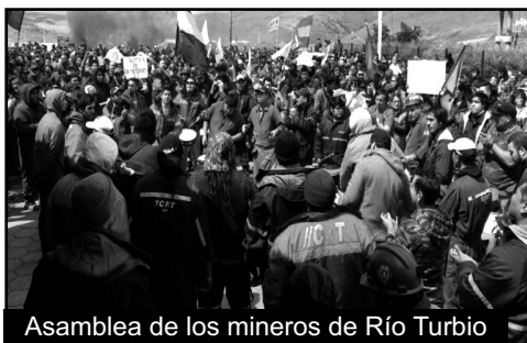
Asamblea de los mineros de Río Turbio