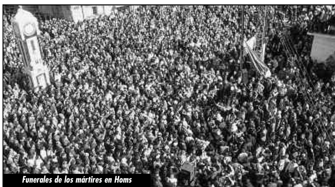
Funerales de los mártires en Homs

¡BRIGADAS INTERNACIONALES DE LAS ORGANIZACIONES OBRERAS PARA IR A COMBATIR Y ROMPER EL CERCO A LAS HEROICAS MASAS DE SIRIA!