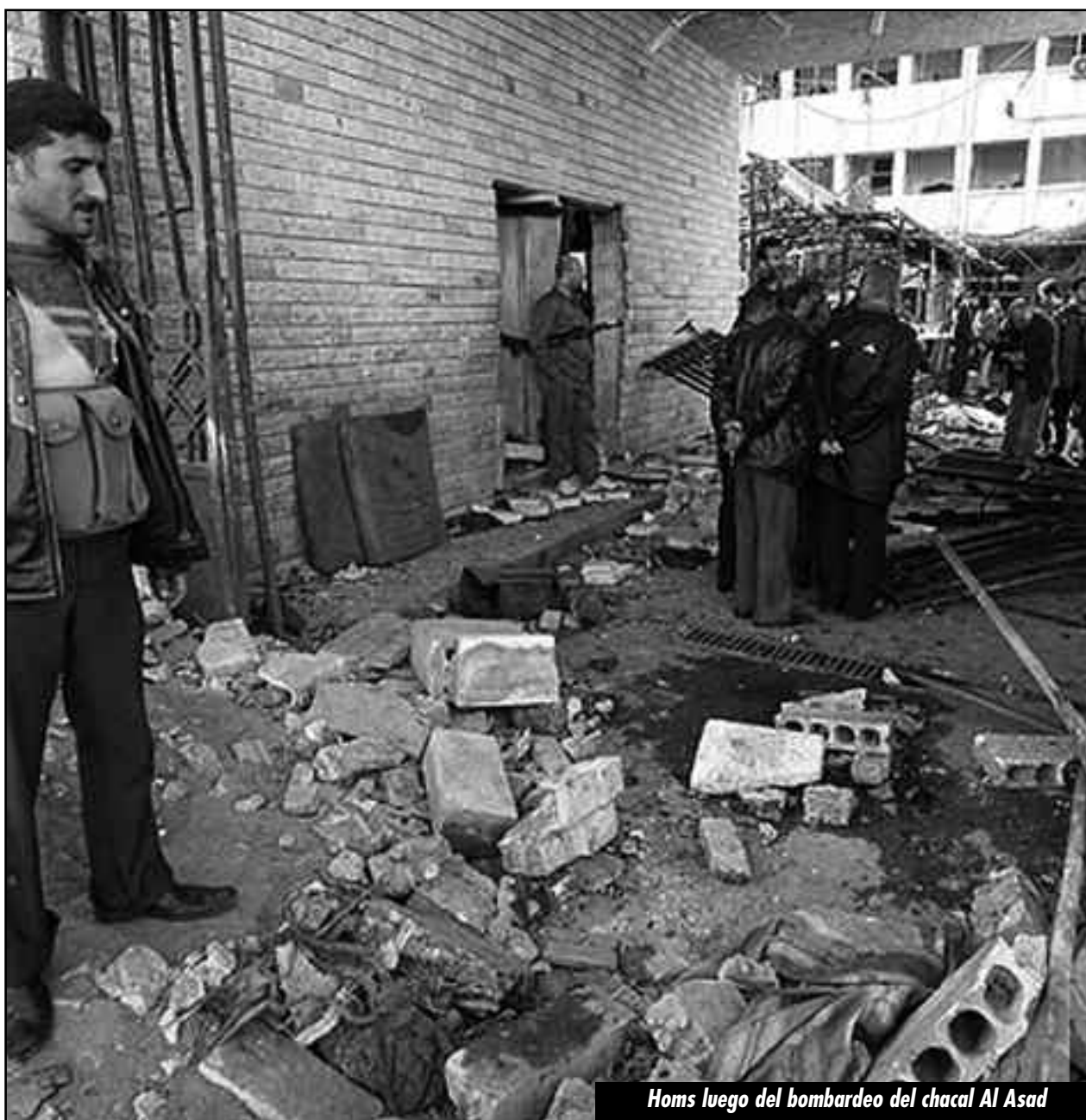
Homs luego del bombardeo del chacal Al Assad

Ya mismo, mientras con el chacal Al-Assad masacran en Homs y Damasco, se ha descargado un nuevo y brutal ataque contra la clase obrera griega y