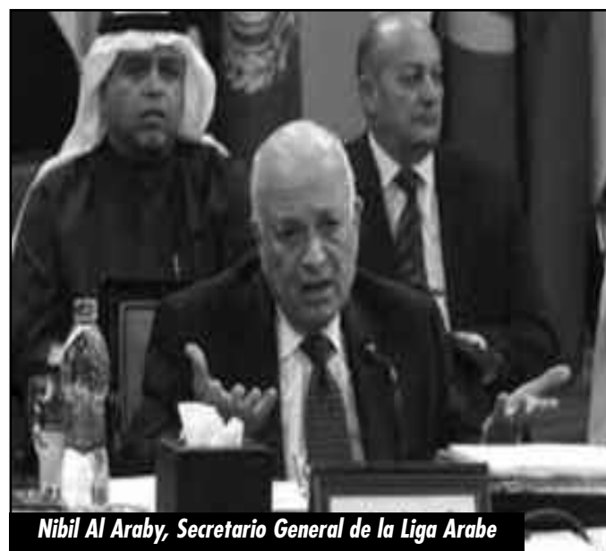
Nibil Al Araby, Secretario General de la Liga Arabe

¡FUERA EL CNS (CONSEJO NACIONAL SIRIO) QUE, INSTALADO EN EL PROTECTORADO IMPERIALISTA DE QATAR, INTENTA EXPROPIAR LA HEROICA INSURRECCIÓN DE LOS EXPLOTADOS, SIN COMBATIR, SIN MORIR EN LAS CALLES DE HOMS O DE DAMASCO!