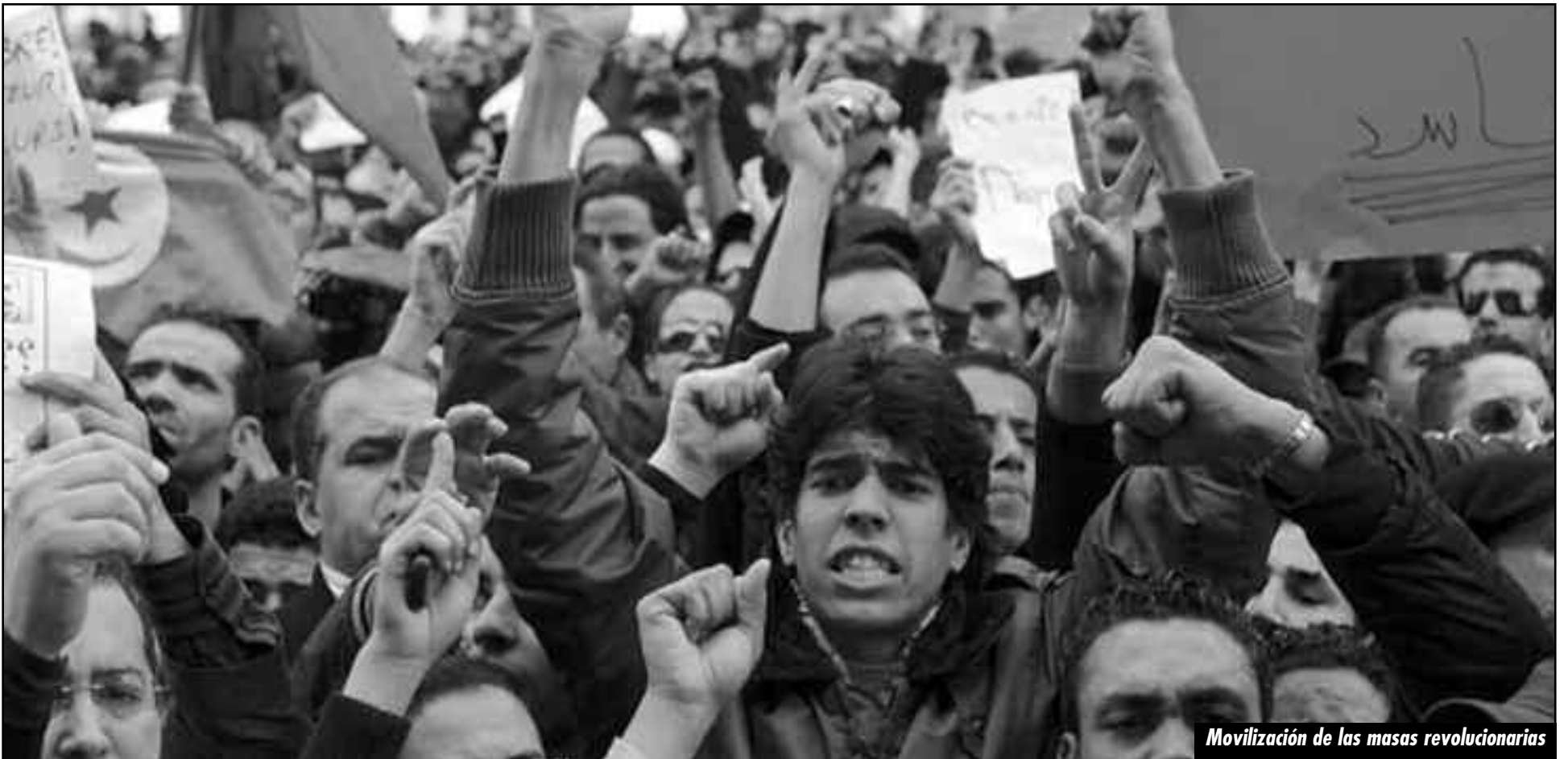
Movilización de las masas revolucionarias

La crisis de la economía mundial ha golpeado muy duramente a Túnez, país que hace un año se transformó en la chispa que incendió el levantamiento revolucionario en todo el Norte de África y Medio Oriente.