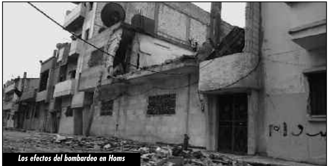
Los efectos del bombardeo en Homs

Al-Assad masacra y cerca a las masas revolucionarias sirias como lo hace el sionismo con las masas palestinas en la Gaza martirizada. Quiere reducir a guetos cercados los barrios obreros y de los explotados de todas las ciudades de Siria