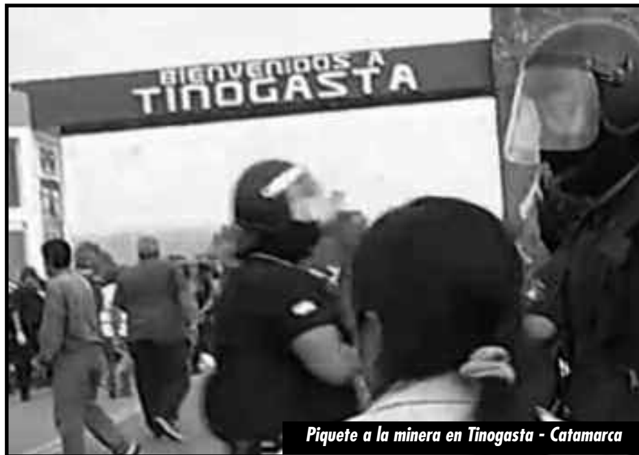
Piquete a la minera en Tinogasta - Catamarca

Es el verso de los llamados “bolivarianos” en el continente americano, que