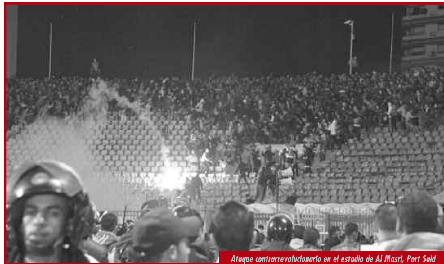
Ataque contrarrevolucionario en el estadio de Al Masri, Port Said

Siguiendo el calendario de la histórica Revolución Rusa, podríamos definir estos hechos como una mini "Jornada de julio", que tuvo como objetivo dar un escarmiento y un duro golpe contrarrevolucionario sobre sectores específicos de la vanguardia proletaria y de los estudiantes combativos. Una verdadera trampa cínicamente calculada por la burguesía contra explotados indefensos. Indudablemente el ataque debía ser