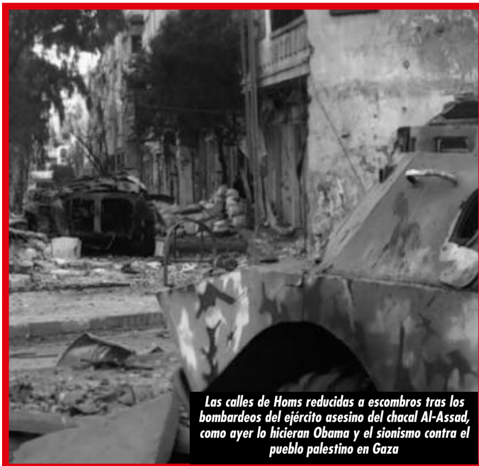
Las calles de Homs reducidas a escombros tras los bombardeos del ejército asesino del chacal Al-Assad, como ayer lo hicieron Obama y el sionismo contra el pueblo palestino en Gaza

¡LOS TRABAJADORES DE HOMS, HAMA Y DAMASCO NO SE RINDEN!