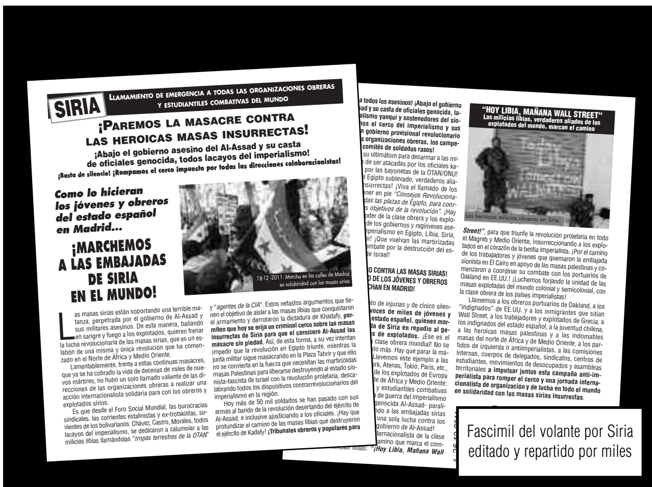
Fascimil del volante por Siria editado y repartido por miles

Es que desde el Foro Social Mundial, las burocracias sindicales, las corrientes estalinistas y ex-trotskistas, sir-