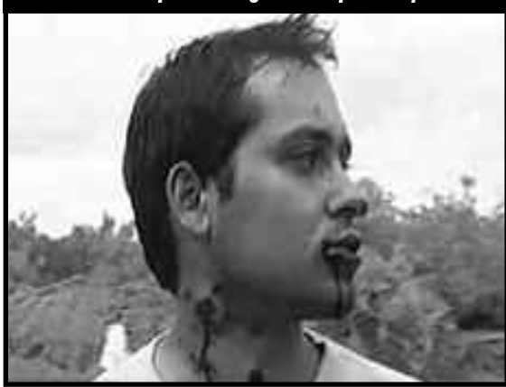
Jóven herido por la sangrienta represión policial

¡Hay que pararle la mano al gobierno de la Kirchner, la "oposición" gorila y el imperialismo! "¡Si tocan a uno, nos tocan a todos!"