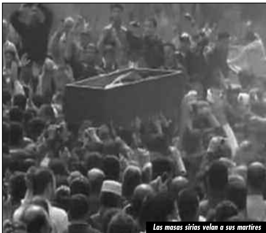
Las masas sirias velan a sus mártires

¡Abajo el CNT y su ultimátum para desarmar a las milicias libias a riesgo