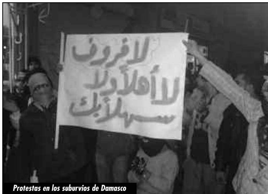
Protestas en los suburbios de Damasco

La tarea de romper el aislamiento y colaborar decisivamente con los explotados de Siria para aplastar a Al Assad sólo puede ser llevada adelante por la clase obrera y sus organizaciones de lucha a nivel internacional, y en Siria por los explotados coordinando y centralizando su lucha, poniendo en pie una centralización de comités de obreros, milicianos y soldados armados imponiendo su propio poder.