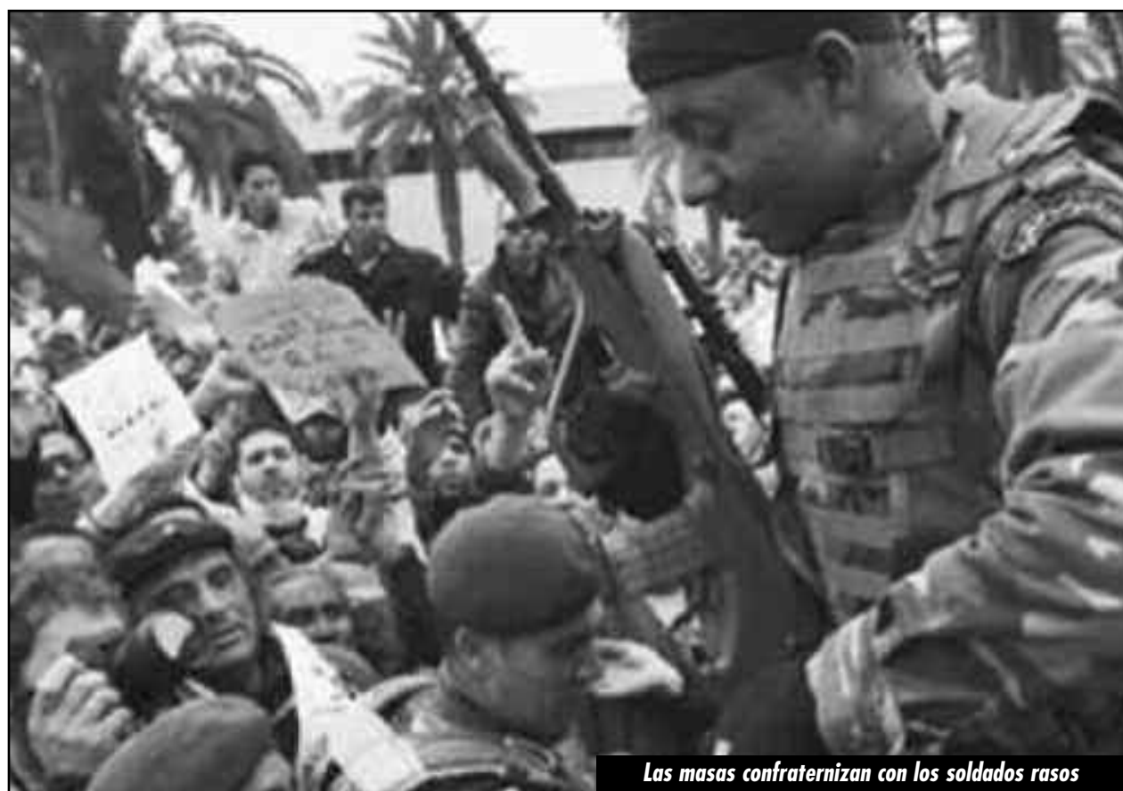
Las masas confraternizan con los soldados rasos

El Túnez profundo continúa de pie. El Túnez obrero y