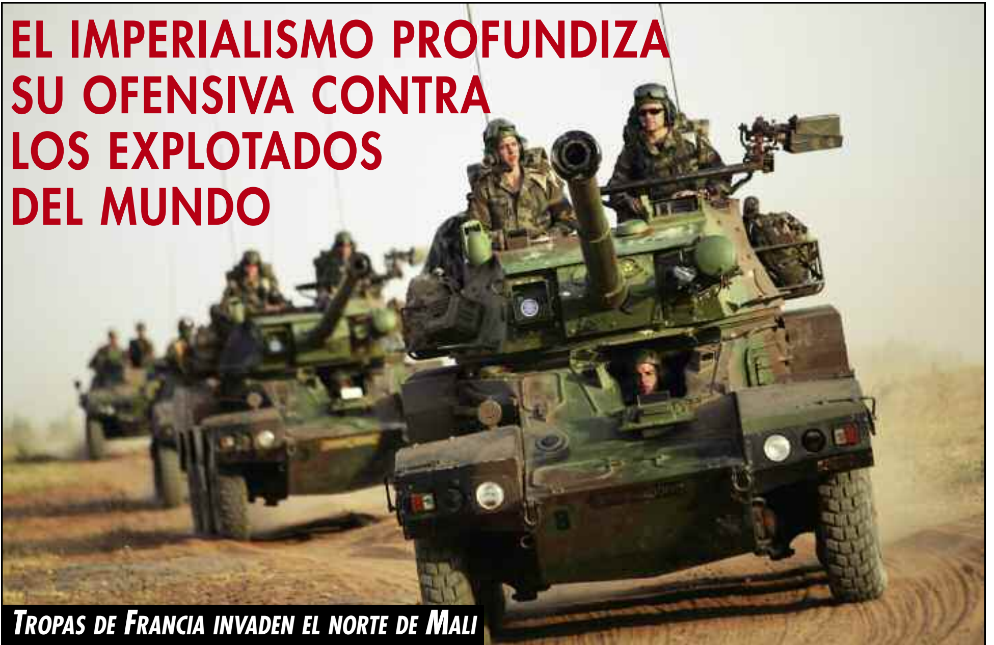
TROPAS DE FRANCIA INVADEN EL NORTE DE MALI