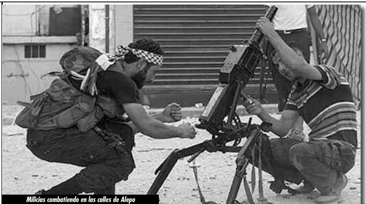
Milicias combatiendo en las calles de Alepo

Luchamos en la resistencia mil y una vez traicionada por los generales fantoches del Ejército Sirio Libre que llegan incluso a repartirse con los oficiales de Al Assad la ropa, las armas y los alimentos