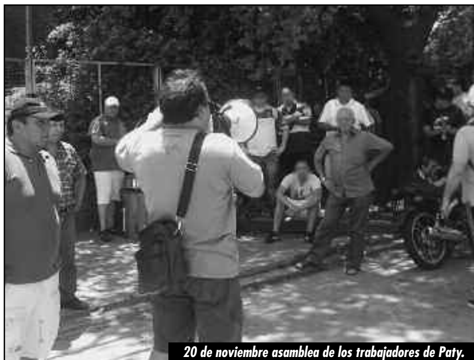
20 de noviembre asamblea de los trabajadores de Paty.

Fueron los obreros de Paty quienes en sus asambleas votaron parar la planta y marchar a la fiscalía de San Isidro cuando un compañero fue sacado por la policía de la planta y luego encarcelado. Este compañero no solo fue liberado, sino que fue reincorporado a sus tareas y el buchón del jefe de seguridad que armó la provocación patronal fue rajado de la fábrica.