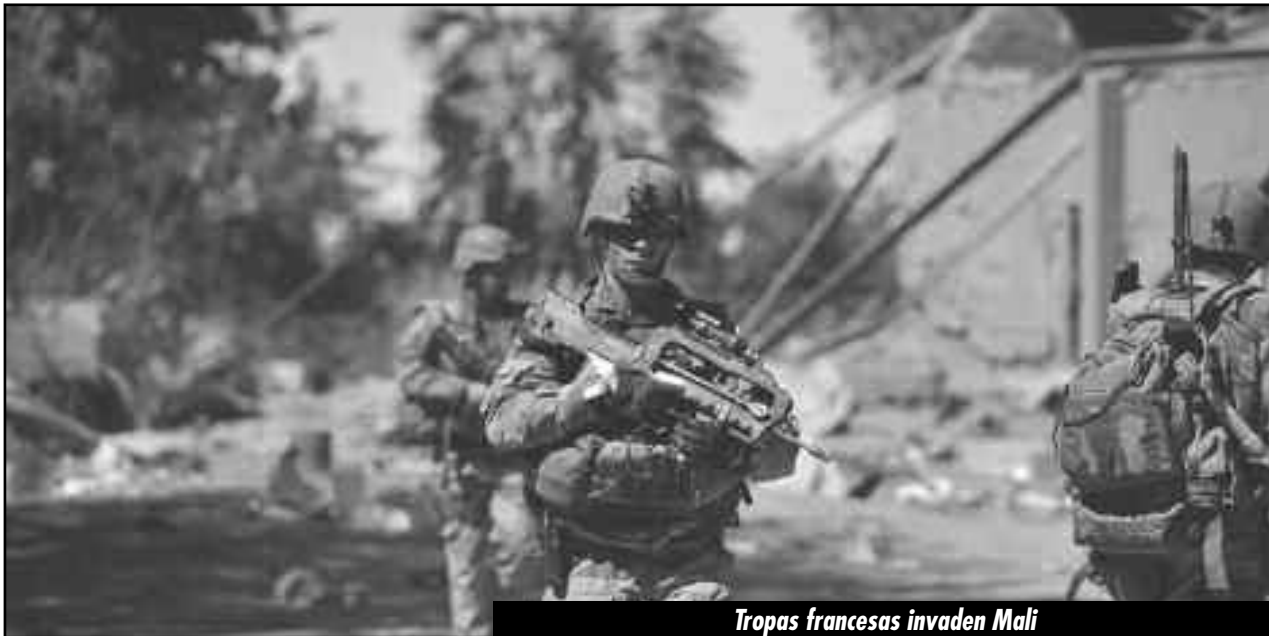
Tropas francesas invaden Mali