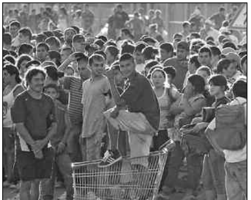
Miles de explotados el 20 de diciembre, salieron a la calle a buscar el pan, a pesar y en contra de las direcciones reformistas.

El MAS no hace más que reeditar la política del FIT y el PTS, que con su Lista Bordó en la industria alimenticia, luego de ganar en 11 fábricas (las más importante del gremio) lejos de llamar a un comité de lucha para reagrupar las fuerzas y derrotar a Daer, terminaron