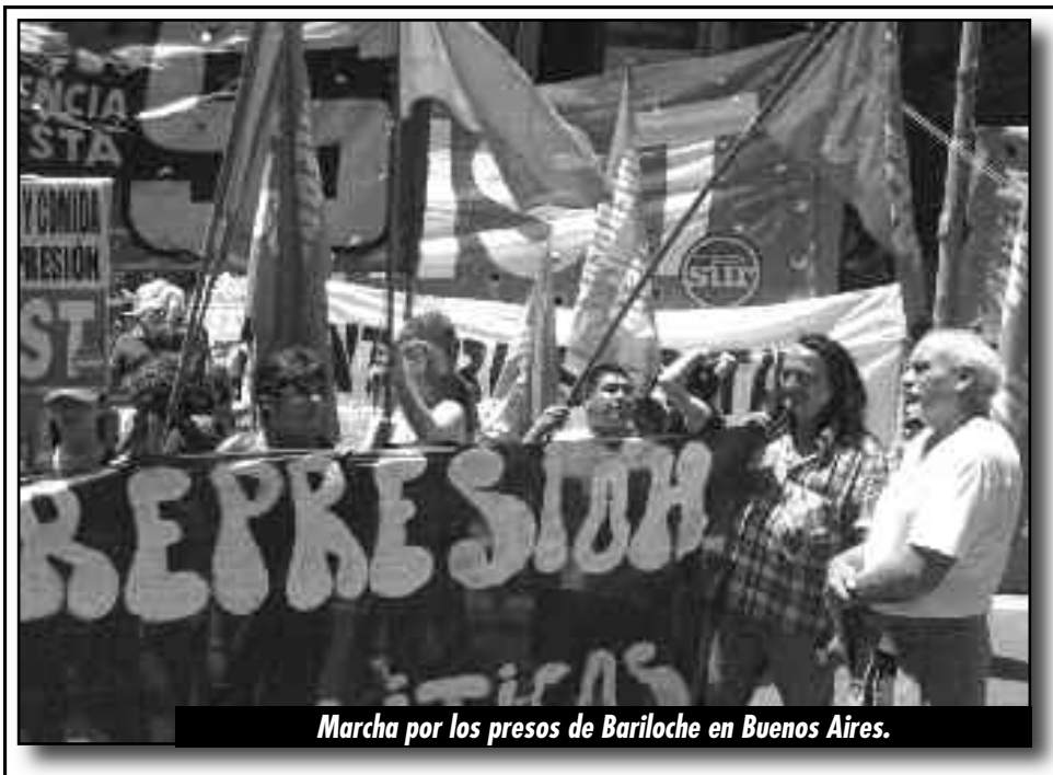
Marcha por los presos de Bariloche en Buenos Aires.

Estos son los "derechos humanos" de la Kirchner, donde persiguen, hostigan, encarcelan y asesinan a los luchadores obreros y populares, mientras ponen en