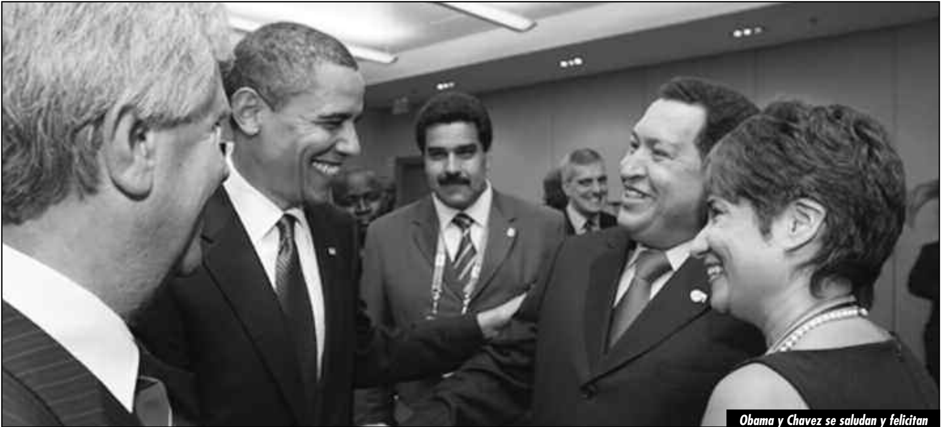
Obama y Chavez se saludan y felicitan

EL HOMBRE QUE GARANTIZA LA ESTABILIDAD POLÍTICA Y LOS NEGOCIOS DEL IMPERIALISMO EN EL CONTINENTE