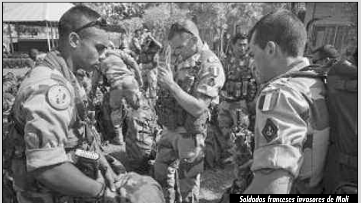
Soldados franceses invasores de Mali

Pero estas diferencias no impiden que en esta ocasión luchemos juntos por la derrota militar de las tropas imperialistas de los carniceros de la V República Francesa y sus aliados, como juntos estamos en Siria por aplastar a las tropas de Al Assad y parar el genocidio a cuenta del imperialismo. En los próximos días publicaremos y les haremos llegar a los compañeros de la RCIT los aportes, precisiones y enmiendas a su declaración, a la que consideramos un excelente punto de partida, para explorar las condiciones de marchar a una elaboración común que dé respuesta a este nuevo test ácido.