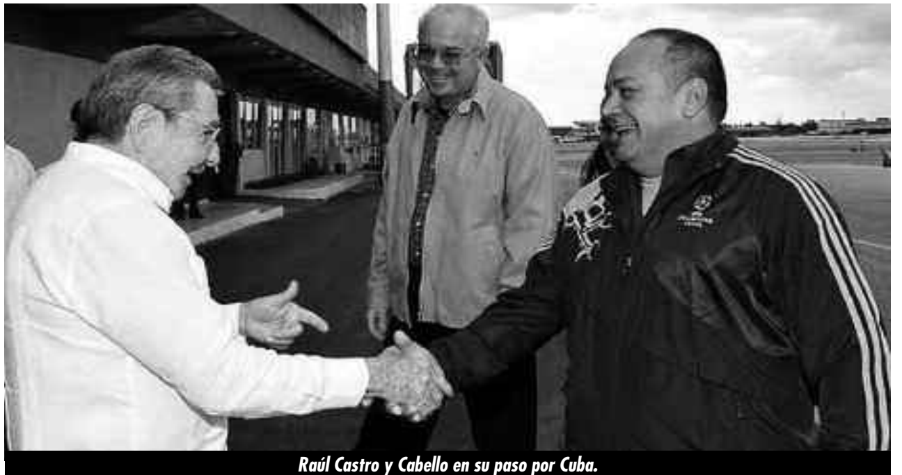
Raúl Castro y Cabello en su paso por Cuba.

La crisis política actual plantea a las claras ¿Quién debe gobernar? Pues bien, los trabajadores debemos decir “ahora nos toca a nosotros” porque