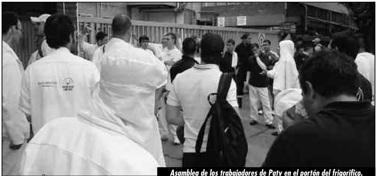
Asamblea de los trabajadores de Paty en el portón del frigorífico.

Los obreros combativos que en estas elecciones buscaban derrotar a la burocracia deben saber, que los dirigentes de la Roja, culpan a los combativos y aguerridos obreros de Paty, cuando son los jefes de la Roja quienes ni siquiera en los frigoríficos donde tienen delegados o cierta representatividad no garantizaron que voten todos los compañeros. Por ejemplo, en Ecocarne, donde el nuevo MAS y la Roja tienen un delegado, solo votaron 140 de los cerca de 400 obreros que hay en la planta. En Rioplatense no pudieron votar 190 compa-