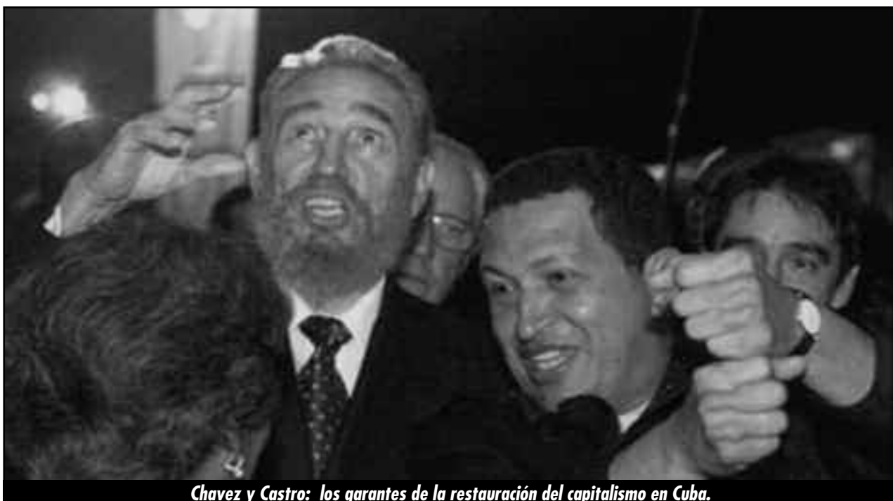
Chavez y Castro: los garantes de la restauración del capitalismo en Cuba.

Hoy algunos de estos dirigentes de la izquierda reformista, agitan el fantasma del “golpe de estado”