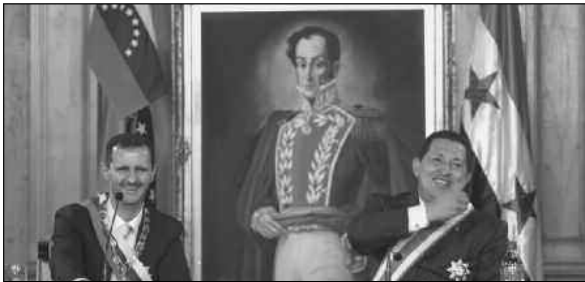
El chacal al Assad y Chavez agentes del imperialismo

Ante el posible fallecimiento de Chávez, la burguesía se puso en rápido movimiento. Por ello ante el temor que entre las disputas de los herederos al trono, como Maduro, Cabello y Capriles, pueda colarse la acción independiente de las masas hambrientas y desposeídas que ya no aguanta más seguir viviendo bajo un océano de penurias, el imperialismo llamó al “orden”. Así fue que en la primera semana de enero se celebró en Cuba el llamado “Pacto de La Habana” para cerrar brechas y que, tanto Cabello como Maduro y también Capriles garanticen la estabilidad del