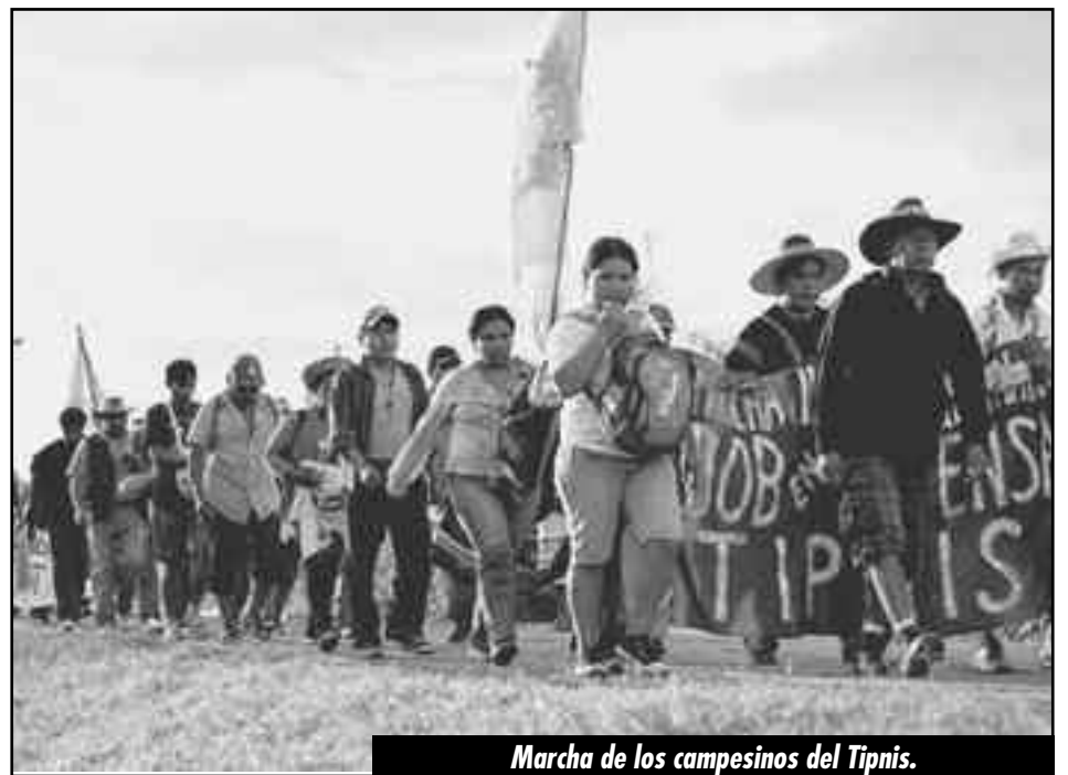
Marcha de los campesinos del Tipnis.

La burguesía le tiene pavor a que vuelva a ponerse en pie de lucha los mineros de Huanuni. Es que el proletariado boliviano no es fuerte por su peso