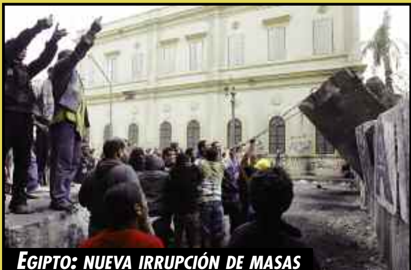
EGIPTO: NUEVA IRRUPCIÓN DE MASAS