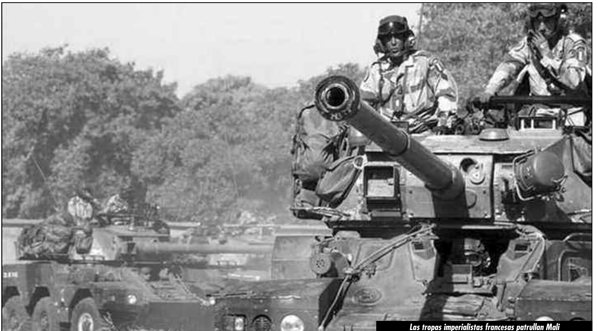
Las tropas imperialistas francesas patrullan Mali

¡Por la revolución socialista en Norte de África y Medio Oriente!