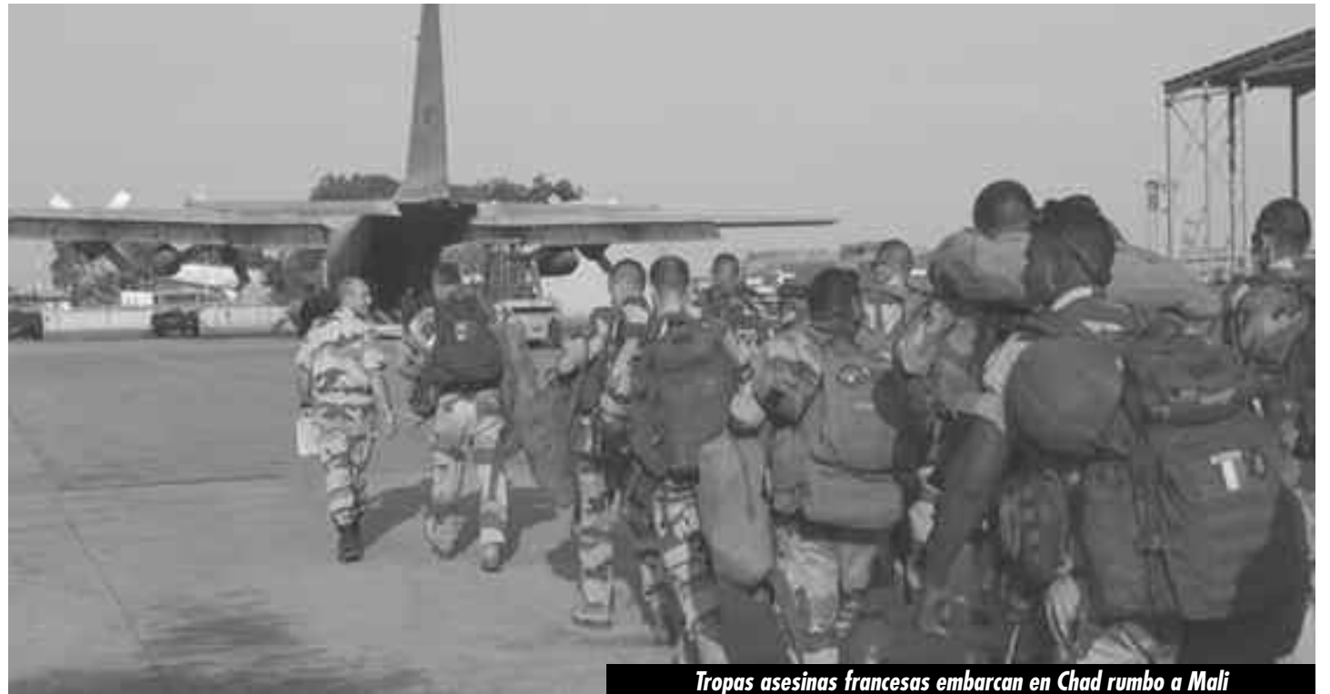
Tropas asesinas francesas embarcan en Chad rumbo a Malí

Llamamos al movimiento obrero internacional —especialmente en Francia— a movilizarse en acciones de protesta contra la guerra colonial para derribar los esfuerzos bélicos del gobierno. ¡Por marchas y huelgas contra la guerra imperialista! ¡Obreros del