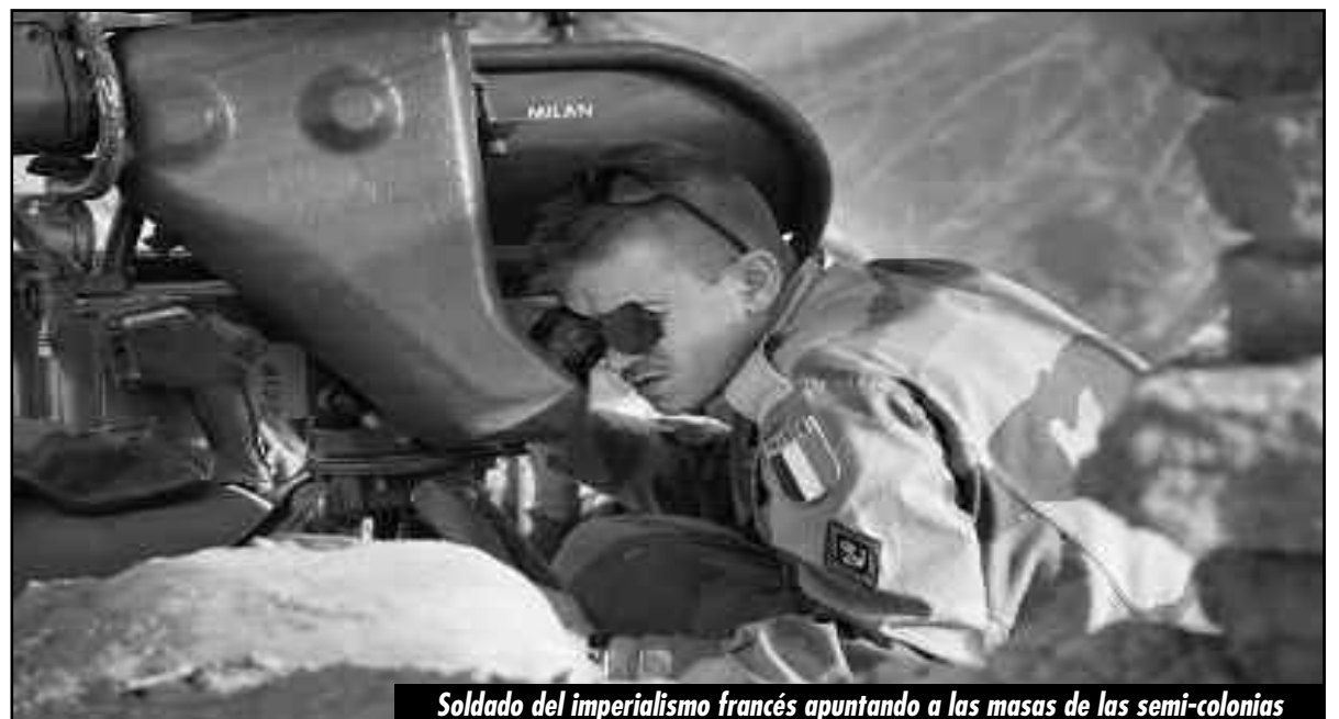
Soldado del imperialismo francés apuntando a las masas de las semi-colonias