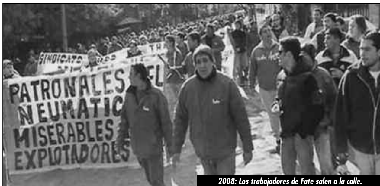
2008: Los trabajadores de Fate salen a la calle.