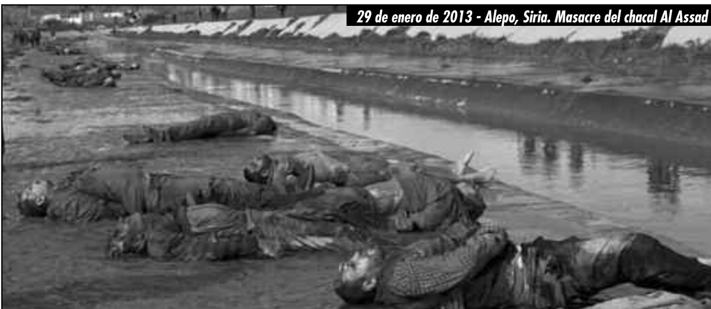
29 de enero de 2013 - Alepo, Siria. Masacre del chacal Al Assad

Esta ofensiva imperialista, en el continente americano, se da con el salto abierto en el proceso de restauración capitalista en Cuba . Luego de varias medidas que durante años liquidaron las conquistas de la revolución, lo nuevo hoy es que se otorga el derecho al ingreso de los gusanos de Miami (EE.UU.), pertenecientes a la élite de la sociedad burguesa norteamericana, dueños de 140.000 empresas a quienes se le permitirá invertir en la isla y contar con mano de obra alta-