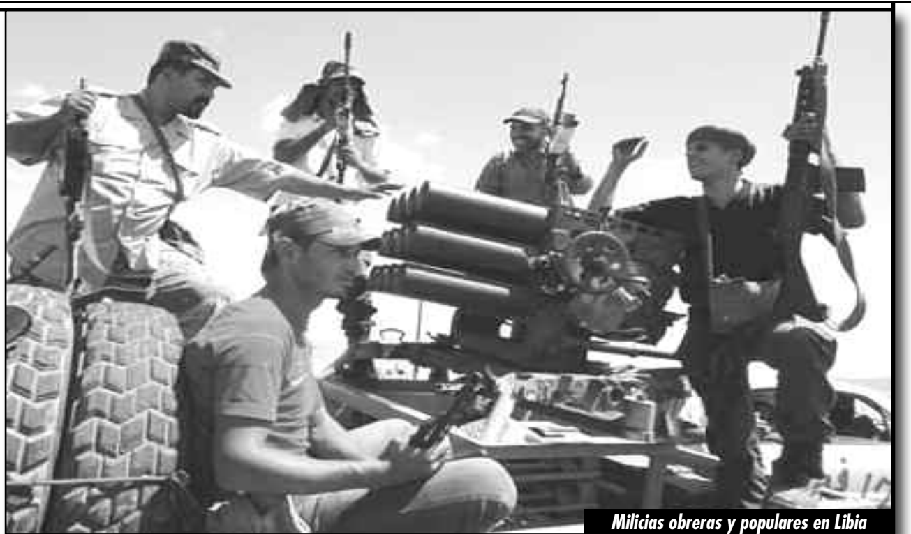
Milicias obreras y populares en Libia

El imperialismo y la burguesía mundial han lanzado una campaña de acusaciones a las masas de la región tratándolas de “bárbaros”, “extremistas islámicos” y “terroristas”. Así presentan la toman de la planta de gas en In Amenas al sudeste de Argelia como la “barbarie”, cuando es el imperialismo y sus gobiernos títeres los que han saqueado, masacrado, proscrito, perseguido y han dejado a pueblos enteros sin nación en todo el continente. Ellos son los que verdaderamente siembran “el terror”. Ahí está