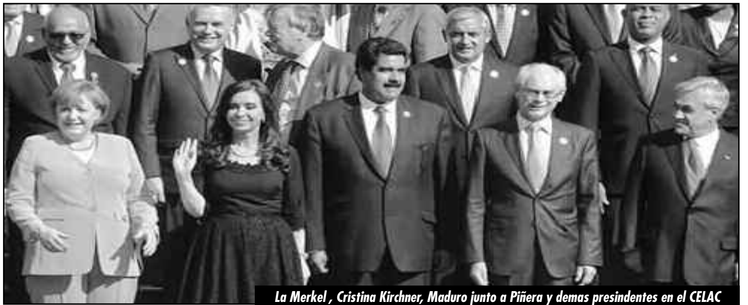
La Merkel, Cristina Kirchner, Maduro junto a Piñera y demás presidentes en el CELAC

Con el pacto Obama-Chávez-Castro se mantiene el control y el saqueo del continente, y han avanzado en el proceso de restauración capitalista en la isla al punto de transformar el carácter del estado. Cuba ha dejado de ser un estado obrero burocrático en aguda descomposición y ha devenido provisoriamente en un estado capitalista transitorio , donde se ha liquidado la propiedad nacionalizada, el monopolio del comercio exterior y la economía planificada, se ha restaurado el derecho a herencia, se ha impuesto un ejército industrial de reserva con los despidos impuestos por los hermanos Castro y los nuevos ricos del PC, y donde las empresas imperialistas se han asociado en empresas mixtas para la explotación del níquel, el turismo, y se están quedando con todas las riquezas de Cuba. Este proceso no se ha dado de forma pacífica sino con sucesivos golpes contrarrevolucionarios, como