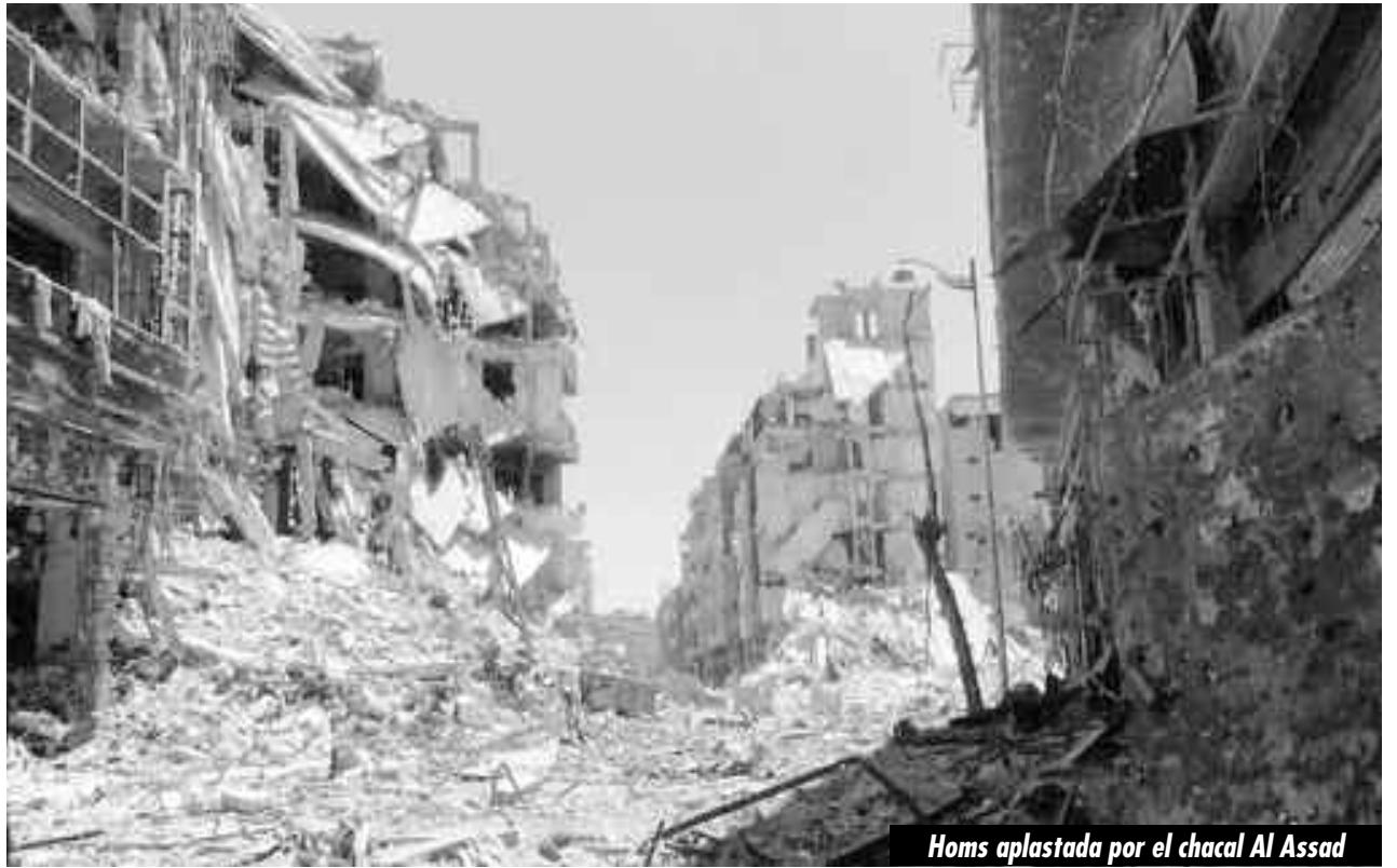
Homs aplastada por el chacal Al Assad

La amplia mayoría de los partidos que se dicen “socialistas revolucionarios” le han atado las manos a la clase obrera mundial para que esta acuda en ayu-