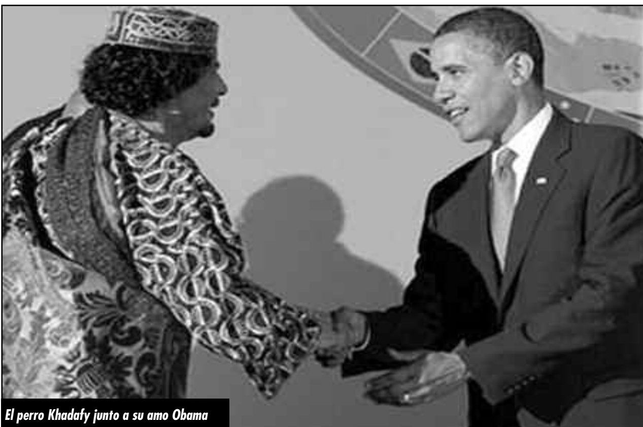
El perro Kadhafy junto a su amo Obama

¡Aplastemos la ofensiva imperialista francesa en Malí para saquear y defender los intereses de las transnacionales en la región! ¡Aplastemos y derrotemos al ejército asesino de Bashar Al Assad que masacra en Siria a cuenta de las potencias imperialistas que buscan aplastar las cadenas de revoluciones del Magreb y Medio Oriente! ¡Fuera Turquía imperialista y sus misiles que apuntan a las masas sublevadas de Siria y Medio Oriente! ¡Por la destrucción del estado sionista de Israel! ¡Fuera la base militar de la V República francesa del Chad! ¡Fuera el AFRI-CON y todas las bases militares de los carneceros imperialistas de todo el continente! ¡Abajo el gobierno colonial puesto a dedo por la casta de oficiales entrenada por la CIA y las transnacionales que saquean el oro, el uranio y las riquezas del África subsahariana! ¡Disolución inmediata del ejército de ocupación de Malí! ¡Expropiación sin pago y bajo control obrero de todas las tierras, minas, fábricas, bancos y propiedades de las transnacionales y la burguesía colaboracionista! Por comités de obreros y campesinos que tome en sus manos el control de la producción, el abastecimiento y la distribución de los alimentos, el agua, los medicamentos y las armas para garantizar que los trabajadores y el pueblo estén en las mejores condiciones para combatir. Por milicias obreras y campesinas y comités de soldados rasos. ¡Armamento generalizado de las masas tuareg, de Mali y toda el África subsahariana!