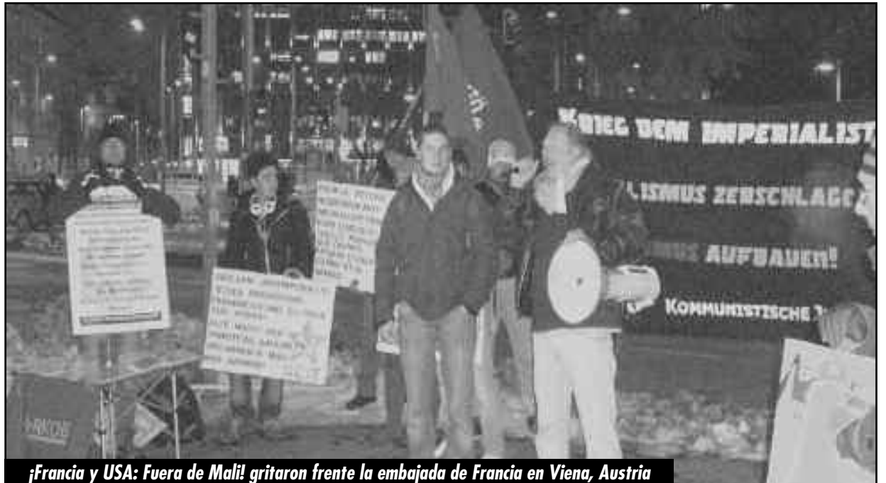
¡Francia y USA: Fuera de Malí! gritaron frente la embajada de Francia en Viena, Austria

COMPAÑEROS DE LA LOI-CI Y DEL COMITÉ POR LA REFUNDACIÓN DE LA IV INTERNACIONAL, DE SAN PABLO, BRASIL