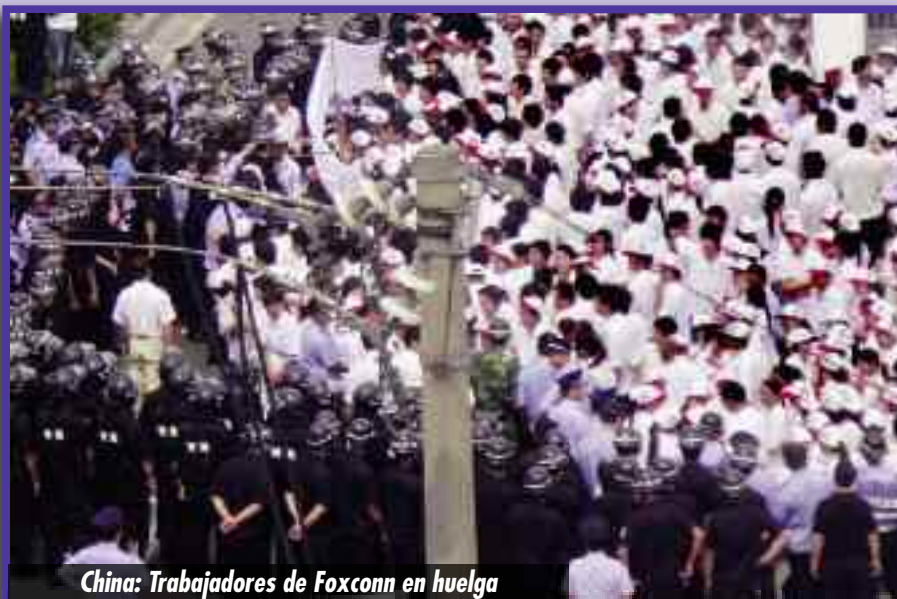
China: Trabajadores de Foxconn en huelga