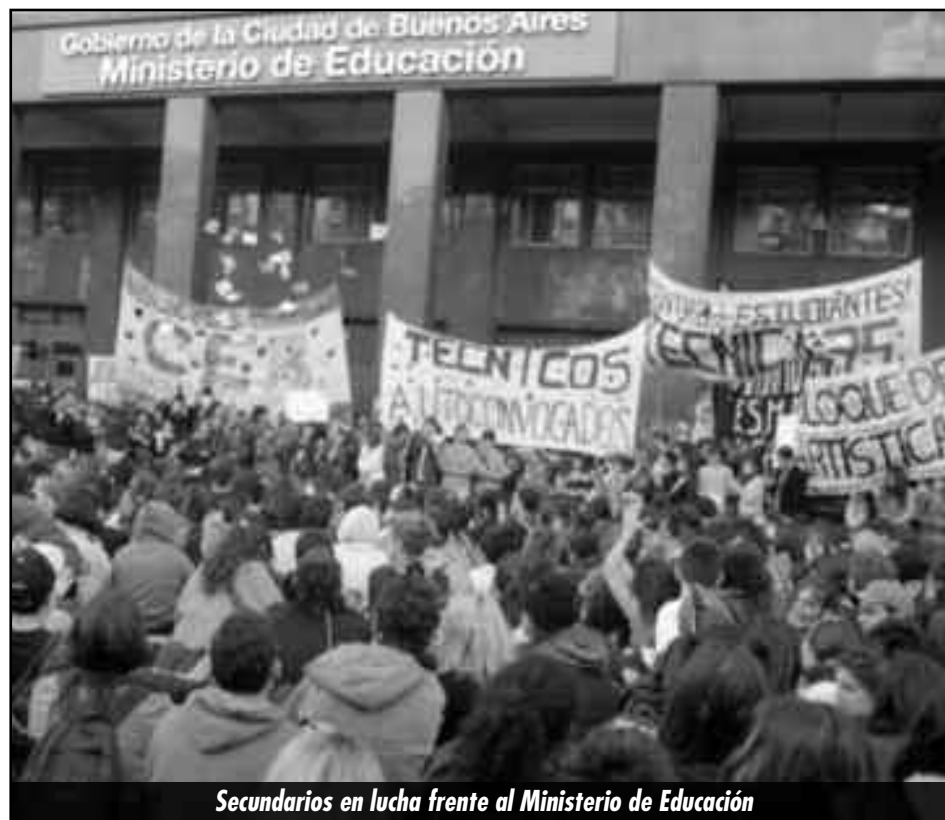
Secundarios en lucha frente al Ministerio de Educación

Desde más de un mes los secundarios estamos enfrentando el ataque de Macri y Kirchner que quieren terminar de aplicar las leyes menemistas como la Ley Federal de Educación que ya está impuesta a nivel nacional, y que aún hoy no han terminado de aplicar en Capital y Neuquén gracias a la lucha de estudiantes, docentes y trabajadores.