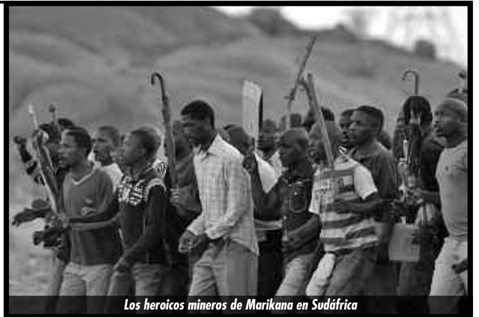
Los heroicos mineros de Marikana en Sudáfrica

La crisis mundial no da respiro a los explotados, corroe al mundo y a la civilización toda. En sectores del planeta como Europa, EE.UU., el Norte de África y Medio Oriente prima el crac y la crisis de deuda de los estados, luego de que estos salvaron a los banqueros y a los parásitos de Wall Street, y por lo tanto prima también un ataque despiadado a las conquistas de las masas.