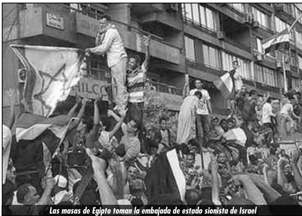
Las masas de Egipto toman la embajada de estado sionista de Israel

La situación en la región y a nivel mundial se polariza. Los choques de clases se agudizan. La recesión y la crisis imperialista no dan respiro ni márgenes