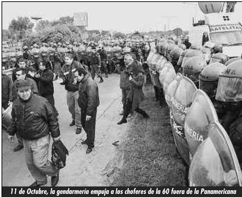
11 de Octubre, la gendarmería empuja a los choferes de la 60 fuera de la Panamericana

La "sindicalización" de los gendarmes, los prefectos, y la policía, levantada por la burocracia sindical de las CGTs y CTAs y gran parte de la izquierda reformista, es una puñalada por la espalda a los trabajadores. Los gendarmes y prefectos, están enfrentados y son irreconciliables, en el espacio y el tiempo, con los piquetes, los comités de lucha y los organismos de auto-organización de la clase obrera. Lo único que puede llegar a admitir la clase obrera es que el gendarme se rinda ante el piquete de huelga y entregue su placa y su arma, declare que