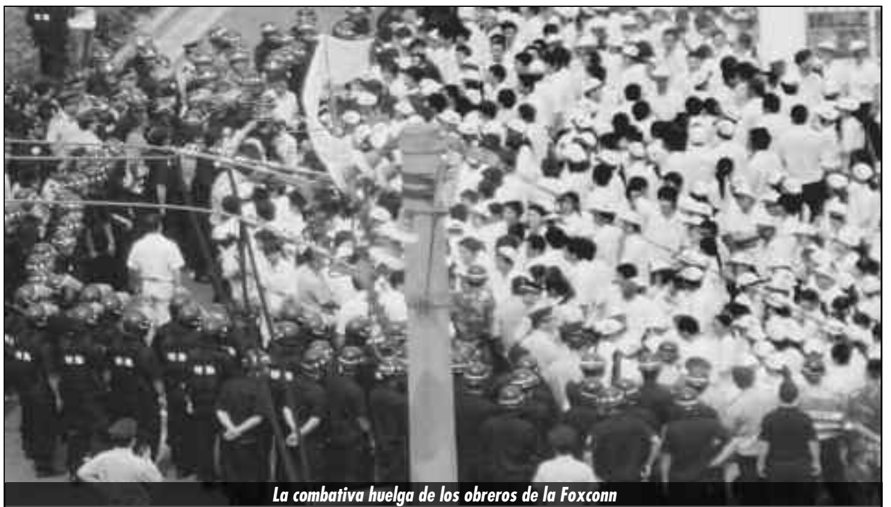
La combativa huelga de los obreros de la Foxconn

¡Basta de trabajadores de primera y de segunda! ¡A igual trabajo, igual salario!