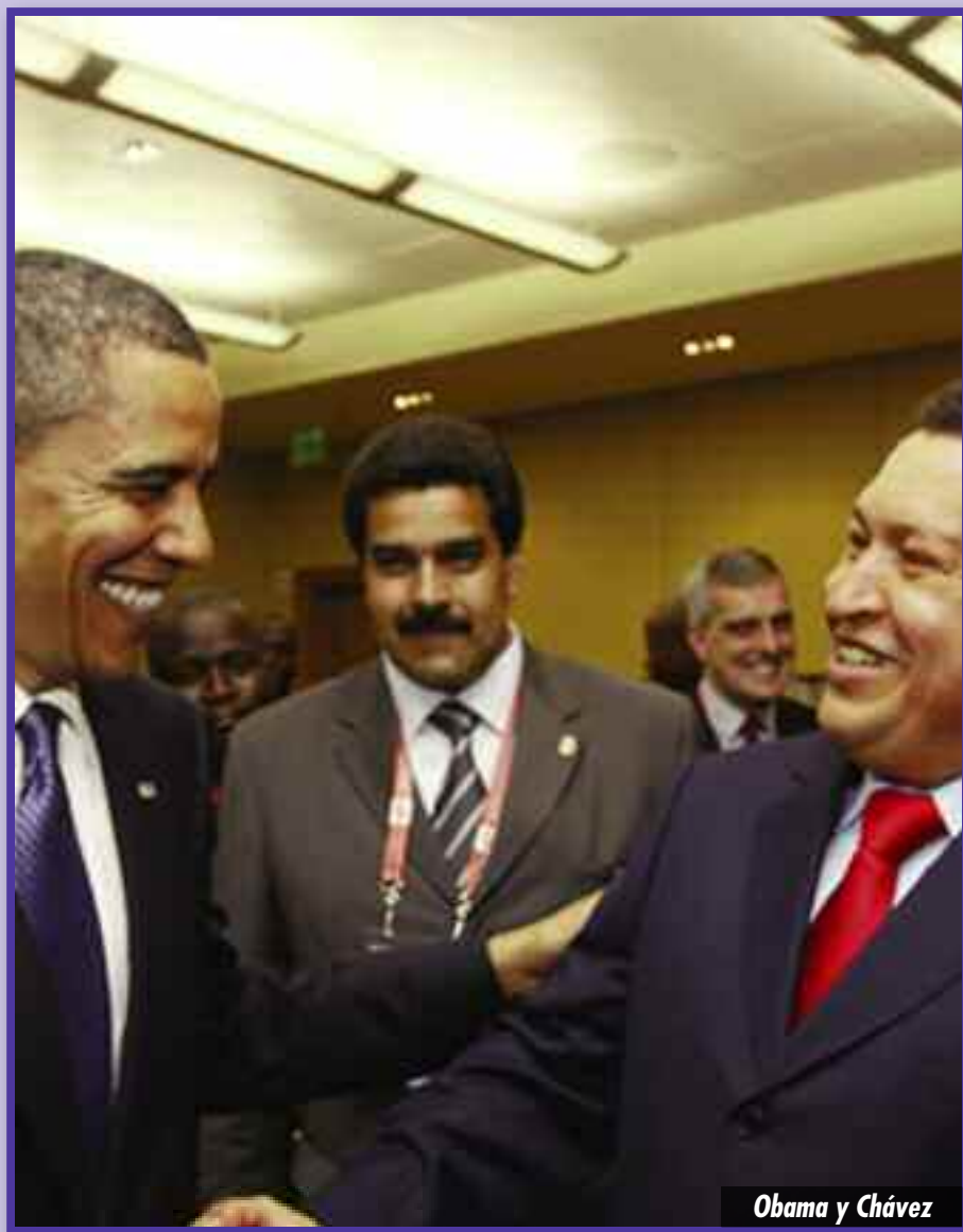
Obama y Chávez