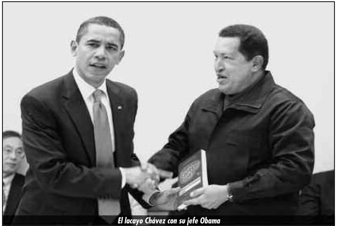
El lacayo Chávez con su jefe Obama

Para el imperialismo no podía ser de otra manera, ya que este gobierno boliburgués, y no uno “neo-puntofijista”, es el que le garantiza sus negocios. Al decir del propio Chávez “este, mi gobierno, es que les garantiza a ustedes, señores de la alta burguesía, a Cisneros, al Grupo Polar, y tantos otros, incluyendo a Obama, la tan anhelada estabilidad para que continúen los negocios y el ‘desarrollo’, porque si les entrego la presidencia para que gobiernen ustedes directamente desestabilizan el país en un tris...”. Dice una máxima del Derecho burgués que a confesión de parte, relevo de pruebas . Por eso el imperialismo yanqui se hizo el distraído cuando Chávez impuso su referendo en febrero de 2009 que modificó la Constitución burguesa para tener la posibilidad de lanzarse indefinidamente a la reelección. No hace falta más que añadir salvo que muchos trabajadores vieron esto y sólo salieron a votar por Chávez acicateados por los manipuladores de oficio que son la pseudo-izquierda, incluyendo renegados del trotskismo, que ali-