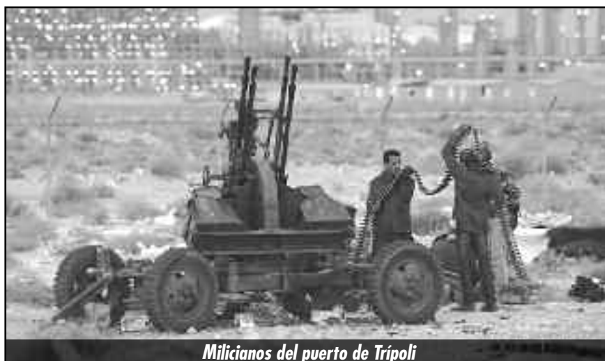
Milicianos del puerto de Trípoli

¡Por comités de la juventud en las milicias, los sindicatos y todas las organizaciones de autoorganización de los explotados! ¡Basta de sojuzgar y esclavizar a la juventud revolucionaria que encabezó el