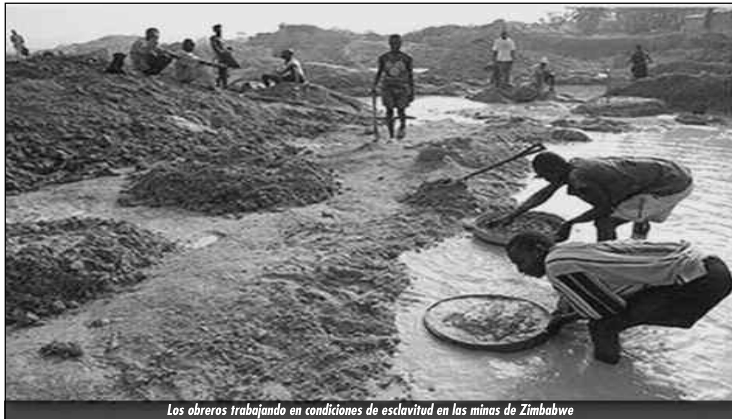
Los obreros trabajando en condiciones de esclavitud en las minas de Zimbabwe

En Libia y Siria las masas se armaron y pusieron en pie organismos de doble poder. En el sur del continente la clase obrera nigeriana se alzó en una huelga general revolucionaria al grito de “¡Fuera Jonathan o morirás como Khadafy!”. Meses atrás vimos cómo la revolución obrera y socialista por el pan se extendió a las huelgas mineras con los obreros de Marikana siendo su vanguardia. Las demandas por las que se alzaron los obreros mineros de Marikana son las demandas de todo el movimiento obrero de la región: por el pan, aumento de salario, contra la carestía de la vida y contra las transnacionales que saquean la nación. Ellos demostraron que para conseguir lo mas mínimo