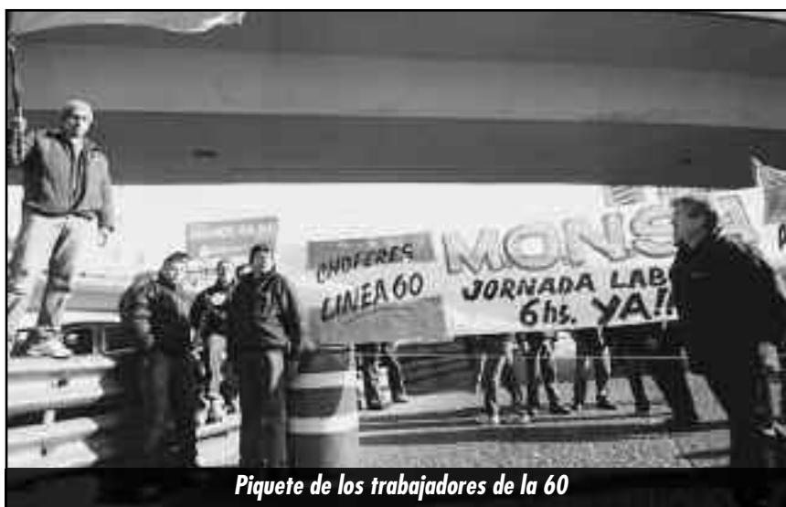
Piquete de los trabajadores de la 60

T: La medida fue iniciada a las 3 de la mañana del día de ayer que duró hasta las 4 o 5 de la tarde. Me encadené al portón, con el único fin de recuperar mi fuente de laburo y mi dignidad, nada más.