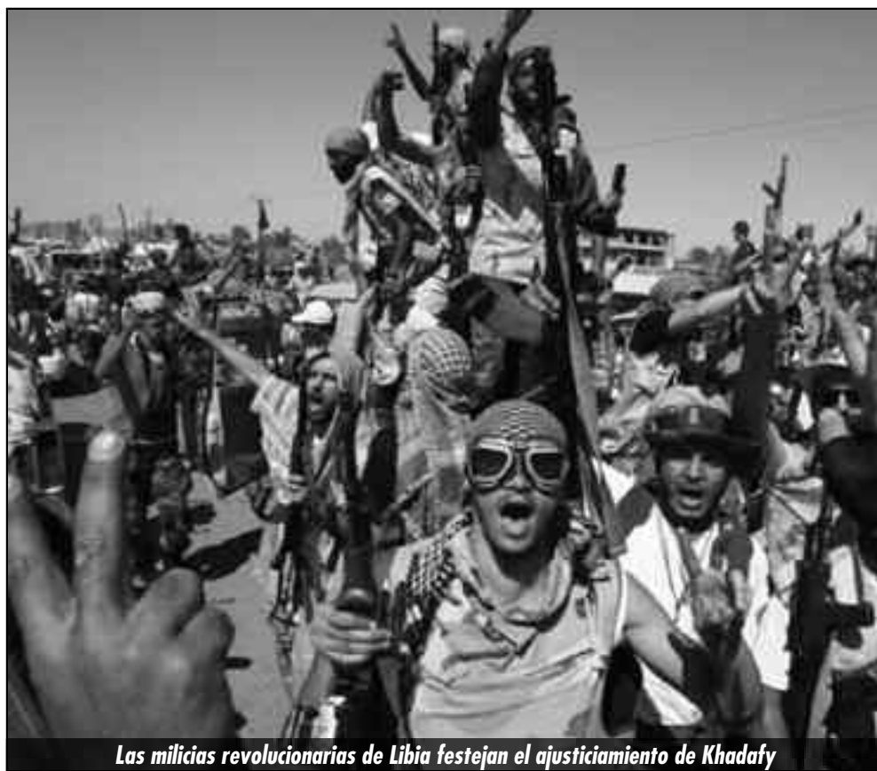
Las milicias revolucionarias de Libia festejan el ajusticiamiento de Khadafy

Un Congreso de las milicias y las organizaciones obreras tendría a su frente la bandera de las