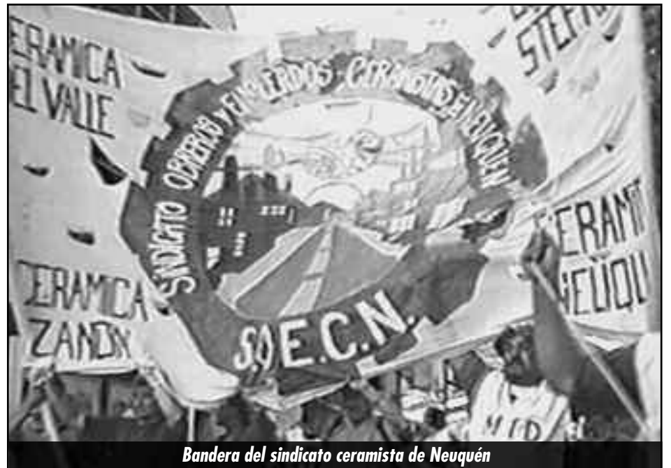
Bandera del sindicato ceramista de Neuquén

Insistimos que la salida vendrá cuando recuperemos la democracia obrera, en las tres fábricas. Volver a reconstruir la Comisión Interna de Zanón, y que en