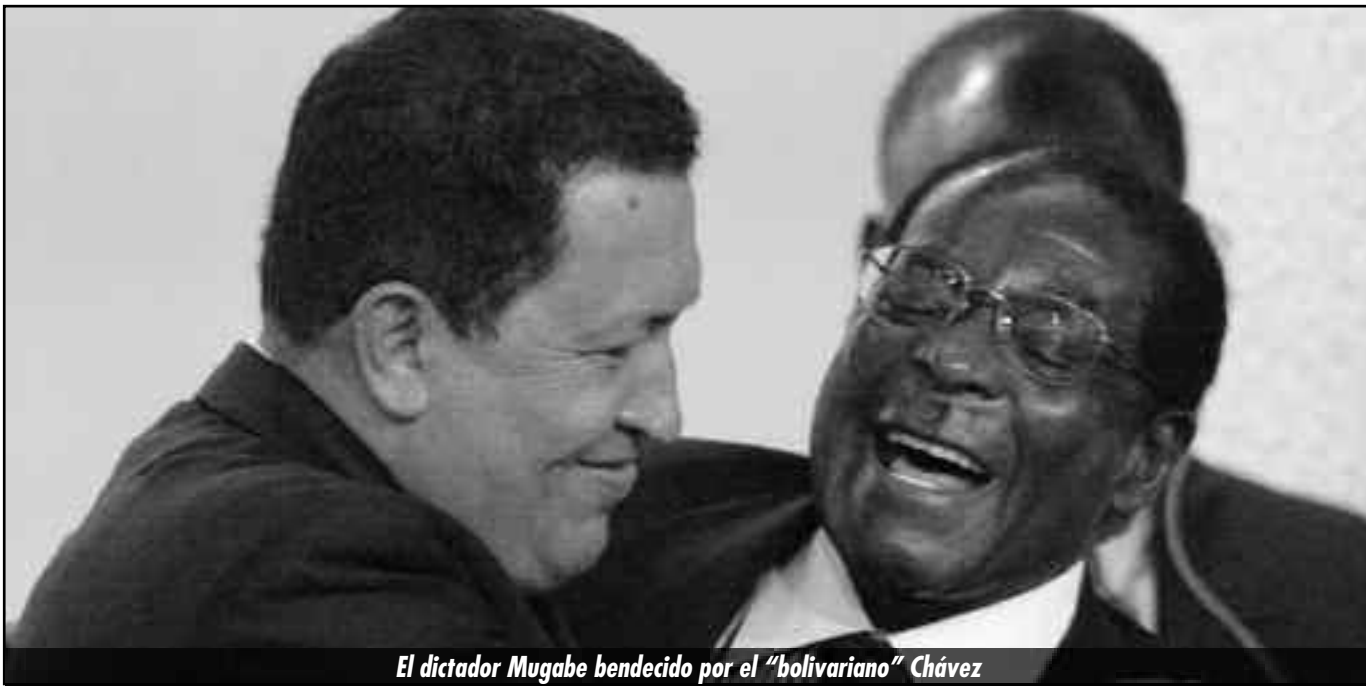
El dictador Mugabe bendecido por el "bolivariano" Chávez