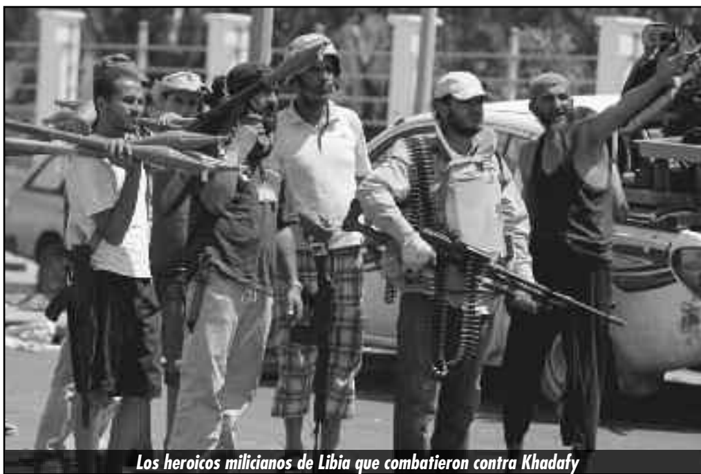
Los heroicos milicianos de Libia que combatieron contra Khadafy

El gobierno del CNL, emergido de las últimas elecciones, ya venía con una contraofensiva que combinaba engaño, demagogia, cortinas de humo y ataques directos a las masas en armas. La imposición de la trampa electoral significó no solo que la clase obrera no tomó el poder, cuando la posibilidad le pasó por sus manos, sino que al no hacerlo, la burguesía con el plan electoral resquebrajó la alianza de la clase obrera con las clases medias a las que le intentan dar una salida planteando que con “paz” y “orden” ahora