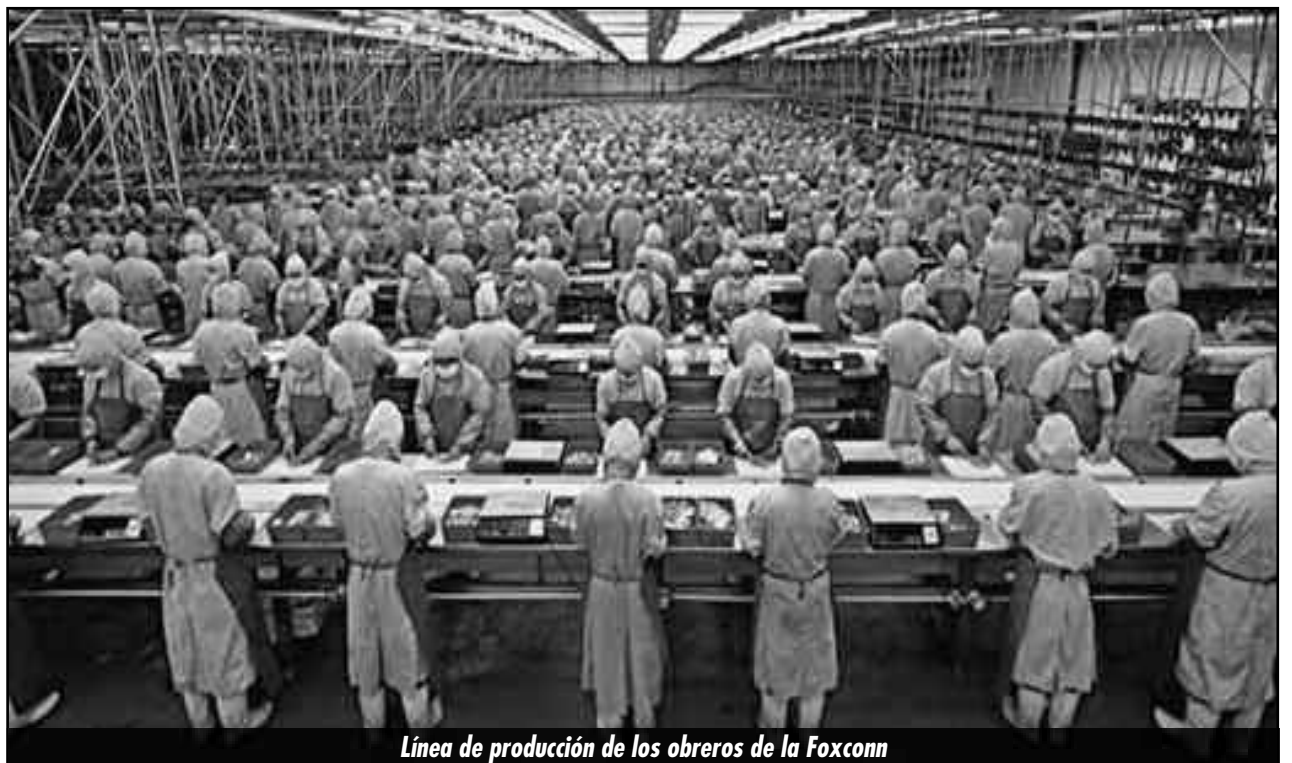
Línea de producción de los obreros de la Foxconn

La tendencia, si son asfixiados los procesos revolucionarios definitivamente, es un salto en la hambruna y la barbarie. El crecimiento demográfico de la población, la