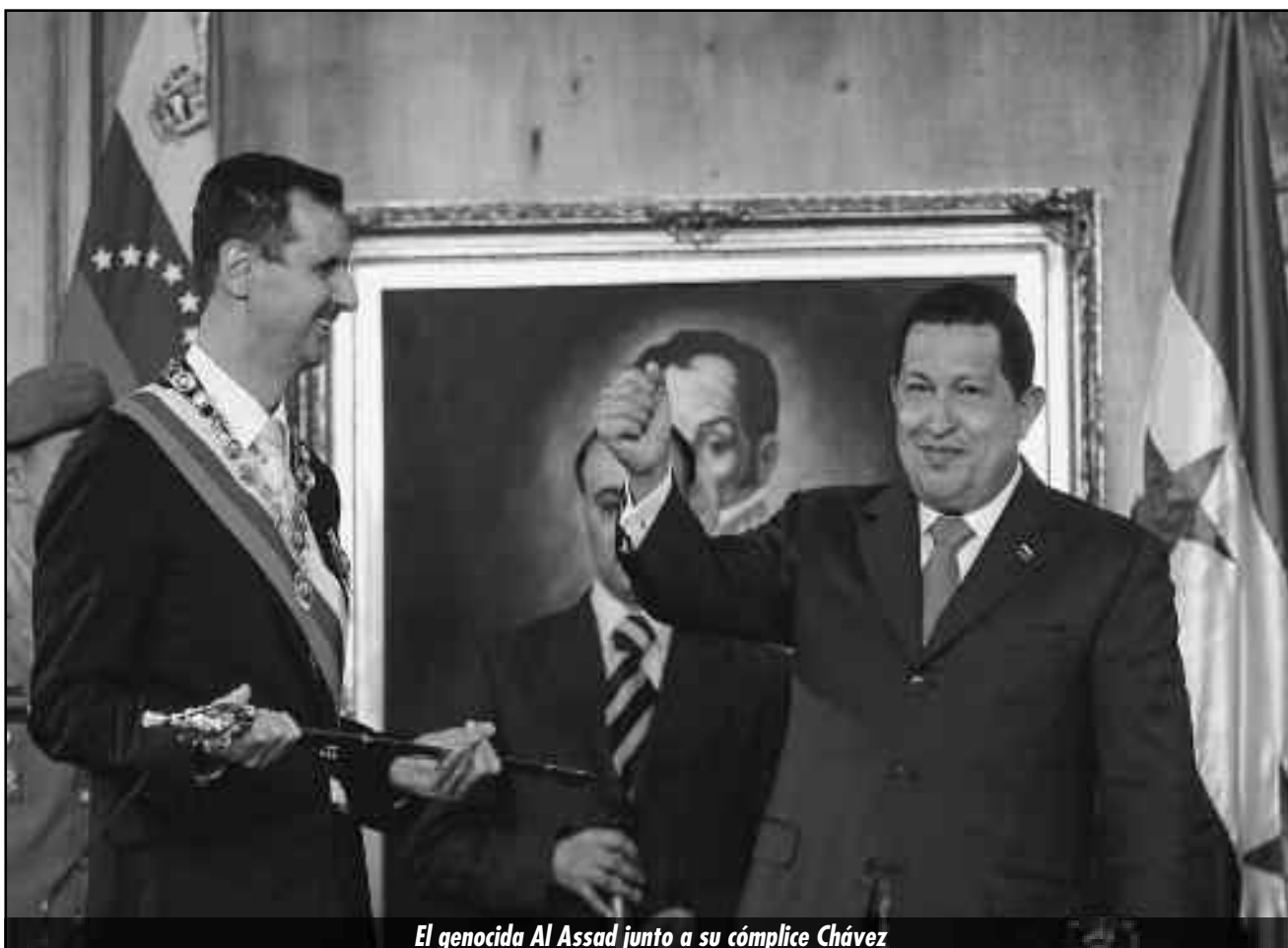
El genocida Al Assad junto a su cómplice Chávez

LIGA COMUNISTA DE LOS TRABAJADORES FRACCIÓN LENINISTA TROTSKISTA INTERNACIONAL