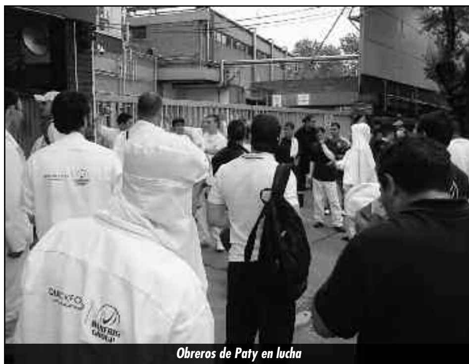
Obreros de Paty en lucha

No se deben permitir los despidos y que sean superexplotados los trabajadores de Bancalari, pues allí la lista Roja tiene candidatos en ambos frigoríficos. De continuar así, siendo garantes de los estatutos del Ministerio de Trabajo, la lista Roja solo estará haciendo "promesas de victoria" y preparando jalones de derrota. ¡Basta de mostrar videos con luchas y epopeyas! Hay que ser valientes, decir la verdad y rendirles cuentas a los trabajadores de la carne: pues con esta política de la Roja de subordinarse al