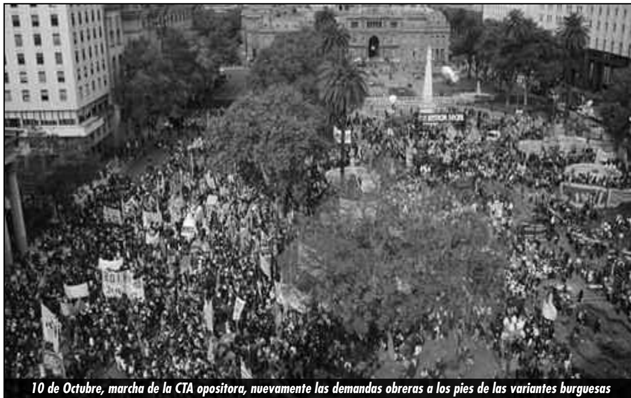
10 de Octubre, marcha de la CTA opositora, nuevamente las demandas obreras a los pies de las variantes burguesas

Hoy está tomando cuerpo una oposición burguesa más sólida (fogueada por el multimedios Clarín), que "deja correr" la movilización de sectores de las clases medias contra el gobierno y le impone sus consignas contra la "re-re-elección", contra "el cepo cambiario" (que les impide ahorrar en dólares) y "por más seguridad". Es que el gran capital, una vez que le impuso a la clase obrera terribles condiciones de "maquila" y desgarró sus filas gracias al accionar de sus direcciones, ahora también descarga su ataque sobre las clases medias. Pero como el proletariado no puede irrumpir de forma independiente por responsabilidad de sus direc-