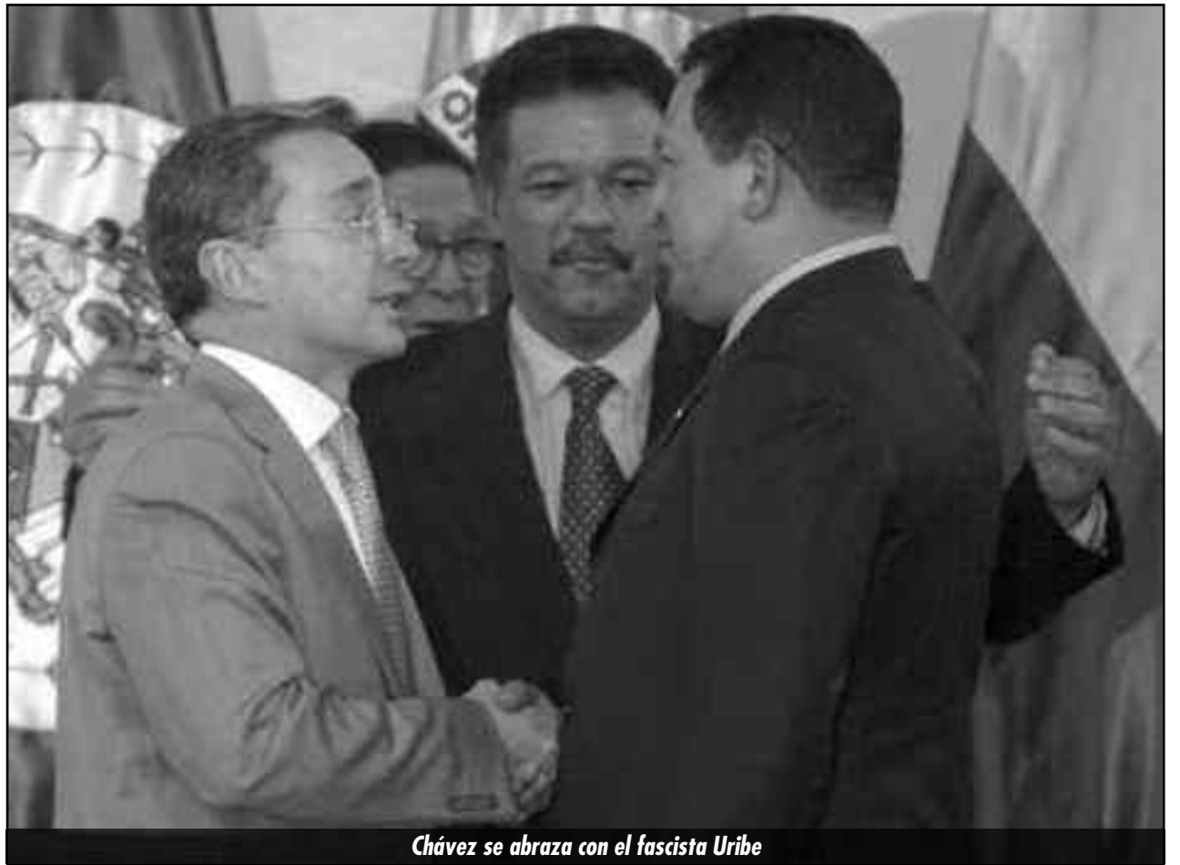
Chávez se abraza con el fascista Uribe

Por otro lado vemos que el PSL-UIT, que enarboló la candidatura de Orlando Chirinos como “obrero y clasista”, respecto a todas estas cuestiones candentes de la lucha de clases internacional mantuvieron silencio, un silencio tanto más ignominioso por cuanto alimenta el cerco que la burguesía monta a los trabajadores, dividiéndolos país por país, y así derrotarlos por separado. “ ¡Divide y vencerás! ”: ese es el lema