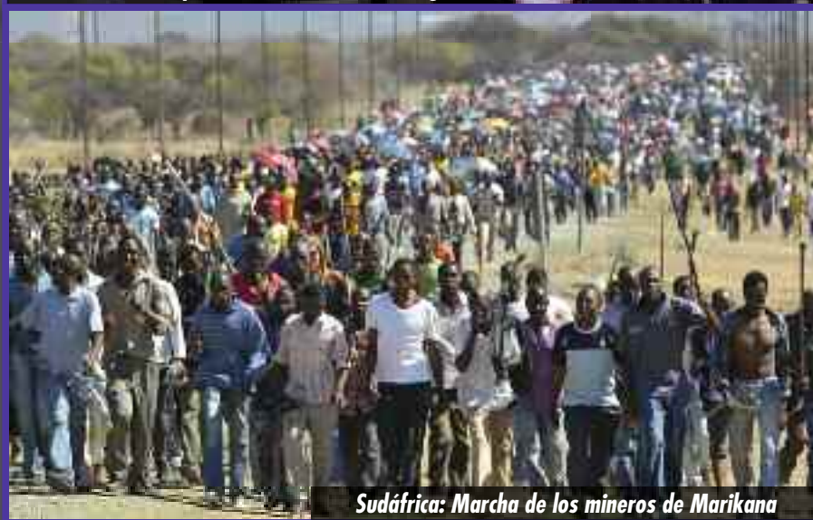
Sudáfrica: Marcha de los mineros de Marikana