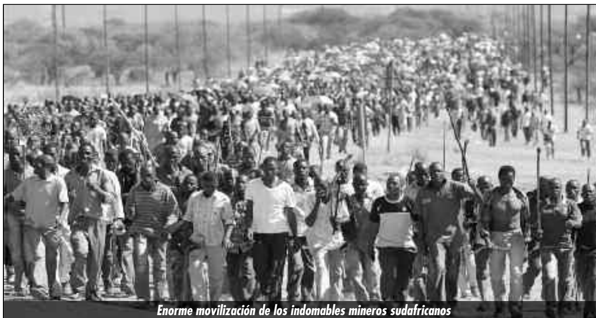
Enorme movilización de los indomables mineros sudafricanos