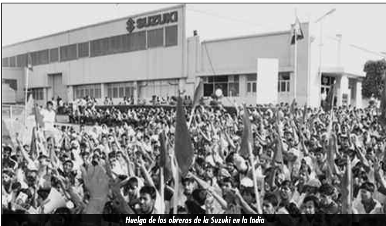
Huelga de los obreros de la Suzuki en la India

recesión abierta, la declinación del crecimiento chino, la crisis norteamericana, europea y japonesa, se combinan ya con un alto proceso inflacionario. La emisión de la Reserva Federal, desde 2007 hasta ahora, de la friolera de 17 billones de dólares para salvar a los bancos de EE.UU. y el mundo, es la inflación galopante que comienza a recorrer la economía mundial junto a la recesión. Así el imperialismo yanqui le descarga su crisis al planeta.