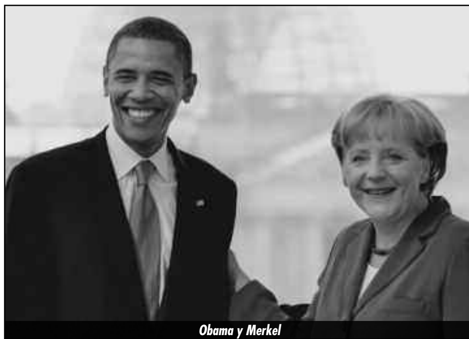
Obama y Merkel

Lo que está en curso es una verdadera guerra de clases a nivel mundial. El capital financiero ahí donde hay crac y crisis se lo descarga sin piedad sobre los explotados como en EE.UU y Europa, y ahí donde hay nichos de expansión porque las transnacionales se relocalizan para explotar la mano de obra esclava y saquear los recursos naturales, el capitalismo no quiere ceder ni un centavo de sus ganancias e impone condiciones de esclavitud insoportables para las masas.