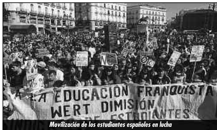
Movilización de los estudiantes españoles en lucha

bancadas por la patronal y el estado para los jóvenes trabajadores, con sueldo mínimo de $8000! ¡Ingreso irrestricto a todos los colegios y universidades! ¡Guarderías bancadas por el Estado para que las madres jóvenes puedan estudiar! ¡Triplicación del presupuesto educativo indexado según la inflación en base al no pago de la deuda externa, un impuesto progresivo a las grandes fortunas y el quite de subsidios y expropiación sin pago de los bienes de la educación privada y de la iglesia!