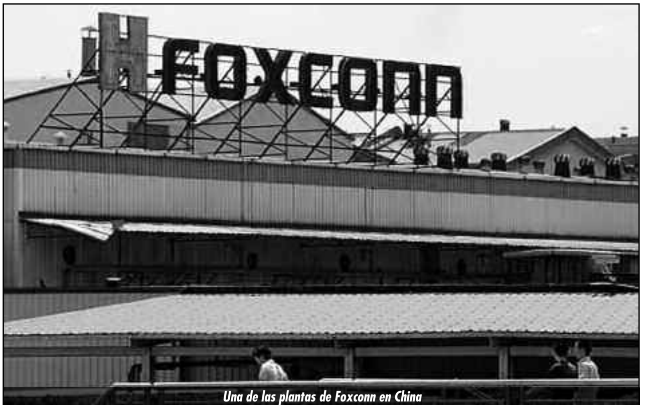
Una de las plantas de Foxconn en China

¡Basta de muertes obreras! ¡Patrones asesinos! ¡Basta de trabajo esclavo! ¡Este es el “milagro chino”: millones de trabajadores esclavos sin el más mínimo derecho sometidos a los peores malos tratos y vejaciones, produciendo para las transnacionales imperialistas por salarios de miseria!