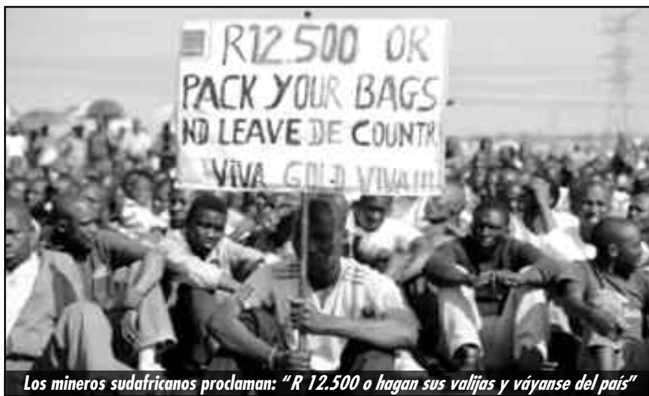
Los mineros sudafricanos proclaman: "R 12.500 o hagan sus valijas y váyanse del país"

Este fin de semana se reúnen los sindicatos en Zimbabwe. Ellos tienen en sus manos la posibilidad inmediata