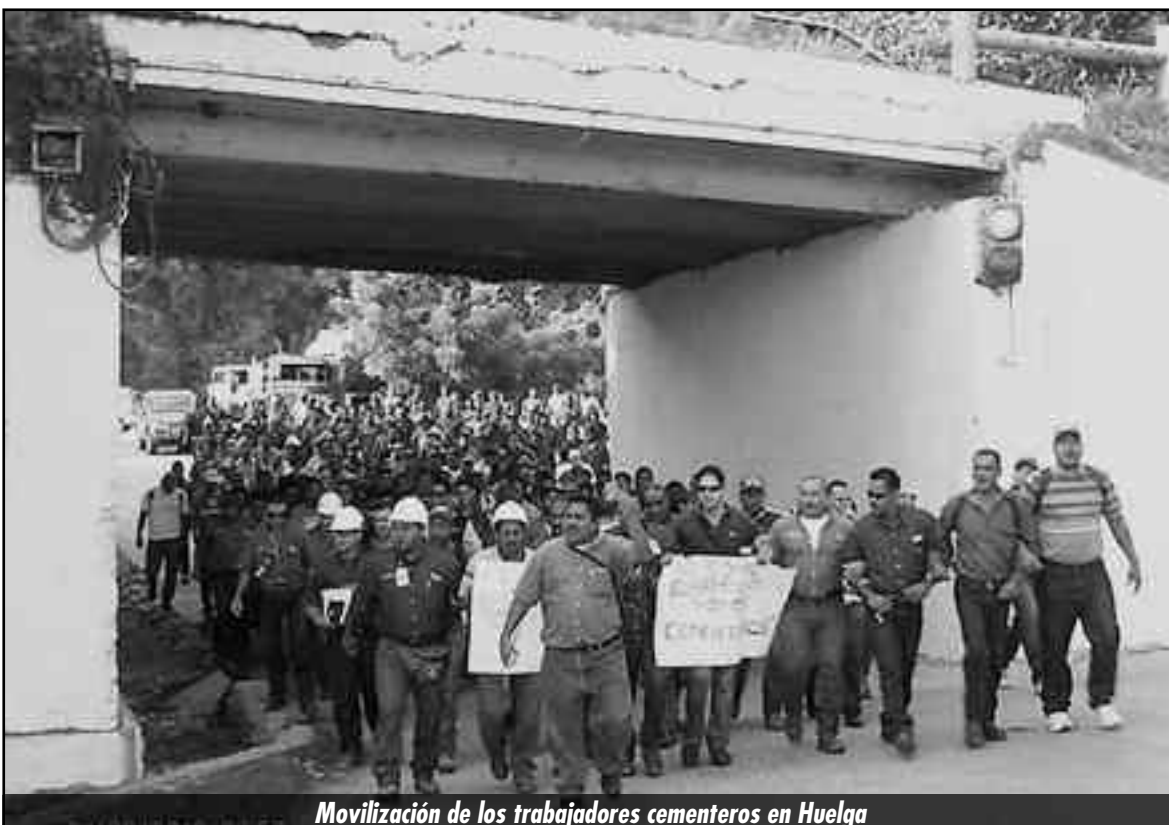
Movilización de los trabajadores cementeros en Huelga