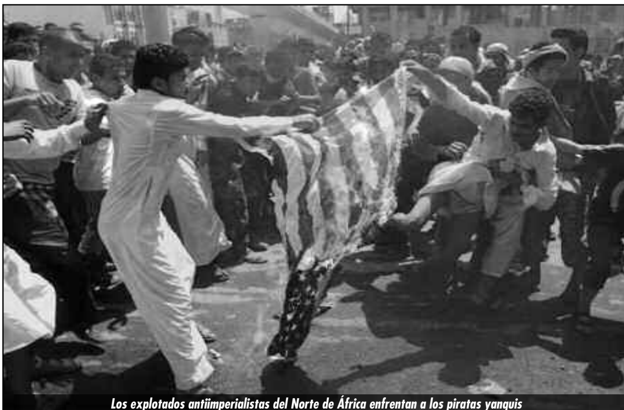
Los explotados antiimperialistas del Norte de África enfrentan a los piratas yanquis

1- La fuerza aérea y los helicópteros de Estados Unidos están haciendo una demostración de armas violenta sobre el espacio aéreo de las ciudades más importantes de Libia. Dos barcos de guerra norteamericanos están en las costas libias con mil marines dispuestos a realizar cualquier operación. Se escuchan disparos sin blancos fijos. Con todo esto amenazan a la población después de los acontecimientos en el Consulado yanqui. Esto le permitió al gobierno del Congreso Nacional Libio (CNL) ganar base social de las clases medias y la burguesía comercial que quiere "orden" y "paz". Donde más se vio esto es en Bengasi. Allí es donde más asentado está el plan de contrarrevolución "democrática" y donde más estaría legitimado el gobierno después de las últimas elecciones, ganar base social de las clases medias y la burguesía comercial que quiere "orden" y "paz". Decenas de miles de funcionarios pagados con el fondo del saqueo del petróleo de Libia han sido contratados por el nuevo régimen para reconsti-