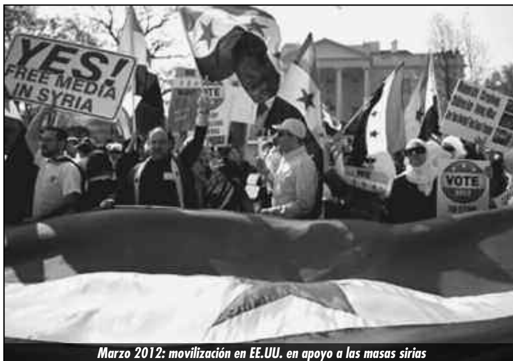
Marzo 2012: movilización en EE.UU. en apoyo a las masas sirias

Por tal el imperialismo no puede terminar de reconstituir plenamente el estado burgués que la revolución dislocó, hasta que no imponga una disci-