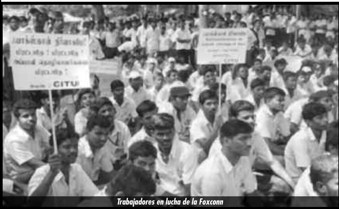
Trabajadores en lucha de la Foxconn

El rol de las direcciones traidoras de la clase obrera mundial es cercar y aislar los focos de respuestas revolucionarias del proletariado en el mundo semicolonial, y separarlos del combate del proletariado de los países centrales a los que condenan a la impotencia de la lucha económica en medio del crack. Los trotskistas de la FLTI, que peleamos por el único programa que los puede unir que es el combate por la Revolución Socialista, apoyados en las fuerzas de los mineros de Marikana, los obreros de la Foxconn y la Suzuki, luchamos por refundar la IV Internacional, que es la bandera sin mácula de su próximo triunfo.