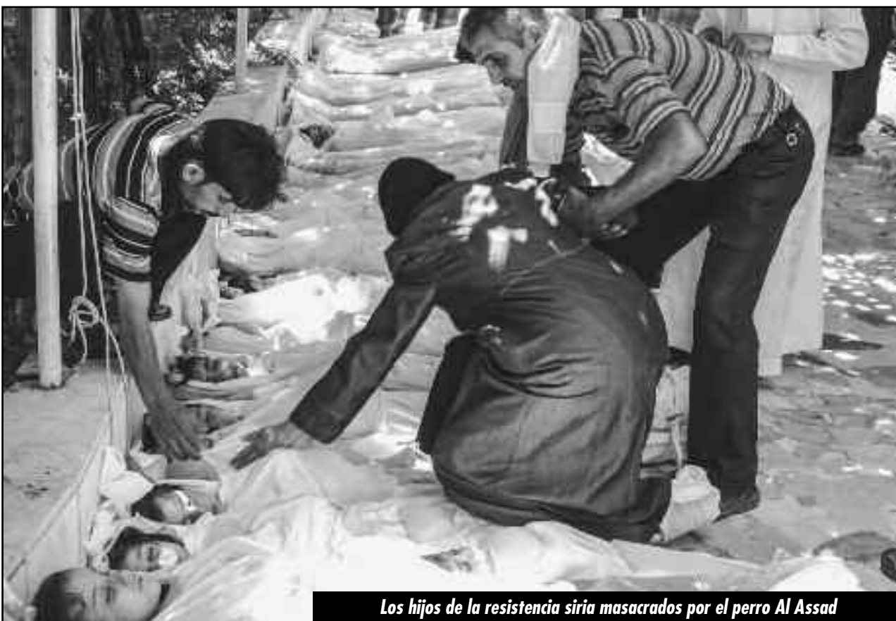
Los hijos de la resistencia siria masacrados por el perro Al Assad

El stalinismo, las burguesías chiitas y bolivarianas hicieron marchas en todo el mundo apoyando a