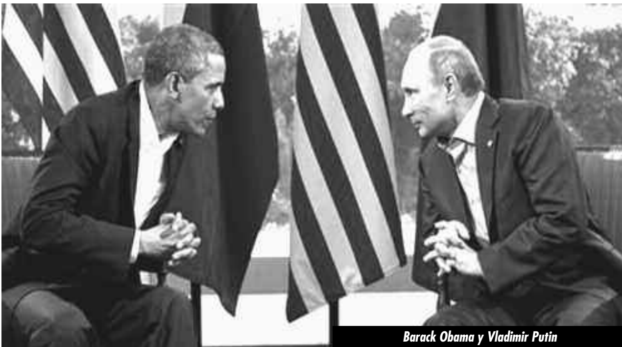
Barack Obama y Vladimir Putin

En realidad, el límite impuesto a EEUU, con respecto a posibles intervenciones militares, no lo ponen otras potencias imperialistas ni una decadencia de