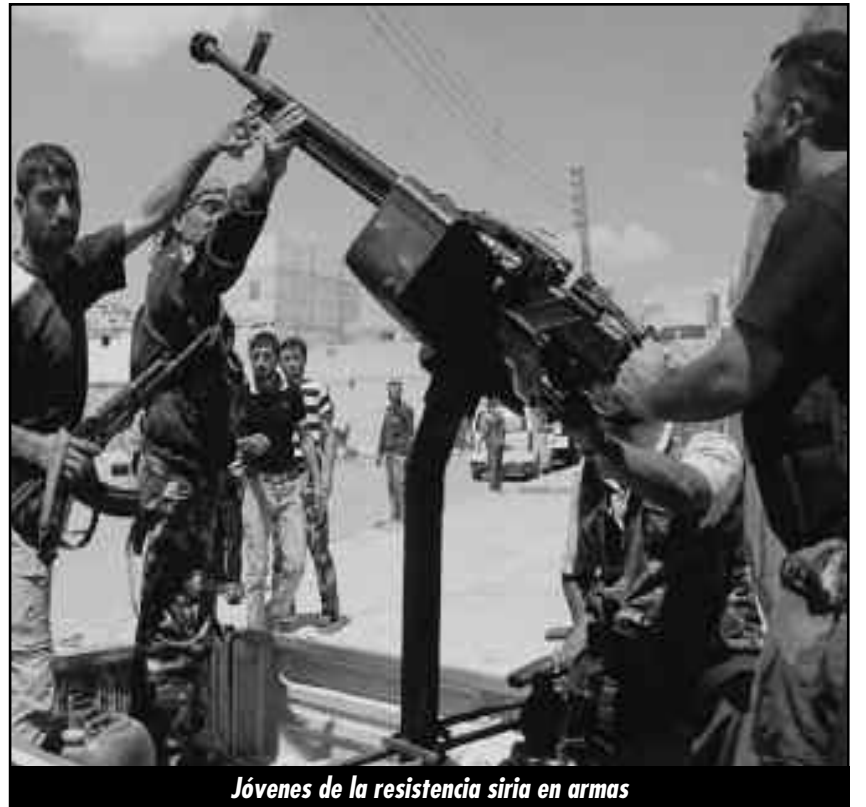
Jóvenes de la resistencia siria en armas

¡Que triunfe la insurrección en Damasco! ¡Brigadas obreras internacionales para ir a combatir con la clase obrera insurrecta de Siria! ¡Basta de traicionar, aislar y cercar a la heroica clase obrera siria, insurreccionada hoy en Damasco, masacrada y martirizada en toda Siria y hacinados en campos de concentración alrededor de las fronteras!