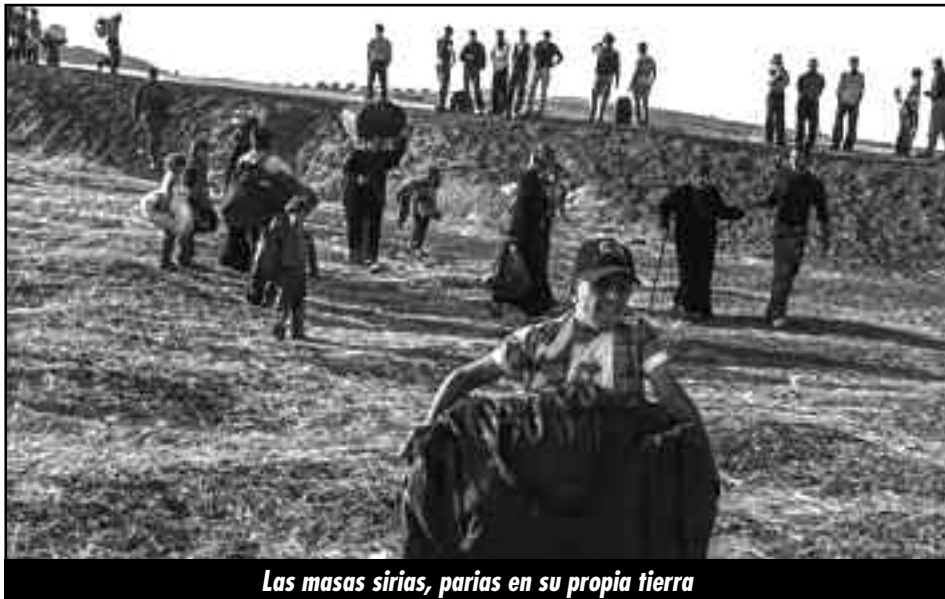
Las masas sirias, parias en su propia tierra

L os generales burgueses, bajo el mando de la burguesía saudí y turca, se preparan como carceleros de las masas rebeldes, en las zonas liberadas, para entrar al gobierno del protectorado imperialista, junto a los generales asesinos de Al Assad bajo el