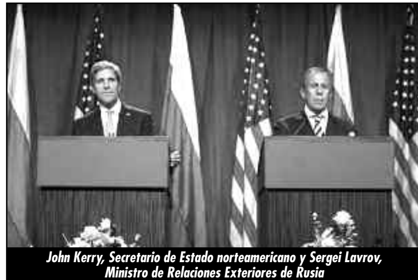
John Kerry, Secretario de Estado norteamericano y Sergei Lavrov, Ministro de Relaciones Exteriores de Rusia

¡ABAJO EL PACTO CONTRARREVOLUCIONARIO DE OBAMA, PUTIN Y AL ASSAD PARA LIBANIZAR SIRIA, SEGUIR MASACRANDO A LAS MASAS Y CUIDARLE LAS FRONTERAS AL ESTADO SIONISTA DE ISRAEL!