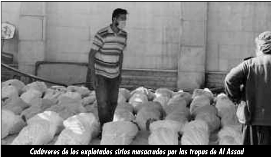
Cadáveres de los explotados sirios masacrados por las tropas de Al Assad