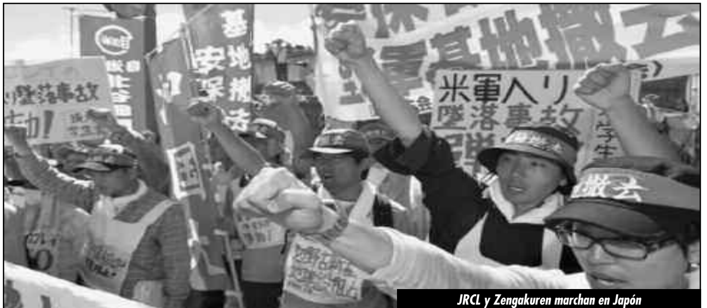
JRCL y Zengakuren marchan en Japón

En todo el mundo, trabajadores indignados se están levantando en protesta -en Brasil, Turquía, Grecia... Nuestros camaradas están luchando en este mismo momento. Ahora es tiempo de uniros y fortalecer nuestro contraataque. ¡Luchemos contra la clase capitalista monopolista y sus gobiernos! ¡No a la imposición de la pobreza sobre las masas laboriosas! ¡No a la invasión neocolonialista!