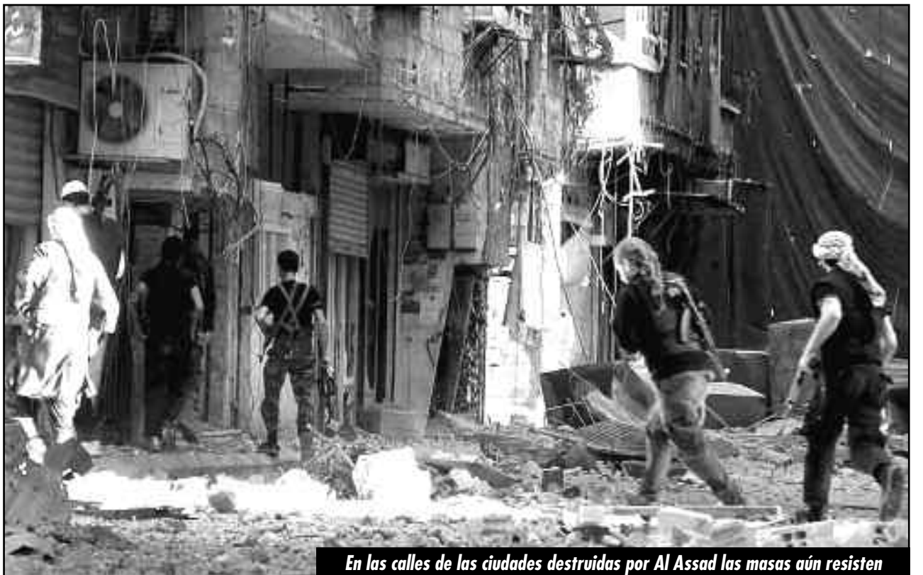
En las calles de las ciudades destruidas por Al Assad las masas aún resisten

El problema que tienen todos, es que en Damasco el ESL y el Frente Al Nusra no dirigen a los obreros que se toman las fábricas, ni jamás se lo proponen hacerlo. Es más, en las zonas liberadas las defienden del ataque de los obreros que buscan comer. Por ello, si no logran contener la revolución y