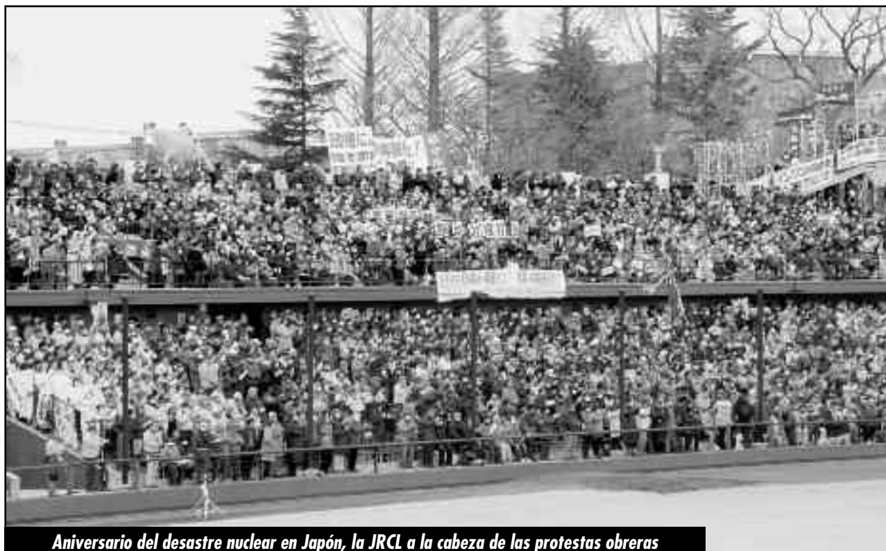
Aniversario del desastre nuclear en Japón, la JRCL a la cabeza de las protestas obreras

Al tratado de libre comercio del Pacífico hay que oponerle sin más pérdida de tiempo un tratado de los obreros de los países bañados por las aguas del Pacífico, para expulsar y expropiar a las transnacionales; para aplastar a los regímenes y gobiernos asesinos de la burguesía y el imperialismo. Un acuerdo internacionalista de la clase obrera del Pacífico para enfrentar a los gobiernos y regímenes restauradores del capitalismo, y restaurar bajo formas revolucionarias los estados obreros de China, Vietnam, Camboya y vencer al imperialismo, conquistando una Corea unificada y socialista. En la lucha contra el Tratado del Transpacífico el camino no es otro que el combate por unir las filas de la clase obrera de toda la región contra las burguesías y el imperialismo, por la destrucción de las bases militares imperialistas.