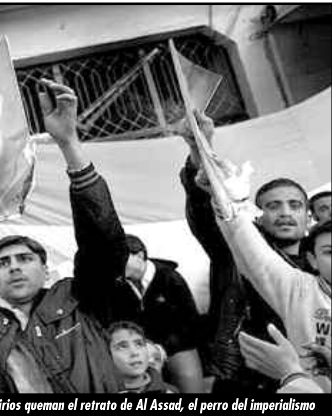
Sirios queman el retrato de Al Assad, el perro del imperialismo

¡FUERA DE LA RESISTENCIA LOS GENERALES BURGUESES DEL ESL Y JABHAT AL-NUSRA!