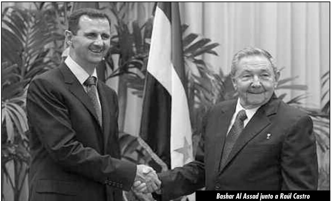
Bashar Al Assad junto a Raúl Castro

Toda corriente que no se oriente con una polí-