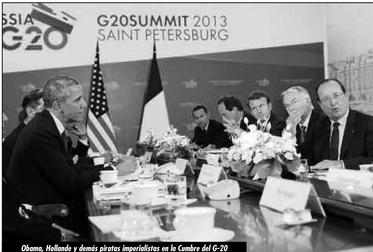
Obama, Hollande y demás piratas imperialistas en la Cumbre del G-20

El PTS que no distingue a un obrero de un burgués en la guerra no puede ser otra cosa que una corriente pequeñoburguesa, que ha hecho el siguiente estereotipo de la clase obrera: un obrero vende su fuerza de trabajo; lucha por el valor de la misma y por eso hace sindicatos... huelgas y cada dos o cuatro años tiene que votar a “sus partidos”. Tesis menchevique, socialdemócrata que sólo distingue al movimiento obrero en épocas de paz.