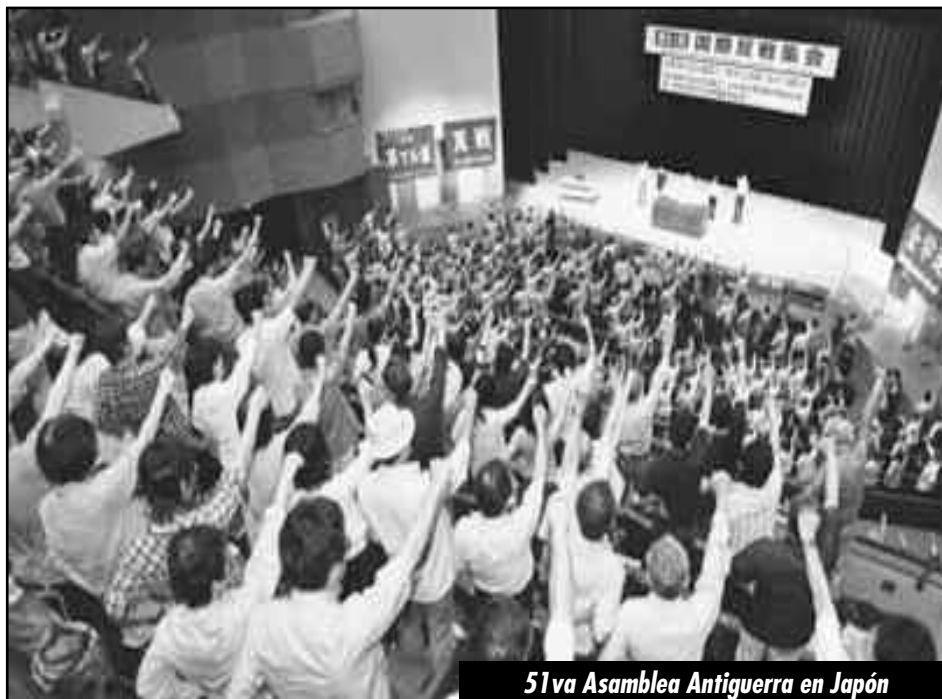
51 va Asamblea Antiguerra en Japón

En Japón estamos promoviendo la lucha para parar la revisión de la Cons-