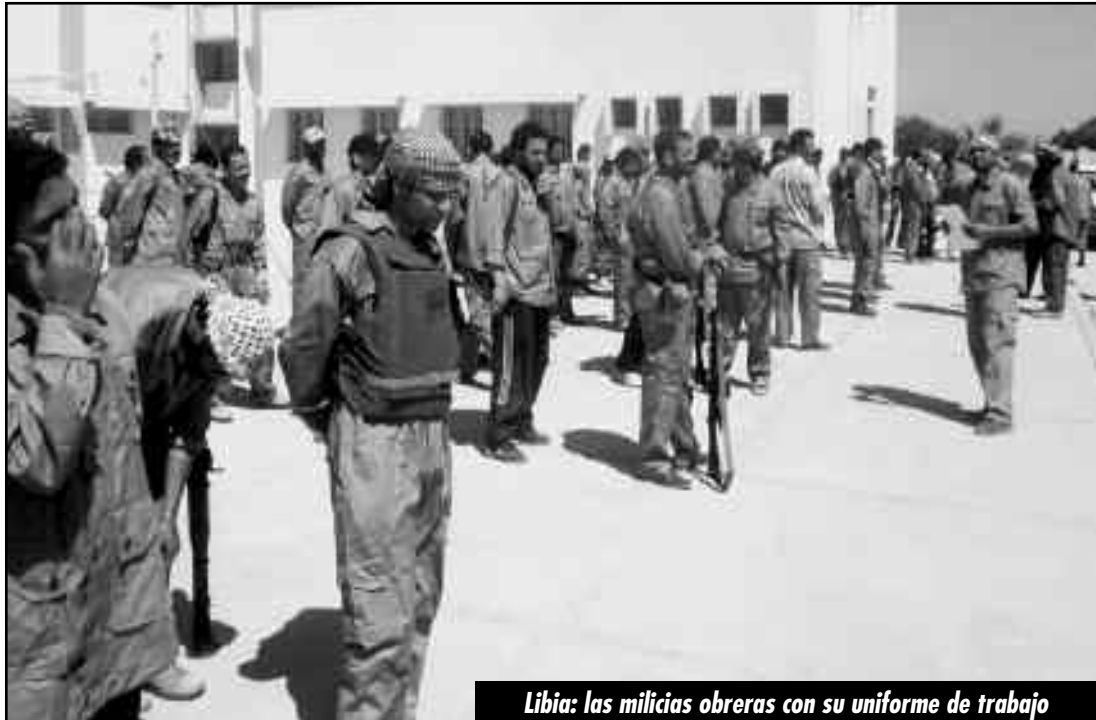
Libia: las milicias obreras con su uniforme de trabajo

Últimamente, la acción más desesperada y descarada de este rejunte de burgueses por continuar con el plan de desarme fue liberar a más de 3.000