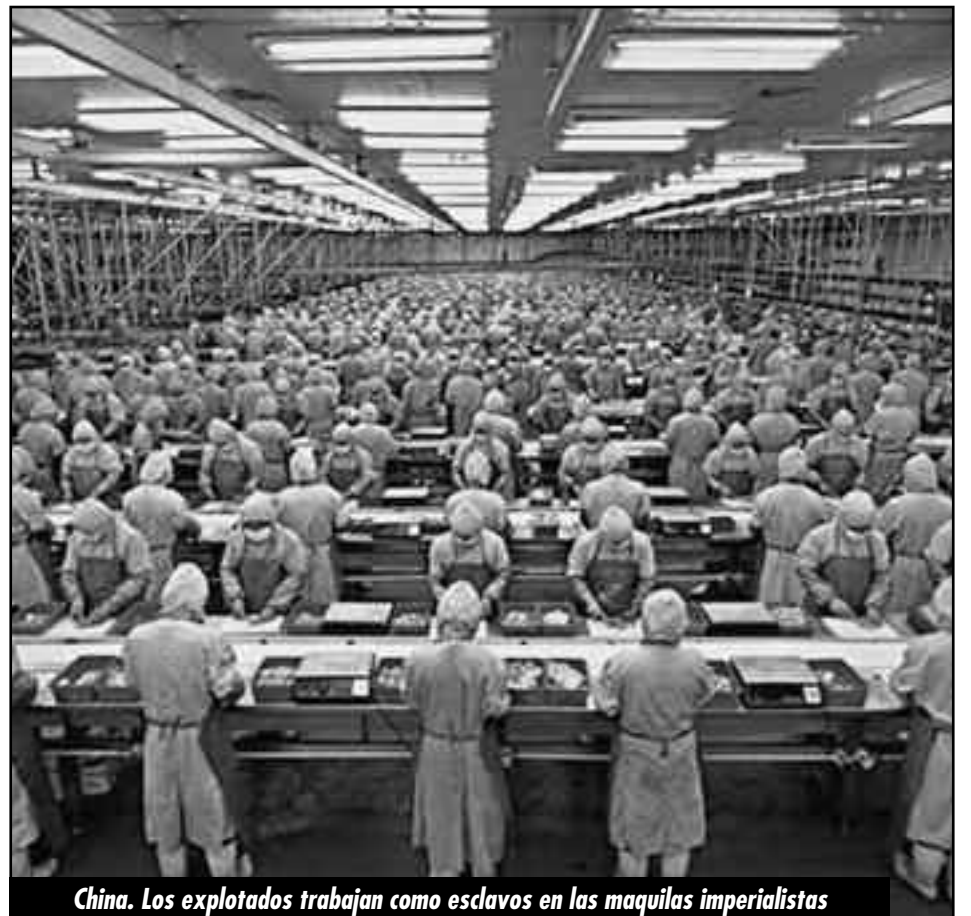
China. Los explotados trabajan como esclavos en las maquilas imperialistas

H ace un año, estuvimos con ustedes luchando juntos contra el imperialismo en la 50° Asamblea contra la Guerra.