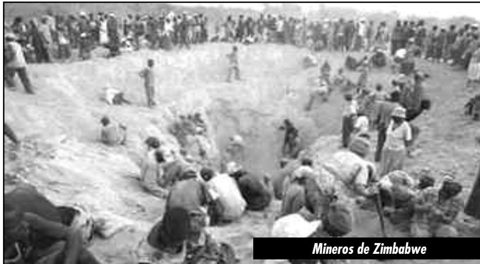
Mineros de Zimbabwe

Zimbabwe es una verdadera reserva de mano de obra esclava, para ser utilizada en Sudáfrica y el resto del continente. Mientras la burguesía discute sobre el fraude electoral, el desempleo, que alcanza el 90%, empeora y los que tienen trabajo lo hacen en condiciones terribles. No hay ni salud ni educación