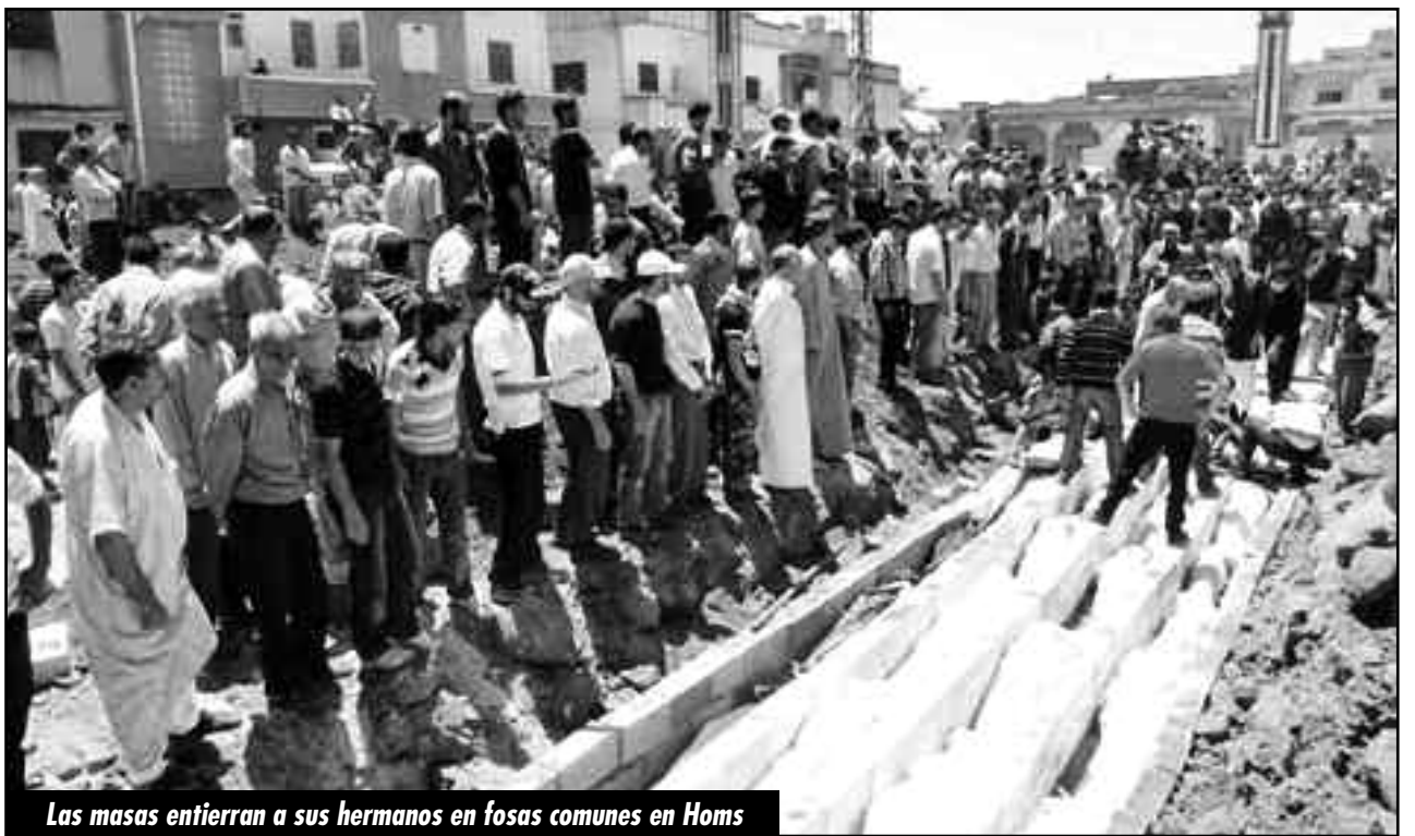
Las masas entierran a sus hermanos en fosas comunes en Homs

Durante años la revolución siria fue cercada, aislada. Desde el FSM, renegados del marxismo, acusaban a cada paso a las masas revolucionarias de ser “agentes del imperialismo” que atacaban al supuesto gobierno “socialista o nacionalista” de Al Assad en Siria. Una falacia. El perro Bashar no es más que el representante de una burguesía multimillonaria, asociada a los negocios de las petroleras y demás transnacionales imperialistas, que ya hacía rato había iniciado el mayor proceso de privatizaciones en la historia de Siria y, como no podía ser de