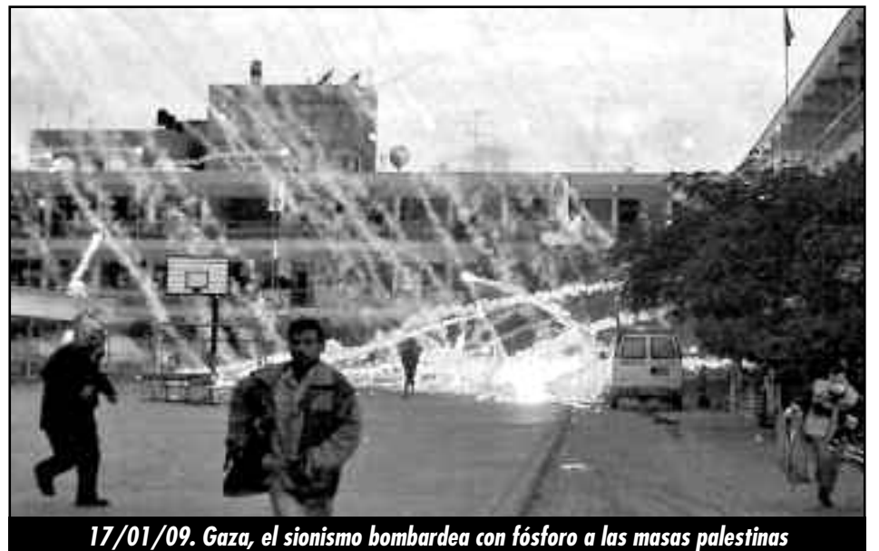
17/01/09. Gaza, el sionismo bombardea con fósforo a las masas palestinas

¡FUERA LAS POTENCIAS IMPERIALISTAS DEL MEDITERRÁNEO, DEL MAGREB Y MEDIO ORIENTE! ¡FUERA LA BASE MILITAR DE TARTUS EN SIRIA, DE RUSIA, LOS GENOCIDAS DE CHECHENIA Y DE LAS REPÚBLICAS DEL CÁUCASO! ¡POR LA DESTRUCCIÓN DEL ESTADO SIONISTA FASCISTA DE ISRAEL!