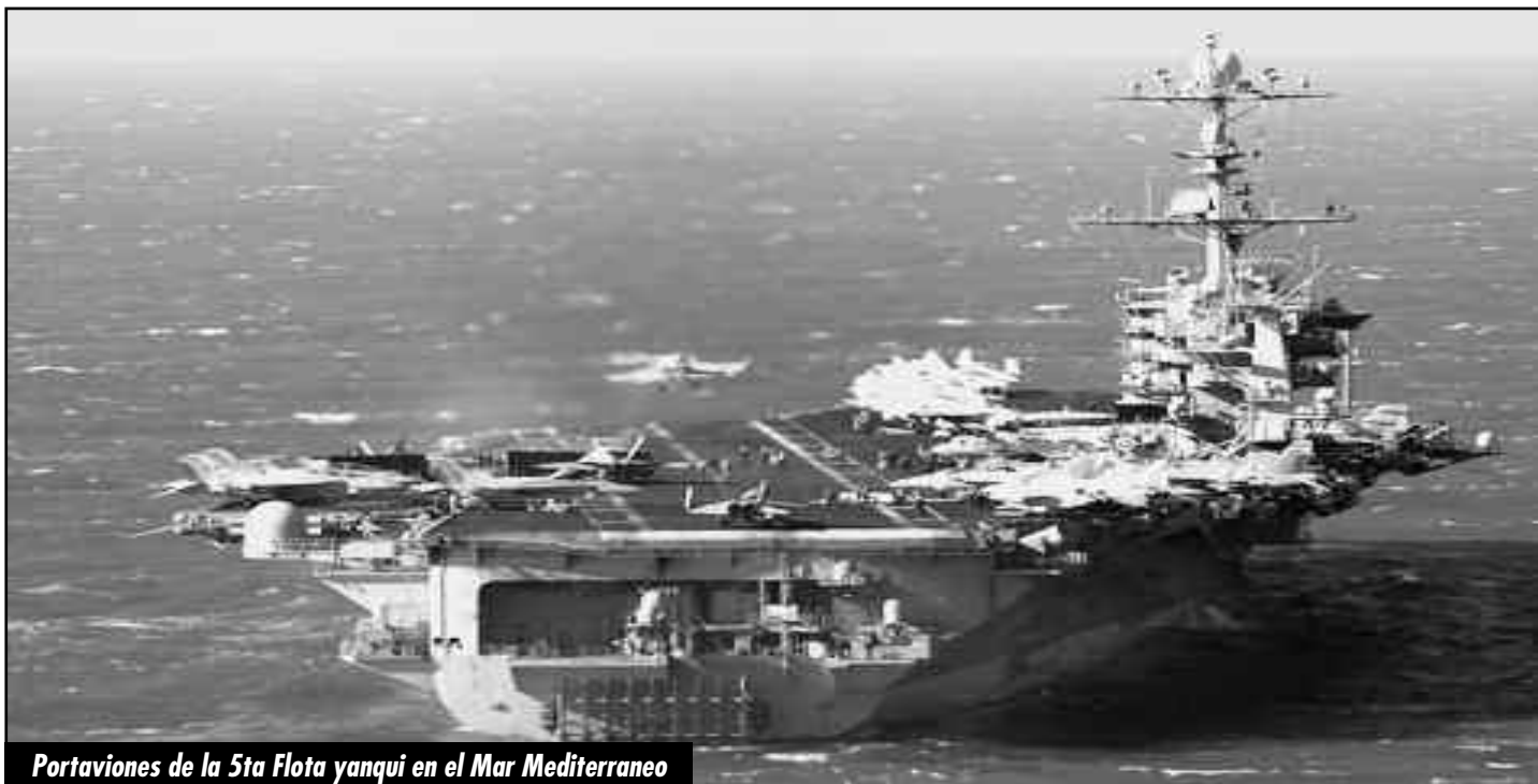
Portaviones de la 5ta Flota yanqui en el Mar Mediterraneo

En la crisis económica que pende sobre nosotros, los gobiernos imperialistas están haciendo todo lo posible por salvar a los monopolios capitalistas de sus propios países, mientras hacen que los trabajadores y las masas laboriosas paguen el precio de la crisis. En Europa, las políticas de austeridad que la dirigencia de la Unión Europea ha impuesto sobre países severamente endeudados han lanzado a la miseria del desempleo a un número sin prece-