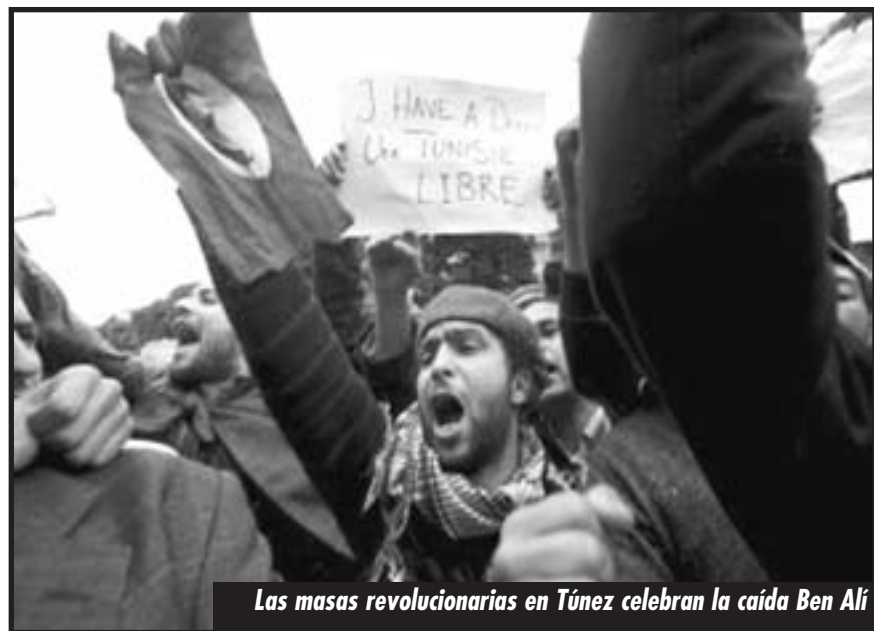
Las masas revolucionarias en Túnez celebran la caída Ben Alí

Con este levantamiento revolucionario por el pan y el trabajo, embistiendo contra la ciudadela del poder, derrotando a la burocracia sindical traidora de la UGTT en las calles, enfrentando la sangrienta represión, desarmando y aplastando a la policía asesina, atacando las comisarías, derrocando al gobierno antiobrero, descalabrando al régimen y dejando totalmente en crisis y debilitado al Estado, las masas tunecinas transformaron su chispa en el incendio de todo el norte de África, que ya está irrumpiendo en Medio Oriente y amenaza con penetrar a la misma Europa imperialista. ¡Vivan los obreros y explotados del Túnez revolucionario, que mocionan al proletariado mundial que para conquistar el pan, el trabajo, la libertad y la independencia nacional hay que enfrentar al imperialismo, sus gobiernos, regímenes y estados capitalistas, y a sus agentes al interior del movimiento obrero!