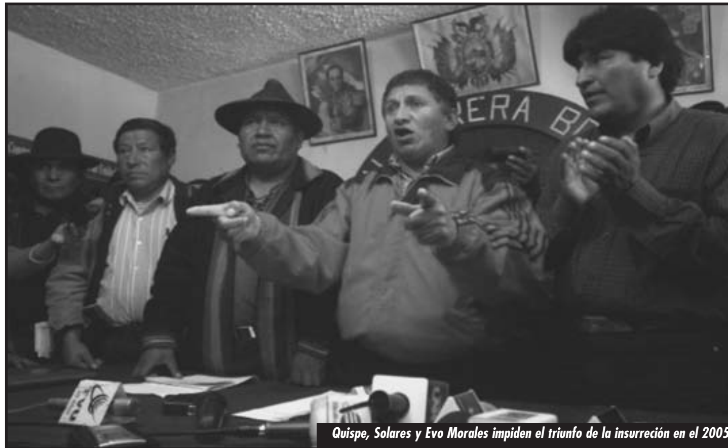
Quispe, Solares y Evo Morales impiden el triunfo de la insurrección en el 2005

Ha llegado el momento de tomar la resolución de todos los problemas en nuestras manos, en las firmes manos de la clase obrera y los campesinos arruinados. No debemos delegar más en ningún gobierno que no sea un verdadero gobierno revolucionario obrero y campesino. Los obreros de Libia, Túnez y Egipto nos marcan el verdadero camino para imponer nuestras demandas: hay que llevar al triunfo la revolución obrera y campesina del 2003-