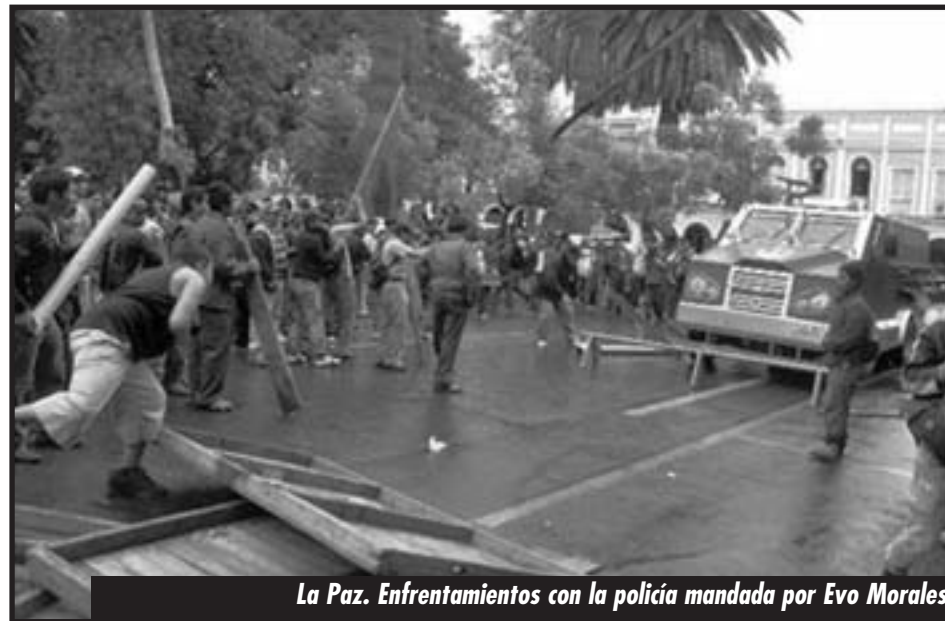
La Paz. Enfrentamientos con la policía mandada por Evo Morales

Precisamente por ello, es que es el gobierno de Morales quien sostiene a