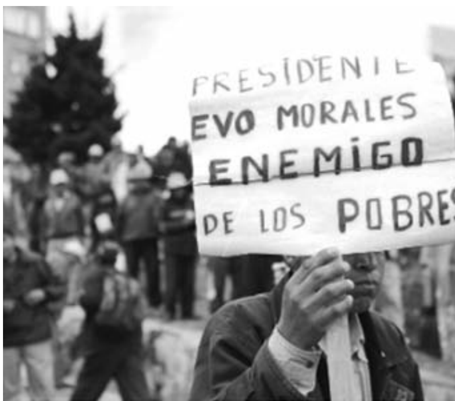
Las masas en Bolivia enfrentan el gasolinazo de Evo Morales

¡FUERA MONTES TRAIOR Y TODAS LAS DIRECCIONES COLABORACIONISTAS DE NUESTRAS ORGANIZACIONES OBRERAS!