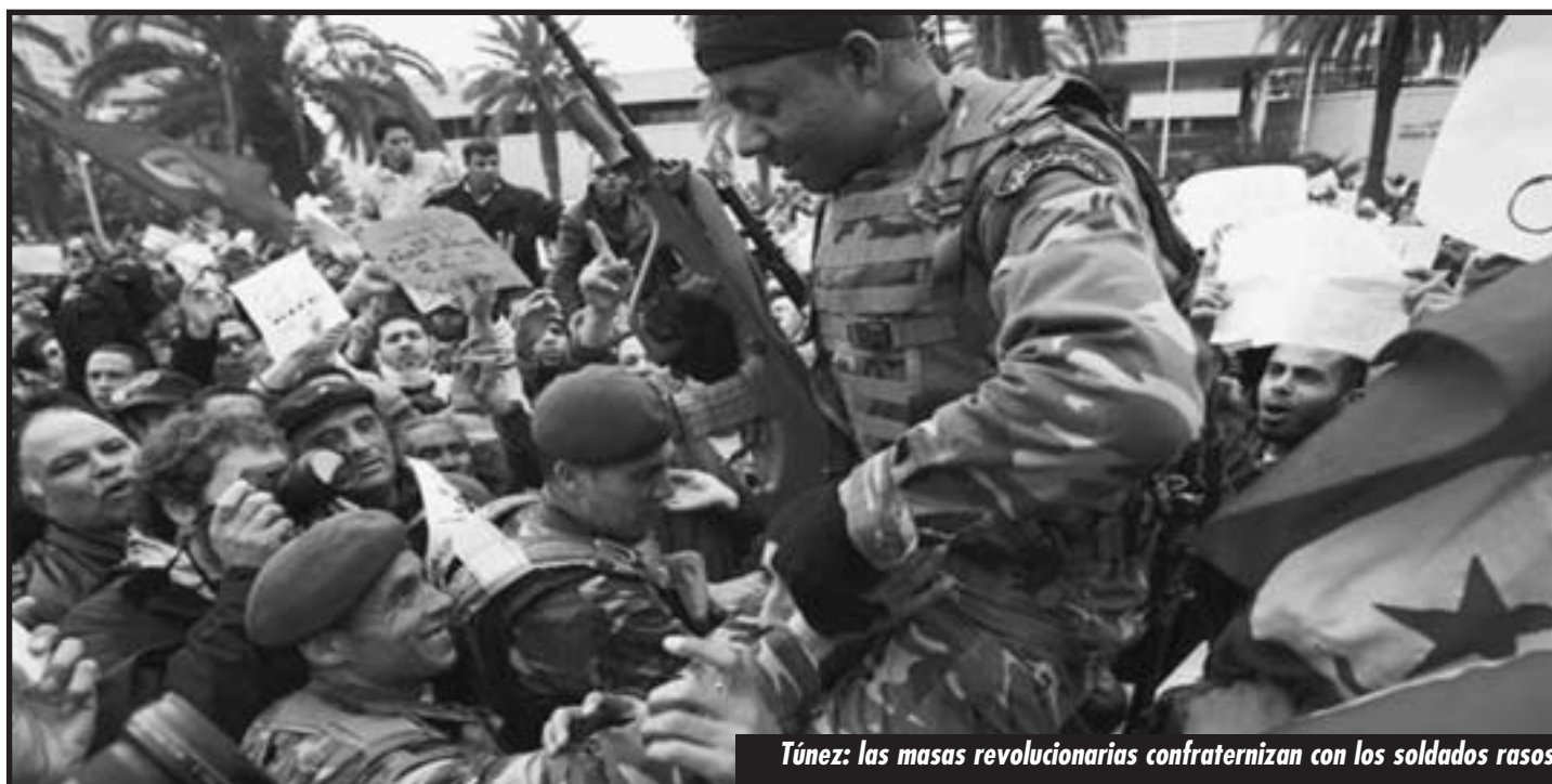
Túnez: las masas revolucionarias confraternizan con los soldados rasos

Esto pone de manifiesto que para triunfar y para que su heroica revolución no sea expropiada, los obreros tunecinos necesitan de una dirección revolucionaria a su frente, que desnude y enfrente la estrategia de los estados mayores del imperia-