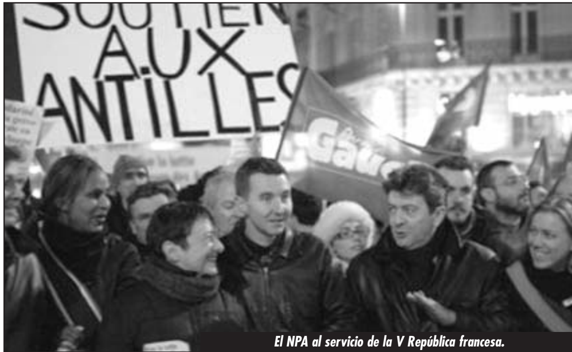
El NPA al servicio de la V República francesa.

El NPA no llama a esta pelea porque es enemigo de combatir a su propia burguesía. No quieren que el fuego de la revolución del Norte de África y Medio