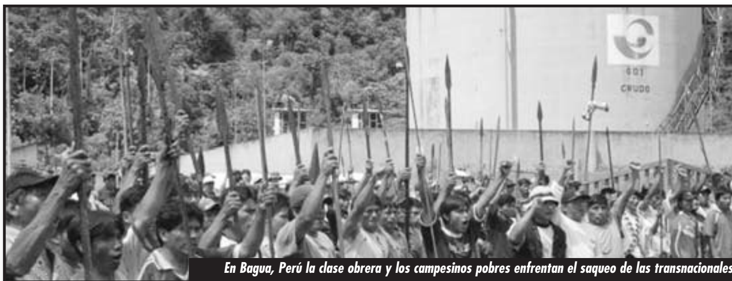
En Bagua, Perú la clase obrera y los campesinos pobres enfrentan el saqueo de las transnacionales