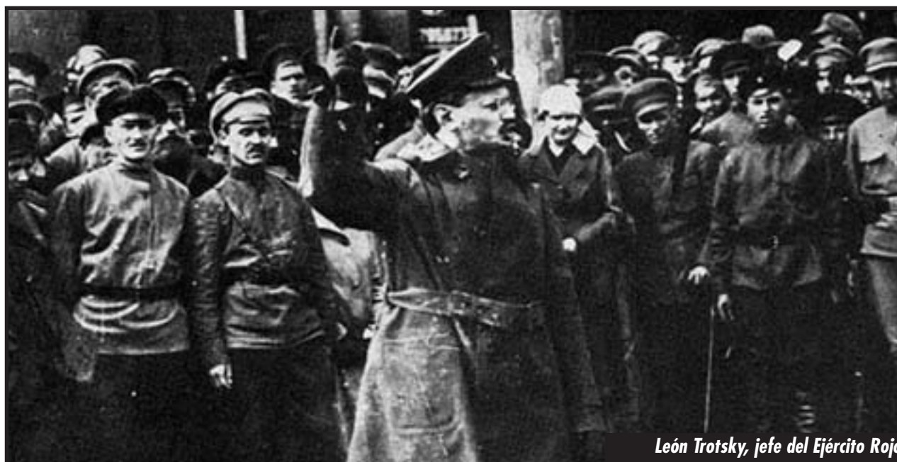
León Trotsky, jefe del Ejército Rojo

El proletariado en Libia y todo el Norte de África necesitan un partido revolucionario internacionalista a su frente que levante el programa por el que la IV