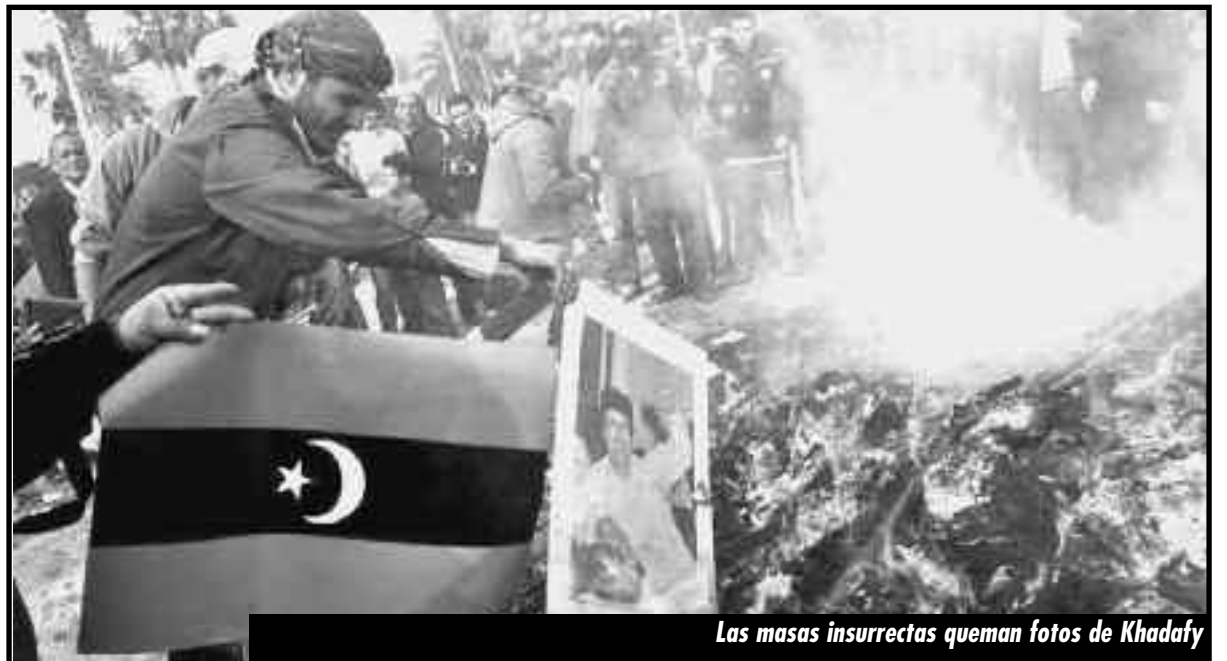
Las masas insurrectas queman fotos de Khadafy

Tanto la revolución en Túnez como en Egipto, tienen una misma tarea para garantizar su triunfo ¡Las organizaciones de las masas en lucha deben enviar ya mismo brigadas a Libia para aplastar la contrarrevolución en Trípoli! ¡Una misma clase, una misma lucha, una misma revolución!