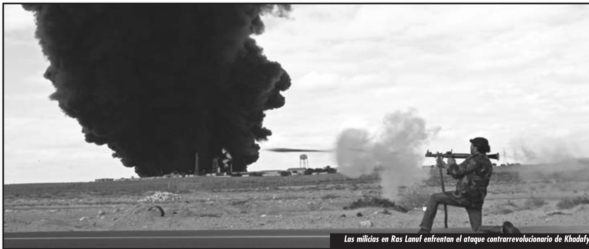
Las milicias en Ras Lanuf enfrentan el ataque contrarrevolucionario de Khadafy

¡ASÍ SE LUCHA! ¡LAS ARMAS NO SE DEVUELVEN! ¡LAS MILICIAS NO SE DISUELVEN! ¡EL QUE TIENE LAS ARMAS, TIENE EL PAN Y EL EMPLEO! ¡ABAJO LA CASTA DE OFICIALES DEL EJÉRCITO EGIPCIO! ¡COMITÉS ARMADOS DE OBREROS, SOLDADOS Y CAMPESINOS! BARADEI, OBAMA, Y LOS HERMANOS MUSULMANES SOSTUVIERON DURANTE 30 AÑOS AL ASESINO MUBARAK! BASTA DE FARSA, BASTA DE MENTIRAS! ¡POR UN GOBIERNO PROVISIONAL REVOLUCIONARIO DE OBREROS, CAMPESINOS POBRES Y LOS SECTORES POPULARES EMPOBRECIDOS, APOYADO EN LAS ORGANIZACIONES DE DEMOCRACIA DIRECTA DE LAS MASAS EN LUCHA!