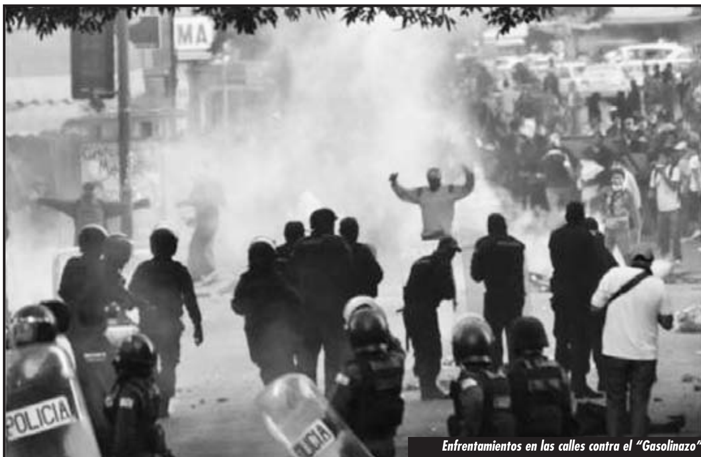
Enfrentamientos en las calles contra el "Gasolinazo"

Es que, los ataques del gran capital en crisis mortal muestran que bajo sus gobiernos y regímenes lacayos, como el boliviano, no hay lugar ni siquiera para mantener las actuales paupérrimas condiciones de vida de las masas. Las superiores condiciones de miseria impuestas por el gobierno confirman que ya no hay lugar para reformas, que Morales lejos de entregar concesiones, sólo tiene para entregar nuevos aprietes de tuerca en la explotación de las masas. Por ello, ante las actuales condiciones de penurias inauditas, de in-