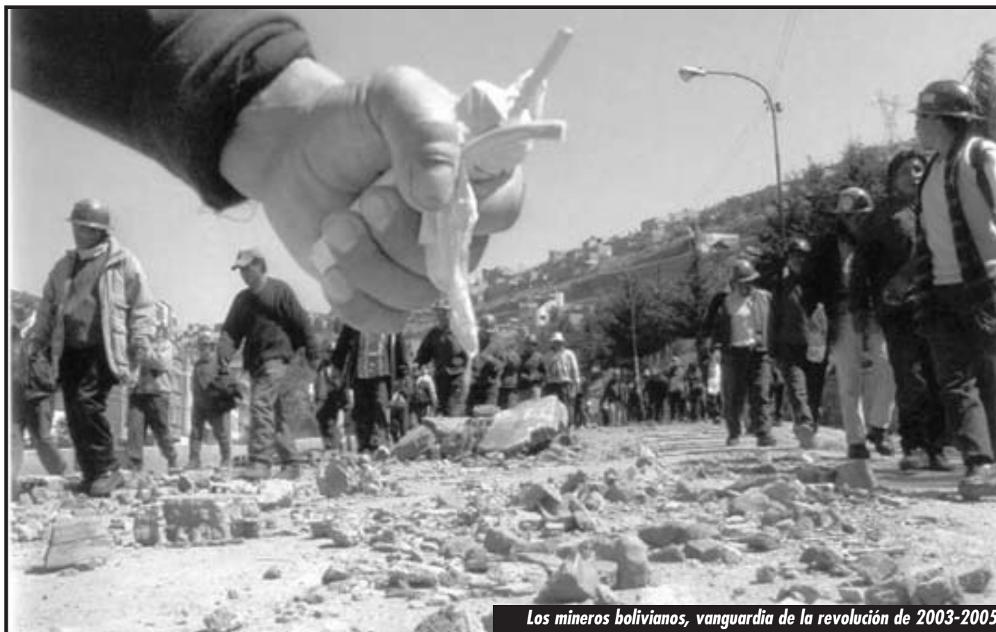
Los mineros bolivianos, vanguardia de la revolución de 2003-2005

Con estas jornadas de lucha política de masas, los obreros y campesinos pobres, han dejado al descubierto al gobierno de Morales y sus nacionalizaciones chutas que son solo negocios para las transnacionales y hambre y miseria para los obreros y los campesinos pobres; por ello ahora Morales vuelve a mostrar un rostro “amigable”, “popular”; dándole nuevamente a su gobierno -al menos formalmente-