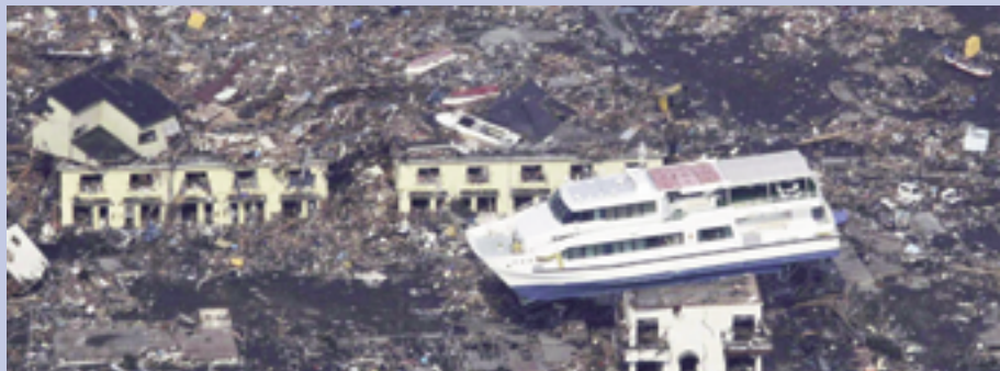
Japón: La clase obrera sometida a los padecimientos del terremoto, el tsunami posterior, la radiación nuclear y la avaricia de la burguesía imperialista.