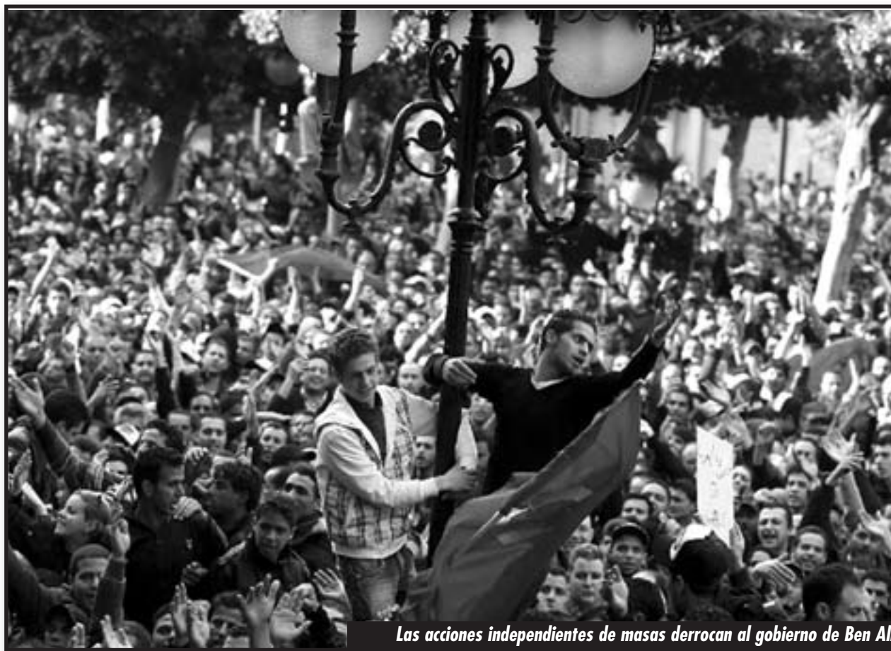
Las acciones independientes de masas derrocan al gobierno de Ben Ali

La crisis del capitalismo ha llevado a los gobiernos burgueses a atacar brutalmente las conquistas y condiciones de vida del proletariado y los explotados de todo el mundo. La clase obrera ha respondido abriendo procesos pre-revolucionarios y revolucionarios que han traspasado las semicolonias y han llegado a las metrópolis. Las revoluciones en Túnez, Egipto y ahora en Libia, son distintos capítulos de un solo proceso