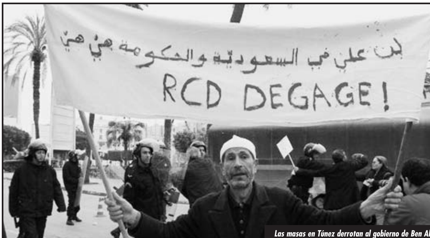
Las masas en Túnez derrotan al gobierno de Ben Ali

Es por todo esto, que NO pueden estar más al frente de la UGTT los burócratas colaboracionistas que se