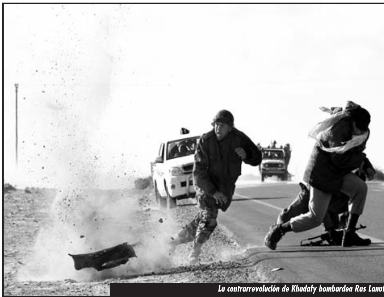
La contrarrevolución de Khadafy bombardea Ras Lanuf

La prensa imperialista está desesperada por la “anarquía” y “desorden” que hay en la ofensiva de los “rebeldes”. Tienen razón en estar preocupados. En el combate contra las tropas asesinas de Khadafy y el imperialismo en Libia, la burguesía “democrática” no controla el frente de batalla, que es móvil. La burguesía “democrática” intenta impedir que las masas avancen, para poder hacer un pacto con el imperialismo y sacar a Khadafy de Trípoli. Sin embargo, las masas revolucionarias armadas persisten en su ofensiva, más allá de un repliegue momentáneo en algunas ciudades, porque saben que en cada ciudad las espera una insurrección que se levanta y les garantiza techo y comida a todos los milicianos.