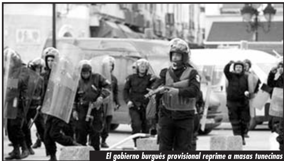
El gobierno burgués provisional reprime a masas tunecinas

Los obreros europeos, que tienen la llave para el triunfo de los explotados de las semicolonias, deben ponerse en pie de lucha ya mismo y romper con la política de los burócratas sindicales y las direcciones reformistas que llamaron a los gobiernos imperialistas a "rectificar" y a "menguar" el duro ataque que largaron contra la clase obrera. El proletariado debe conquistar de inmediato un Congreso Obrero continental para coordinar un mismo combate con las masas tunecinas, libias y egipcias llamando a la Huelga General Revolucionaria en toda Europa, bajo las banderas de "¡el enemigo está en casa!". ¡Abajo Maastricht! ¡Abajo la V República francesa! ¡Abajo el gobierno asesino de Sarkozy! ¡Abajo la Corona española e inglesa! ¡Abajo