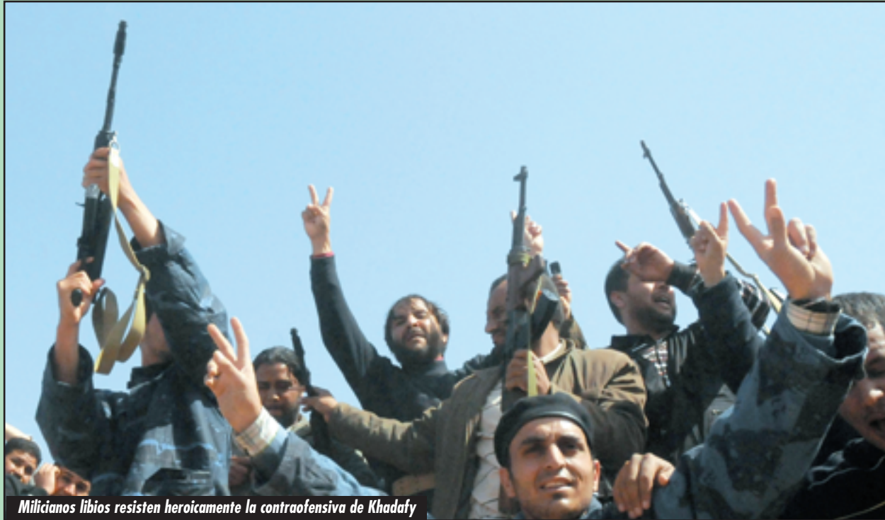
Milicianos libios resisten heroicamente la contraofensiva de Khadafy

MIENTRAS LA CHISPA DE TÚNEZ Y LAS ONDAS EXPANSIVAS DE SU REVOLUCIÓN IMPACTAN EN YEMEN, JORDANIA, IRAN Y TODO MEDIO ORIENTE: