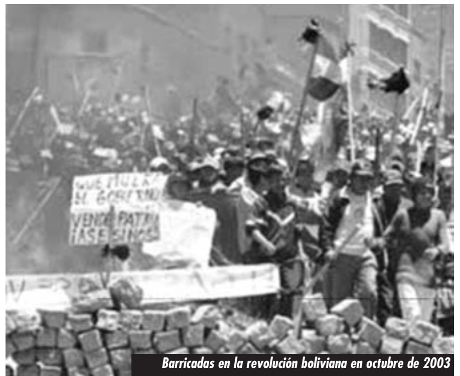
Barricadas en la revolución boliviana en octubre de 2003

¡Fuera Gringos! Ni el 30% ni el 50% de Evo Morales que nos mató de hambre: ¡Nacionalización sin pago y bajo control obrero de los hidrocarburos y la minería!