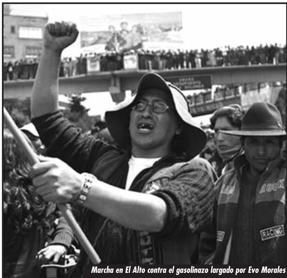
Marcha en El Alto contra el gasolinazo largado por Evo Morales

No hay más tiempo que perder. En Bolivia, a diferencia de la revolución obrera y socialista en Egipto, Túnez o Libia, ya estamos al final de todo el proceso revolucionario, donde el gobierno de frente popular es el ante último gobierno de la burguesía en su lucha contra la revolución. Se vienen combates decisivos para la clase obrera. La revolución boliviana se definirá históricamente en el enfrentamiento entre comunismo o fascismo, y en los combates de la lucha de clases internacional. O la salida la da la clase obrera llevando al triunfo la revolución y con una insurrección triunfante impone el gobierno revolucionario de la COB, o la salida la dará la burguesía con las bandas fascistas de la Media Luna.