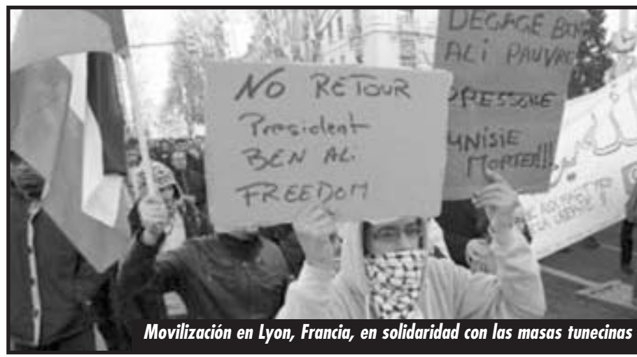
Movilización en Lyon, Francia, en solidaridad con las masas tunecinas

Pero esta situación debe definirse. En 1917 Lenin alertaba de esta cuestión en plena Revolución Rusa en “ Las tesis de abril ”: “ Este doble poder se manifiesta en la existencia de dos gobiernos: uno es el gobierno principal, el verdadero, el real gobierno de la burguesía, «el gobierno provisional» de Lvov y Cía., que tiene en sus manos todos los resortes del poder; el otro es un gobierno suplementario y