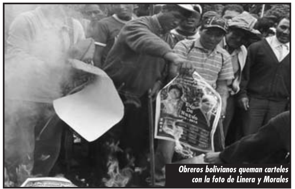
Obreros bolivianos queman carteles con la foto de Linera y Morales

Ese congreso, es el que se transformará en el verdadero poder de los trabajadores para dar una salida a la crisis preparando una Huelga General revo-