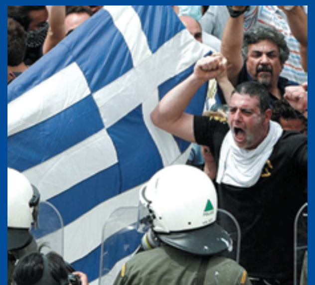
La clase obrera de Grecia de pie junto a sus hermanos de Egipto.

¡HAY QUE VOLVER A PONER DE PIE A LA CLASE OBRERA CONTRA EL ASESINO OBAMA, LOS BANQUEROS DE WALL STREET Y SUS GUERRAS CONTRARREVOLUCIONARIAS!