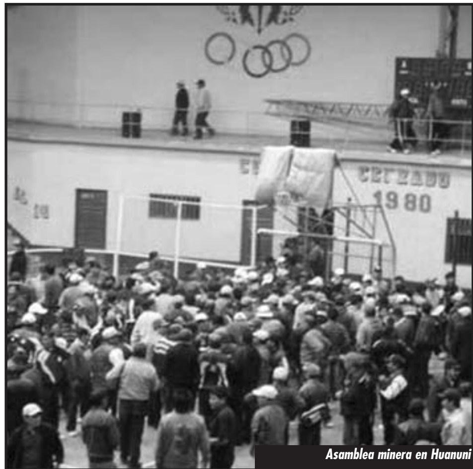
Asamblea minera en Huanuni

Esa es la farsa de revolución bolivariana y su proceso de cambio: escasez, miseria, salarios magros, represión y muerte para la clase obrera y los