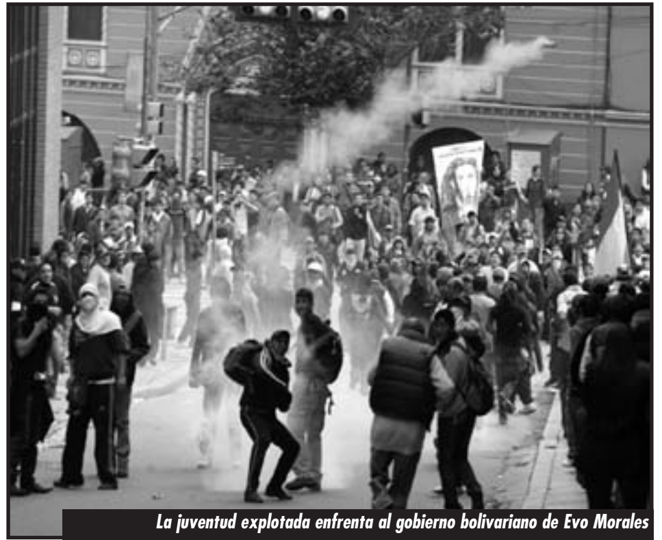
La juventud explotada enfrenta al gobierno bolivariano de Evo Morales

Por ello, los obreros y campesinos, contra el gobierno de Morales y para aplastar a las bandas fascistas de la Media Luna debemos poner en pie las milicias obreras y campesinas y marchar sobre los cuarteles para ir a buscar a nuestros hijos, soldados rasos bajo armas, para que desconozcan la oficialidad banzerista y se pasen con sus armas a la milicia obrera y campesina. Lllamarlos a conformar los comités de soldados para destruir a la casta de oficiales asesina del ejército banzerista. Es la milicia de los explotados la que, como en el 1952, destruyendo a la casta de oficiales asesina de obreros, puede garantizar la vida de millones de obreros y campesinos pobres y volver a poner de pie a los explotados en la Media Luna para aplastar al fascismo.