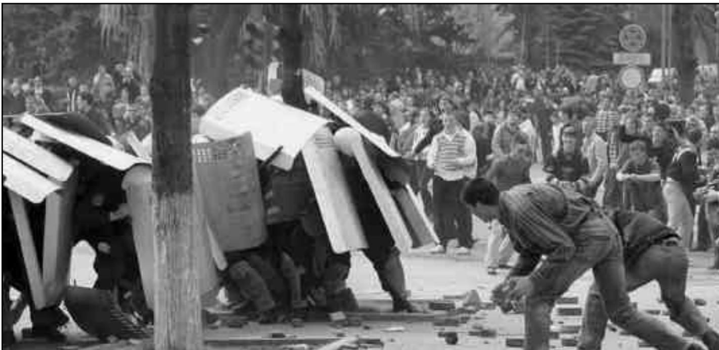
Revueltas en Moldavia en los comienzos del 2009.

15. Es bajo esta comprensión que el CWG, el HRS y toda la FLTI entran a un debate público en nuestra prensa de cara a los trabajadores del mundo para señalarles claramente que estamos hombro a hombro contra la amenaza militar contra China por parte de las demás potencias imperialistas o de sus representantes.