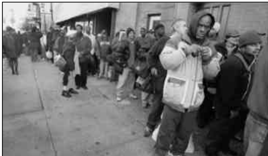
Colas de desocupados en EE.UU. esperando recibir un “plan social”

En una entrevista dada poco después de la inauguración de Obama que fue publicada en la edición 321 del periódico online del Lambertismo, el boletín de noticias internacional ILC ( http://www.owcinfo.org/ILC/NEW-