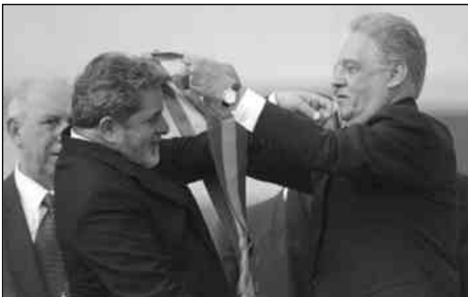
Lula la continuidad de la entrega y superexplotación al movimiento obrero.

Sin embargo -como planteaba Trotsky- los reformistas ni siquiera llaman a pelear en serio por su propio plan para imponerlo. Es necesario plantearle a la base de las organizaciones obreras de la CUT, la Conlutas, etc., que ante la crisis los trotskistas estamos por la revolución socialista, quienes impulsamos el programa transicional aquí planteado, y que nos reconocemos como una fracción minoritaria aún de la clase obrera. Pero que, sin embargo, no podemos dejar de plantear que los reformistas están en excelentes condiciones para llamar a un combate serio por su propio programa, es decir, llamarlos a que convoquen a un Congreso Obrero de delegados de base para preparar y organizar la huelga general para imponer "su" propio plan. Porque si nos dicen que no hay condiciones para luchar por imponer su propio plan -el de los reformistas- en realidad significa que no tienen la mas mínima voluntad de combatir y ya han desertado de la pelea antes de que la misma comience. Congreso