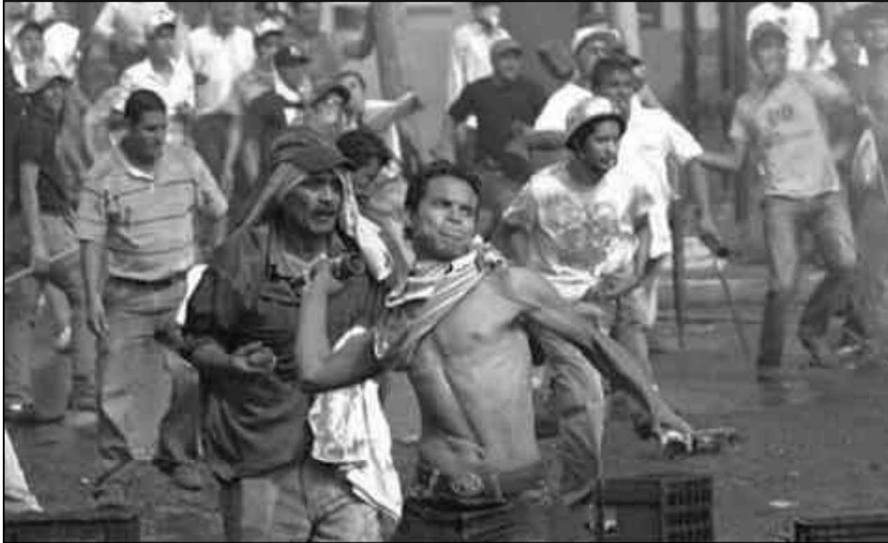
Los trabajadores y el pueblo hondureño enfrenta al golpe en las calles

Combatiendo en la primera línea contra la agresión del estado sionista de Israel contra la Gaza masacrada, conquistando un programa frente a los procesos revolucionarios de Guadalupe y Madagascar, desenmascarando el pérfido rol de los partidos "anticapitalistas" europeos, máscaras que encubren al socialimperialismo de izquierda que defendió a brazo partido el carácter de territorio de ultramar de Guadalupe y las Antillas de los carniceros imperialistas franceses. Así, con el programa de la revolu-