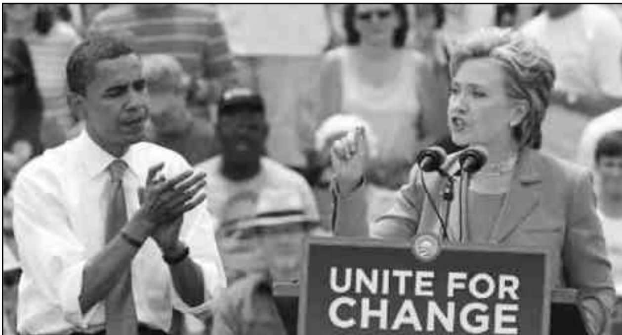
Obama y Hillary Clinton.

RESOLUCIÓN DEL CONGRESO DE FUNDACIÓN DE LA FLTI