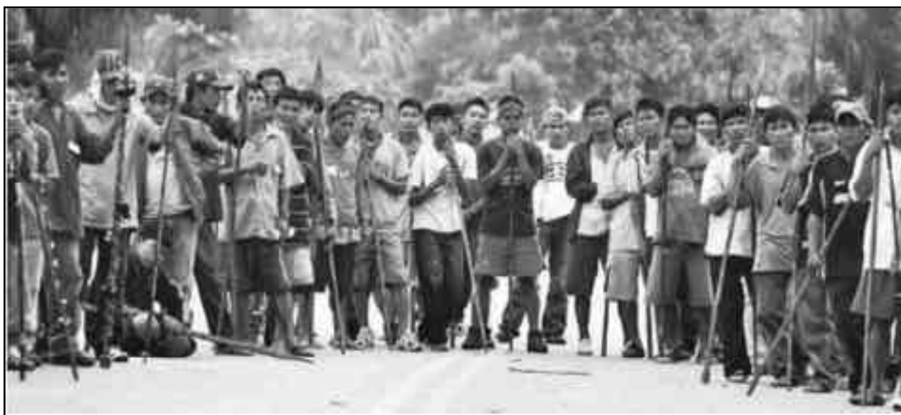
Piquete obrero y campesino en Bagua, Perú.

Los golpes de la crisis económica mundial han generado la crisis del régimen de dominio imperialista del planeta, impuesto a partir del 89 con los enormes triunfos contrarrevolucionarios conquistados con la restauración capitalista en los ex-estados obreros, dejando al desnudo a este sistema capitalista imperialista como un sistema enfermo, agónico y putrefacto que merece desaparecer de la esce-