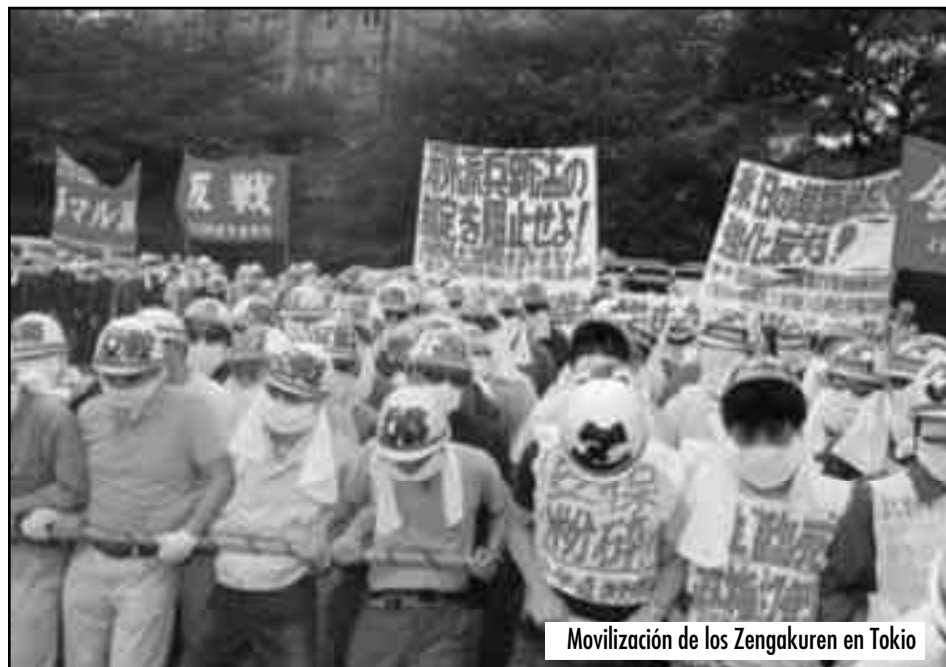
Movilización de los Zengakuren en Tokio