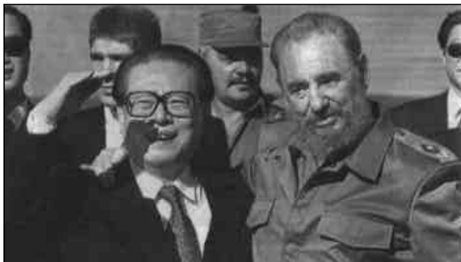
La nueva burguesía china, y Castro

7. ¿Estamos revisando la teoría de la revolución permanente que dice que sólo la clase obrera puede dirigir la realización de las tareas nacionales mediante la revolución socialista? Desde la década de 1980 ha habido algunos grandes cambios en las funciones del imperialismo que no cambian la esencia de la revolución permanente, pero que nos obligan a hacer frente a las nuevas contradicciones que se viven. Y es que eventualmente estos cambios han