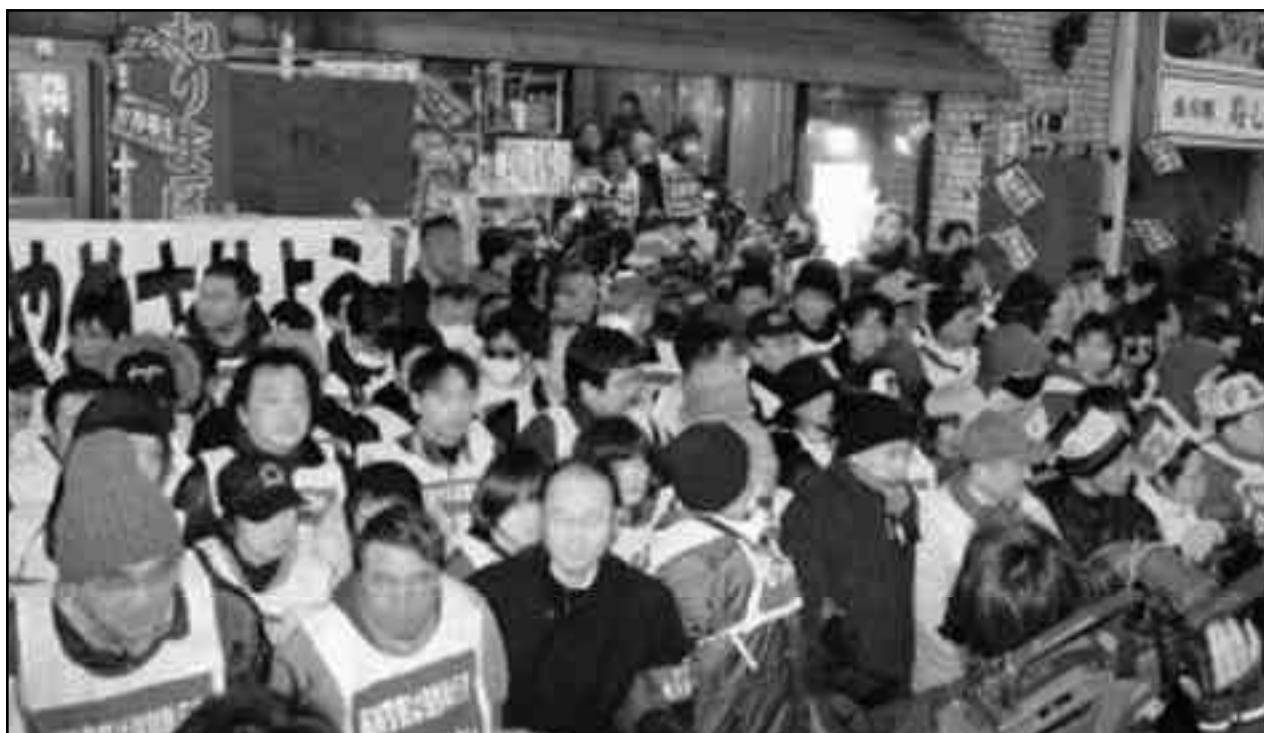
Trabajadores hoteleros en la defensa de su fuente de trabajo.

Si con cantos de sirena nos quieren someter a que entreguemos nuestras heroicas luchas contra la guerra y los explotadores, llamándonos a apoyar y a someternos a nuestros verdugos como los Obama, a las burguesías “bolivarianas”, a los frentes populares, a las burguesías islámicas que entregan nuestras guerras de liberación y nuestras luchas nacionales. ¡Tampoco lo podemos permitir!