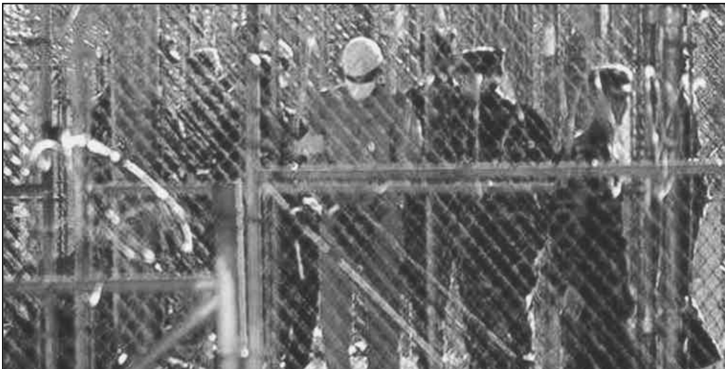
Milicianos antiimperialistas de Medio Oriente, presos en la base militar yanqui de Guantánamo, Cuba.

Sólo los observadores occidentales más reaccionarios y cínicos creen aún que la intervención de la OTAN en esta región es una batalla real contra el "terrorismo", o una pelea para llevar la democracia a aquellos que han estado viviendo bajo el mando de los Talibanes. Intereses geopolíticos más profundos