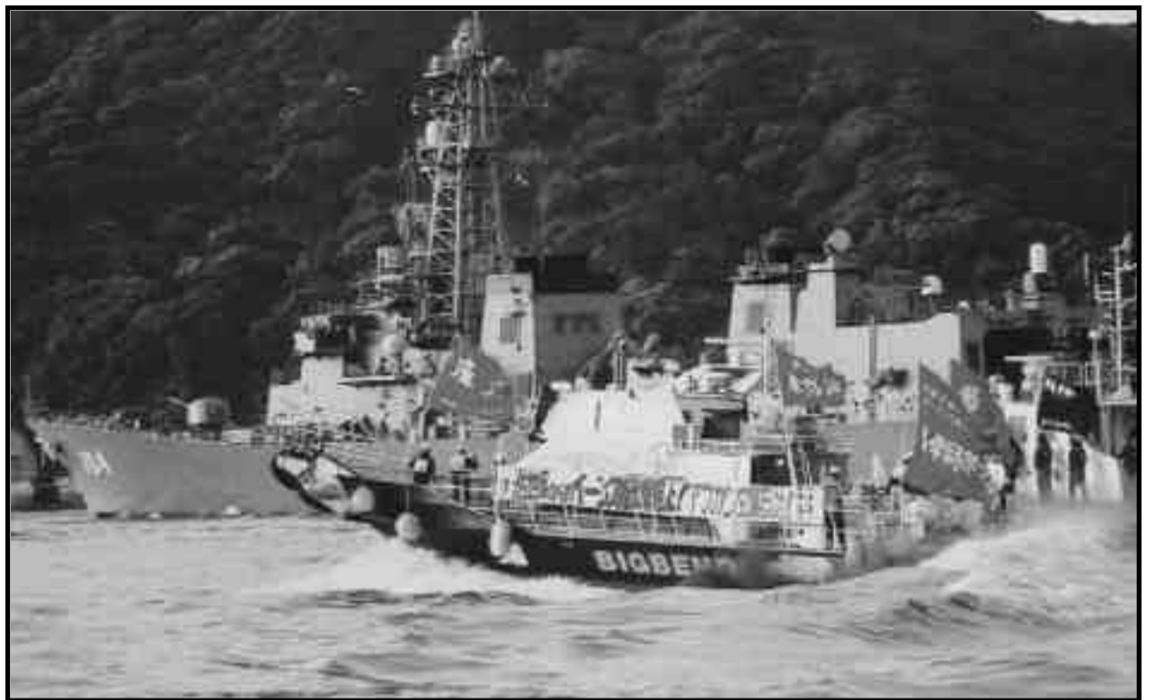
Los Zengakuren bloquean la salida de los barcos de guerra.

Por ello, venimos a hacerles una tercera moción y propuesta a esta asamblea; una moción que ya la hicieron los obreros y jóvenes revolucionarios en las barricadas de Atenas, los combatientes obreros y campesinos en Madagascar, Martinica y Guadalupe y los que se tomaron las fábricas en Francia: "La chispa se encendió en Atenas, que se incendie París"; y afirmemos juntos: ¡Que se incendie Londres, Nueva York! ¡Que vuelva un Vietnam en todo Medio Oriente! ¡Pa-