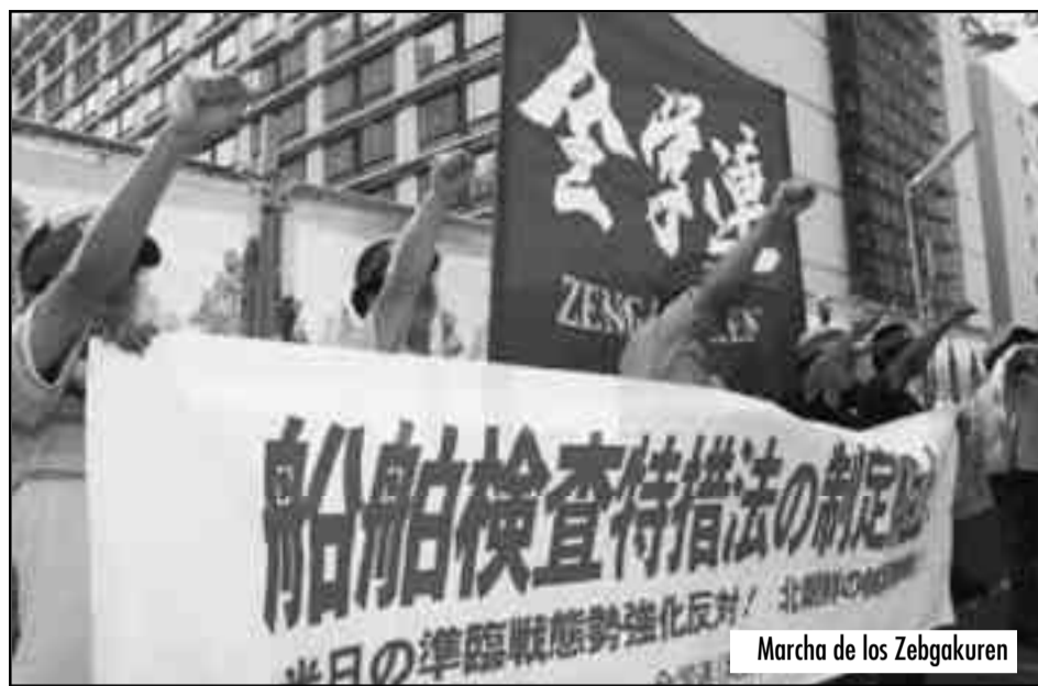
Marcha de los Zebgakuren

El proletariado japonés tiene una responsabilidad histórica con sus hermanos de clase de China, Corea y de Asia y el Pacífico. Ustedes, camaradas, son parte de la clase obrera en el Japón de los asesinos imperialistas, una clase obrera que vivió las grandes gestas históricas del proletariado asiático en Corea, China y en la derrota yanqui de Vietnam. Pero tam-