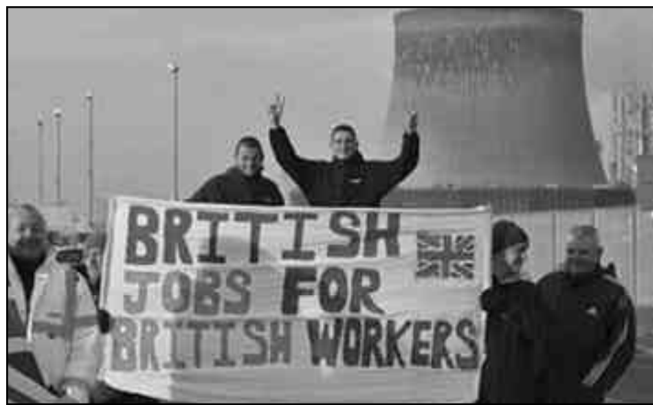
Los sindicatos y la aristocracia obrera en Inglaterra, contra los inmigrantes.