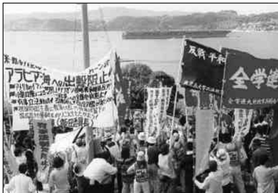
Manifestación contra la guerra en Irak, enfrentando el envío de tropas de parte de la burguesía japonesa.

Es nuestra segunda propuesta entonces que la dirección de la JRCL pueda intervenir en todas las discusiones internas de nuestra corriente hacia el próximo congreso en nuestro boletín interno de discusión.