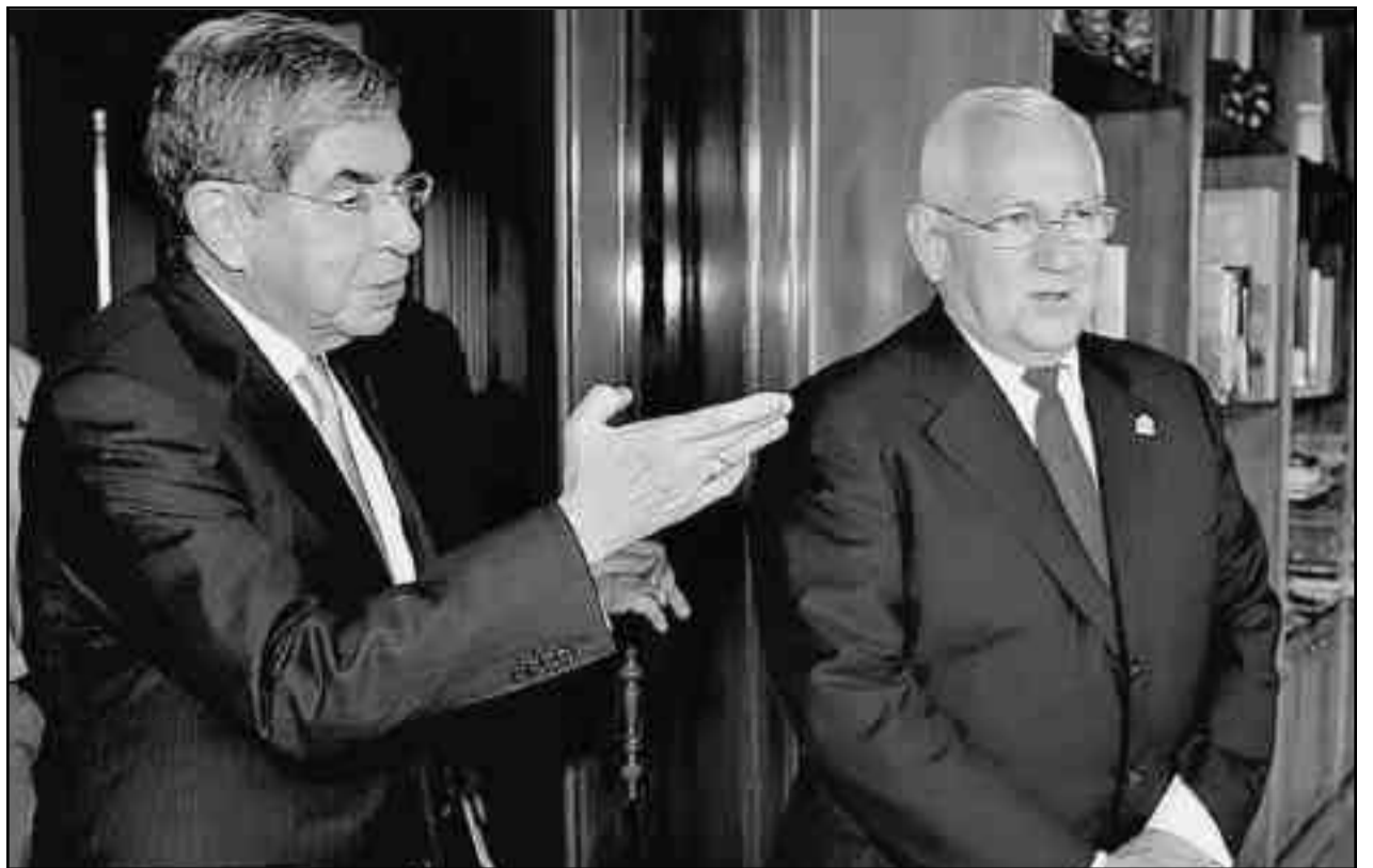
Arias y el "golpista" Micheletti en la reunión en Costa Rica.

Además, Honduras importa el 100% de petróleo que consume. Y como si esto fuera poco, en 2008, Honduras fue azotada por el huracán Mitch, que dejó 34 muertos, varios heridos, a 70.000 trabajadores y campesinos pobres sin casa, y destrozos por el valor de 154 millones de dólares. Pero encima, impidió la siembra del frijol y en gran parte, de maíz.