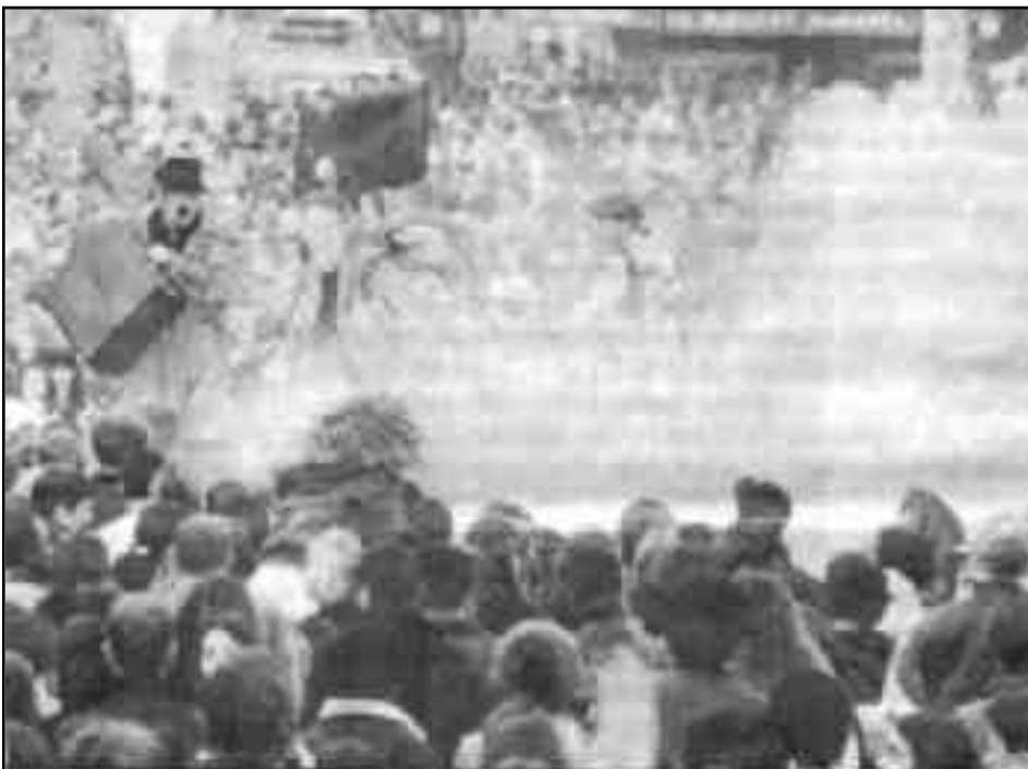
Paris y la revuelta de los sin papeles.

En los ‘70 había una película italiana del director Vittorio de Sica, llamada “Ladrón de bicicletas”. En una escena de la misma el ladrón de la bicicleta gritaba “al ladrón!...” señalando