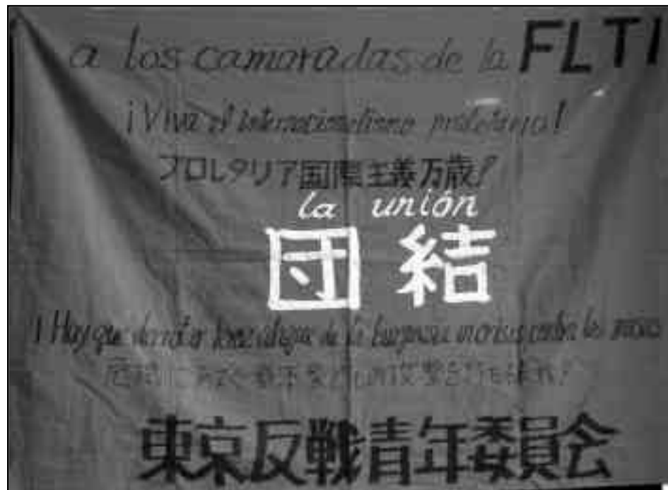
Bandera obsequiada por la juventud Zengakuren en la 47ª Asamblea contra la guerra a la FLTI. La inscripción dice "A los camaradas de la FLTI. ¡viva el internacionalismo proletario! ¡Hay que derrotar el feroz ataque de la burguesía contra las masas!"

Antes de comenzar el acto, preparamos la traducción de mis palabras, acordando que directamente leyera en inglés todas las propuestas donde a cada párrafo en inglés se traducía al japonés con K. en el estrado a mi lado, y que en la introducción hablada de mi discurso, él tomaba nota y se apoyaba en sentencias de la carta que yo usé y le marqué en el texto. Me pidieron que en alguna parte del discurso hablara en español, para que mi voz y el espíritu revolucio-