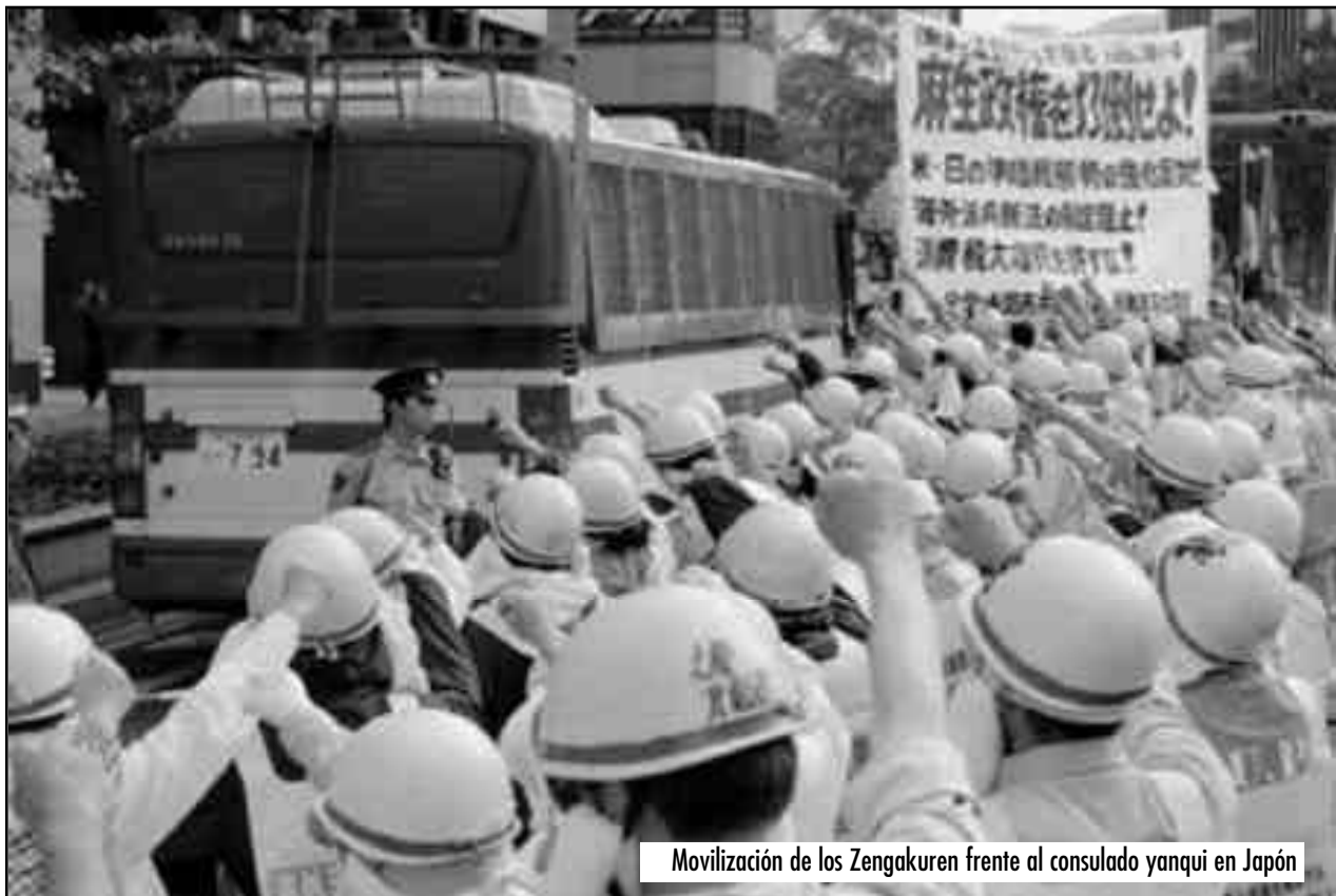
Movilización de los Zengakuren frente al consulado yanqui en Japón

4) Camaradas, en este aniversario de las bombas de Hiroshima y Nagasaki, comprometámonos, por nuestro honor de obreros revolucionarios, a decirle a la clase obrera mundial que lo que abrió el camino a dos guerras interimperialistas mundiales fue la traición de la socialdemocracia primero y luego, la del stalinismo a mediados del siglo XX, entregando las revoluciones alemana, española y francesa de los ‘30, y lo más importante, usurpando la heroica revolución