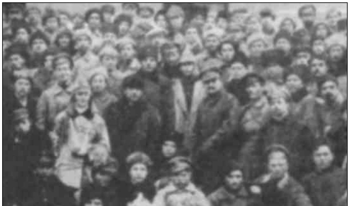
Lenin y Trotsky juntos a los bolcheviques.

NÚCLEO REVOLUCIONARIO INTERNACIONALISTA (NRI), ARGENTINA