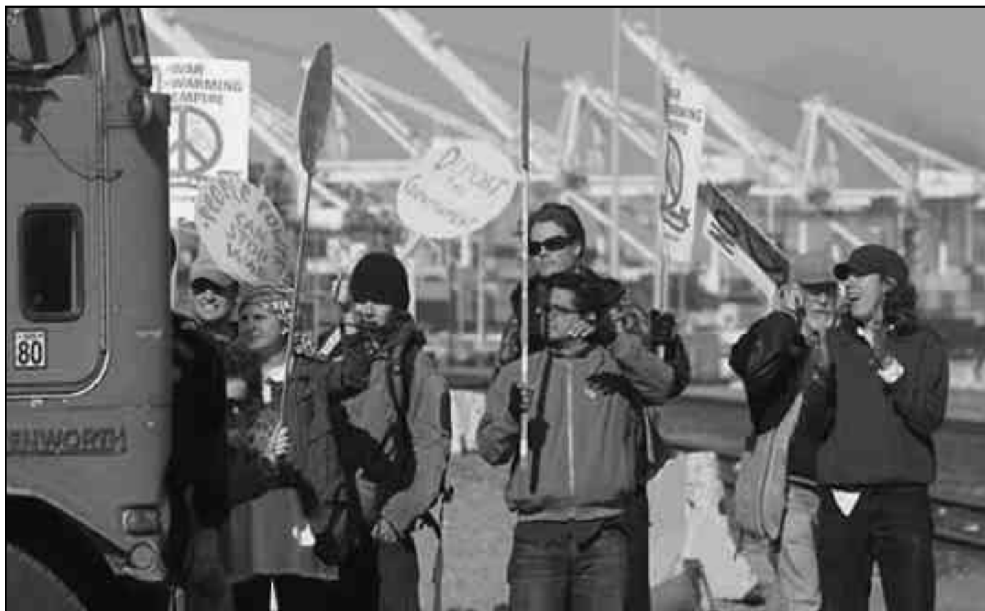
Piquete obrero en los puertos de Oakland, EE.UU., contra la guerra.

* Predator drones: “zánganos depredadores” en castellano, son aviones de la fuerza aérea norteamericana que se manejan a control remoto (sin piloto humano) que se utilizaron en el bombardeo a Waziristan.