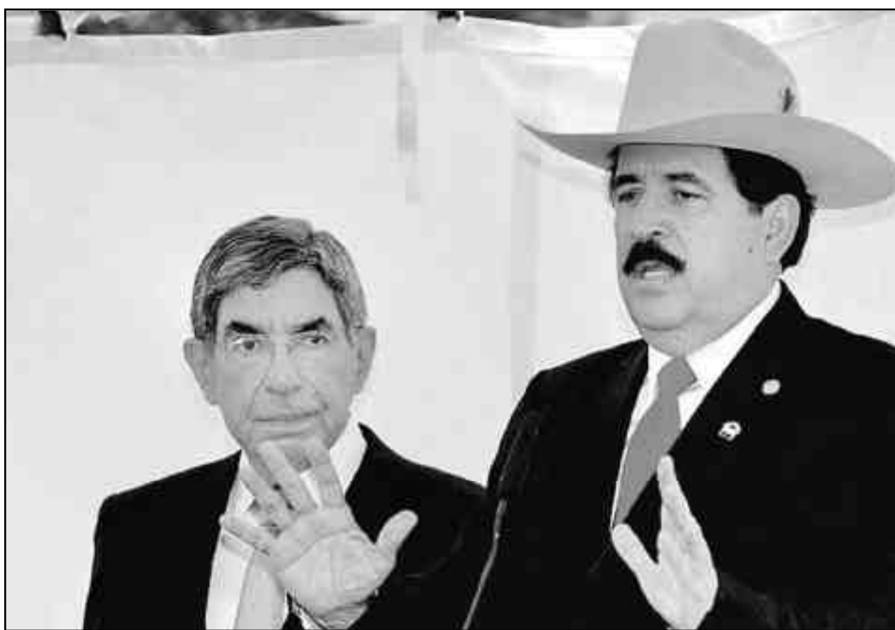
Zelaya y Arias, a espaldas de las masas, conspiran un acuerdo para restituirlo en el gobierno.

12) Los revolucionarios internacionalistas tenemos que decir con claridad que la clase obrera y los explotados no podemos ser neutrales en este enfrentamiento de dos campos burgueses. Tenemos que plantear que si bien la democracia