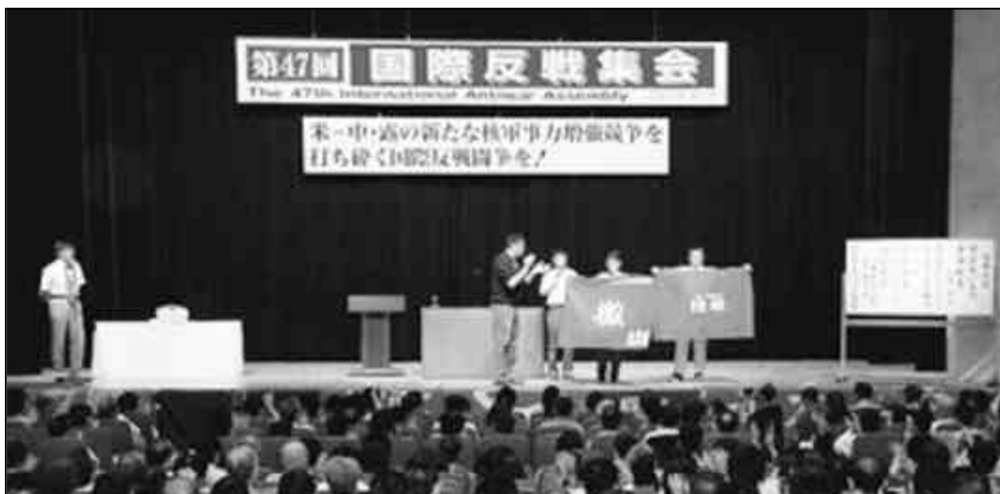
Los Zengakuren entregan los estandartes al camarada de la FLTI, en la sesión de la 47ª Asamblea contra la guerra.

Denunció que también en la campaña de organización de las trabajadoras, usaba el argumento contra el Zengoren de guerrillista, ya que llama a recuperar las islas Buriles, y aprovecha por esa vía para hacer propaganda anti comunista. Ella en su frente con su rama era organizadora de los militantes antiguerra de Okinawa (donde la JCRL dirige el movimiento antiguerra antiimperialista) y con toda esa política esperaba seguir atrayendo grupos a la organización. Luego dijo textuales palabras: “después de haber escuchado al camarada de la FLTI, voy a volver a mi sindicato y de - cirle a los trabajadores que hay que ex -