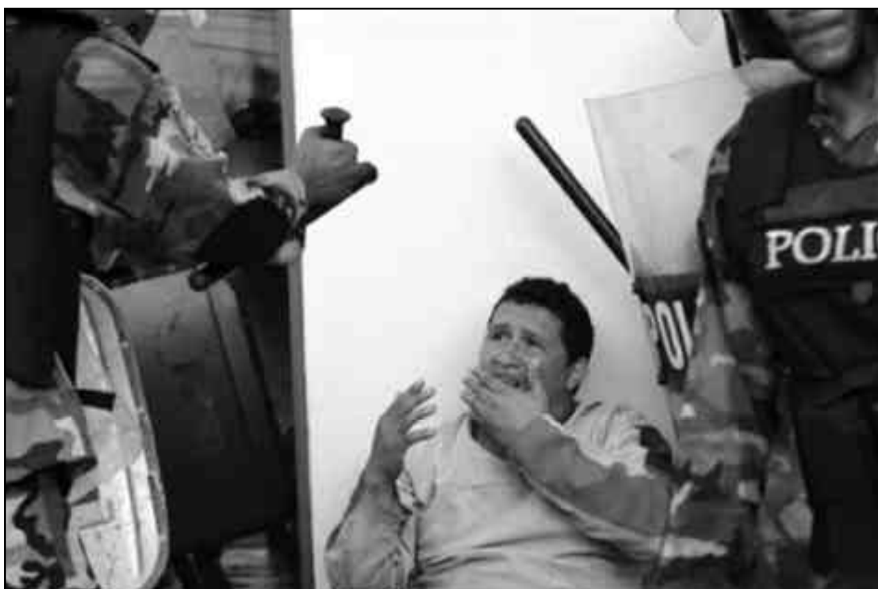
Represión y enfrentamientos contra las tropas golpista en Tegucigalpa, de las masas ecuatorianas.

3) Podríamos decir entonces, para utilizar tan sólo una analogía, que EEUU quiere volver a recuperar plenamente su patio trasero usando la política de "New Deal", es decir de Buen Vecino, retirando el rostro irritante y oprobioso de Bush y su política de TLC, buscando nuevos pactos y acuerdos con las burguesías nativas e inclusive con el imperialismo francés, español, etc. (con los cuales éstas