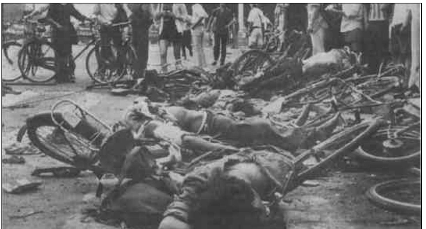
La masacre de Tiannamen en el '89, un paso decisivo en la contrarrevolución en china.

9. Con las Inversiones Directas Externas (IDE) excediendo las IDE entrantes por primera vez en 2008 y con la aceleración de esta tendencia en 2009, un umbral cuantitativo se ha cruzado y China está emergiendo en el escenario mundial como un gángster imperialista con derecho propio, a pesar de encontrarse al final de la jerarquía de las potencias imperialistas, junto con otros países imperialistas más pequeños (particularmente los Escandinavos) con cantidades y balances de IDE entrantes y salientes similares a las de China.