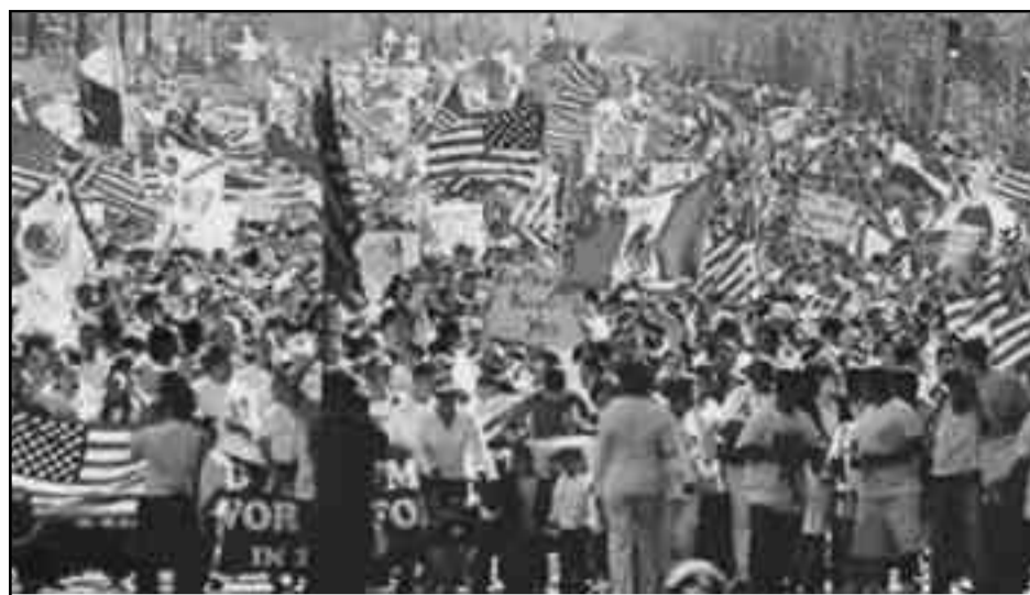
Marcha de inmigrantes dentro de EE.UU.

Los socialistas no tienen deseos de ver al reaccionario Talibán tomar el poder ni sometiendo a la población a una teocracia represora. Pero mucho menos permitir la asomada imperialista mil veces más reccionaria. En la época de decadencia del capitalismo, el imperialismo es reacción en toda la línea. La derrota de las fuerzas imperialistas y sus representantes paquistaníes, ayudaría a las luchas de los traba-