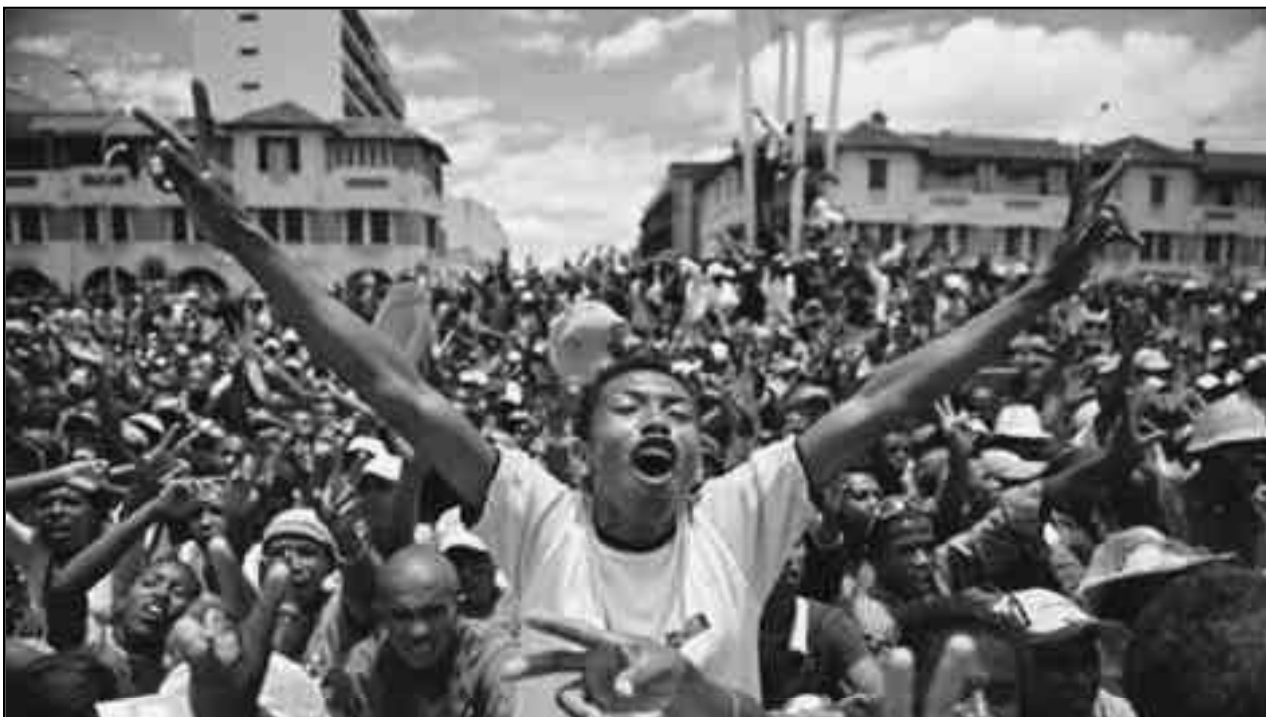
Las masas en lucha revolucionaria ganan las calles de Madagascar.