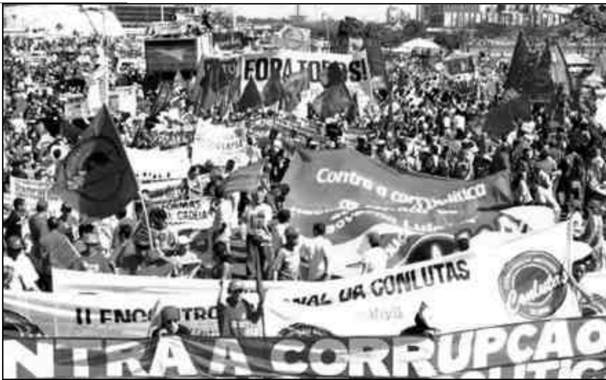
El PSTU, el PSOL, LER-QI, y LBI, se oponen con todas sus fuerzas a una perspectiva obrera y revolucionaria.

¡Expropiación sin pago de toda la banca, comenzando por el City Bank, el HSBC, el Itaú, el Santander, etc.! ¡Por una banca estatal única bajo el control de los trabajadores, para darles créditos baratos a los campesinos sin tierra, a la clase media arruinada, a los trabajadores, el pueblo pobre y condonarle las deudas! ¡Para reagrupar las filas obreras hay que levantar un nuevo programa que ataque la propiedad de los explotadores y unifique las demandas de todos los sectores de la clase obrera y los explotados! ¡Hay que ex-