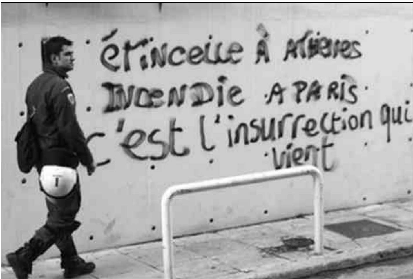
Chispa en Atenas, incendio en París es la insurrección que se viene. La juventud griega llama a la insurrección.

Quedó demostrado de qué lado de la trinchera se encuentra Philippe Couthon y sus amigos. Desde la juventud de la LOI-CI y toda la FLTI estamos combatiendo en la barricada de la juventud obrera francesa y hacemos nuestro su combate. Todas nuestras fuerzas están puestas en que todo el proletariado internacional siga su ejemplo y en transformar cada capital del mundo, en especial de los países imperialistas, en una nueva Bagdad. Por eso gritamos con ellos, aunque lloren los señores reformistas: ¡Hay que hacer todas las noches de París, Tokio, Berlín, Washington, Londres, Atenas, Madrid, Roma, una nueva Bagdad!