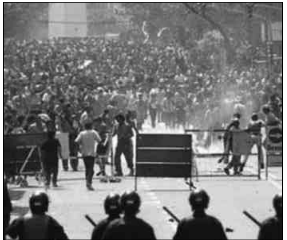
20 de diciembre de 2001, la revolución en Argentina.

Como parte inseparable de este combate, en Argentina el Núcleo Revolucionario Internacionalista (NRI) ha iniciado un proceso de fusión con la Liga Obrera Internacionalista-Democracia Obrera (LOI-CI) en base a los acuerdos internacionalistas conquistados en el Congreso Fundacional de la FLTI, que permiten un grado importante de homogeneidad política y configura una base para intervenir con un régimen leninista de