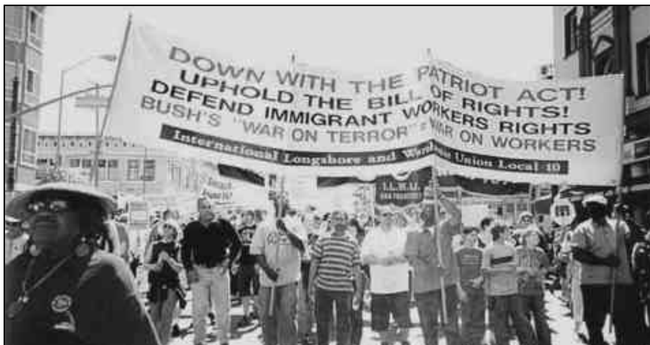
Obreros de Oakland EEUU, marchan por la defensa de los derechos de los trabajadores inmigrantes

Fundamos la FLTI con el mismo programa y mismo grito de Revolución Permanente, con el que se fundara la IV Internacional de 1938, en contra del frente popular y los frentes democráticos del stalinismo, cuando ahora son los renegados del