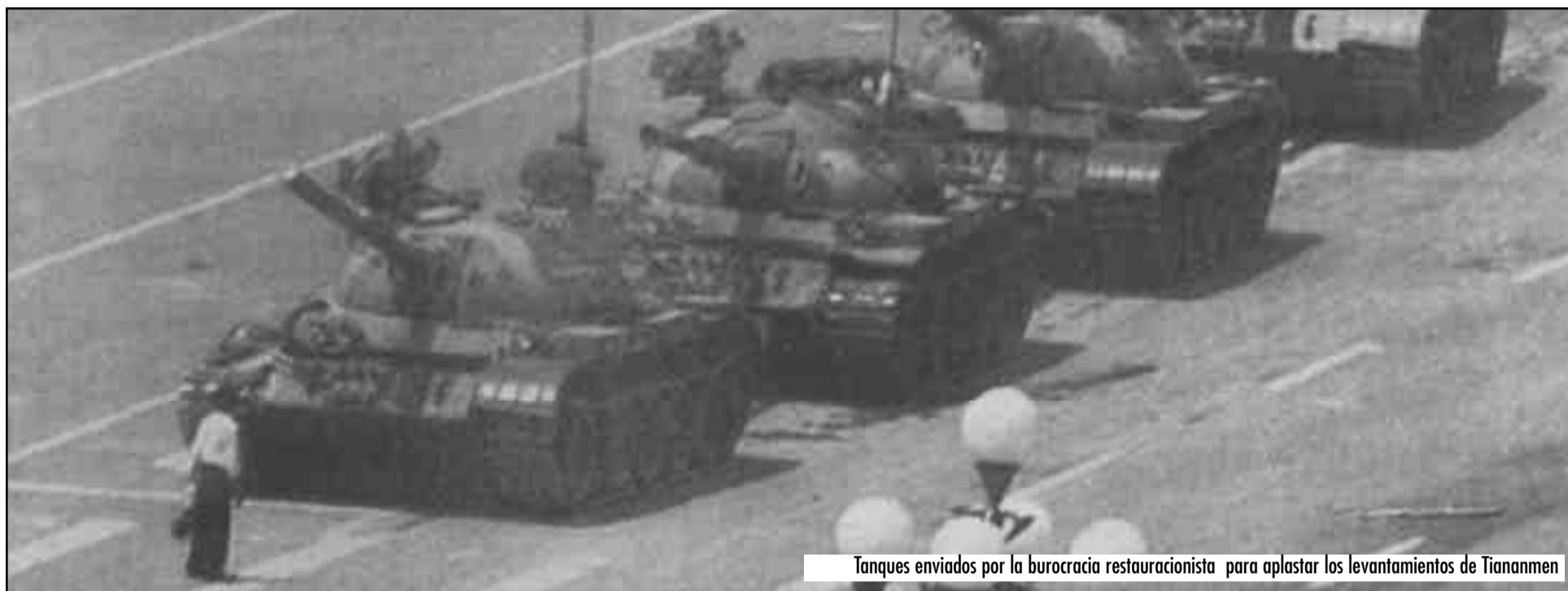
Tanques enviados por la burocracia restauracionista para aplastar los levantamientos de Tiananmen