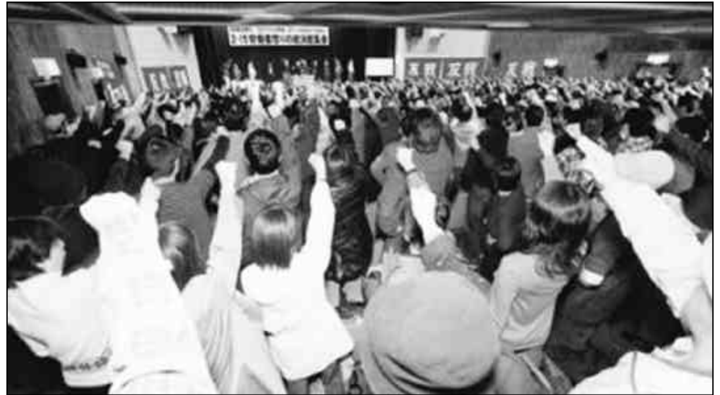
Asamblea obrera en febrero de 2009

Sobre el CPJ, explicó que la posición oficial del estalinismo era apoyar las medidas progresivas del nuevo gobierno y ser su oposición positiva, mientras en todos los sectores de trabajadores estaba a la cabeza de sembrar las ilusiones en el