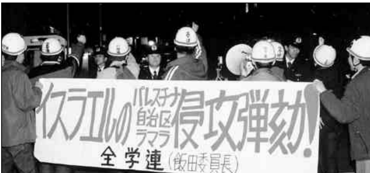
Protesta en Japón contra la masacre del ejército sionista en Gaza.

¡Para poner en pie el partido mundial de la revolución socialista!