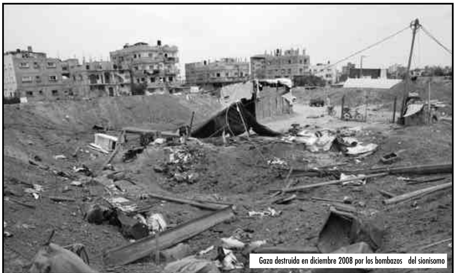
Gaza destruida en diciembre 2008 por los bombarzos del sionismo

PRESENTAMOS UNA DECLARACIÓN PUBLICADA POR LOS CAMARADAS DEL HRS - JUNIO DE 2009