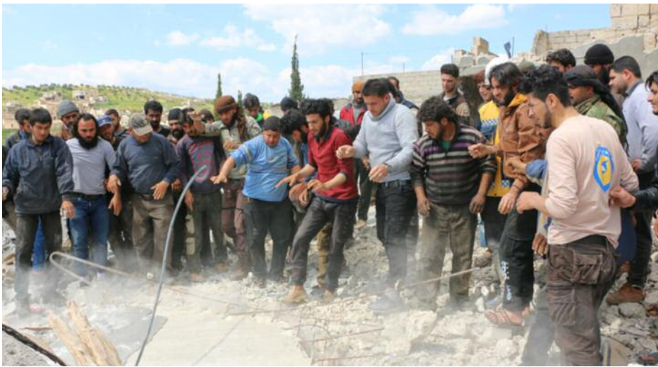
El pueblo de Idlib busca rescatar sobrevivientes bajo los escombros

Las fuerzas turcas exigieron la necesidad de trabajar para el regreso a esa región de los desplazados de sus pueblos. A pesar de las marchas en el sur y el este de la provincia de Idlib, Turquía exigió la finalización de la instalación de esos puestos de avanzada para trabajar para detener los bombardeos aéreos del régimen y de Rusia en las zonas liberadas.