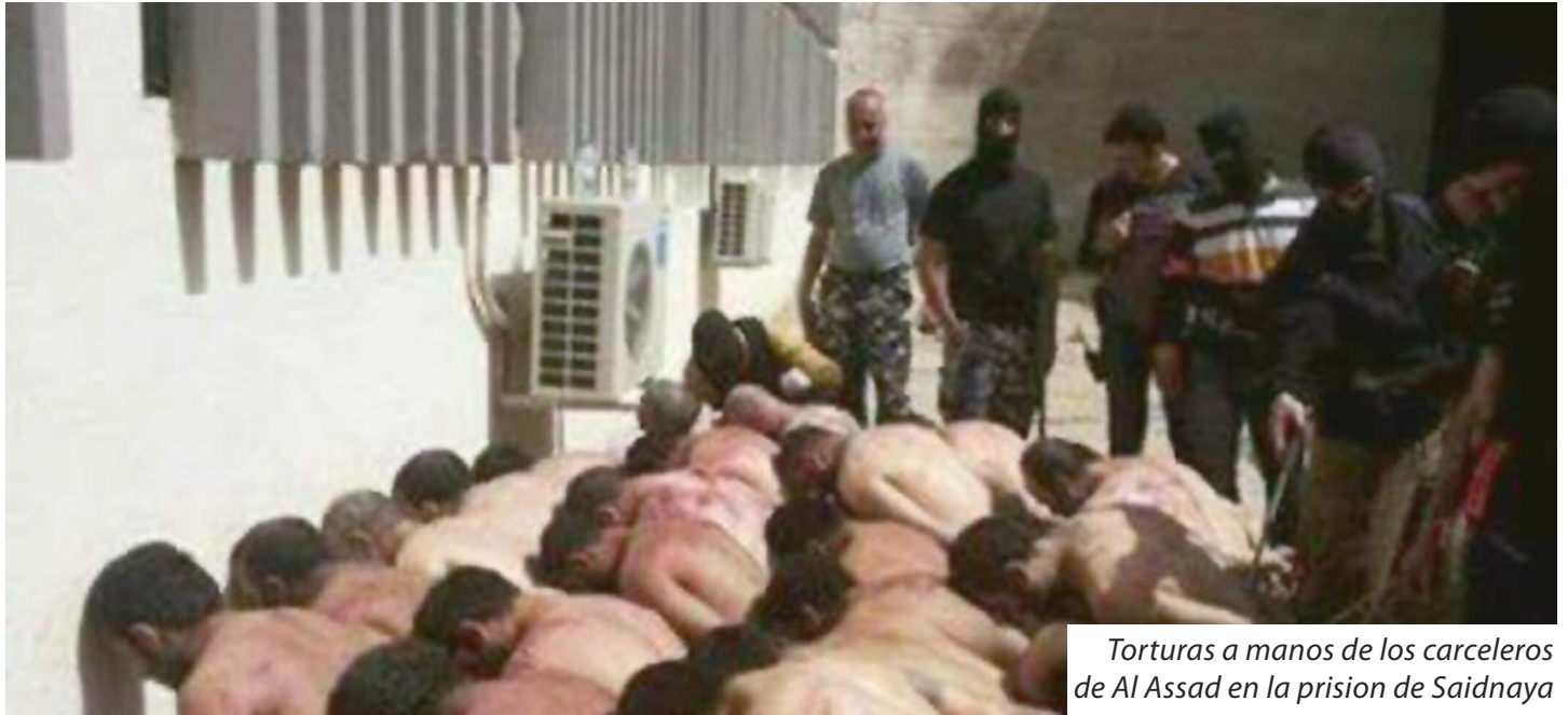
Torturas a manos de los carceleros de Al Assad en la prision de Saidnaya

Este lugar es espantoso, aterrador, conocido como el matadero humano y un lugar donde “el interior falta y el exterior nace”, en el que están ausentes todos los derechos de los seres humanos y hasta las criaturas más bajas están mejor que ellos. Es el lugar donde el régimen assadista practica los tipos más horribles y odiosos de violación a la misma Siria y a la dignidad del pueblo sirio, de todas las formas y categorías. Es el lugar donde la seguridad del régimen vacía y descarga su obsesión, lejos de los medios de prensa, cubriendo con las mentiras que usa el régimen. En ese lugar es donde uno sabe que Siria durante 40 años no ha sido gobernada por un régimen o un estado, sino por una pandilla sectaria.