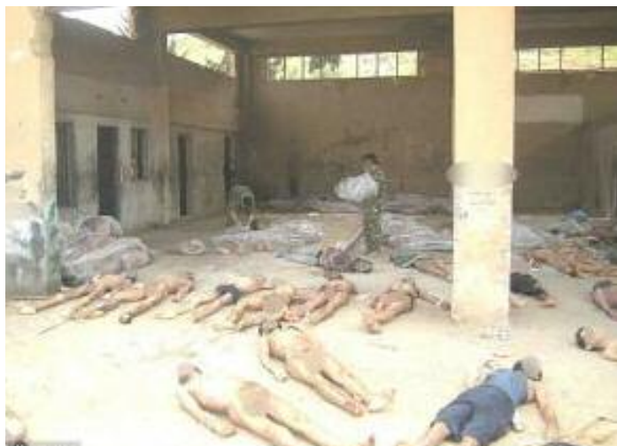
Presos asesinados en las cárceles de Al Assad