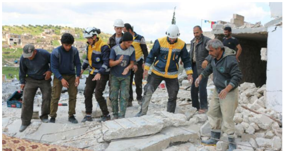
Tras los bombardeos de Rusia y Assad, el pueblo sale al rescate de sobrevivientes en Idlib

La gente le está diciendo a las facciones que dejen de luchar y abran las verdaderas batallas contra las fuerzas del régimen.