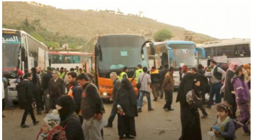
Los habitantes de Ghouta son desplazados a Idlib

Inmediatamente algunos de los rebeldes de Ghouta se unieron a los puntos de guar-