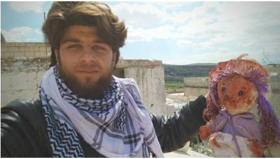
Corresponsal muestra como símbolo de la masacre la muñeca ensangrentada de las niñas masacradas