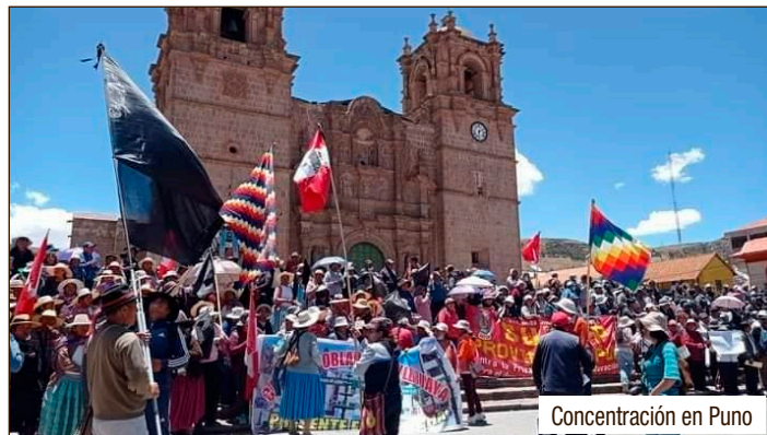
Concentración en Puno

Para hacer esto realidad, desde las bases de todas las organizaciones obreras y populares, siguiendo el ejemplo de autoorganización de nuestros hermanos de clase del sur, ¡pongamos en pie en Lima y en todo Perú los Comités de Coordinación obreros y campesinos, así como marcan el camino las regiones del Sur!