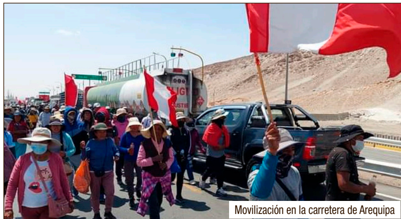
Movilización en la carretera de Arequipa

En esa Coordinadora Macro-regional se ha restablecido la alianza obrera y campesina. Allí, a pesar y en contra de las direcciones stalinistas traidoras, se organizaron los explotados y desde el 4 de enero llamaron al paro na-