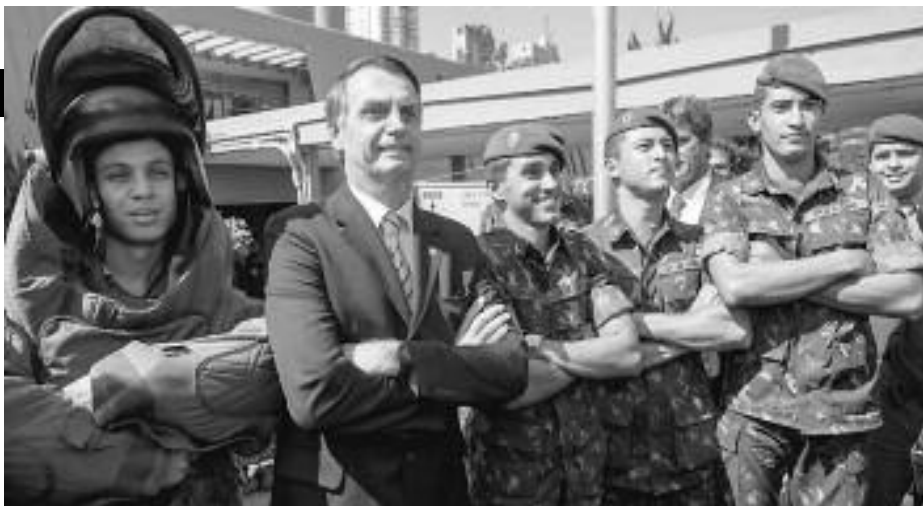
Jair Bolsonaro junto a los milicos asesinos