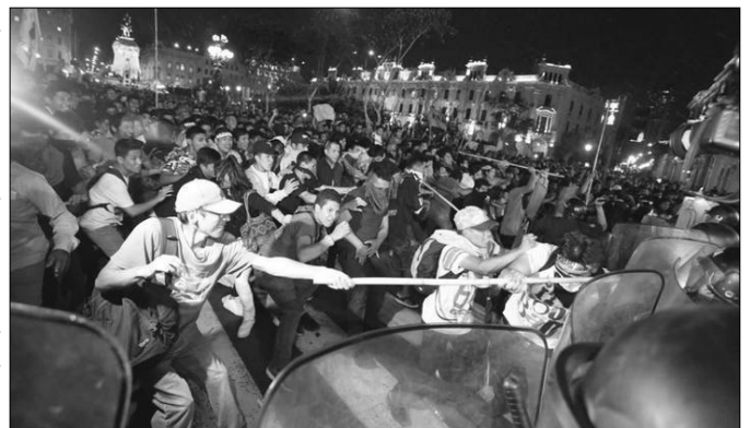
Estudiantes técnico en lucha contra la ley de “esclavitud juvenil”

Como parte de esta trampa, es que el próximo 7/10 se realizarán las elecciones municipales en todas las alcaldías del país.