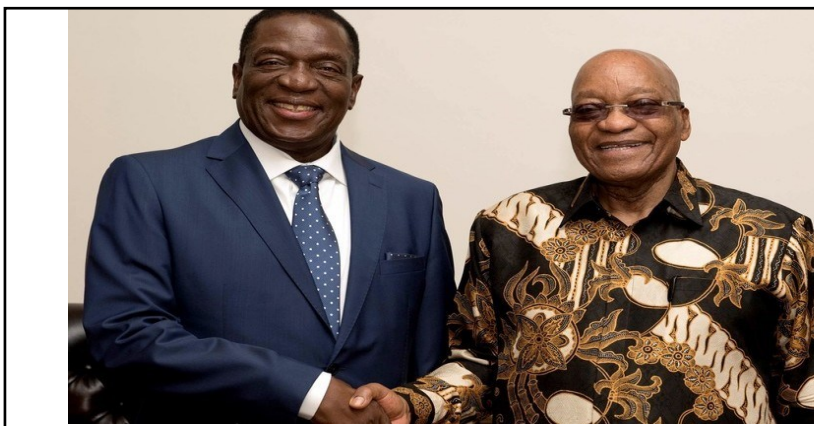
Emmerson Mnangagwa (izq.) junto a Jacob Zuma (presidente de Sudáfrica)

Luchamos por el triunfo del socialismo en Zimbabwe, todo África del Sur y a nivel internacional. En este mundo golpeado por la brutalidad del crac capitalista y la guerra de las pandillas imperialistas por las rique-