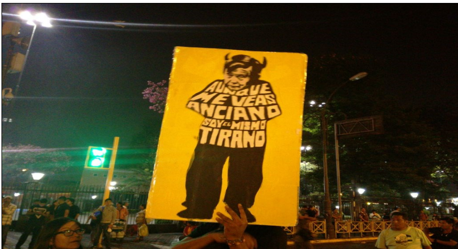
Marcha contra Fujimori