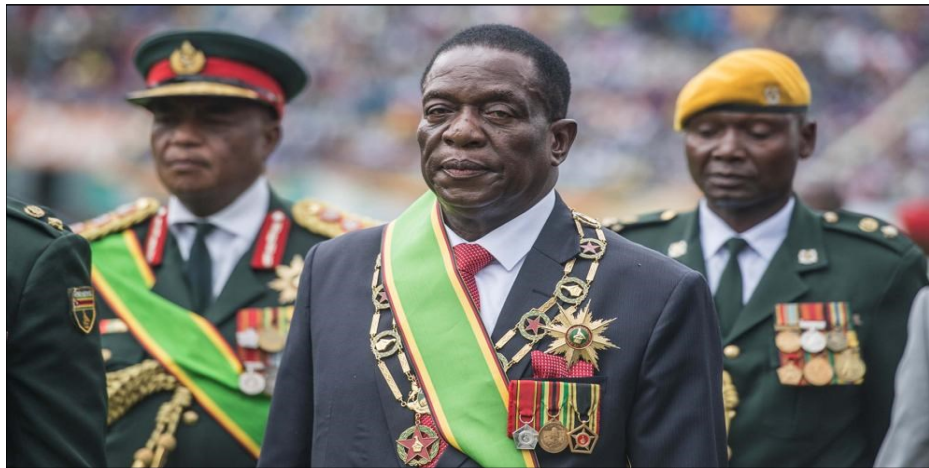
Mnangagwa y la casta de oficiales

te libre y soberana que sólo podrá ser democrática si la clase obrera y el pueblo movilizado y armado terminan con todas las fuerzas represivas del estado burgués.