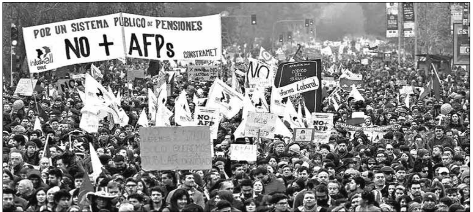
2016: movilización masiva contra la estafa de las AFP

Pero sabiendo esto, los dirigentes de la CCT igualmente aplicaron este método de financiamiento, propio de las burocracias sindicales, y de esta forma, una central que se dice “clasista” quedó sometida al estado burgués y sus leyes antiobreras.