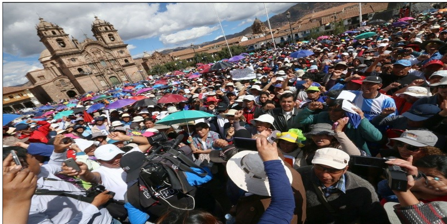
Maestros en la Huelga Nacional Indefinida de 2017

Es una rara "independencia política de clase" la de Fernández Chacón y la UIT-CI que abrazaron y defendieron todo el programa burgués del Frente Amplio de "democratizar la democracia". Incluso plantearon como lema de su campaña en Lima la farsa de "con el voto también se lucha"... ¡como si con una papeleta electoral la clase obrera pudiera hacer huelga, piquetes, comités de autodefensa, milicia obrera y pelear contra los capitalistas y su gobierno! Un verdadero chiste de mal gusto para en realidad impedir el combate de los trabajadores contra sus verdugos en las calles y con sus métodos de lucha, atacando la propiedad de los capitalistas, etc. En realidad, el lema de campaña de Fernández Chacón no es más que una estafa para