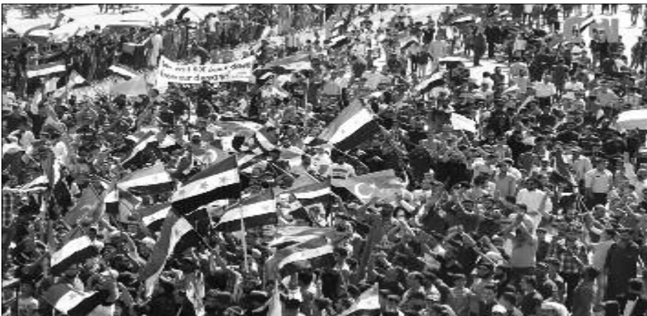
"No retrocedemos de nuestra demanda: Libertad a todos los presos"