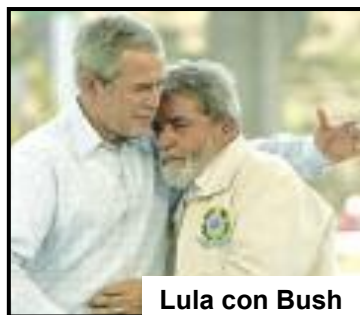
Lula con Bush