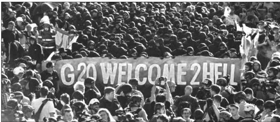
La lucha de la juventud rebelde en Hamburgo en 2017: “G20 bienvenido al infierno”

4) Para ello, desde todas las organizaciones que son parte de la CCT deben convocar a un Congreso Obrero Nacional de delegados de base votados en las asambleas de todos estos sindicatos y del conjunto del movimiento obrero, junto a delegados del movimiento estudiantil y los campesinos pobres para votar un plan de lucha común con un pliego único de reclamos contra el gobierno de Piñera, el régimen y las transnacionales imperialistas, para derrotar en las calles a la burocracia de la CUT, forjar la alianza obrera y campesina y así reabrir el camino del 2011, con la Huelga General Revolucionaria. Un Plan de Lucha que comience por retomar la lucha por la “renacionalización sin pago y bajo control obrero del cobre” para que haya “educación primero para el hijo del obrero y después para el hijo del burgués” .