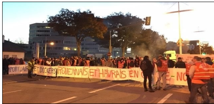
Manifestación de portuarios en Ruen

de la educación pública y gratuita para todos!