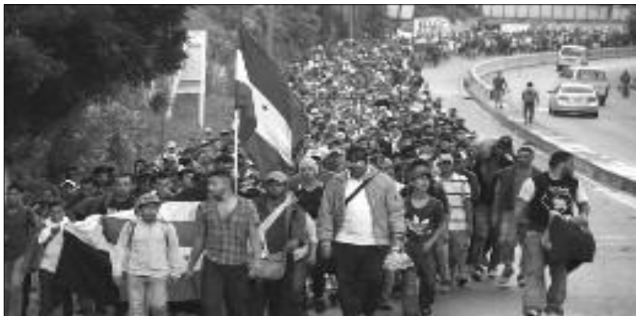
Caravana migrante de centroamericanos hacia EE.UU.

En dicha cumbre estarán Cristina Kirchner, Dilma Rousseff, "Pepe" Mu-