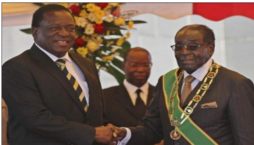
Mangagwa y Mugabe

Todo aquel que dice luchar por las libertades democráticas, por elecciones