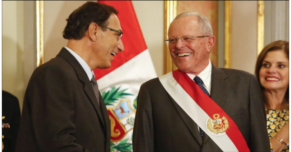
Martín Vizcarra (izquierda) y el ex-presidente Kuczynski

A su vez América Latina, desde Perú, Chile, Colombia, etc. es parte de las rutas del Pacífico del comercio mundial, mientras que desde Brasil y Argentina el imperialismo yanqui controla las rutas del Atlántico sur.