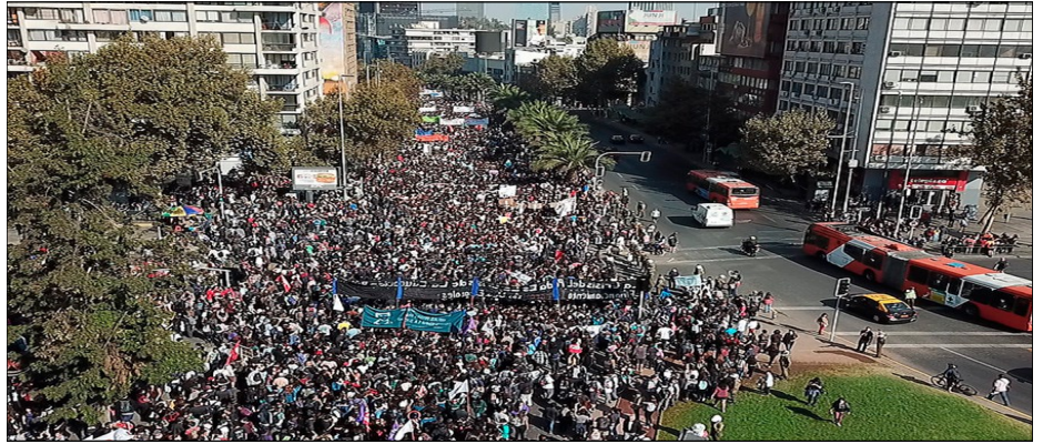
Estudiantes en lucha por la educación gratuita

¡Independencia total e incondicional de los sindicatos respecto del Estado burgués! ¡Fuera las manos del Ministerio del Trabajo de las organizaciones obreras! ¡Abajo las conciliaciones, los arbitrajes obligatorios y toda legislación que permita la injerencia patronal! ¡Abajo el Código del Trabajo pinochetista y las reformas labora-