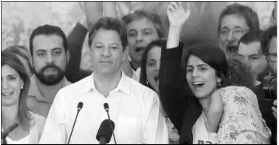
28/10: Haddad junto a su candidata a vicepresidenta, Manuela D'ávila, y Boulos del PSOL

hacen matando a los tiros y de hambre al pueblo... y sin tocar un solo peso del imperialismo... Es más, ¡entregaron Cuba a los yanquis! Y con sumisión y cobardía, Brasil a Bolsonaro y Trump.