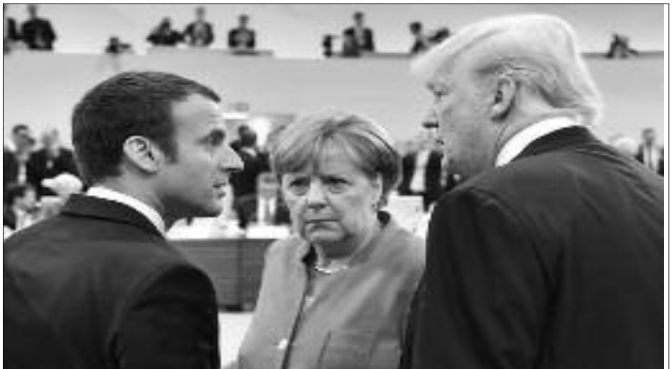
Macron, Merkel y Trump

El imperialismo ha convertido al planeta en una sucia prisión. En nombre de la "civilización" imponen la barbarie, llevando a la humanidad al borde del abismo con una guerra comercial en la que se están disputando las