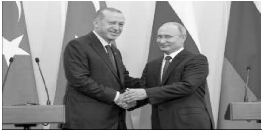
Erdogan y Putin

Para ellos, el único problema que existe en Idlib son los "grupos radicales islamistas" como "Tahrir-al-Sham, que está compuesta por el Frente al-Nusra y con conexiones con Al Qaeda" y "el Frente de Liberación Sirio, la coalición de varios grupos salafistas", los cuales "hacen un esfuerzo sistemático por destruir los comités locales". Pero los verdaderos comités de coordinación que funcionaban con democracia directa ya fueron destruidos tanto por los generales de estos partidos-ejército que ellos denuncian como -y principalmente- por los generales del ESL. Las pocas instituciones que quedan bajo el nombre de "comités loca-