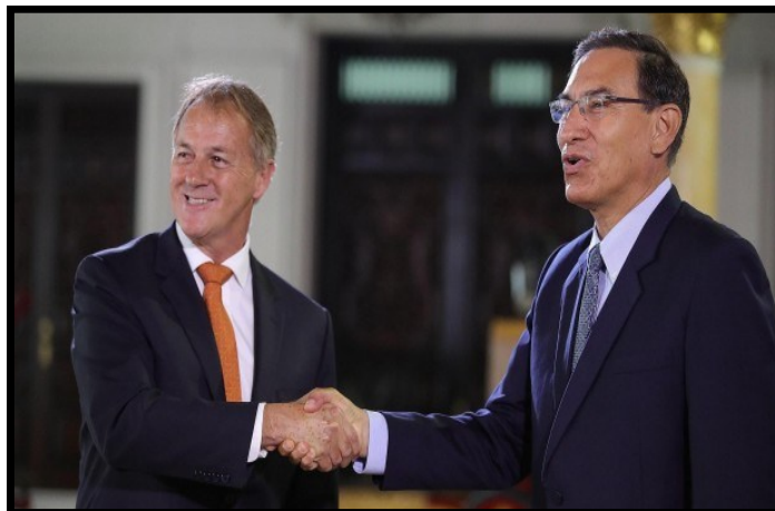
Muñoz, electo alcalde de Lima, en una reunión junto al presidente Vizcarra luego de las elecciones