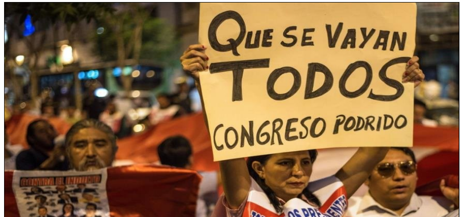
Marzo 2018: las masas ganan las calles contra el régimen fujimorista

mantiene el profundo odio de la clase obrera y los explotados contra el régimen fujimorista y todas sus instituciones antiobreras. Ya el año pasado y en marzo de este año, las masas oprimidas ya habían amenazado con hacer saltar por los aires este régimen tutelado por las bases y los marines yanquis, al grito de "Que se vayan todos, que no quede ni uno solo" y "Cierren el congreso", cuando tuvo que renunciar Kuczynski a la presidencia. Lo mismo sucedió tiempo después cuando salían a las calles los explotados contra el gasolinazo que imponía Vizcarra, quien hoy profundiza su ataque liquidando los convenios colectivos de los trabajadores estatales.