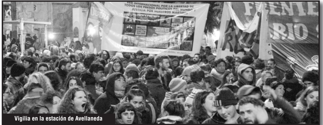
Vigilia en la estación de Avellaneda