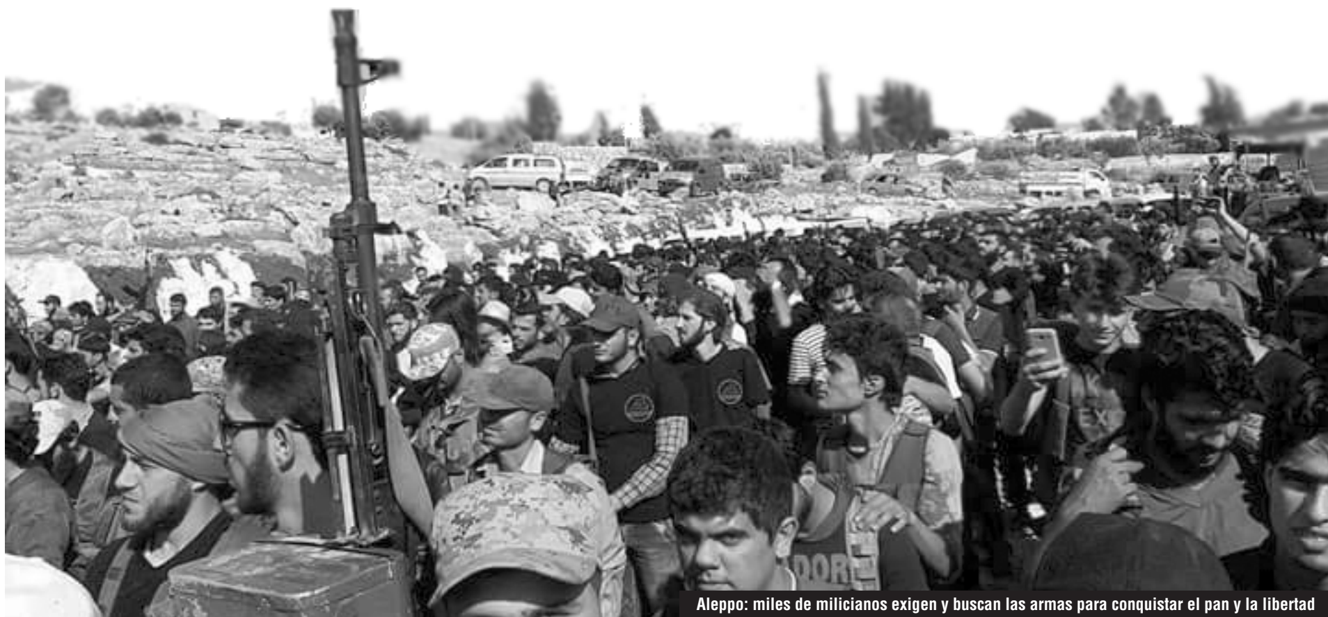
Aleppo: miles de milicianos exigen y buscan las armas para conquistar el pan y la libertad

Para llegar a Damasco, para terminar con el genocidio de Al Assad y con el saqueo imperialista, los trabajadores deben tomar la dirección de la guerra civil