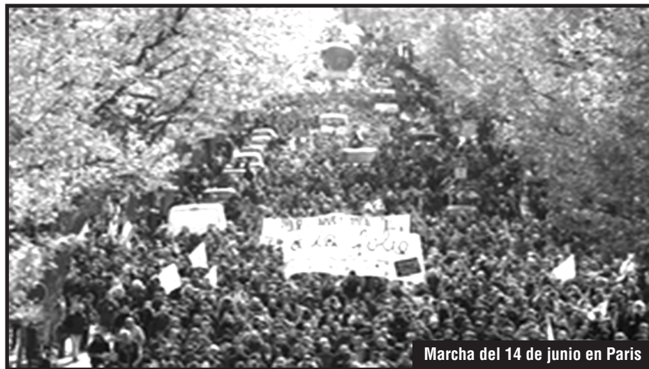
Marcha del 14 de junio en París

Después de una enorme acción de masas de los comités de acción y los