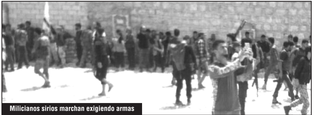
Milicianos sirios marchan exigiendo armas

¡Paso a los comités de coordinación de obreros, refugiados y soldados rebeldes!