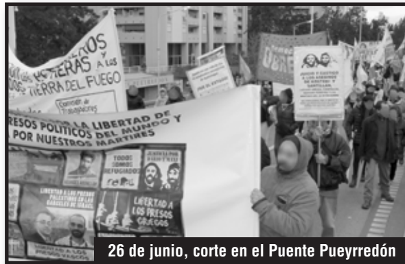
26 de junio, corte en el Puente Pueyrredón