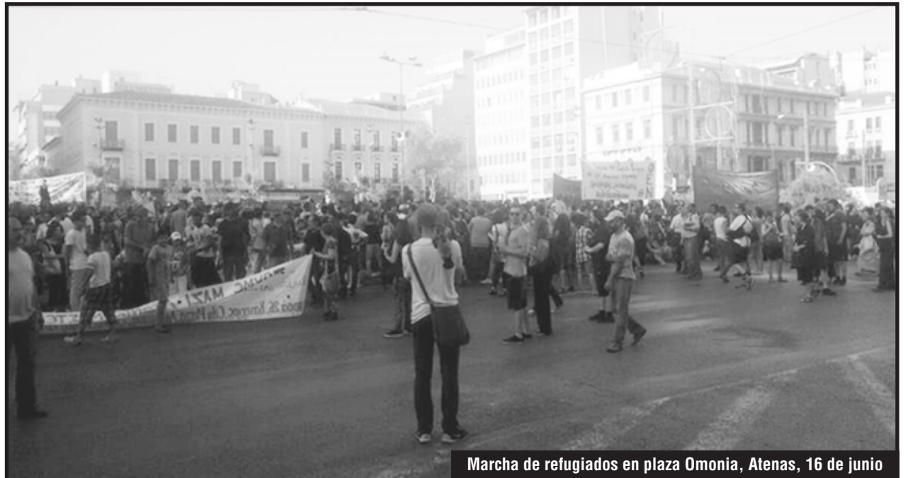
Marcha de refugiados en plaza Omonia, Atenas, 16 de junio

Fue una jornada de lucha, donde los refugiados empezaron a abrir el camino, mostrando que quieren pelear por una vida digna, por un futuro, por abrir las fronteras, por llegar a Europa. Así fue la lucha que se llevó adelante en Idomeni, donde se organizaban día a día en asambleas y votaban las medidas de lucha para conseguir sus más sentidas demandas. En esta gran acción se demostró que lo que se necesita es hacer en Atenas lo que se hizo en Idomeni. Por una Asamblea General de todos los refugiados, que funcione en la capital donde los refugiados se puedan coordinar, porque solo siendo miles de refugiados auto-determinados y eligiendo en asamblea las medidas de lucha a se-