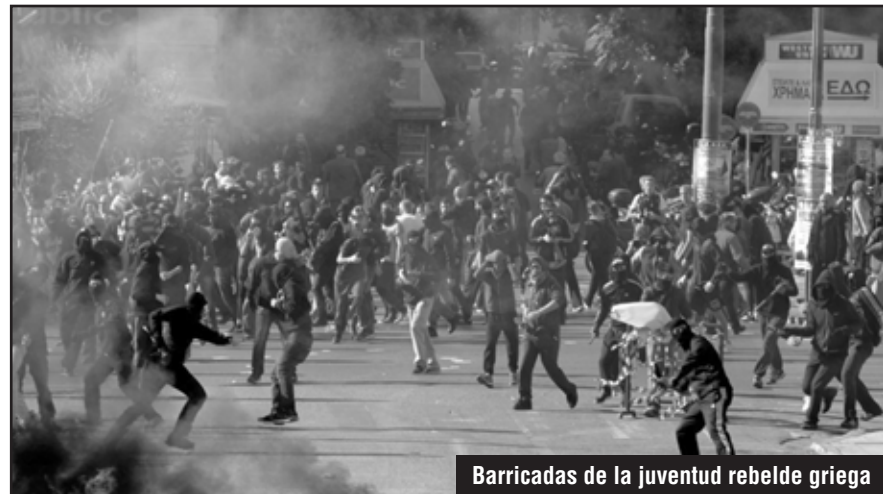
Barricadas de la juventud rebelde griega