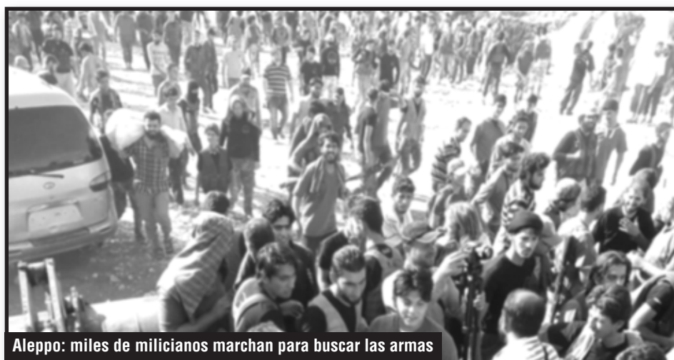
Aleppo: miles de milicianos marchan para buscar las armas

Pero la discusión de esa asamblea no terminó allí. También se discutió que hacer al separarse de estos generales, porque todos saben que ellos tienen el grueso del armamento y de las camionetas guardadas en sus depósitos un poco alejados de donde estaban, en el norte de Siria, a metros de la frontera con Turquía, y que no son es-