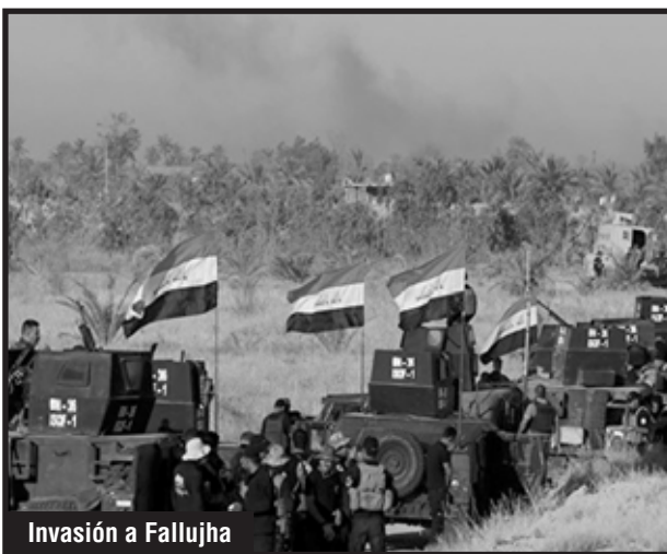
Invasión a Fallujha

Cercados por el ejército iraquí, aislados y separados del resto de las masas de ese país, los explotados en Fallujah resistieron heroicamente. Se alimentaban de los pocos animales que se encontraban por las calles o de hojas de los árboles. Tomaban el agua del río Éufrates directamente aún cuando ello significaba un alto riesgo de intoxicación. Combatieron valerosamente y causaron enormes bajas a las fuerzas contrarrevolucionarias que querían entrar. Se negaban a irse y a rendirse, porque sabían que la vida bajo la bota del gobierno del protectorado yanqui y sus fuerzas armadas gurkas