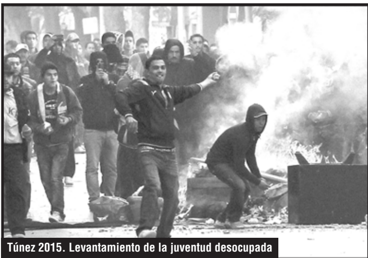
Túnez 2015. Levantamiento de la juventud desocupada

¡Abajo la conferencia de Ginebra! ¡Allí no está la resistencia, allí van los que la entregan!