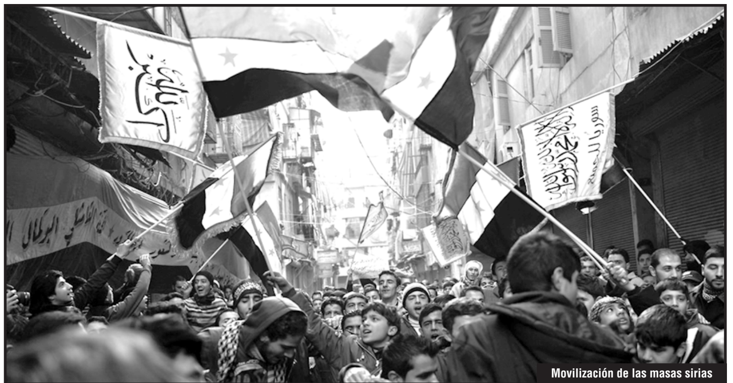
Movilización de las masas sirias

A LOS REFUGIADOS SE LES HAN RETIRADO LOS DOCUMENTOS. SE LOS HA COLOCADO EN CAMPOS MILITARES DE LOS QUE NO SE LES DEJA SALIR. ELLOS SON REFUGIADOS POLÍTICOS, QUE AHORA ESTÁN DETENIDOS Y PRESOS EN LAS CÁRCELES DE SYRIZA, COMO USTEDES. ELLOS