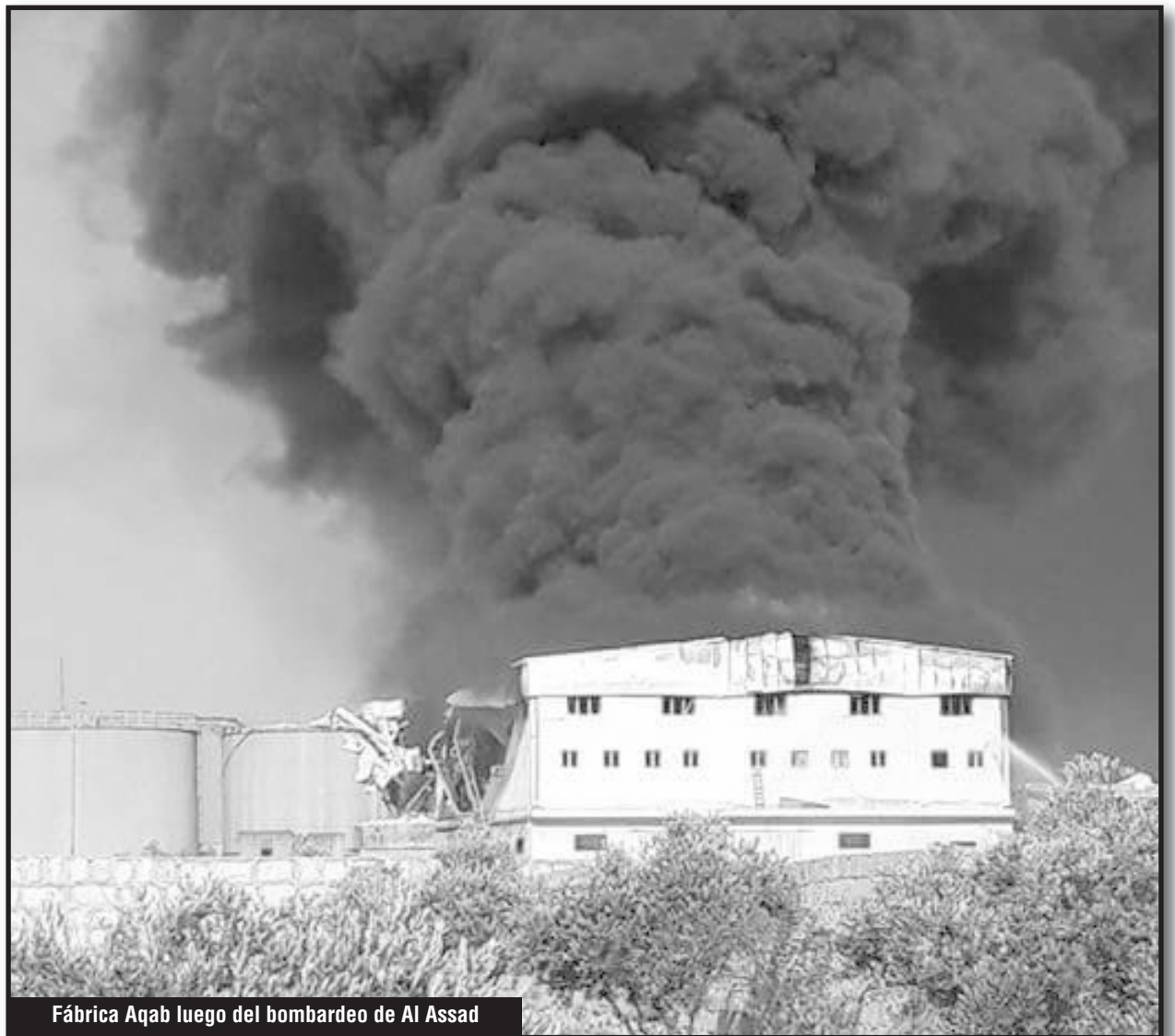
Fábrica Aqab luego del bombardeo de Al Assad

Inmediatamente después, los obreros se reunieron en asamblea y no decidieron ni aceptar las condiciones miserables de trabajo y el bajo salario, ni la amenaza del gerente, y vieron que necesitaban una solución, la cual estaba solo en sus propias manos.