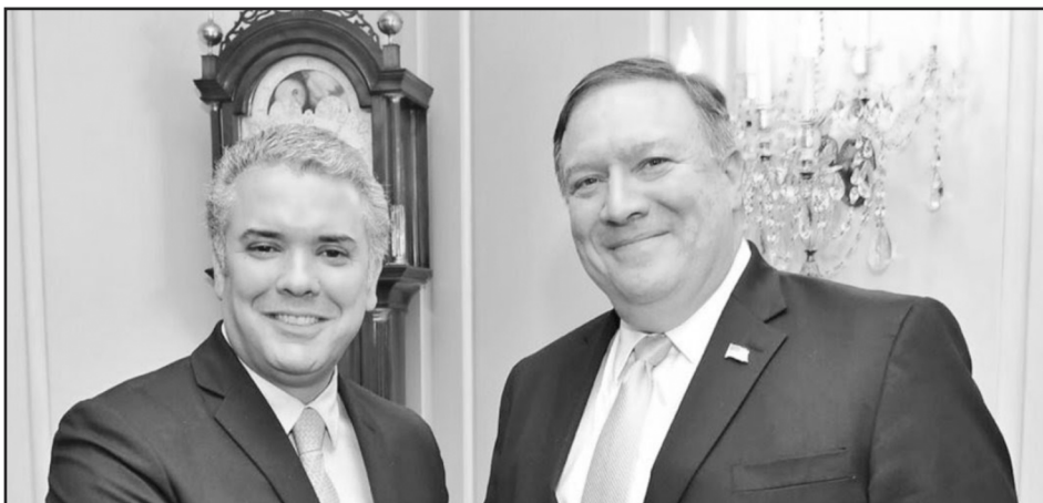
El presidente Ivan Duque y Mike Pompeo, Secretario de Estado norteamericano

Para abrir el camino a la victoria, las masas buscan desesperadamente sacarse de encima a las direcciones traidoras que tienen a su frente. Este es el rumbo que han comenzado a recorrer los obreros y campesinos de Colombia, en un enorme ejemplo para la clase obrera de todo el continente americano y a nivel mundial. ¡A las