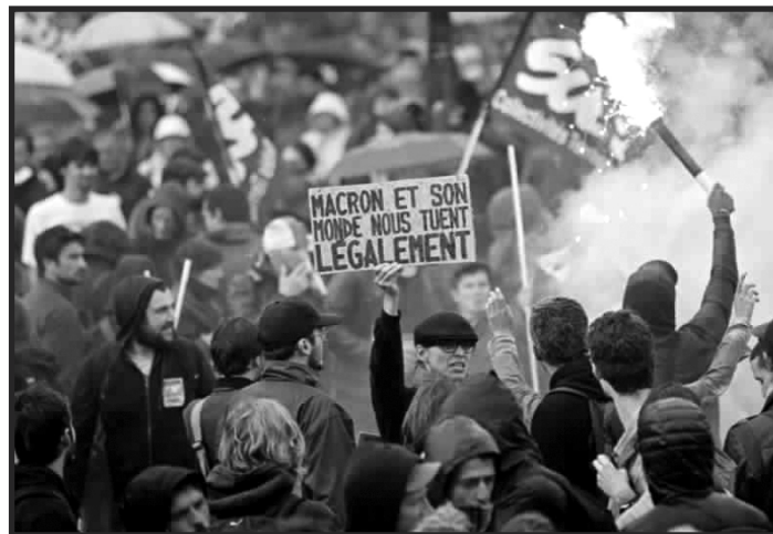
París, 5 de diciembre de 2019: jornada de paro y movilización

Son las masas las que garantizan las huelgas ya que en estas