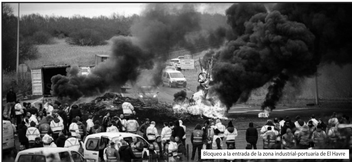
Bloqueo a la entrada de la zona industrial-portuaria de El Havre

¡Huelga General Revolucionaria hasta que caiga Macron!