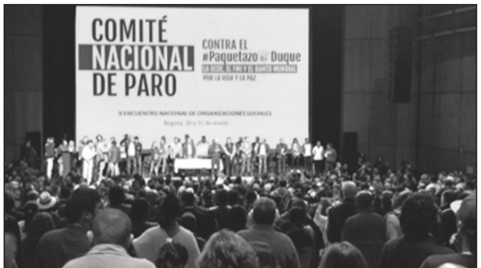
La base obrera le toma el palco del congreso a la burocracia

En este Encuentro Nacional, las cúpulas de las centrales obreras CGT, CTC, CUT y la Federación Colombiana de Educadores (FECODE), dirigidas por el estalinismo,