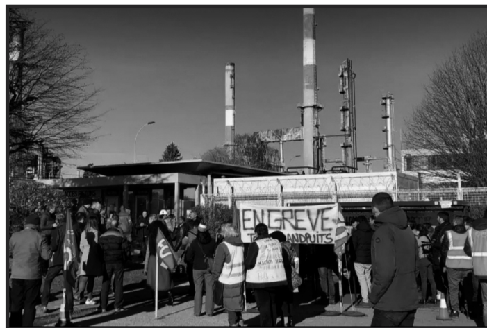
4 de enero 2020: piquete en la refinería de Grandpuits

La clase obrera europea luchó ferozmente en los últimos años contra el ataque imperialista en todo el continente, abriendo incluso