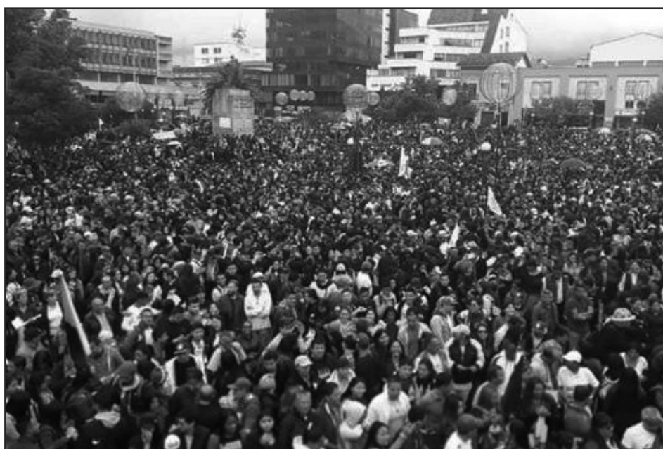
Movilización de miles en Colombia

entregadores de la dirección de las FARC dicen que nuestros problemas se resuelven votándolos a ellos en 2022. Eso no es así... Esa política es para sostener a este gobierno títere de los yanquis y asesino del pueblo y que se quede dos años más. Es una trampa para que abandonemos las calles. Pero ellos no nos representan.