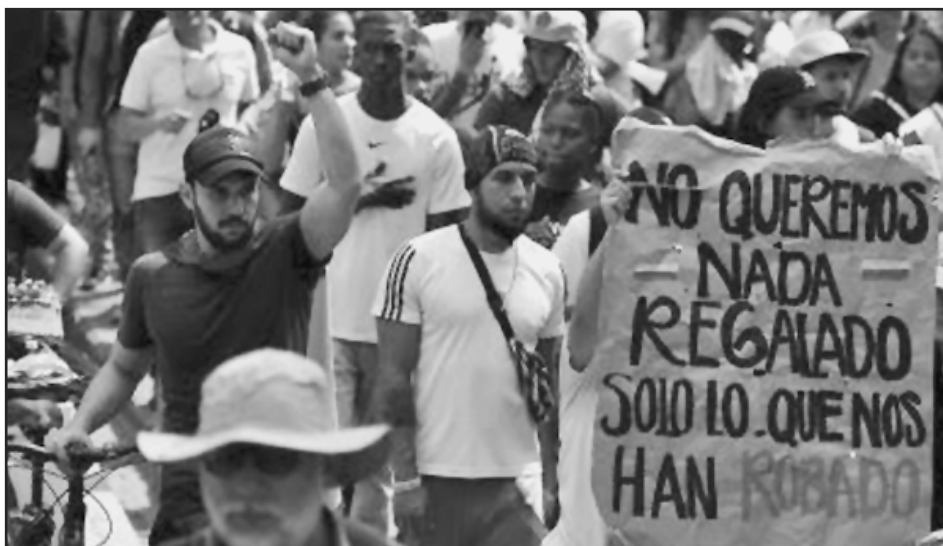
Los explotados colombianos salen por sus legítimos reclamos.

El stalinismo ha entregado Cuba a los yanquis y a la voracidad de los capitalistas.