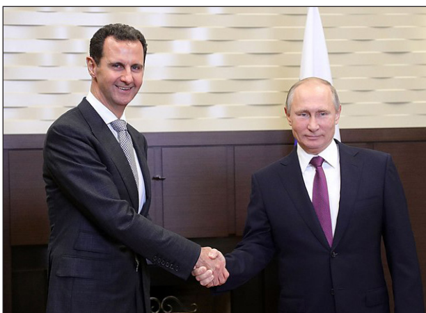
El fascista Al Assad junto al carnicero Putin

Hoy se corre el velo y se abre el telón. Aparecen con sus verdaderas caras los actores de la tragedia contra los procesos revolucionarios en Medio Oriente, que crearon las condiciones para que el monstruo sionista sea lanzado por el imperialismo a una guerra de exterminio contra el pueblo palestino y para imponer orden en todo el Magreb y Medio Oriente.