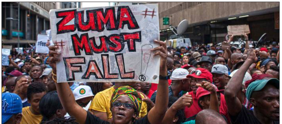
2017. Combate de masas en Sudáfrica: "Zuma debe caer"

Esta política de la dirección del NUMSA debilitó el frente de lucha de los explotados. Se abrió así una nueva crisis de dirección del