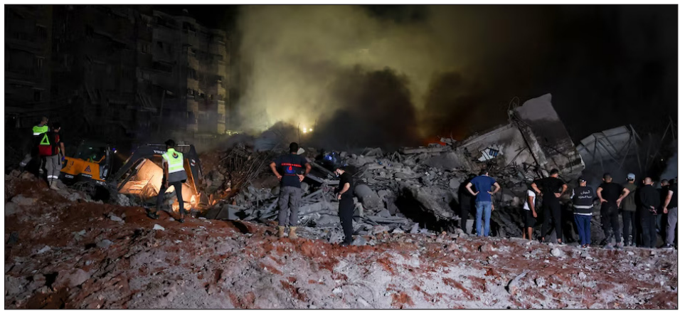
Beirut, la capital del Líbano, bombardeada por el sionismo

Las burguesías árabes como la de Hezbollah y la de Irán en particular, junto a la de Qatar y Egipto, como venimos diciendo, apostaron por un “plan de paz” con EEUU y le dieron tiempo al sionismo para que masacre en la Palestina ocupada, permitiendo que las masas palestinas paguen el alto precio de padecer un Holocausto a manos de la ofensiva sionista. Hay que decir la verdad y esta es la verdad. Las burguesías árabes y chiitas apostaron a la negociación; el sionismo apostó a la guerra total y a la masacre del pueblo palestino.