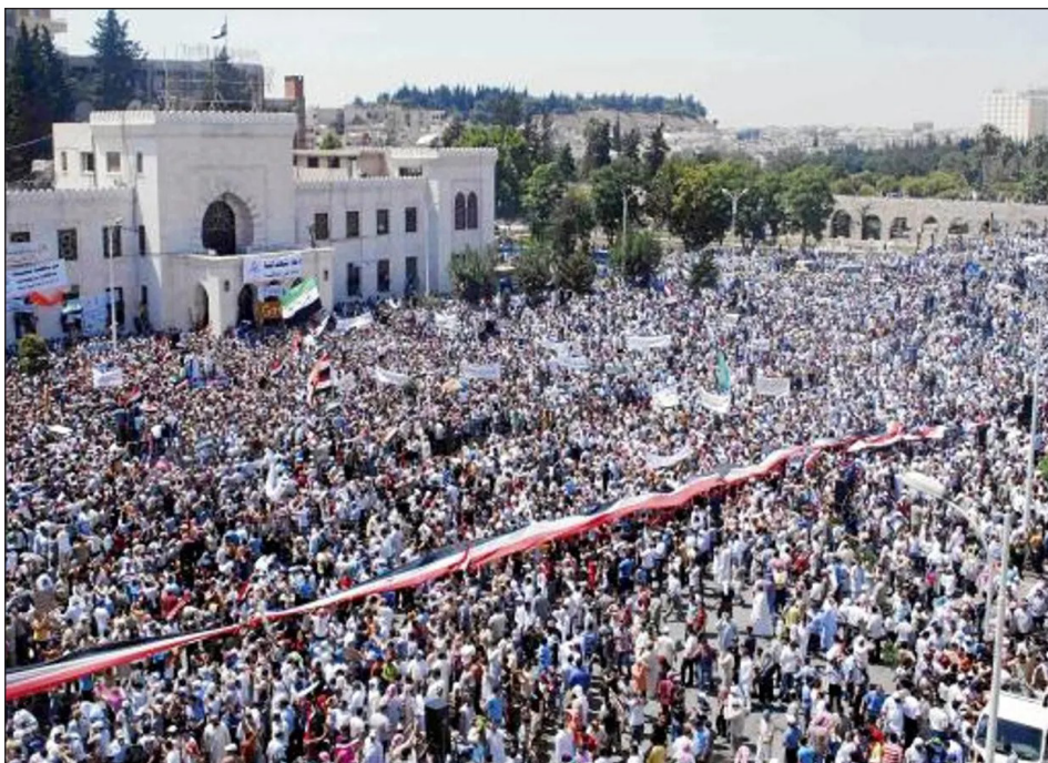
Agosto de 2011: movilización en Hama durante el inicio de la revolución siria

A la izquierda reformista le atrasaba el reloj: se habían quedado en el “frente antiterrorista” con el que justificaron el aplasta-