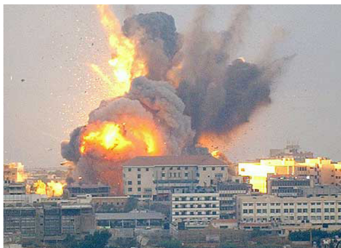
Bombardeos sionistas al sur de Beirut, Líbano

¿Cuántos genocidios tienes que presenciar antes de retirar tu trabajo no esencial en señal de protesta? Qué vergüenza vivir y ser muerto en un mundo donde la guerra es la industria más rentable. Con miles de millones de dólares en ayuda de Estados Unidos (ayer mismo, Estados Unidos confirmó un paquete de ayuda adicional de 8.700 millones de dólares a Israel) y exportaciones de armas importadas desde y hacia Estados Unidos, el Reino Unido, Alemania, Canadá, los Países Bajos, Australia, Italia, Dinamarca, Noruega, Suiza, Suecia y España, la entidad sionista ha matado al menos a 42.252 palestinos, 16.500 de los cuales son niños, ha herido a 95.921 y ha desplazado a 1,9 millones de palestinos en Gaza. Según un estudio publicado en la revista científica The Lan-