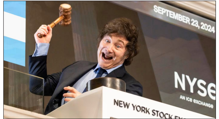
Milei en Wall Street

Este gobierno infame, tutelado por la embajada yanqui y un puñado de parásitos capitalistas, está amparado en la archirreaccionaria Constitución del '53 que le garantiza poderes de “monarca” a Milei, que puede gobernar por decreto, tiene derecho a veto, etc.