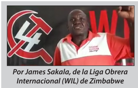
Por James Sakala, de la Liga Obrera Internacional (WIL) de Zimbabwe

Hay que expropiar al imperialismo y derrotar a su gobierno lacayo de Mnangagwa