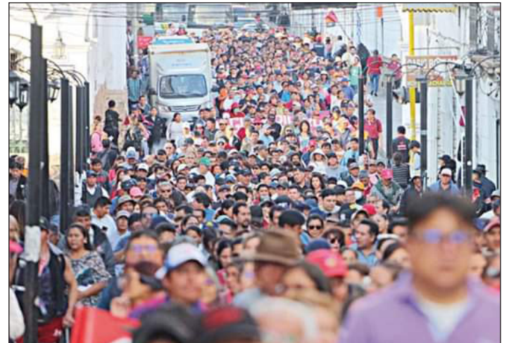
La Central Obrera Departamental de Chuquisaca y sus sectores afiliados marchan contra el incremento de la canasta familiar