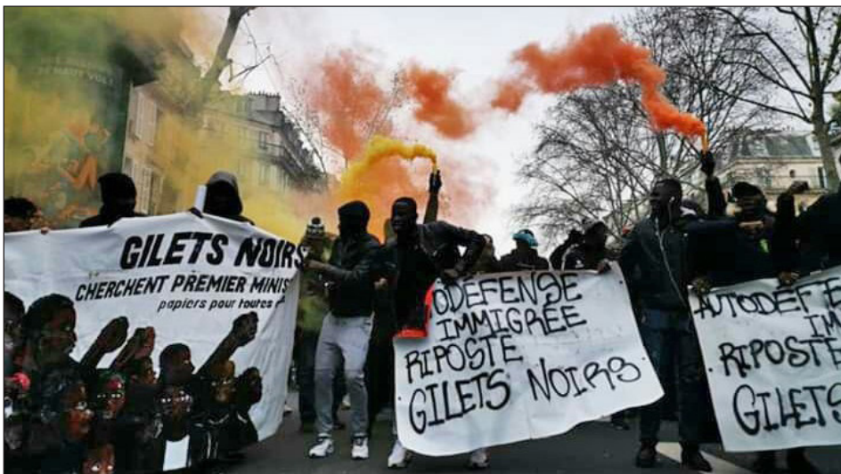
Obreros inmigrantes de los “Chalecos Negros” de Francia”

Coordinar a esta fracción de la clase obrera es un jalón decisivo para reconstruir la unidad del proletariado mundial que el stalinismo y las burocracias sindicales han destruido.