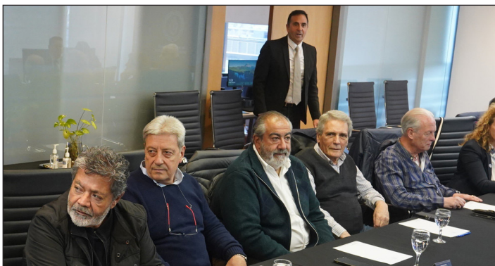
La burocracia de la CGT reunida con el Secretario de Trabajo de Milei

¡Hay que preparar una contraofensiva de masas!