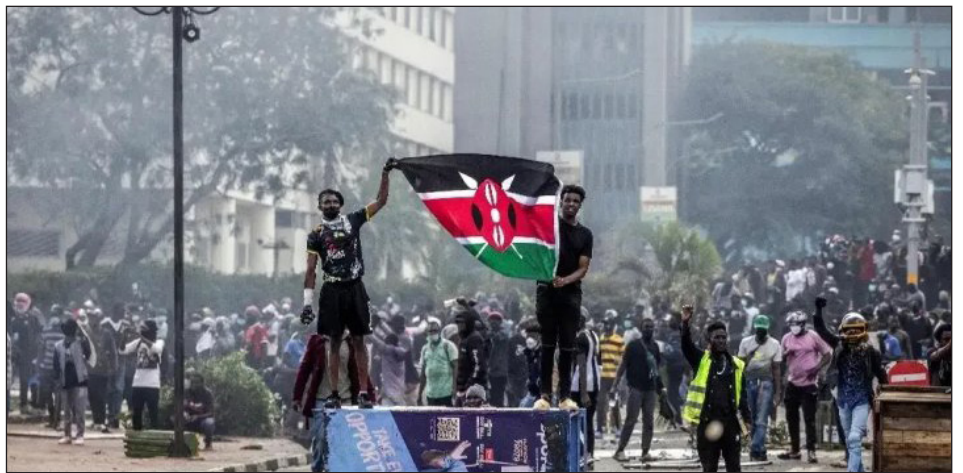
Junio de 2024. Sublevación revolucionaria de masas en Kenia

La construcción de partidos revoluciona-