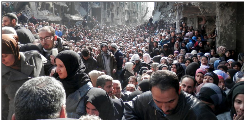
2014. Campo de refugiados palestinos en Yarmouk, Siria

A través del estado de ocupación de Israel, que no es más que un portaviones yanqui en tierra, el imperialismo ha largado una guerra contrarrevolucionaria total en la región. EEUU ha armado al sionismo hasta los dientes, mientras de forma hipócrita se "lamentan por la muerte de civiles", como hace el carnicero Biden. Esas son "lágrimas de cocodrilo" para neutralizar el odio que despiertan los sinvergüenzas imperialistas del Partido Demócrata, apoyados por