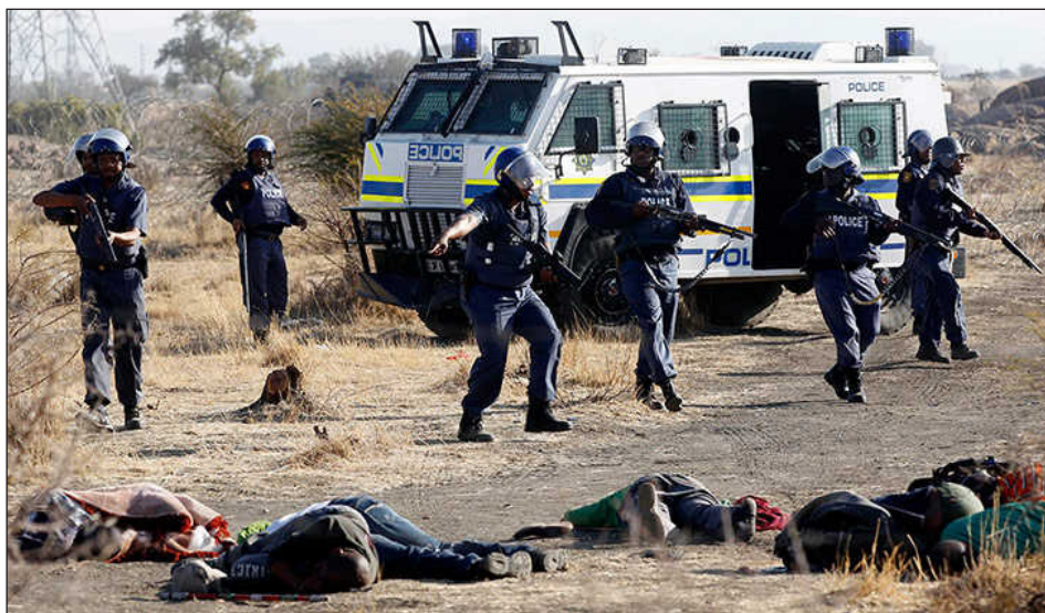
Masacre a los mineros de Marikana

Los obreros no soportaban más las condiciones de trabajo en la mina. Exigían justicia por sus mártires. Y su grito de guerra, era, como dijo James: “12.500 rands de salario o hagan las valijas y váyanse del país”.