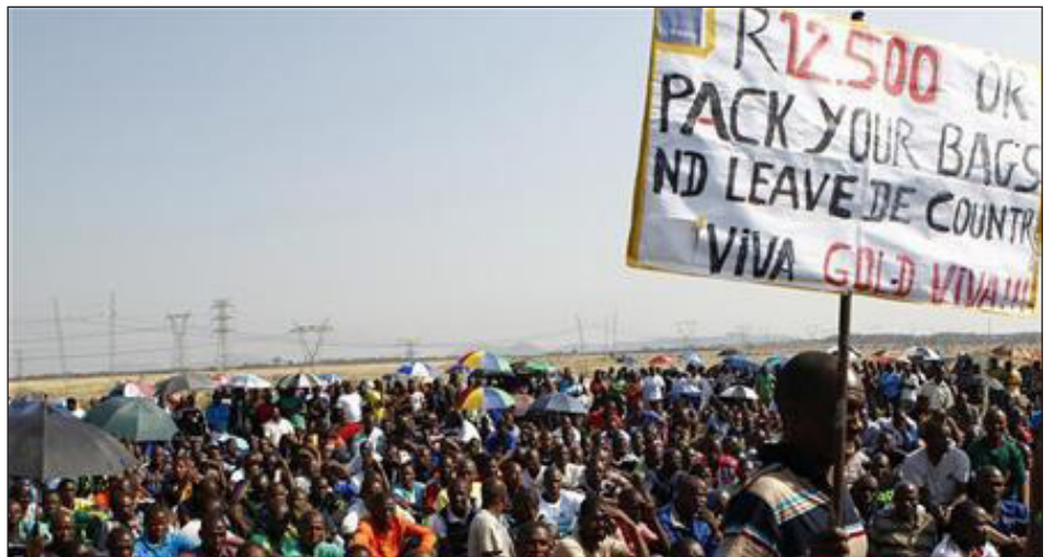
Huelga minera en Marikana: “12.500 rands o hagan sus valijas y váyanse del país”

Es que muchas corrientes del stalinismo y de los renegados del trotskismo quieren guardar bajo la alfombra ese heroico combate de los mineros de Marika-