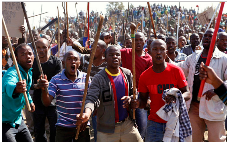
2012. Huelga de Marikana

La pelea por el juicio y castigo a todos los asesinos de Marikana, el reclamo por un