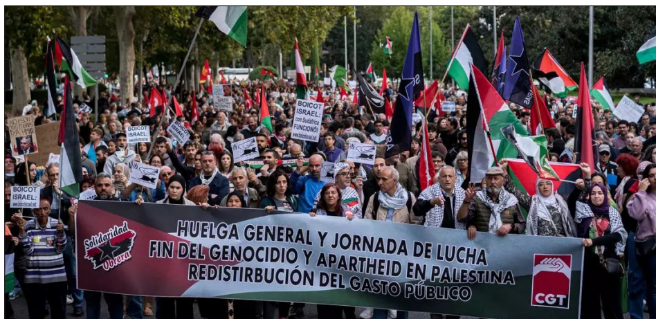
27/09/24: huelga general en el Estado Español en apoyo a las masas palestinas

Los sindicatos palestinos ya han hecho el llamado. Sindicatos y trabajadores en lu-