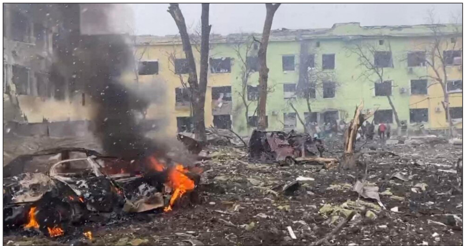
Ucrania: el hospital infantil de Mariúpol destruido por las bombas de Putin

Las masas pelearon... Las direcciones las traicionaron... La verdadera crisis que existe es la de dirección revolucionaria: la falta de partidos revolucionarios de vanguardia que combatan por la revolución socialista y la unificación interna-