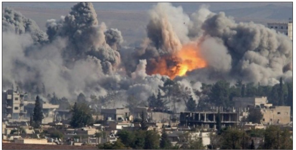
2015: bombardeos de Putin para ahogar la revolución siria en sangre

Por ello, hoy la batalla de Palestina se juega en dos frentes: el de Gaza, Cisjordania y Medio Oriente, y en EEUU, que es la avanzada de la enorme solidaridad internacional que recorrer el mundo en apoyo a las masas palestinas. Allí, en EEUU, está surgiendo el