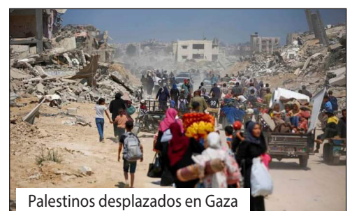
Palestinos desplazados en Gaza

¡Palestina libre del Río Jordán al Mar, con capital en Jerusalén!