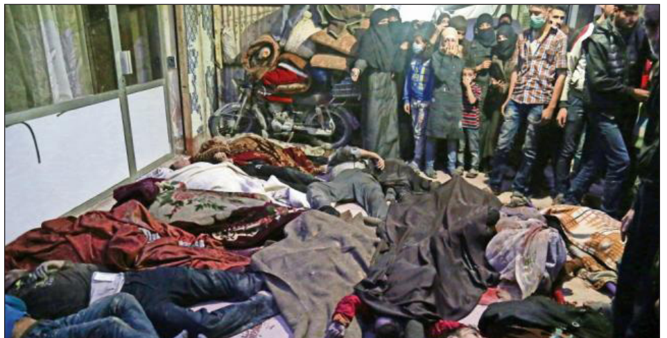
Siria: explotados masacrados en Duma con armas químicas por el fascista Al Assad

La burguesía y los estados mayores imperialistas supieron leer perfectamente la situación y distinguir a sus clases enemigas que se sublevaban en acciones revolucionarias en Siria. Allí concentraron todas sus fuerzas y a todos sus agentes en condiciones de intervenir: la guardia islámica de Irán, Hezbollah, el asesino Putin, siempre dispuesto a masacrar, junto a Al Assad... todos