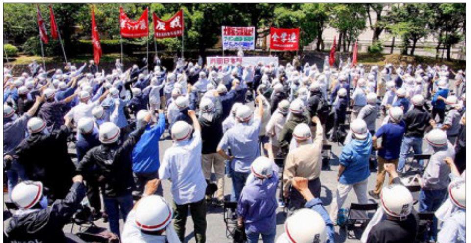
Mitín en Japón en solidaridad con Palestina

dad internacional con Gaza martirizada a los pies de la teocracia iraní y de los traidores de la OLP y Al Fatah en Cisjordania.