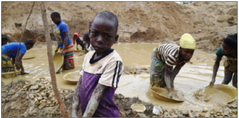
Brutal explotación infantil en las minas de cobalto en el Congo

Para dar tan solo un ejemplo, el cacao que extrae Cargill, la más grande empre-