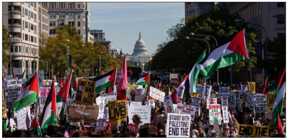
Marcha en EEUU contra el genocidio en Gaza

Los yanquis no pudieron ingresar a Europa con la guerra comercial de Trump, sino que volvieron sobre ella pisándola con la OTAN. Utilizaron la invasión de Putin a una nación oprimida como Ucrania para cortar el