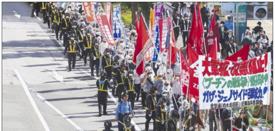
Marcha de la JRCL-RMF y la juventud Zengakuren a la embajada yanqui en Tokio