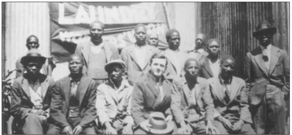
Militantes trotskistas sudafricanos en 1934

Trotsky afirmaba que la reivindicación y el nacionalismo negro en EEUU no es más que el exceso natural de deseo de igualdad. Y eso es total y absolutamente progresivo. Pero por ello también afirmaba que el chovinismo blanco americano es la expresión de la dominación racial y es esencialmente reaccionario. Las tendencias nacionalistas de los negros enfrentan abiertamente al sistema capitalista que es el que impone el racismo y el desprecio al movimiento negro para generar una mano de obra barata y esclava.