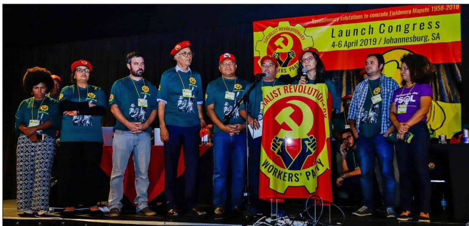
2019. Fundación del SRWP en Sudáfrica: oradores con las remeras de Fidel Castro y la boina chavista

Por ello, los dirigentes del NUMSA participaron de diversos congresos internacionales de los autoproclamados “trotskistas” donde se fueron a lavar la cara y su ropa sucia. Estas corrientes ex trotskistas vestían de “ultra rojo” a esa dirección de izquierda stalinista que la burguesía sudafricana supo utilizar muy bien para imponer la trampa y el desvío