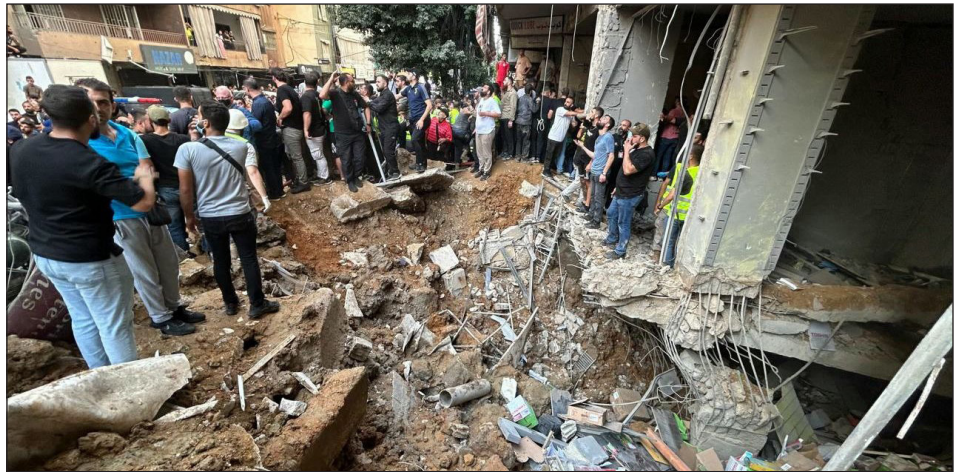
Ataques sionistas en Beirut, Líbano

Los métodos militares terroristas del sionismo utilizados en el Líbano buscan