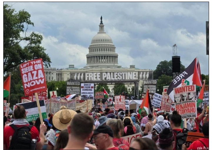
Julio de 2024. EEUU: movilización al Capitolio rechazando la llegada del genocida Netanyahu

6) Hacemos hincapié en que no apostamos en absoluto por el sindicato de trabajadores de ocupación "Histadrut" para detener la agresión u obligar al criminal de guerra Netanyahu a detener la guerra. Sin embargo, se produce en el contexto de las disputas internas y la parcialidad de este sindicato a favor del régimen de la oposición, cuyas manos también están