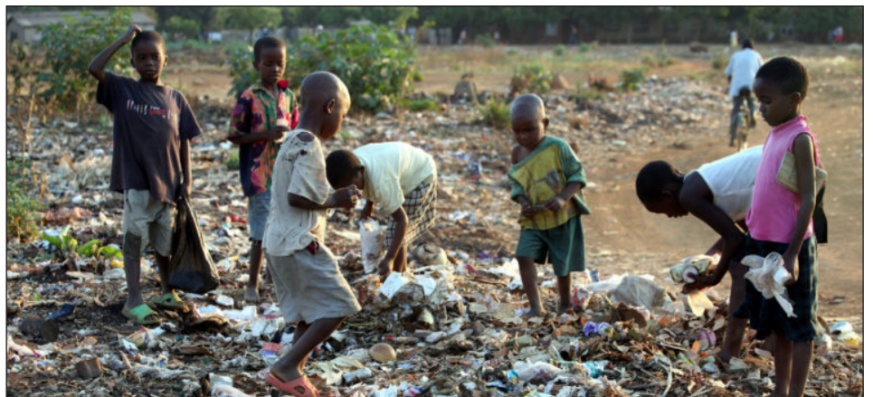
Niños buscan sobras de comida en Harare

Se da la tesis de que en un polo se acumula la riqueza de un puñado pequeño de explotadores y en el polo opuesto la gran mayoría del pueblo trabajador y los campesinos pobres sufren una gran hambruna, que ahora paliarán con ¡carne de elefante!