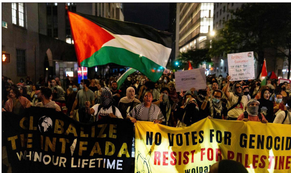
27/09/24 - movilización en EEUU contra el discurso de Netanyahu en la ONU: "Globalizar la Intifada" "Ningún voto al genocidio. Resistir por Palestina"

contraofensiva revolucionaria de masas: enfrentar al sionismo con el método de la revolución obrera y campesina, cuestión que las burguesías árabes, socias menores de las transnacionales, están muy lejos de desear, puesto que esto pondría en cuestión su poder y sus sociedades con los bancos y empresas imperialistas.