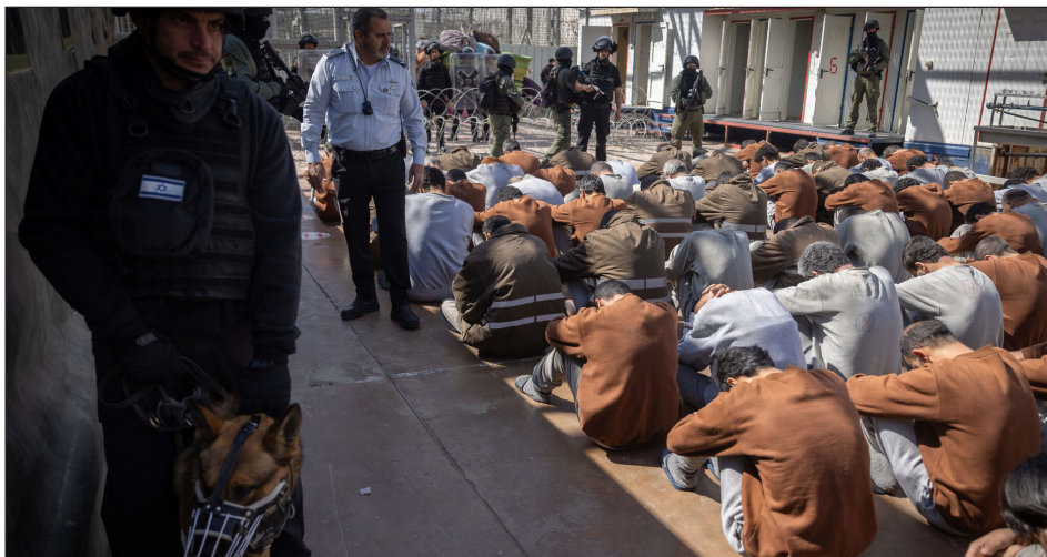
Presos palestinos en los campos de concentración del sionismo

en la guerra, es un derecho inalienable de una nación ocupada y sometida a un genocidio. La nación palestina ha mantenido a los prisioneros de guerra en condiciones óptimas de existencia, mientras los prisioneros palestinos son vejados y mutilados masivamente y hasta sus niños torturados por el sionismo. Insistimos, resolver sobre esto es un derecho de la resistencia.