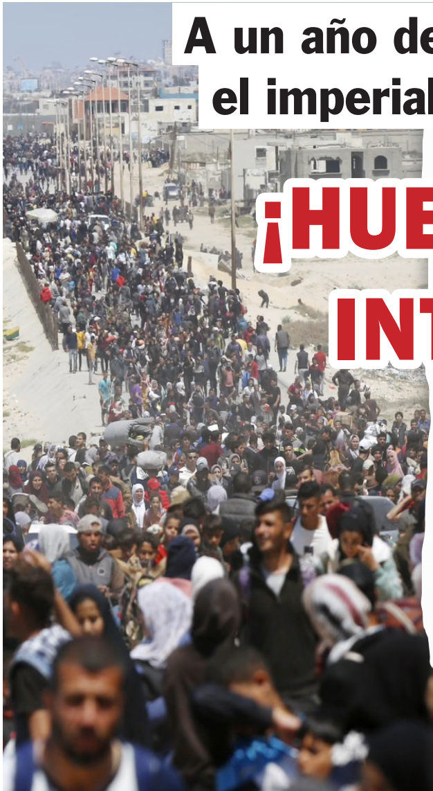
1.900.000 desplazados en Gaza. El martirio de la nación palestina: masacrados y refugiados en su propia tierra

¡Por la destrucción del estado sionista-fascista de Israel!