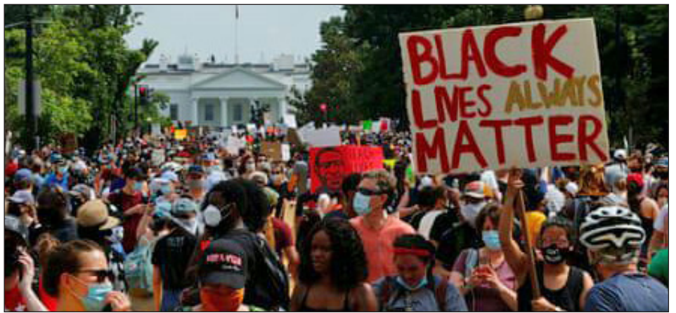
2020. El movimiento negro encabeza la lucha contra Trump en EEUU