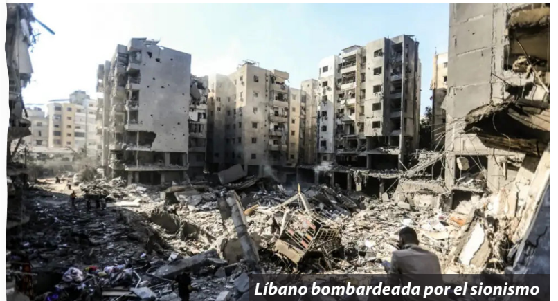
Líbano bombardeada por el sionismo