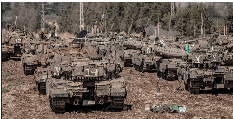
Tanques del ejército fascista del estado sionista apostados en la frontera con el Líbano