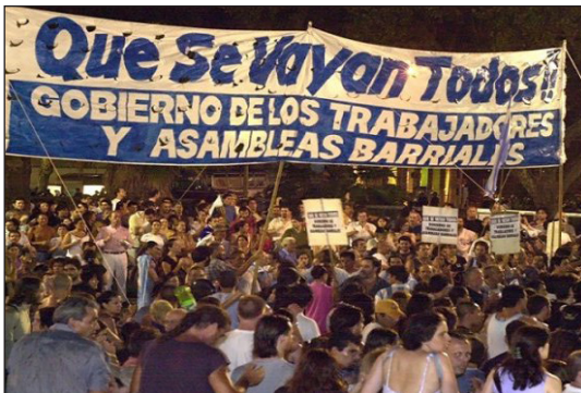
Argentina 2001. Asambleas Populares