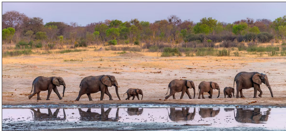
Elefantes en el Parque Nacional de Hwange

- Hay que expropiar todas las minas que están en manos de las transnacionales que saquean los recursos naturales de Zimbabwe, como también a las de capital chino que se roban el litio y todos los minerales para mantener la producción de las transnacionales imperialistas radicadas en