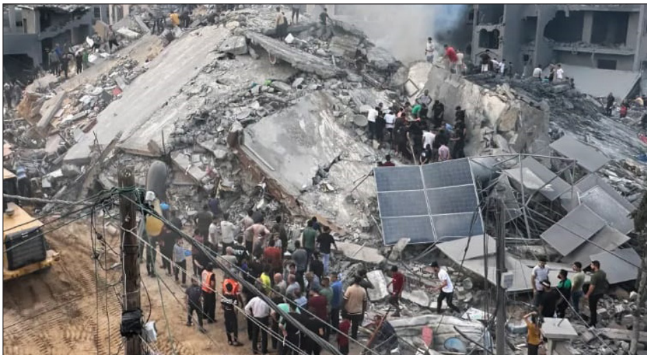
Gaza devastada por el sionismo

El imperialismo hoy ha vuelto a sacar como gendarme al estado de Israel. Este no pudo intervenir directamente durante la ofensiva de masas de 2011, cuando se to-