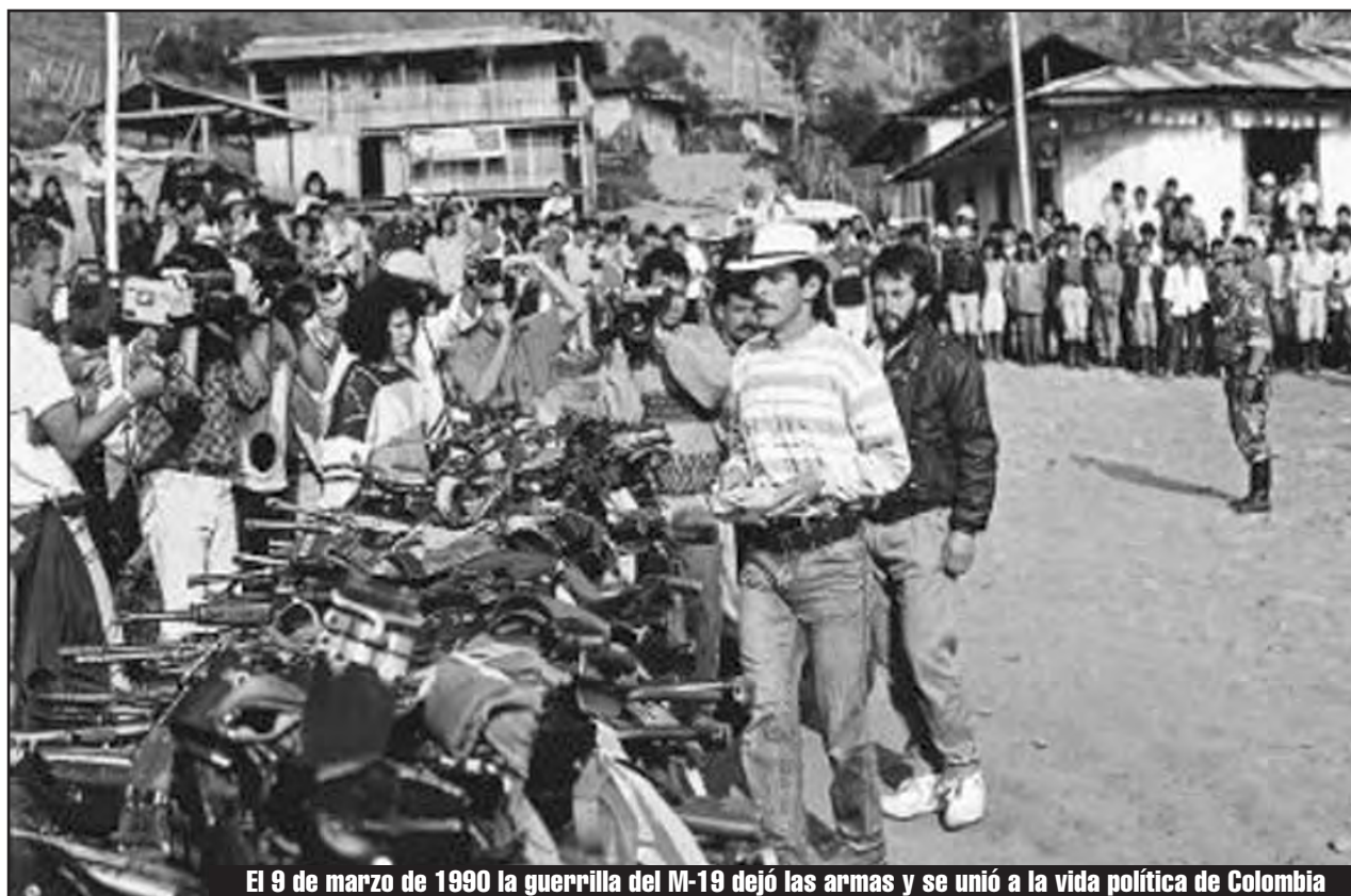
El 9 de marzo de 1990 la guerrilla del M-19 dejó las armas y se unió a la vida política de Colombia

Es por eso que no coincidimos en absoluto con la política de colaboración de clases de la cúpula de las FARC que las ha convertido en un verdadero reformismo armado; no apoyamos la política de la dirección de las FARC de presentar como "amigos" a aliados de las masas colombianas a gobiernos burgueses bolivarianos como los de Maduro, Ortega, Morales, Lula, C. Kirchner, o a carniceros imperialistas como Sarkozy, o un asesino como Putin que entregaron la revolución rusa restaurando el capitalismo en la ex URSS y en Colombia sus aliados burgueses como Piedad Córdoba consentida del partido liberal, Clara López hijas de burgueses, Carlos Gaviria defensor de las leyes que nos oprimen. Tampoco coincidimos con el método impotente y pequeñoburgués del foquismo, que pretende sustituir las luchas de las masas. Por el contrario, estamos con los métodos de lucha de la clase obrera, como la huelga, la ocupación de fábricas, por la auto organización y el armamento de la clase obrera y los campesinos pobres es decir el único camino para preparar y organizar una insurrección de masas victoriosa con una dirección revolucionaria al frente que derroque a la burguesía y lleve al proletariado al poder. Pero a la vez, no le reconocemos al estado burgués colombiano genocida y masacrador de las masas explotadas,