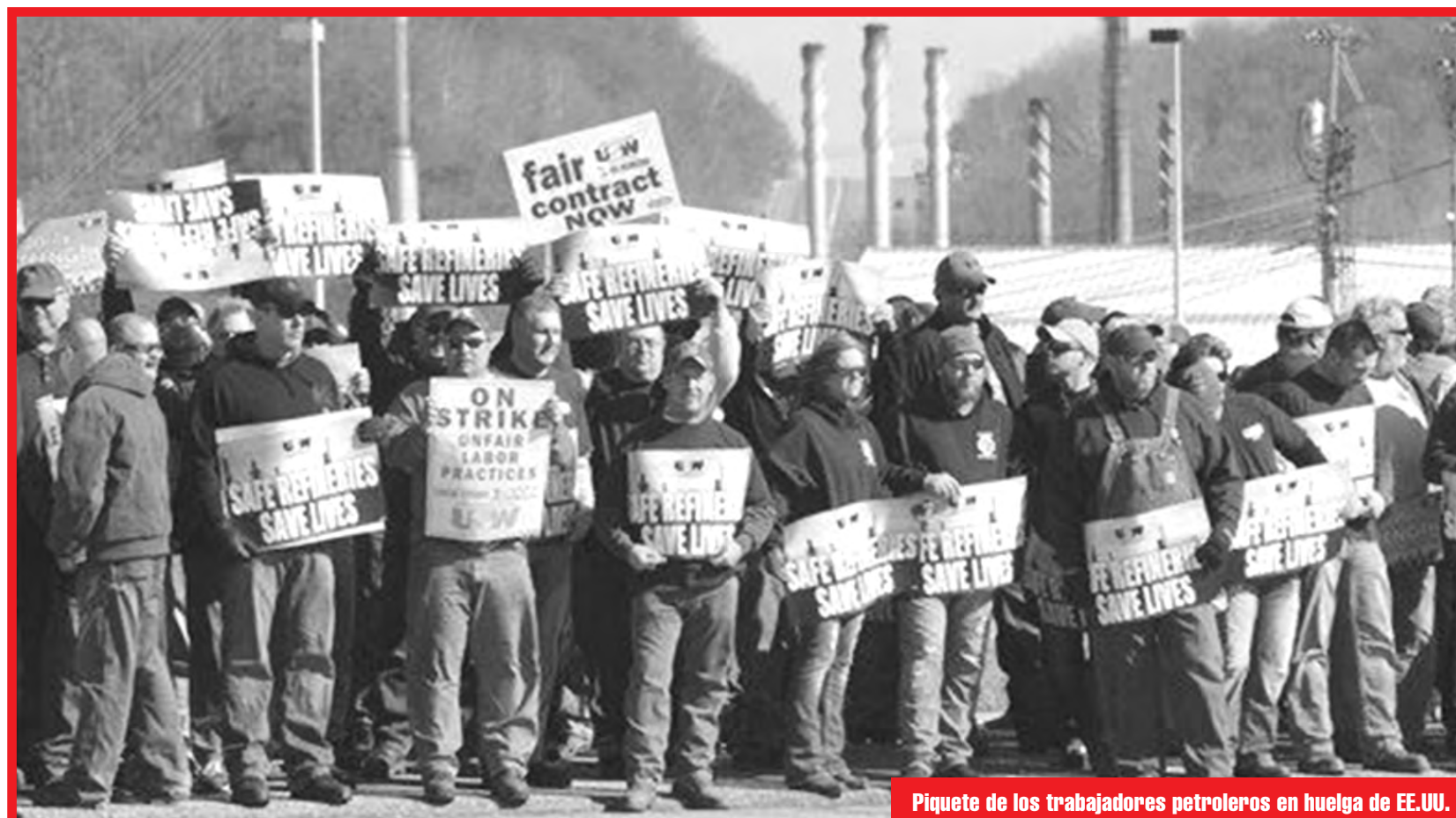
Piquete de los trabajadores petroleros en huelga de EE.UU.

¡Basta! ¡Hay que pararle la mano a las petroleras imperialistas de Wall Street, la City de Londres y el Bundesbank!