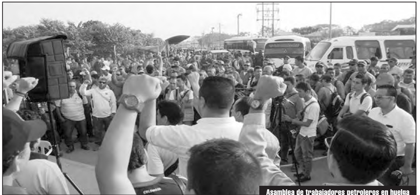
Asamblea de trabajadores petroleros en huelga

La dirección de la USO, que en su momento envió una carta de solidaridad