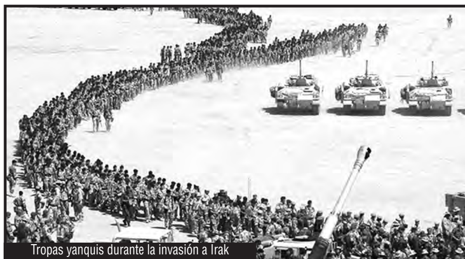
Tropas yanquis durante la invasión a Irak

Así, con guerra (que al decir de Lenin, confirma ser el "factor económico determinante en la época imperialista"), desarrollando fuerzas destructivas y ejecutando matanzas generalizadas, saqueando hasta la última la gota "del oro negro" sin ningún tipo de inversión, conquistando nuevos mercados y zonas de influencia (con la entrega por parte de la lacra estalinista de los ex estados obreros); el imperialismo yanqui salía de su crisis.