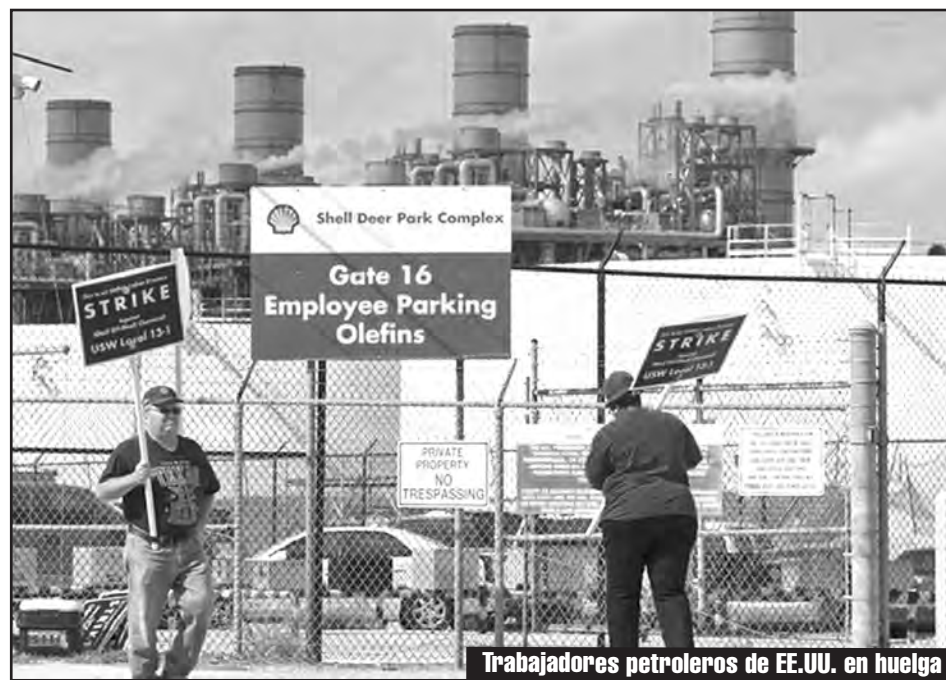
Trabajadores petroleros de EE.UU. en huelga

Texas, Washington, Kentucky, Indiana y Ohio. Muchas de ellas estuvieron paralizadas por más de un mes. 11 fueron ocupadas por sus trabajadores. En total eran 65 refinerías que en su conjunto producen el 64% del petróleo de los EEUU. Muchos de los trabajadores que protagonizaron esta histórica huelga, son afiliados al sindicato del acero USW (United Steel Workers) que agrupa a más de 35.000 obreros petroleros. Sin embargo, la burocracia del USW se negó a que las 65 refinerías en lucha se mantengan unidas durante la huelga; impulsando la política del gobierno de negociar acuerdos parciales con cada una de las distintas plantas. Hoy la lucha ha ingresado en un impasse. Sin embargo los obreros se niegan a reducir sus demandas y a ceder en las negociaciones. La lucha no ha terminado.