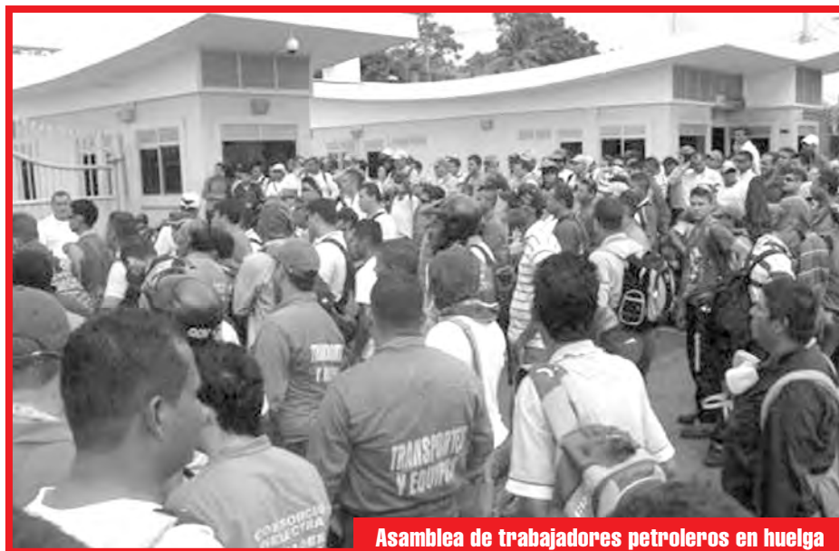
Asamblea de trabajadores petroleros en huelga

Sin embargo no es la única demanda por la que han salido los trabajado-