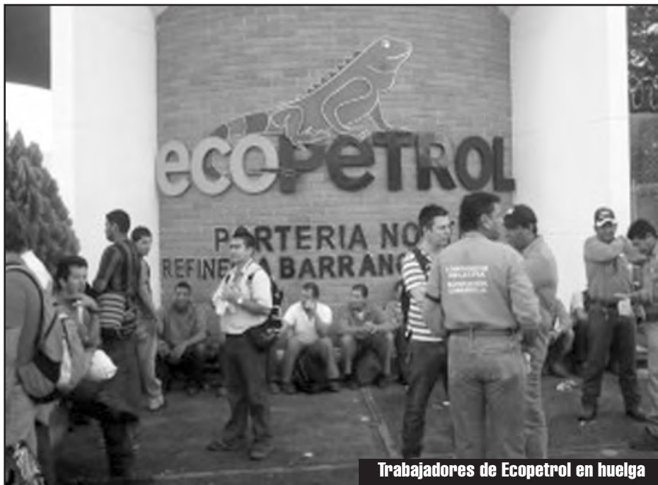
Trabajadores de Ecopetrol en huelga

mente se arremete contra la prestación social de las pensiones, a. Eliminar definitivamente el régimen de prima media que hoy administra Colpensiones y entregarle esos recursos a los fondos privados, que ya administran más de $150 billones. b. Aumentar la edad de pensión de las mujeres de 57 a 62 años e igualarlas a los 65 años, (más 1300 semanas cotizadas) lo cual es absolutamente discriminatorio con las mujeres y que en la práctica significa acabar con esa prestación social que incrementará la pobreza y la desatención de los adultos mayores y niños. c. Aprobar que existan pensiones por debajo del actual salario mínimo lo que causará exorbitantes ganancias para el capital financiero que administra los fondos de pensiones, es decir la banca privada.