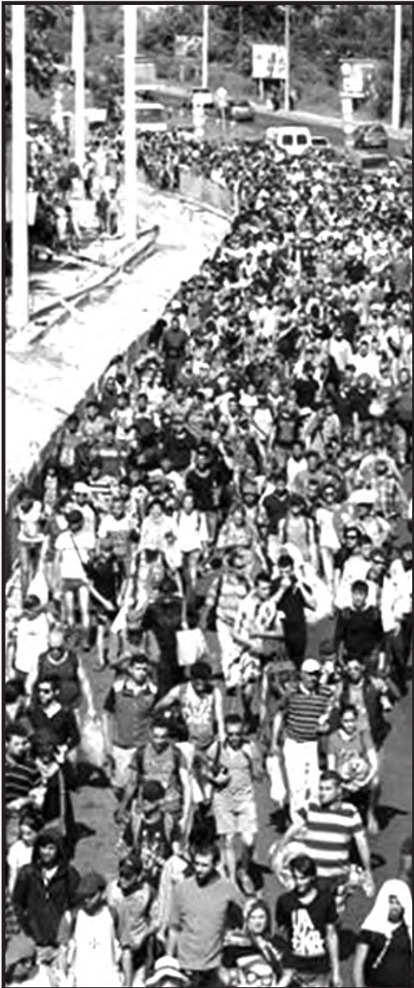
Marcha de los refugiados sirios de Hungría hacia Alemania