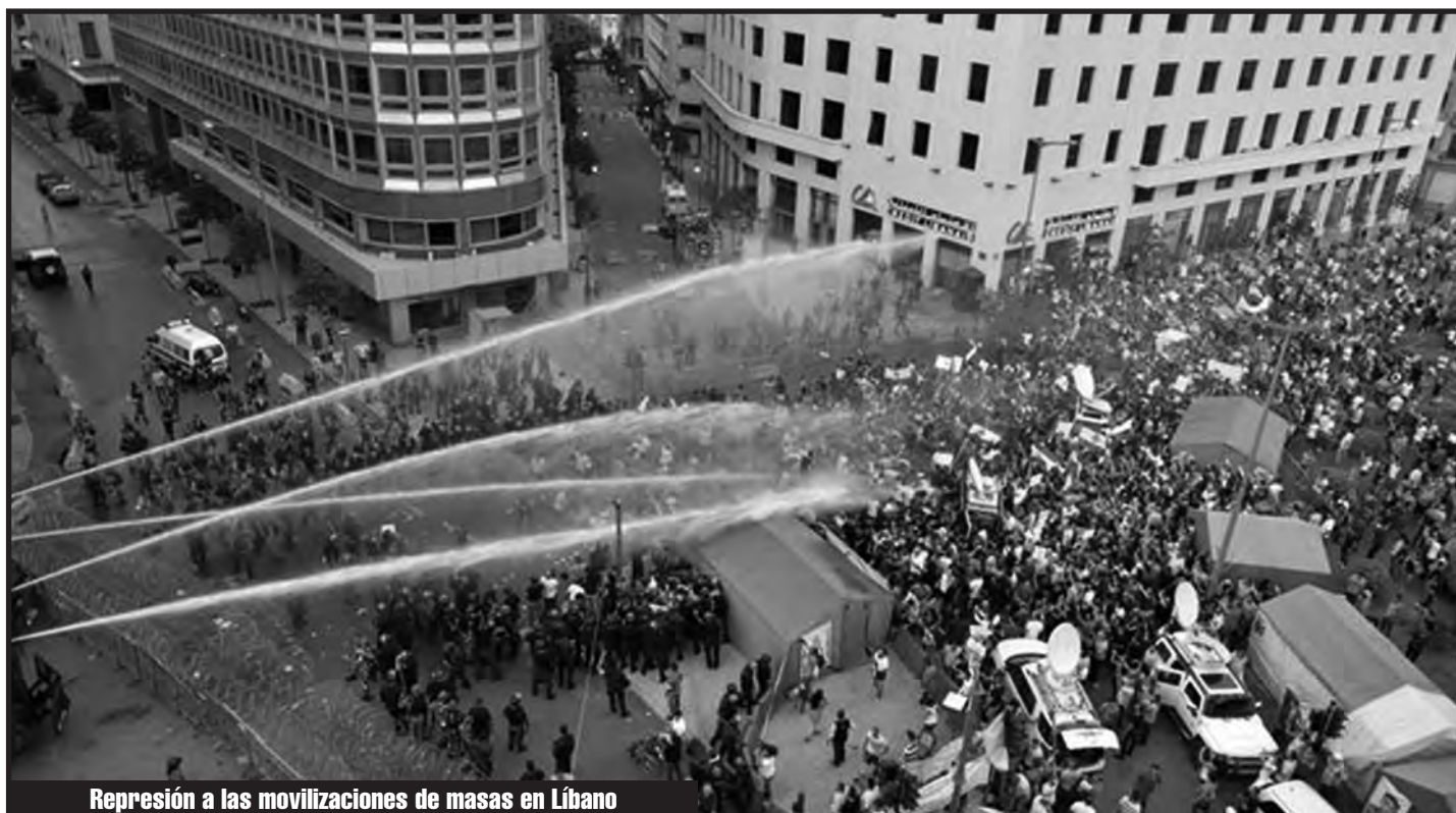
Represión a las movilizaciones de masas en Líbano

Ante esta situación, rápidamente el sector burgués que había convocado a las movilizaciones llamó a suspender todas las protestas que tenía programadas. Pero las masas ya salieron a las calles. Por ello, antes de que escapen a su control, volvieron a convocar protestas para el sábado 29, donde al menos 30.000 personas colmaron el centro de Líbano, nuevamente exigiendo la caída del régimen y la renuncia de todos los ministros y parlamentarios. Hacia la noche, algunos sectores de las masas intentaron ir más allá de los límites que quería imponer la burguesía y prendieron fuego algunas bolsas de basura que habían cerca e intentaron saltar las vallas y alambrados policiales para ir a las oficinas de gobierno. Hubieron