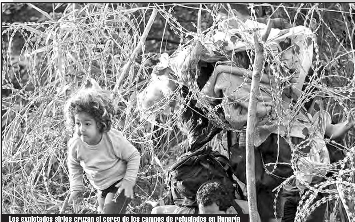
Los explotados sirios cruzan el cerco de los campos de refugiados en Hungría

DESDE ALEPPO, BRIGADA LEÓN SEDOV Agradecemos compartir y reproducir este comunicado