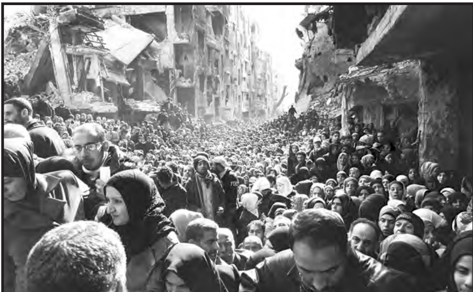
Yarmouk, campo de refugiados palestinos en Siria tras ser bombardeado por Al Assad