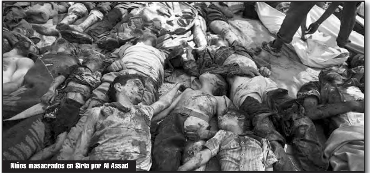
Niños masacrados en Siria por Al Assad

Los refugiados de guerra, masacrados por las potencias imperialistas europeas, y los inmigrantes que realizan los peores trabajos en la Europa imperialista, deben tener el derecho a papeles, la nacionalidad que deseen, a transitar libremente por toda Europa. Este debe ser un reclamo, una exigencia y una bandera de lucha de toda la clase obrera mundial.