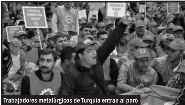
Trabajadores metalúrgicos de Turquía entran al paro

Esta misma patronal que hoy nos despiden obreros por luchar meses atrás modificó los convenios colectivos en Turquía, imponiendo el fin de la efectividad en las metalúrgicas por contratos de 3 años - en donde hubo enormes huelgas de nuestros hermanos de clase. En Francia recortó los salarios un 30% ¡así es! nada menos que en un país imperialista donde un obrero se ha suicidado en una colada ante las condiciones insoportables de trabajo.