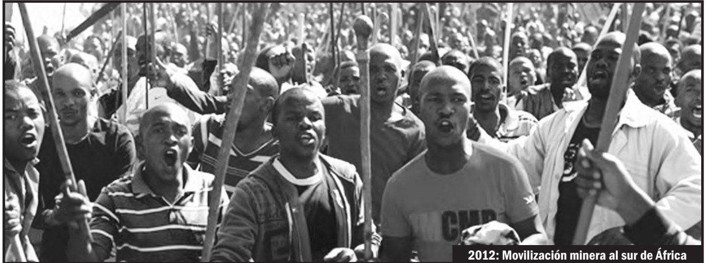
2012: Movilización minera al sur de África