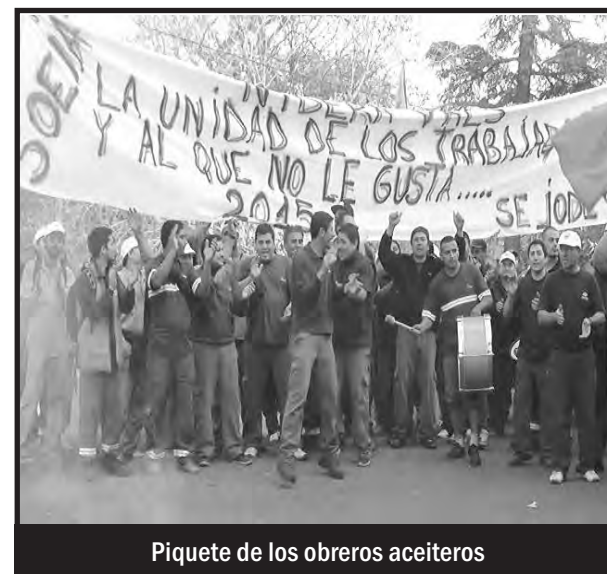
Piquete de los obreros aceiteros

Sobran condiciones para que el FIT vote llamar a desconocer y derrotar las paritarias de Caló, Cristina y Kicillof. Sobran condiciones para que el FIT vote ahora darle las principales candidaturas a los condenados de Las Heras para que no vayan presos y conquistar su absolución. Sobran