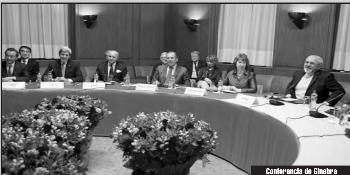
Conferencia de Ginebra

¡Abajo los pactos contrarrevolucionarios de Obama con los criminales de guerra de las burguesías regionales que sólo buscan salvar los intereses de las petroleras imperialistas y el conjunto de los capitalistas, de la lucha y los embates de las masas!