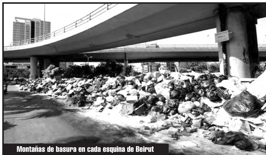
Montañas de basura en cada esquina de Beirut

Como en Yemen, Siria, Libia, ¡hay que poner de pie los organismos de poder de los explotados! ¡Por comités de obreros y de los sectores medios arruinados de la ciudad y el campo! Sólo un gobierno de esas organizaciones puede poner todos los recursos a disposición de garantizar el plan de obras públicas que se ne-