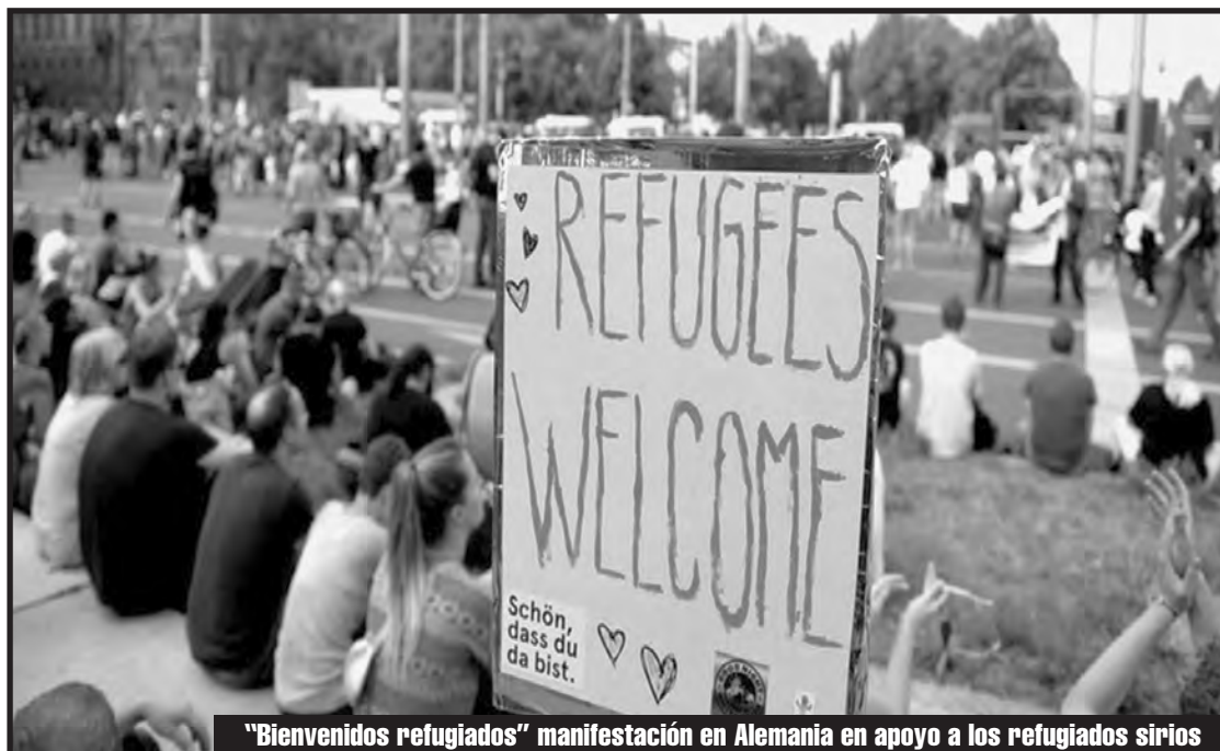
"Bienvenidos refugiados" manifestación en Alemania en apoyo a los refugiados sirios