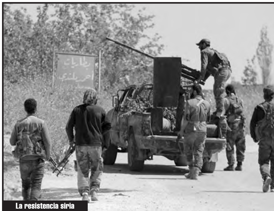
La resistencia siria

Desde hace ya casi un mes, desde la Brigada Leon Sedov venimos acom-