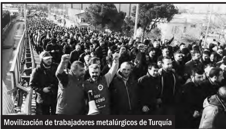
Movilización de trabajadores metalúrgicos de Turquía