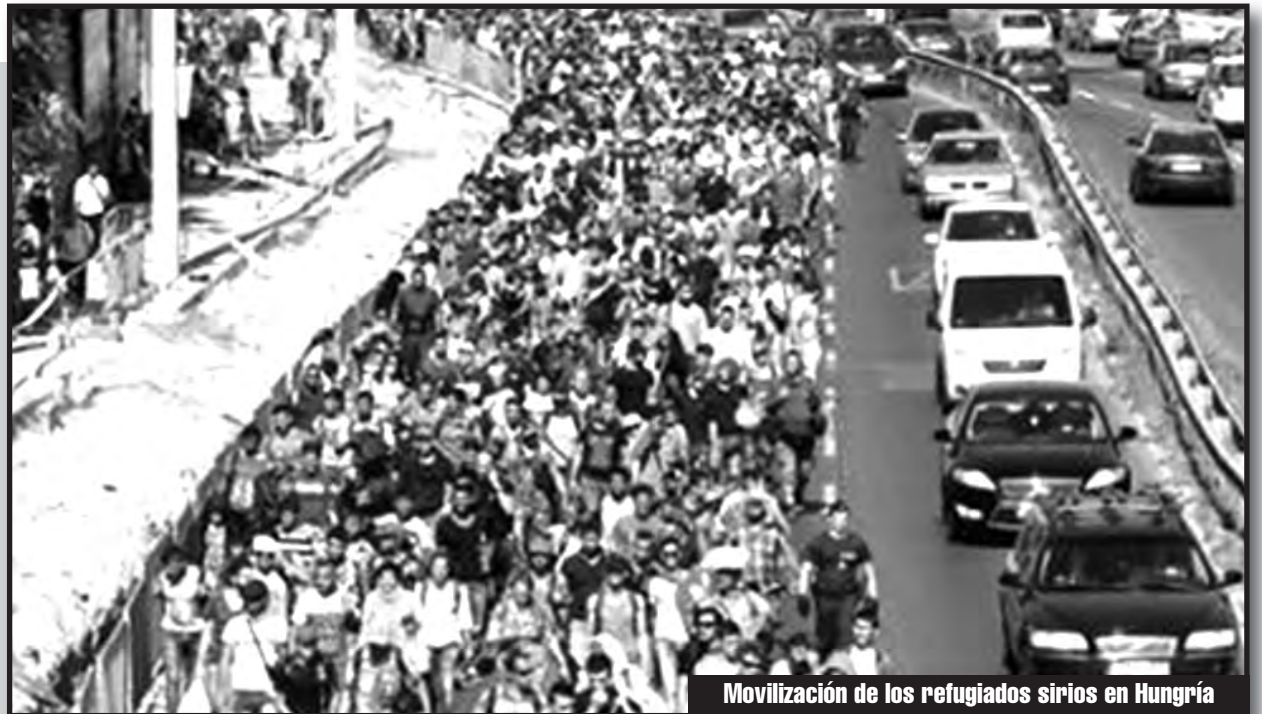
Movilización de los refugiados sirios en Hungría

Desde las organizaciones de la izquierda socialimperialista, los amigos de Obama, vendieron "aire en bolsa" diciendo de que cuando nos levantábamos contra Bashar era EEUU quien nos incitaba. ¡¡¡MENTIRA !!! ¡¡DEJEN DE "VENDER AIRE CONTAMINADO"!! NI SIQUIERA TENEMOS MISILES TIERRA-AIRE PARA DERRIBAR LOS HELICÓPTEROS QUE NOS TIRAN BARRILES EXPLOSIVOS QUE DEMUELEN UNO A UNO LOS EDIFICIOS DE NUESTRAS CASAS EN LOS BARRIOS OBREROS. Todos los días, miles de niños (como los de la foto que hoy recorre el mundo conmoviendo a millones de explotados) mueren en nuestros brazos masacrados por Bashar como lo hacen las fuerzas de ocupación sionistas. Y nosotros sólo tenemos un Kalashnikov... ¿Por qué tanta hipocresía por parte de los gobiernos imperialistas? ¿Porque les llegó a sus costas nuestros muertos, nuestras familias, nuestros niños?