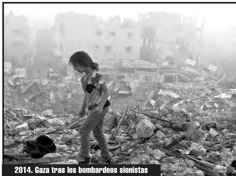
2014. Gaza tras los bombardeos sionistas

Es más, cerraron la calle más larga de la ciudad que conecta la ciudad, como una medida más realizadas para aislar lo que ya había sido aislado y dividir lo que había sido dividido para dar un escarmiento colectivo e individual contra los residentes palestinos en la ciudad de Khalil que se transformó en el museo del apartheid y una ciudad fantasma después de la imposición de un grupo de políticas de ocupación, que fue un desplazamiento silencioso para promover el asentamiento judío a expensas de los dueños de la tierra, los na-