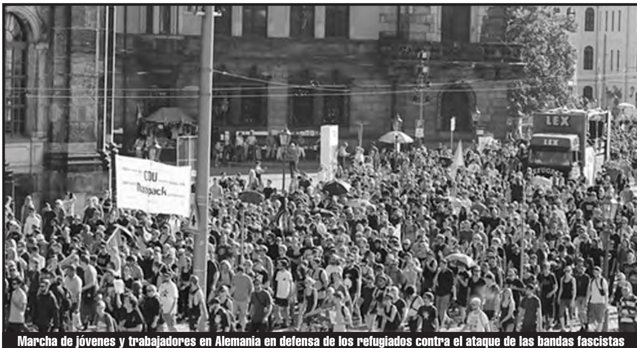
Marcha de jóvenes y trabajadores en Alemania en defensa de los refugiados contra el ataque de las bandas fascistas

¡De pie junto a la resistencia siria en Aleppo, Idlib, Deraa y las afueras de Damasco! Desde los campamentos de refugiados y "las zonas liberadas", ¡hay que volver a poner en pie los Comités de Coordinación! ¡Hay que sacarse de encima al ISIS,