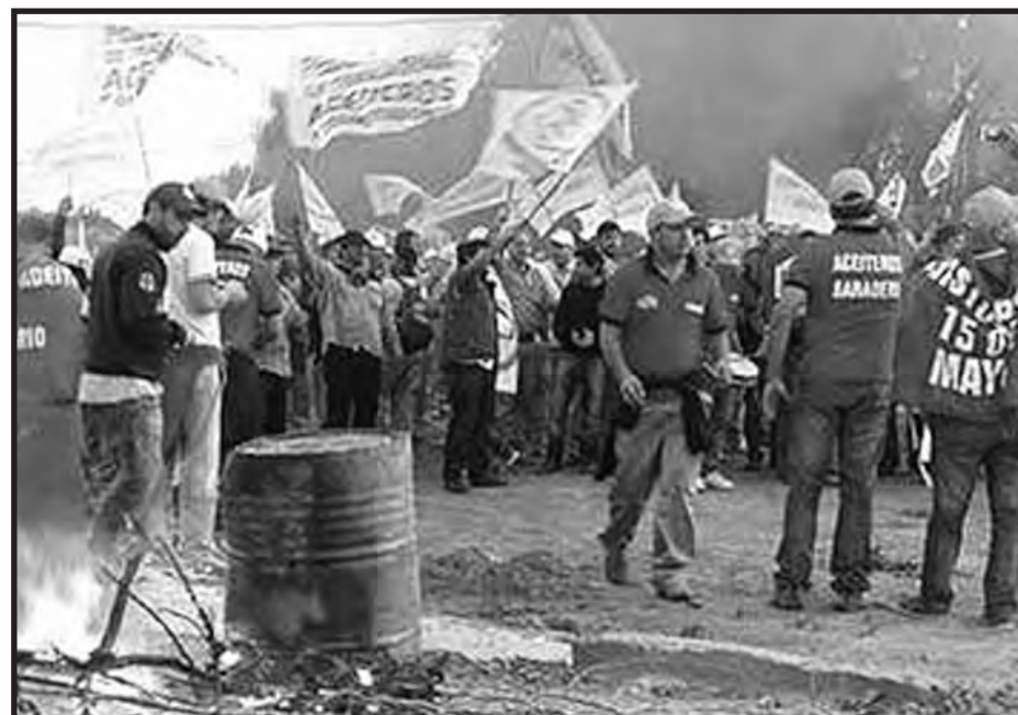
Mayo de 2015. Los trabajadores aceiteros durante su huelga

Ayer los estafadores y expropiadores de la revolución obrera y campesina latinoamericana, en nombre de los boli-