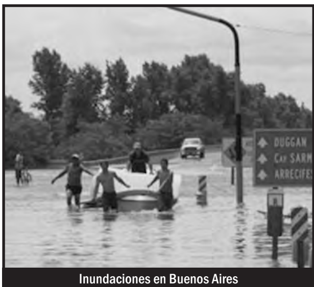
Inundaciones en Buenos Aires

Y como si todo esto fuera poco, las lluvias y la sudestada de los últimos diez días pusieron al desnudo —¡Una vez más!— la desidia y la inagotable sed de ganancias de los capitalistas. El norte y noroeste de la provincia de Buenos Aires y el sur de Santa Fe se encuentran bajo el agua. La inundación arrasó con cientos de barrios populares donde los gobernantes no hicieron una sola inversión en infraestructura. Es que en toda esa zona se han construidos