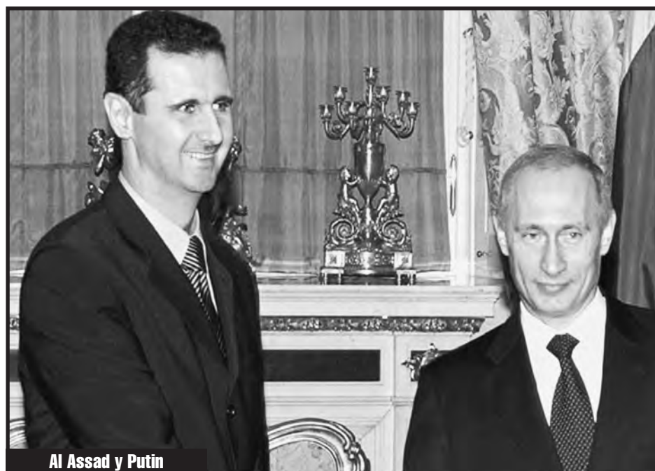
Al Assad y Putin