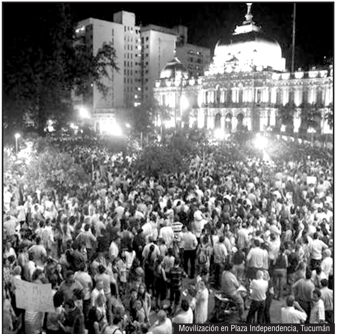
Movilización en Plaza Independencia, Tucumán