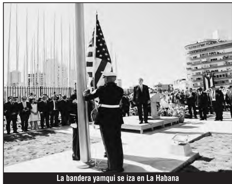
La bandera yanqui se iza en La Habana

La clase obrera norteamericana, con sus obreros de color e inmigrantes sublevados y combatiendo por salario de 15 dólares la hora contra el gobierno de Obama no permitirán que se asiente una nueva república de Batista en la Cuba abierta al imperialismo por los hermanos Castro