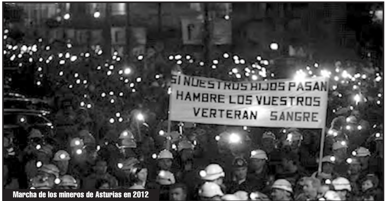
Marcha de los mineros de Asturias en 2012

Hoy se levantan las masas del Líbano contra ese gobierno infame de millonarios de Hezbollah, la burguesía sunnita y maronita. Ellos hicieron enormes negocios y ni siquiera dejaron fondos para recoger la basura del pueblo. ¡Viva la sublevación de las