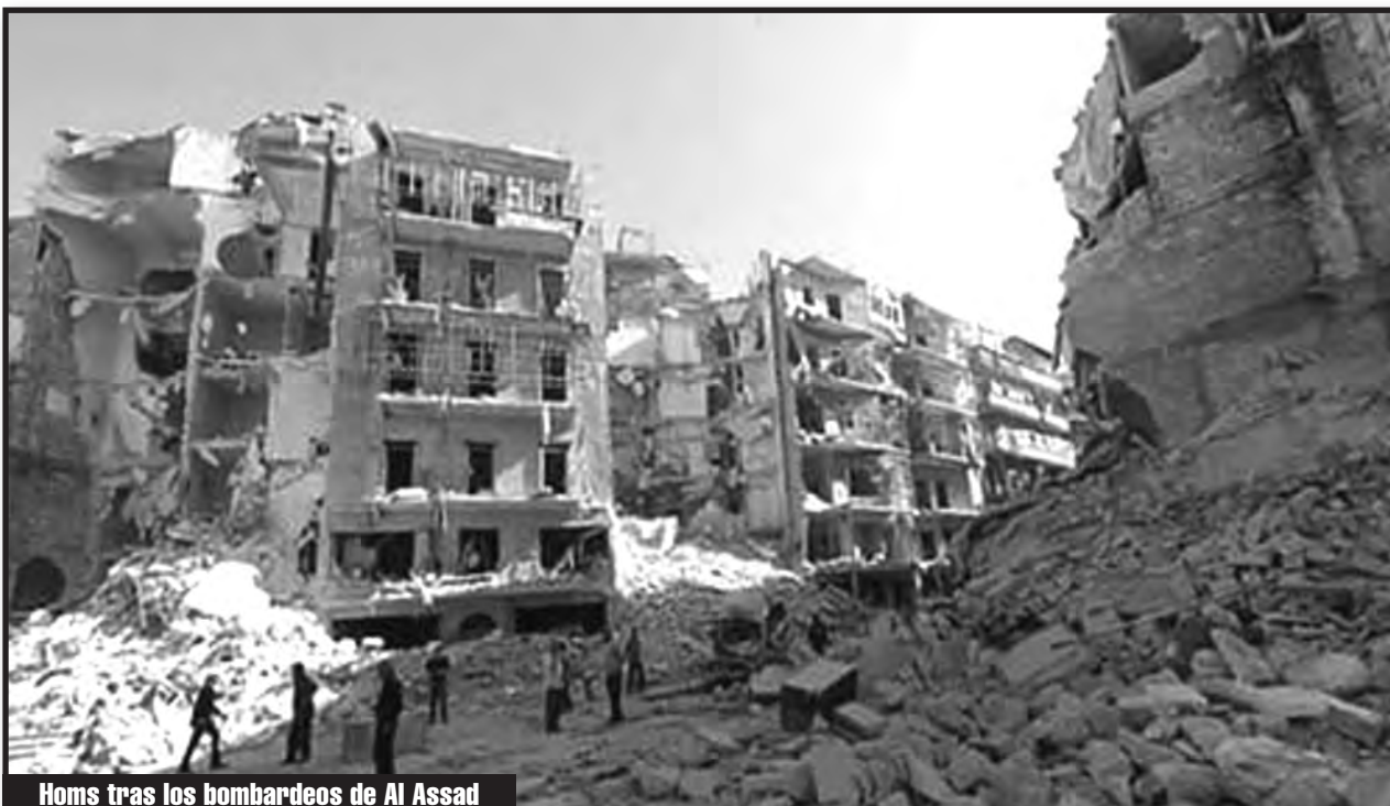
Homs tras los bombardeos de Al Assad

En Europa, ¡todos somos refugiados sirios!