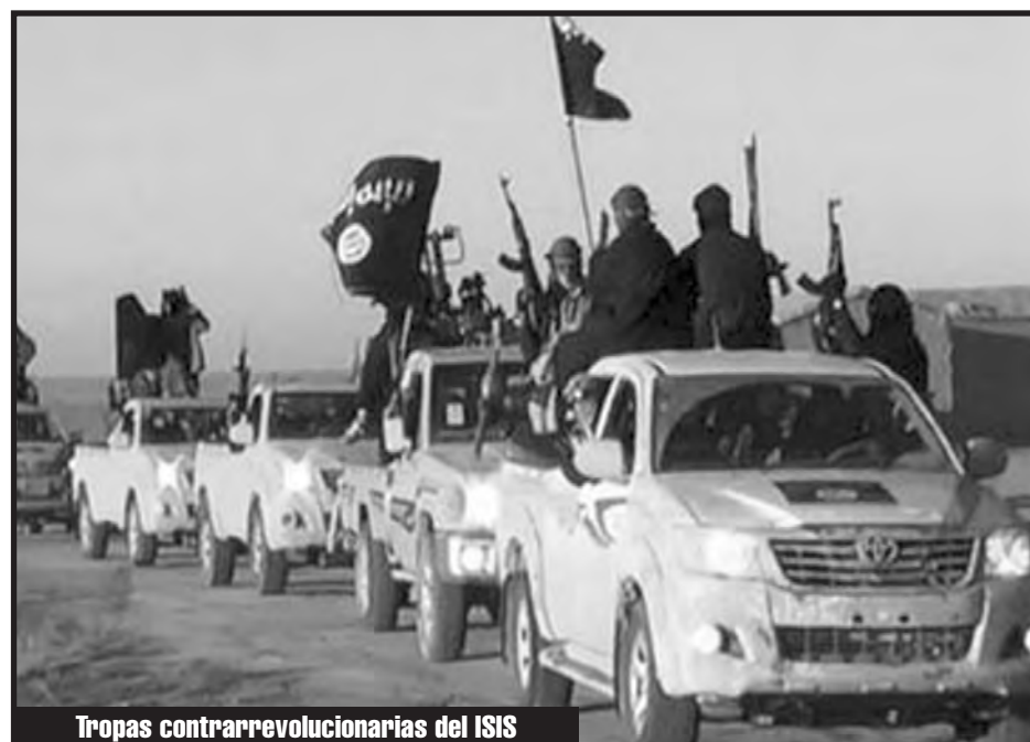
Tropas contrarrevolucionarias del ISIS