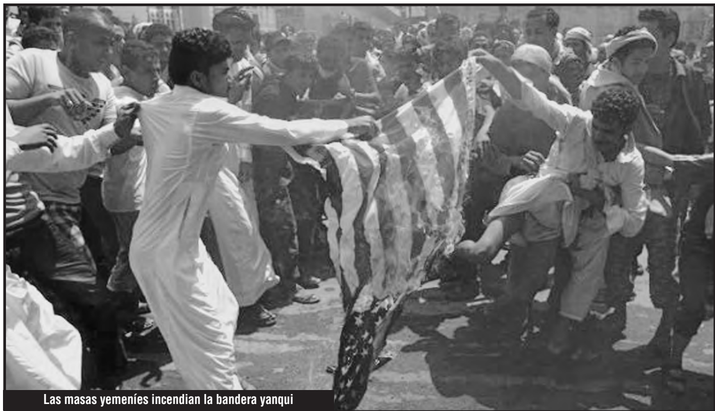
Las masas yemeníes incendian la bandera yanqui

Las cosas han quedado claras en la clase obrera mundial: El stalinismo, los más grandes entregadores de las conquistas de la clase obrera incluyendo la más importante de ellas, los estados en donde se tomó el poder, levantan la