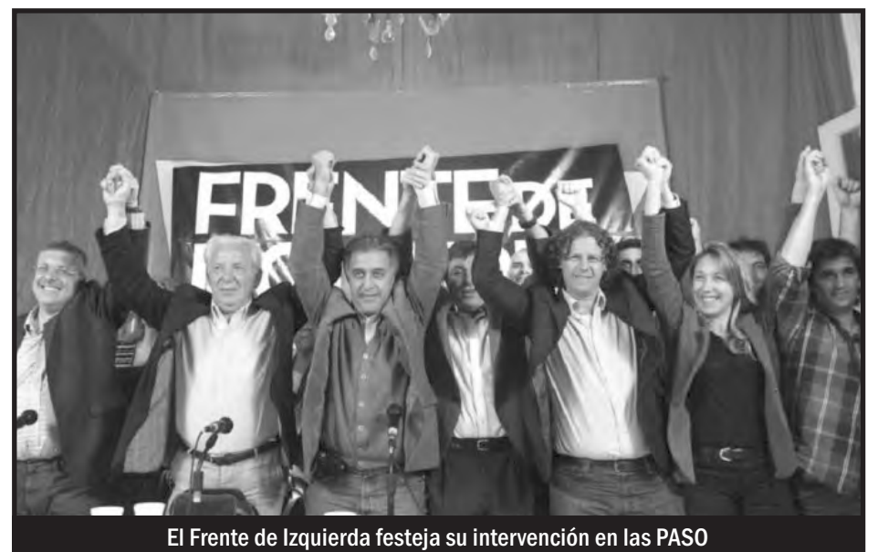
El Frente de Izquierda festeja su intervención en las PASO

Es interesante cómo el PO señala correctamente en su balance de Prensa Obrera 1376 que el PTS habla de “los límites” de la década ganada kirchnerista, presentando las cosas como si se tratara de un proceso progresivo a superar... es decir, como veremos mas adelante, el PTS y Del Caño le dan un carácter progresivo al kirchnerismo ante el “pjetismo actual”, un verdadero escándalo de política colaboracionista. Pero ¿el PO se da por enterado recién ahora de que el PTS quiere ser una colectora del kirchnerismo? Si hace tiempo el PTS habla de que “el kirchnerismo está girando a la derecha” como si alguna vez hubiera sido de izquierda o