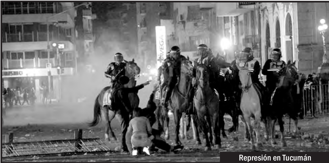
Represión en Tucumán

El fraude es la trampa y la cortina de humo del circo electoral mientras nos roban el salario, avanzan los despidos y profundizan la entrega de la nación al imperialismo