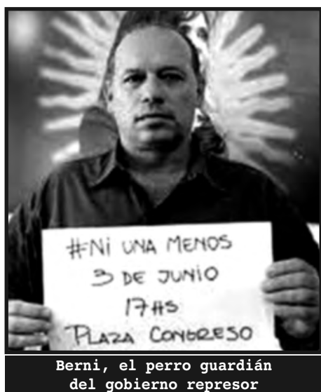
Berni, el perro guardián del gobierno represor

Las enormes fuerzas puestas en marcha en la lucha contra el femicidio