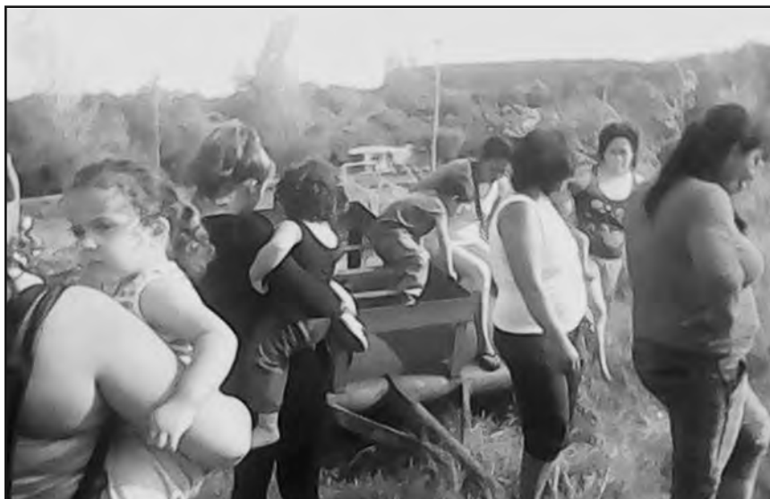
Misiones-mayo 2015: Mujeres trabajadoras ocupan tierras luchando por una vivienda digna

no pueden quedar en manos del gobierno y los políticos patronales ni sucumbir ante las pretensiones reformistas que plantean que todo se resolverá defendiendo las leyes de esta democracia para ricos.