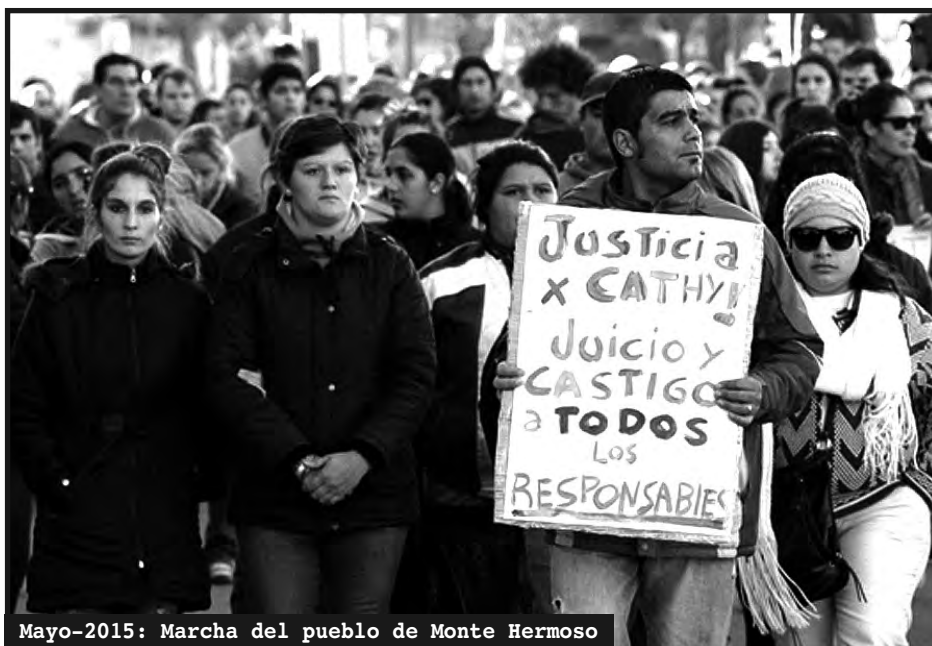
Mayo-2015: Marcha del pueblo de Monte Hermoso

¡ARGENTINA SERÁ SOCIALISTA y la mujer será liberada O SERÁ COLONIA y la mujer trabajadora seguirá siendo triplemente explotada!