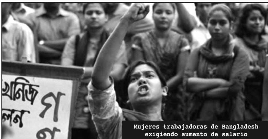
Mujeres trabajadoras de Bangladesh exigiendo aumento de salario

De otra manera, si el PTS no pelea por llevar adelante desde las organizaciones obreras y estudiantiles habrá demostrado que buscan hacerse los desentendidos y lavarse la ropa después de rebajado el programa de la mujer explotada para marchar con un programa de colaboración de clases con La Campora, el FPV, y los políticos patronales del oficialismo y la oposición, tal como lo hicieron todos los partidos del FIT en el último encuen-