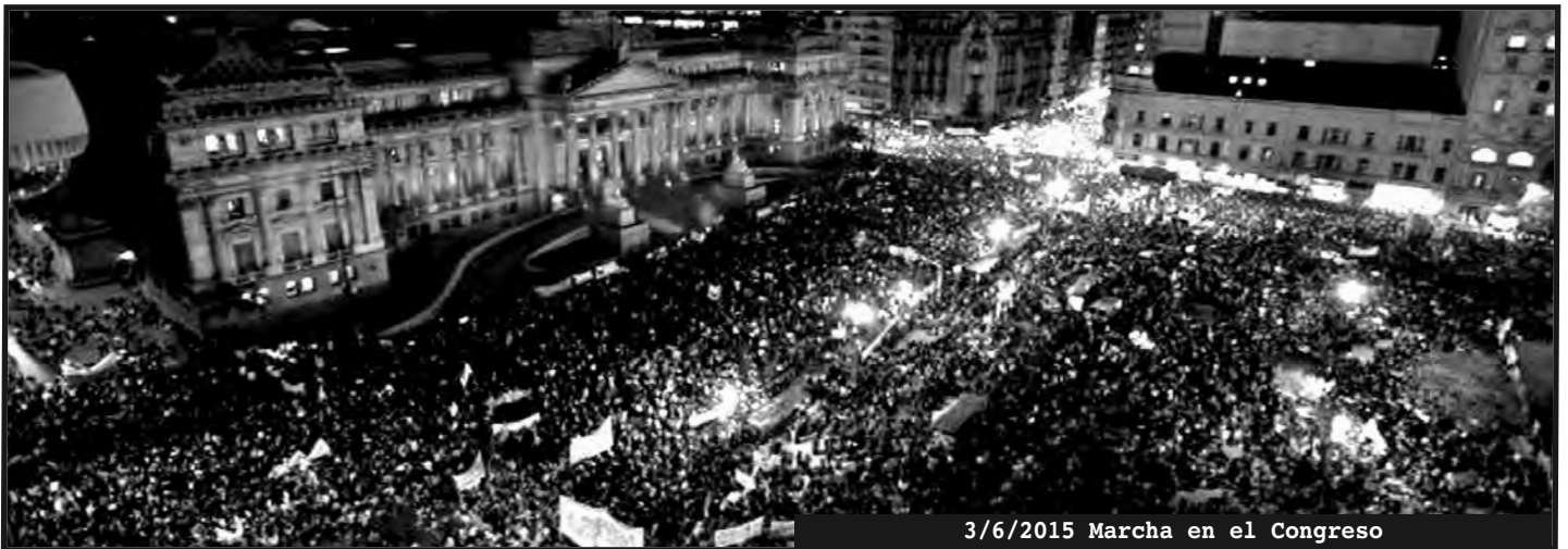
3/6/2015 Marcha en el Congreso

¡QUE NO NOS MIENTAN MAS, BASTA DE CIRCO ELECTORAL! ¡HAY QUE TOMAR LA SOLUCIÓN DE NUESTROS PROBLEMAS EN NUESTRAS MANOS!