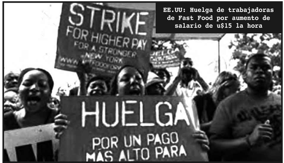
EE.UU: Huelga de trabajadoras de Fast Food por aumento de salario de u$15 la hora

Los políticos patronales, los representantes de los capitalistas que imponen estas condiciones, el 3 de junio, en una marcha de unidad nacional, usaron el sentido y justo reclamo de la mujer trabajadora para lavarse la ropa y asegurarse una transición ordenada del kirchnerismo al próximo gobierno ¿Y los botones antipánico, las comisarías de la mujer, nuevas secretarías, los refugios, la ley 26.485? No han resuelto nada, han sido nada mas que argumentos para convencer a las miles de mujeres oprimidas que luchan por la igualdad de derechos, por el aborto legal, contra la violencia doméstica, contra la precarización laboral, que de la mano de la justicia, los parlamentos, sus instituciones o alguno gobierno vendrá la solución a sus padecimientos.