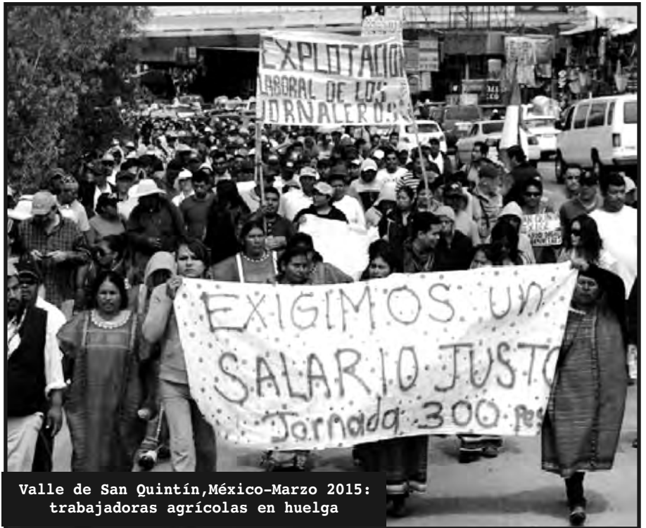
Valle de San Quintín, México-Marzo 2015: trabajadoras agrícolas en huelga

√ ¡Basta de precarización y esclavitud laboral! ¡Todos bajo convenio! ¡8hs de trabajo, 8hs de ocio y 8hs de descanso para todos los trabajadores!