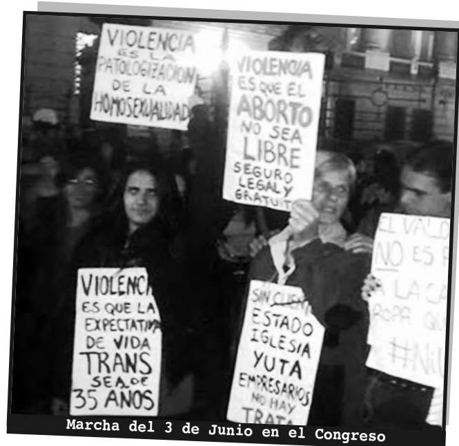
Marcha del 3 de Junio en el Congreso

✓ ¡Por comités de mujeres en los sindicatos, seccionales y organizaciones de lucha para pelear por todas nuestras demandas!