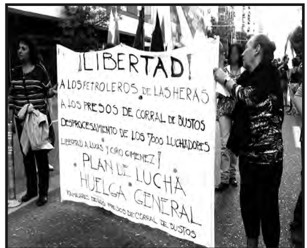
Los familiares de los presos de Corral de Bustos, junto a los compañeros de Las Heras, se movilizan por el plan de lucha y la Huelga General.

Agradezco a todos los derechos humano y organizaciones y en especial, que siempre me apoyaron, a Democracia Obrera Córdoba y a la Comisión de Trabajadores Condenados Familiares y Amigos de Las Heras. Estoy en libertad condicional y tratamiento psicológico."