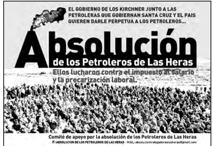
Facsimil del afiche de la Comisión en Buenos Aires.