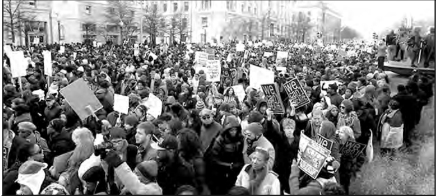
13/12 Movilización en EE.UU. contra masacre a la juventud negra por parte de la policía de Obama

ros de Huanuni y los comuneros de Ayo Ayo de Bolivia. Estamos junto a los obreros de Sidor y de la Civetchi de Venezuela atacados por el gobierno que se dice democrático y sólo ataca a los obreros cuando luchan.