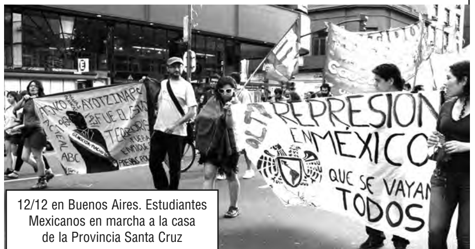
12/12 en Buenos Aires. Estudiantes Mexicanos en marcha a la casa de la Provincia Santa Cruz

Asamblea de Mexicanos en Córdoba y todo México.