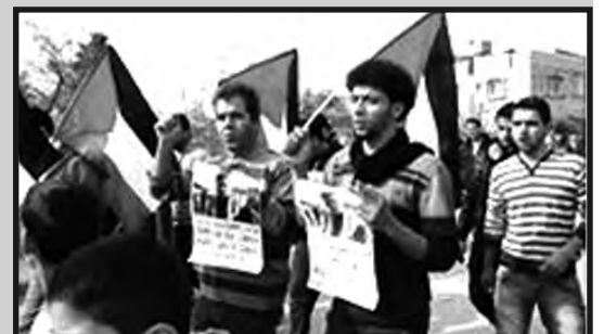
Palestina- Ciudad de Nablus

Red Internacional por la libertad de todos los presos políticos del mundo