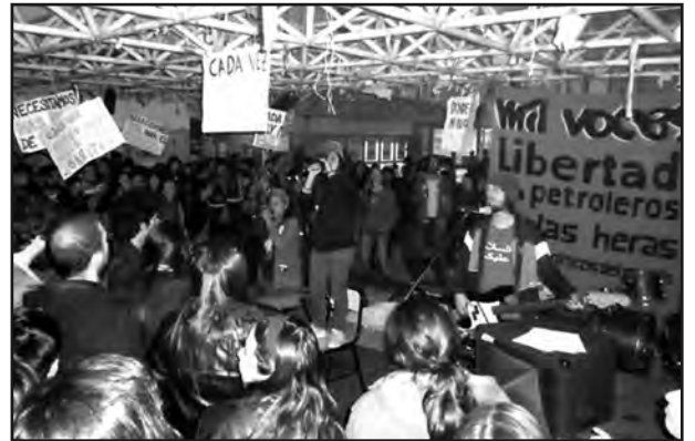
Festival en la facultad de Filosofía y Letras organizado por la Comisión Antirrepresiva