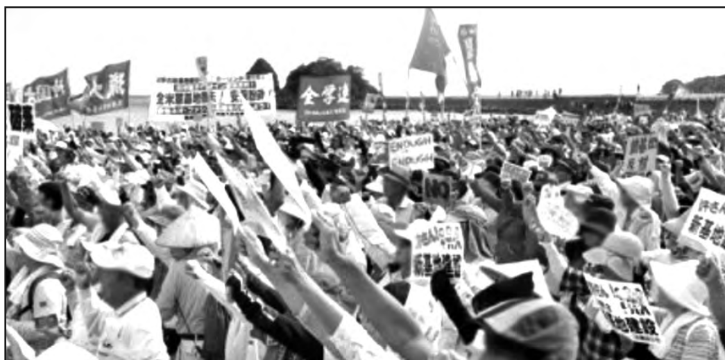
Movilización contra la construcción de la base norteamericana en Henoko, Okinawa, 20/9/2014