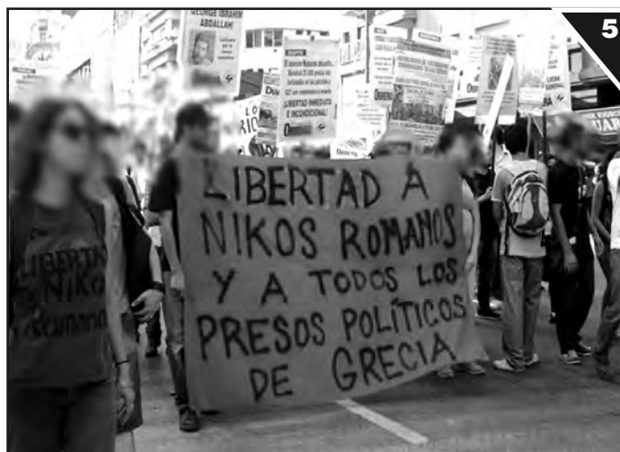
12/12 en Buenos Aires. Bandera por la libertad de los presos políticos en Grecia

El 12 de diciembre de 2013 dijimos que constituíamos una Comisión de Trabajadores condenados y familiares de Las Heras, no solo para no ir nosotros a la prisión, sino para que no vaya a prisión ninguno de los procesados y condenados que vinieron después. Ya todos comprendimos esto. Por eso nos pusimos a disposición de la lucha por nuestra libertad y la de todos los perseguidos. Apoyamos cada lucha en defensa de la fuente de trabajo, contra las paritarias de hambre, los salarios de miseria, los despidos y la desocupación. Porque los rehenes de los opresores tenemos que estar junto a los trabajadores que luchan por sus derechos, porque en