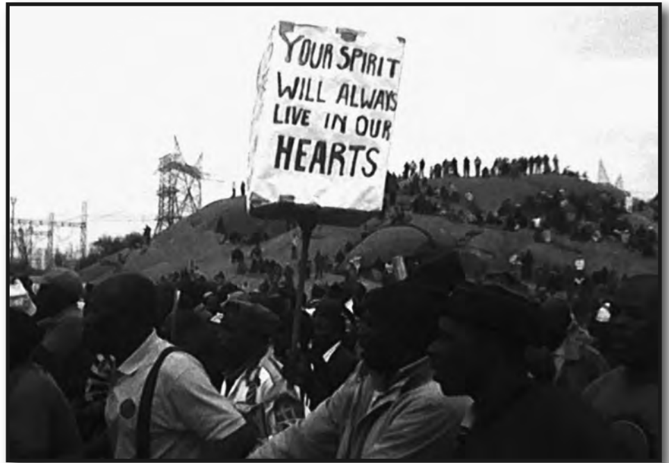
16 de agosto de 2014. "Sus espíritus vivirán por siempre en nuestros corazones" Los mineros de Marikana conmemoran a su compañeros masacrados

Nuestras demandas son las mismas que en toda la región y de la clase obrera mundial, luchamos por: salario, trabajo digno y contra todos los dirigentes que hablando en nombre de los sindicatos y organizaciones