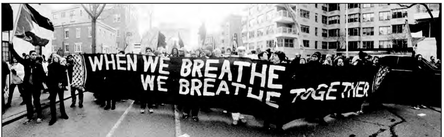
New York en solidaridad con la juventud y los trabajadores: “Cuando nosotros respiramos, respiramos juntos”