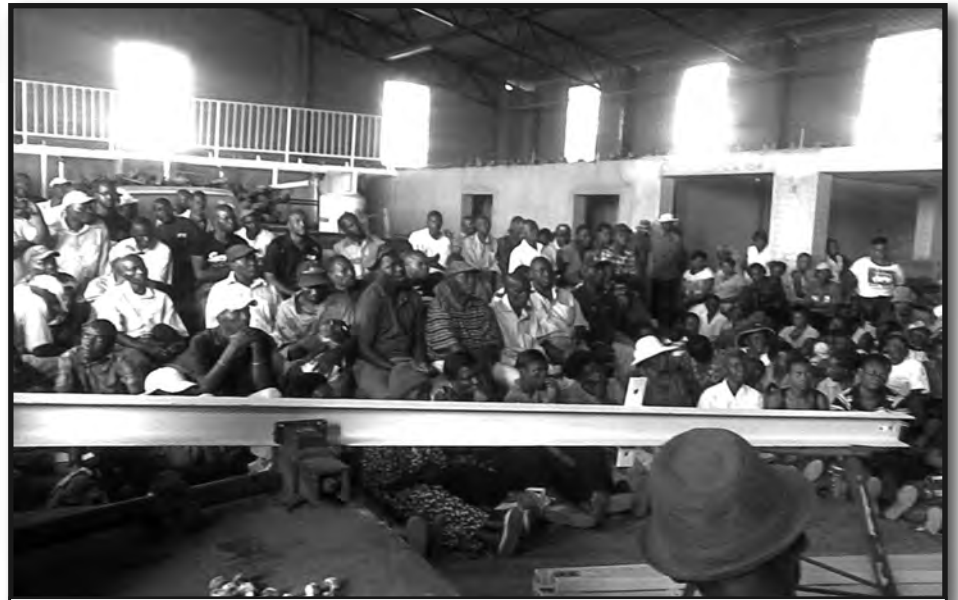
Reunión del Comité de Huelga Unificada de los trabajadores Zimbabwe

¡Continuaremos pidiendo justicia por el acribillamiento despiadado de Brown en Ferguson!