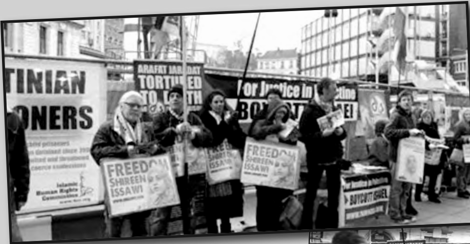
Mitin en LONDRES