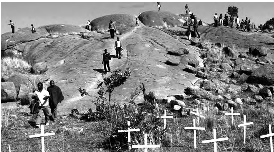
16/8/2014. Cruces de los mineros asesinados en Sudáfrica en 2013