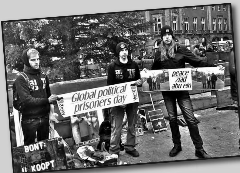
Mitin en HOLANDA