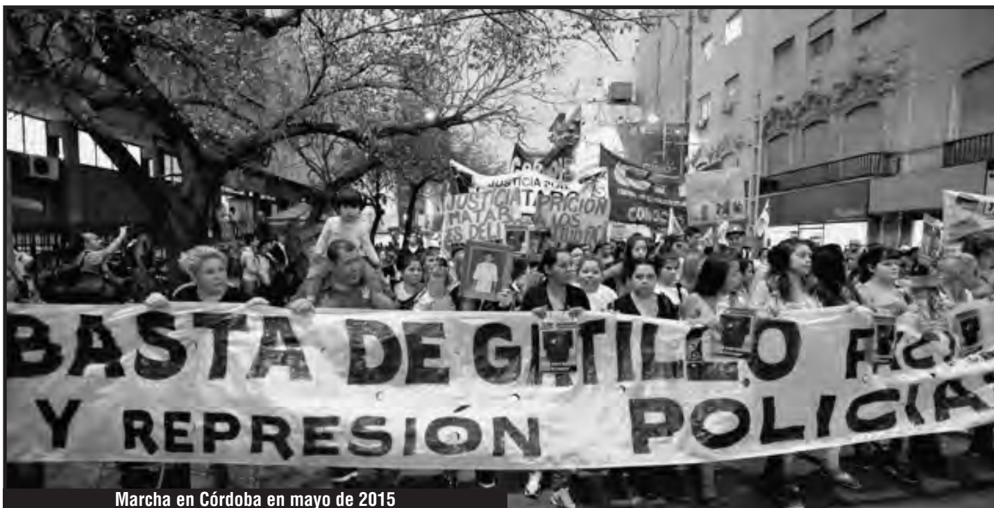
Marcha en Córdoba en mayo de 2015

Sabemos que policía de De la Sota redoblado la militarización en los barrios obreros de Córdoba con