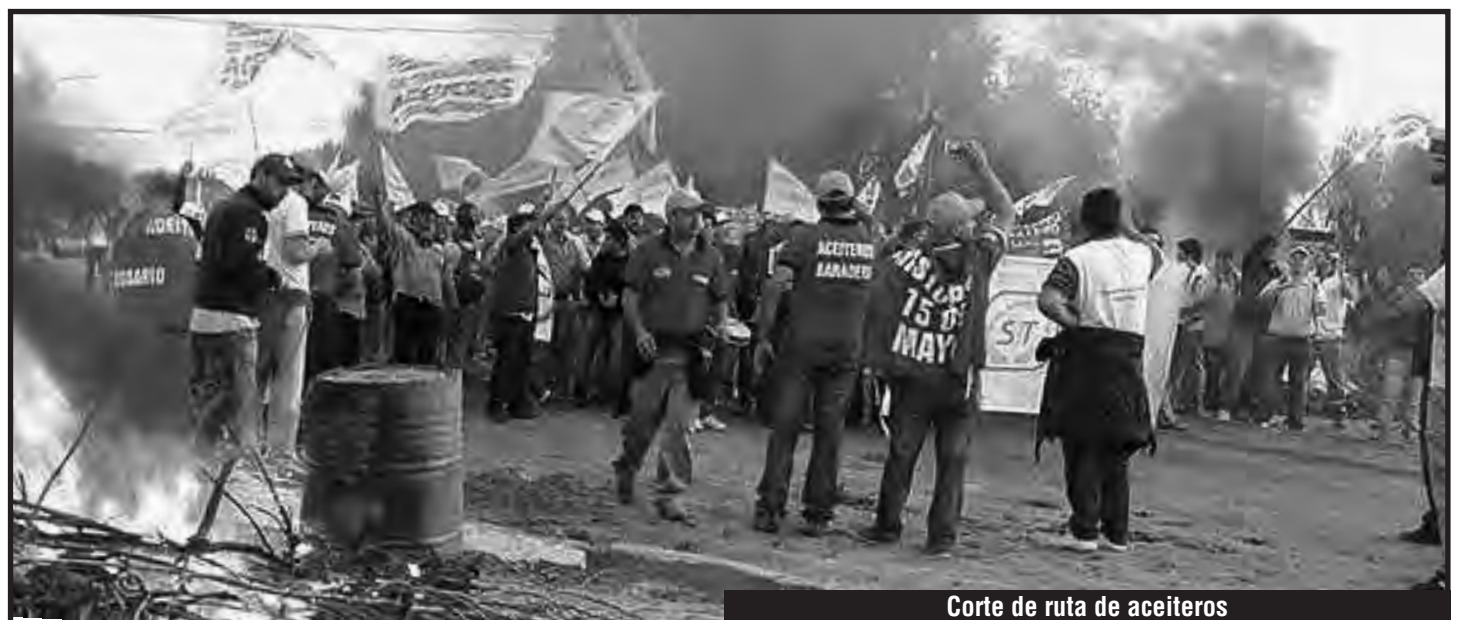
Corte de ruta de aceiteros

D.O.: ¿Cuál es la importancia del puerto de San Lorenzo?