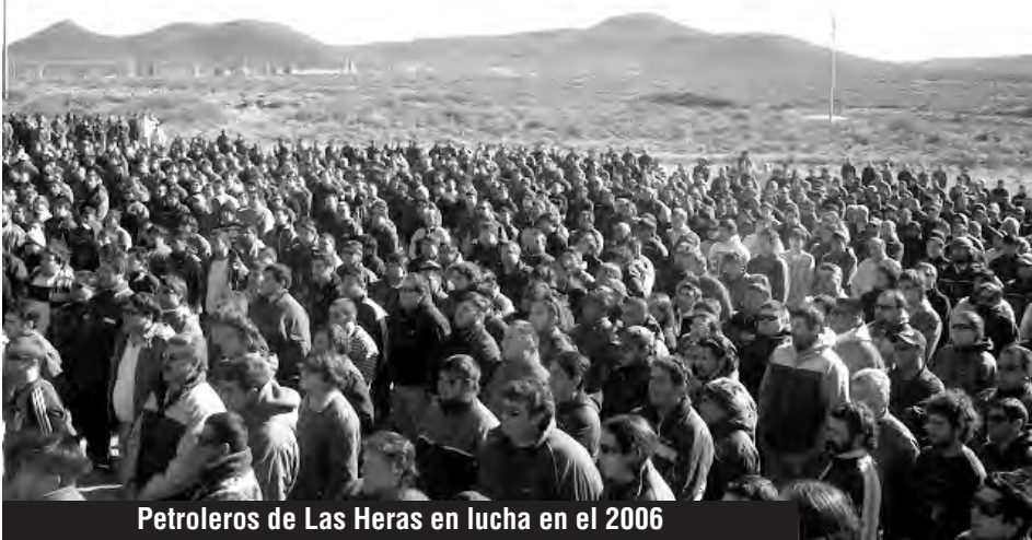
Petroleros de Las Heras en lucha en el 2006

Reproducimos a continuación un comunicado de la Comisión de Trabajadores Condenados, Familiares y Amigos de Las Heras.