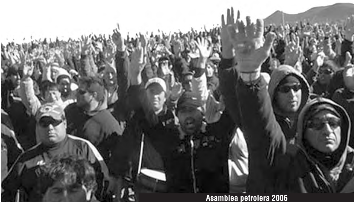
Asamblea petrolera 2006

¡Paso a las asambleas! ¡Paso a la democracia directa! ¡La base de INDUS expulsa a los buchones y vota como delegados a los compañeros condenados por luchar por nuestra demanda de “todos somos petroleros” y por “a igual trabajo, igual salario!”