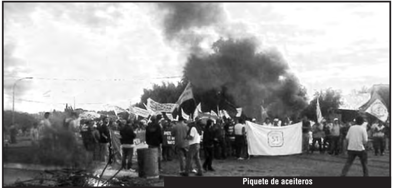
Piquete de aceiteros

Moyano y Michelli miran para otro lado y preparan un paro general recién para el 9/6 para entregárselo a la oposición gorila de Macri y Massa... Mientras, hoy nos hacen luchar a todos por separado