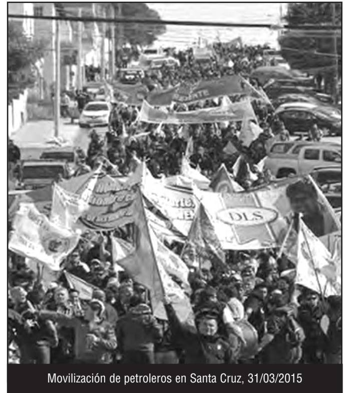
Movilización de petroleros en Santa Cruz, 31/03/2015

Pida el Organizador Obrero Internacional Vea: www.flti-ci.org