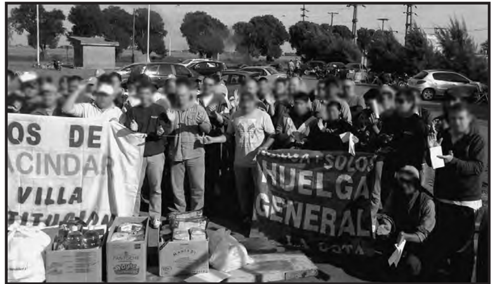
Desde el piquete de huelga que bloquea la planta de Louis Dreyfuss, en General Lagos, Santa Fe, al borde del Paraná...

¡Su lucha es la de todo el movimiento obrero, no puede quedar aislada! ¡Allí se lucha por 42 por ciento y 15000 de mínimo vital y móvil para todo el movimiento obrero! Ese es el camino para conquistar la huelga ¡Si ganan los aceiteros, rompemos el techo salarial de las paritarias truchas firmadas por Caló y la burocracia sindical y ganamos todos! ¡Hoy somos todos aceiteros!