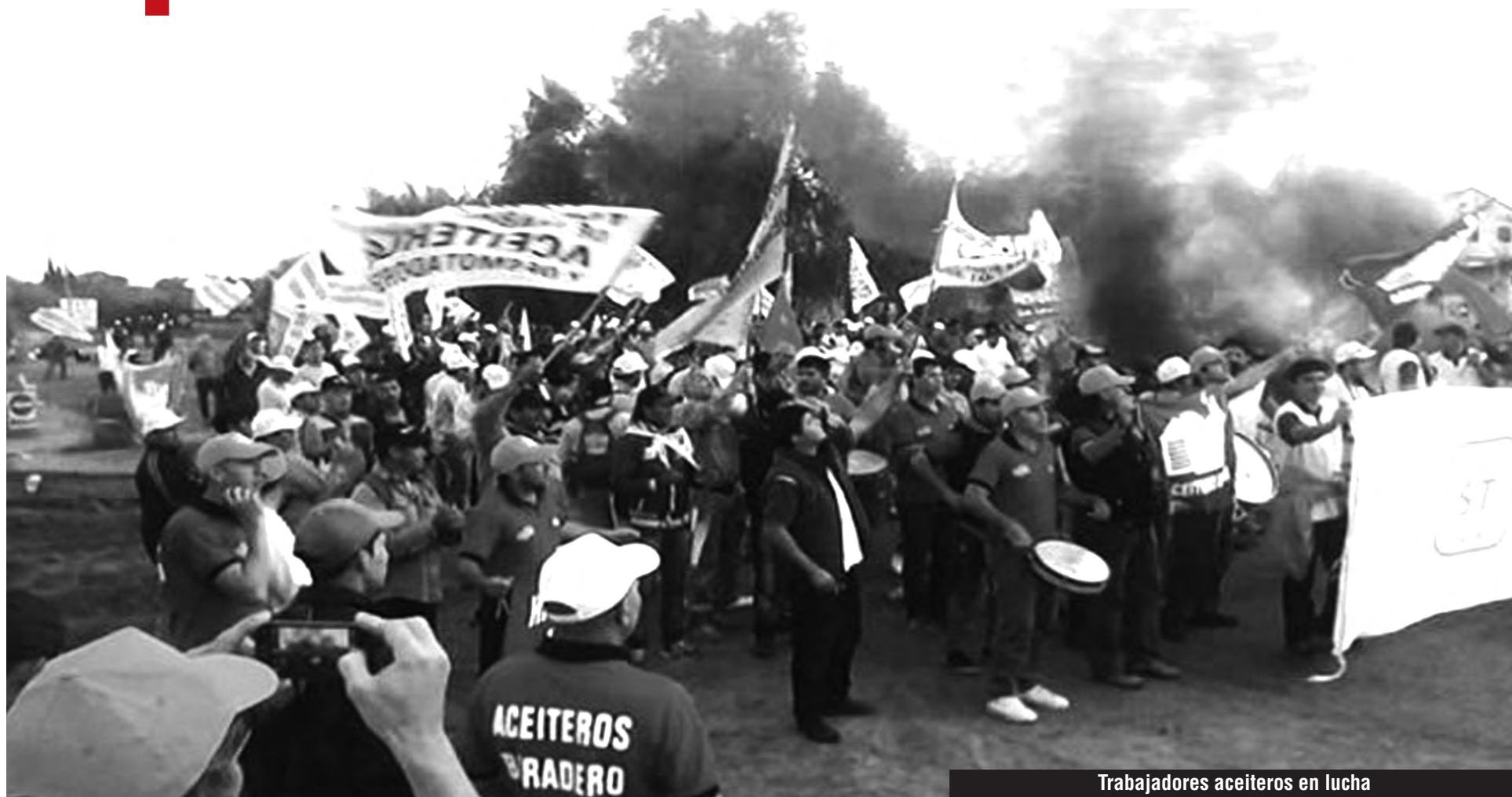
Trabajadores aceiteros en lucha

Enviemos a los piquetes y cortes de rutas de los compañeros delegados de los gremios en lucha y de las organizaciones obreras combativas para poner en pie un