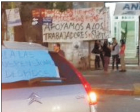
OBREROS DE CAMPANA EN CARAVANAZO REPUDIANDO SUSPENSIONES.

El 2 de mayo, la trasnacional Techint, suspende a mas de 2000 trabajadores. Chantajeando con la caída del precio del petróleo y los ataques que ésto está causando en diferentes partes del