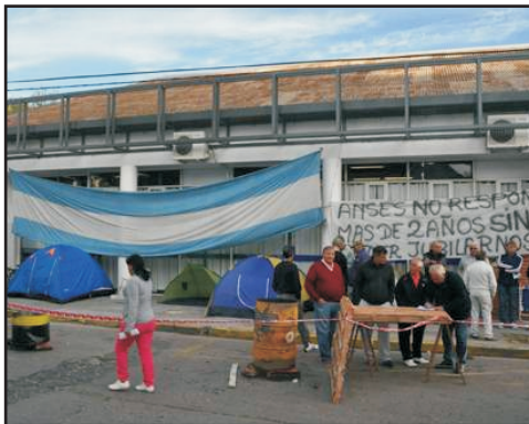
CARPA DE JUBILADOS FRENTE A ANSES SAN NICOLAS - 30 AÑOS DE APOORTE Y MAS DE 1 AÑO SIN PODER JUBILARSE

ANSES Y Después de dos años al fin varios consiguieron jubilarse.