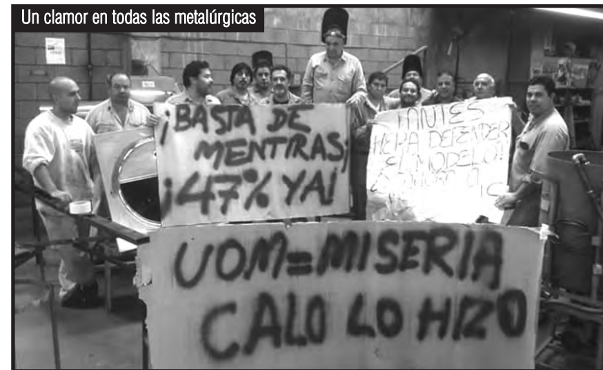
Un clamor en todas las metalúrgicas

Todos los obreros hervimos de odio ante semejante prepotencia de la patronal y queremos salir a la lucha, ya dijimos presente con el quite, pero estamos cansados de que los planes de lucha los decidan entre cuatro paredes. ¡Somos los 7000 obreros los que sacamos la producción todos los días en nuestros puestos de trabajo y queremos decidir nosotros! En los congresos de delegados no nos podemos expresar porque los delegados no llevan nuestro mandato. ¡Necesitamos un playón para poder decidir todos, los que vivimos todas las penurias en la