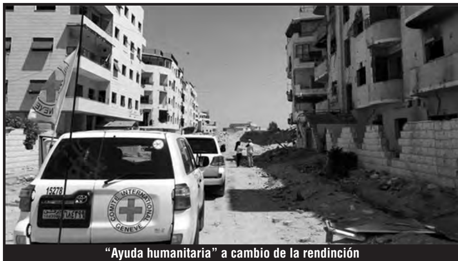
"Ayuda humanitaria" a cambio de la rendición

El asedio a este barrio ha sido brutal. Ha sido atacado incluso con armas químicas. Sin embargo la resistencia de las masas que se levantaron por el pan aun no ha cesado. Mil y una vez cercadas, han protagonizado las más duras y feroces batallas contra el régimen en el corazón de Damasco. Se han convertido para toda la vanguardia siria en un símbolo de la lucha. Un último hecho cualitativo fue el ataque de las masas de Daraya a un aeropuerto de Damasco donde le propinaron una derrota militar a Hezbollah quien perdió a uno de sus más altos generales, Mustafa Badr al-Din.