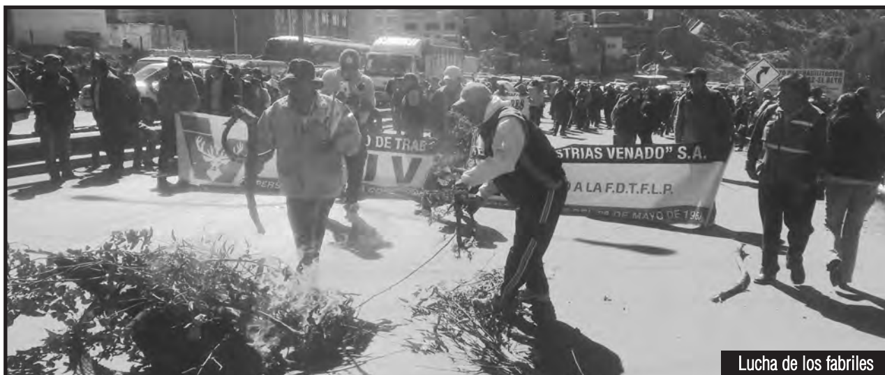
Lucha de los fabriles

Como refracción de los golpes de la crisis económica mundial y su nuevo pre infarto, en Bolivia hay una disminución de los ingresos al estado de la renta minera y de hidrocarburos por la caída de los precios internacionales de estos commodities. Así, la recaudación efectiva 2016 por la renta hidrocarburífera ha disminuido un 53%, es decir, algo más de la mitad. Esto ha llevado a que el reparto de la renta a las gobernaciones y alcaldías también se reduzcan, por lo que ya están planeando la rebaja del presupuesto a la educación, la salud, la jubilación, miserables salarios obreros y el intento de cierre de