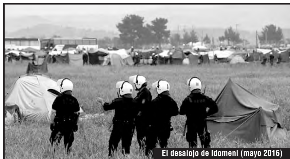
El desalojo de Idomeni (mayo 2016)