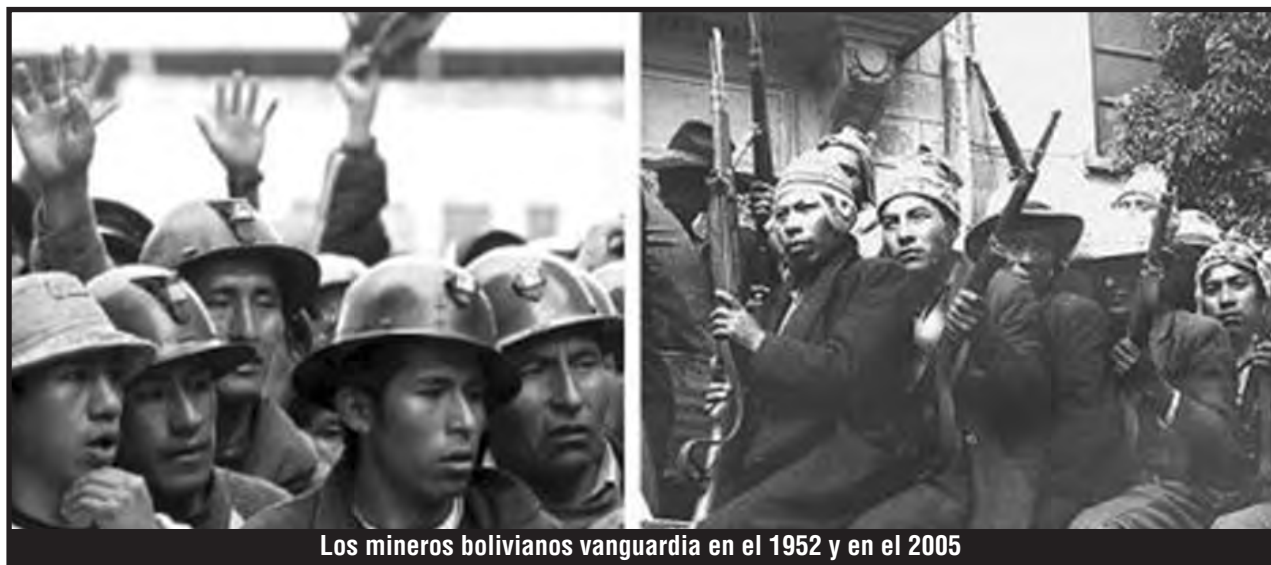
Los mineros bolivianos vanguardia en el 1952 y en el 2005

LIGA SOCIALISTA DE LOS TRABAJADORES INTERNACIONALISTAS DE BOLIVIA