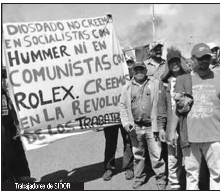
Trabajadores de SIDOR