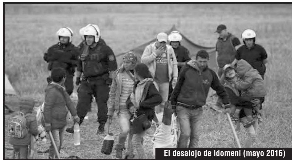
El desalojo de Idomeni (mayo 2016)