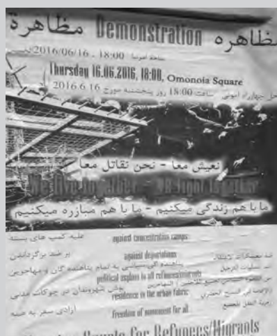
Afiche del llamado a la movilización