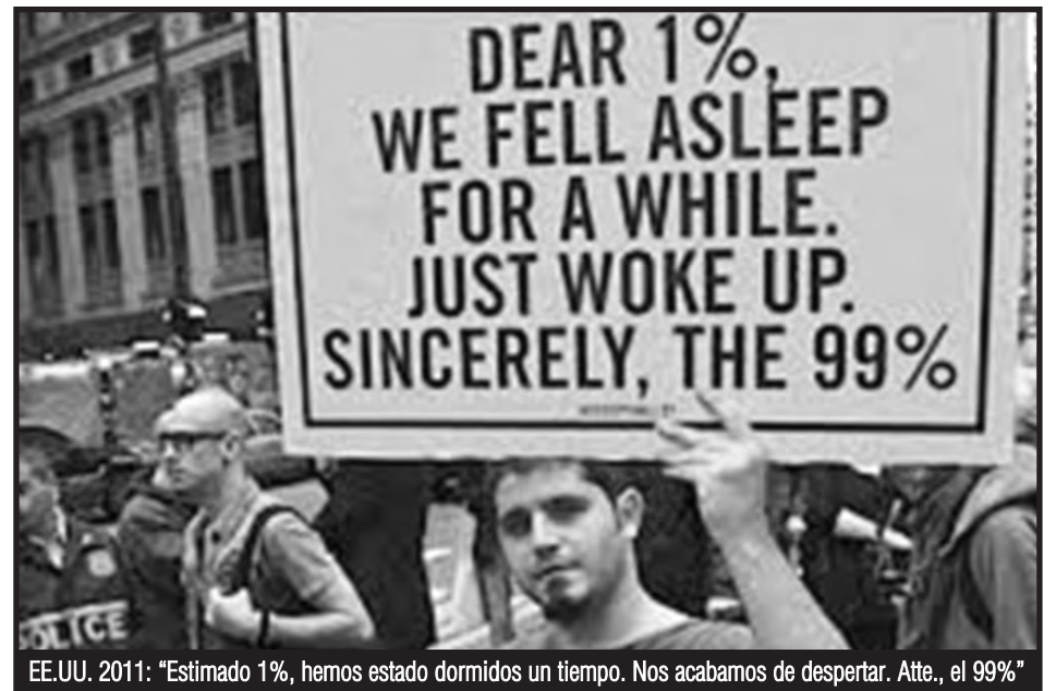
EE.UU. 2011: "Estimado 1%, hemos estado dormidos un tiempo. Nos acabamos de despertar. Atte., el 99%"

Nada nuevo. Ayer los K subsidiaban a la patronal negrera, indemnizaron con 6.000 millones de dólares a los saqueadores de la Repsol, que saqueó el petróleo de YPF y la Argentina durante 30 años, hoy Macri sigue subsidiando a las petroleras garantizándole el barril a 40 dólares cuando en el mercado mundial está en 75 ¿De dónde sale esta plata? del