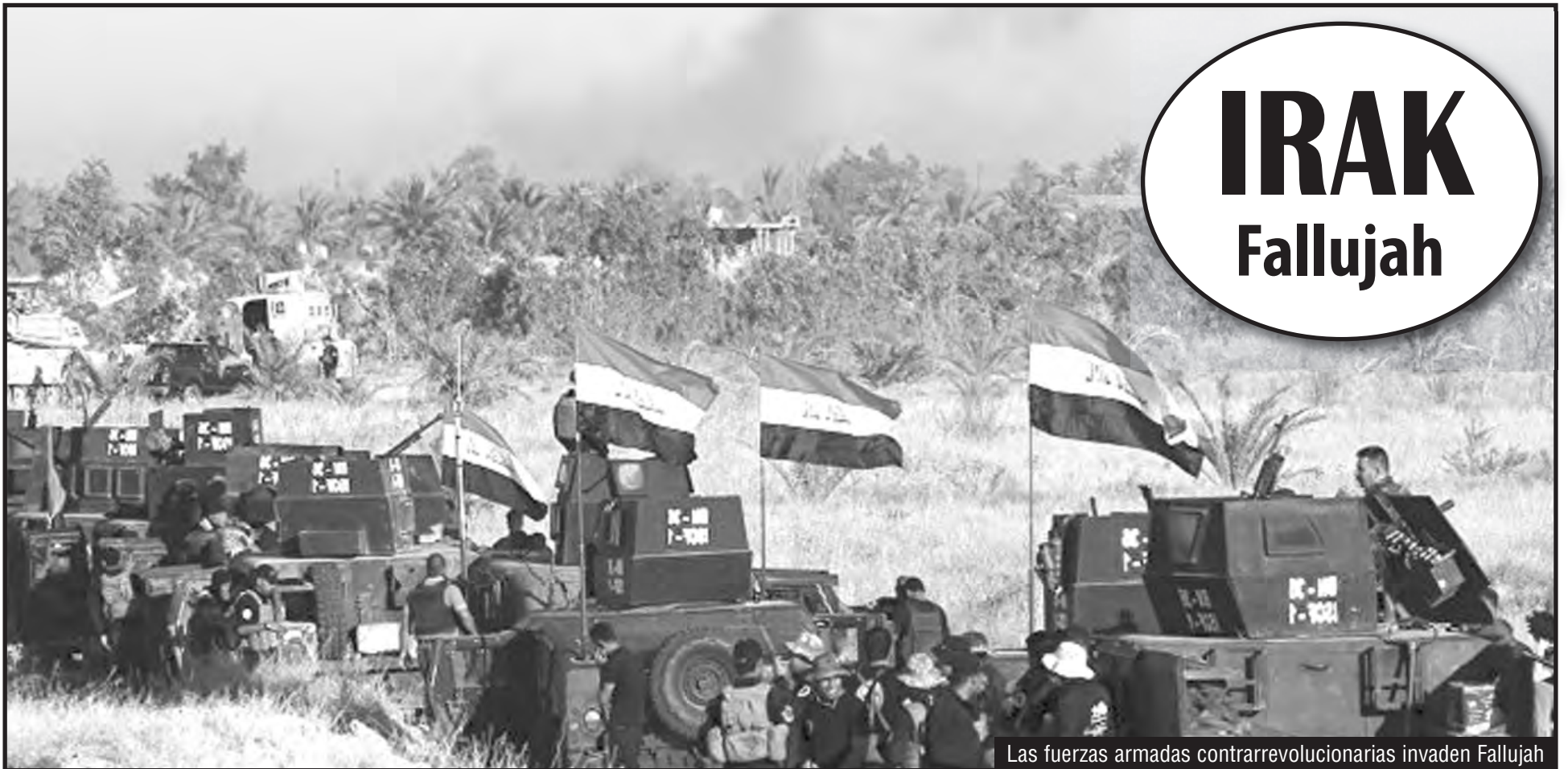
Las fuerzas armadas contrarrevolucionarias invaden Fallujah