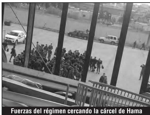
Fuerzas del régimen cercando la cárcel de Hama

Sin embargo, la ONU, por medio de sus organismos de "derechos humanos", intervino como "mediador" planteando que ha todo aquel que no tuviese una causa legal abierta se lo dejara en libertad. Así dividió a los luchadores que se encontraban unidos en pleno control de la cárcel central de Hama, puesto que el 90% no tenía en aquel momento una causa legal, pero todos estaban insurreccionados defendiendo al 10% que sí la tenía y