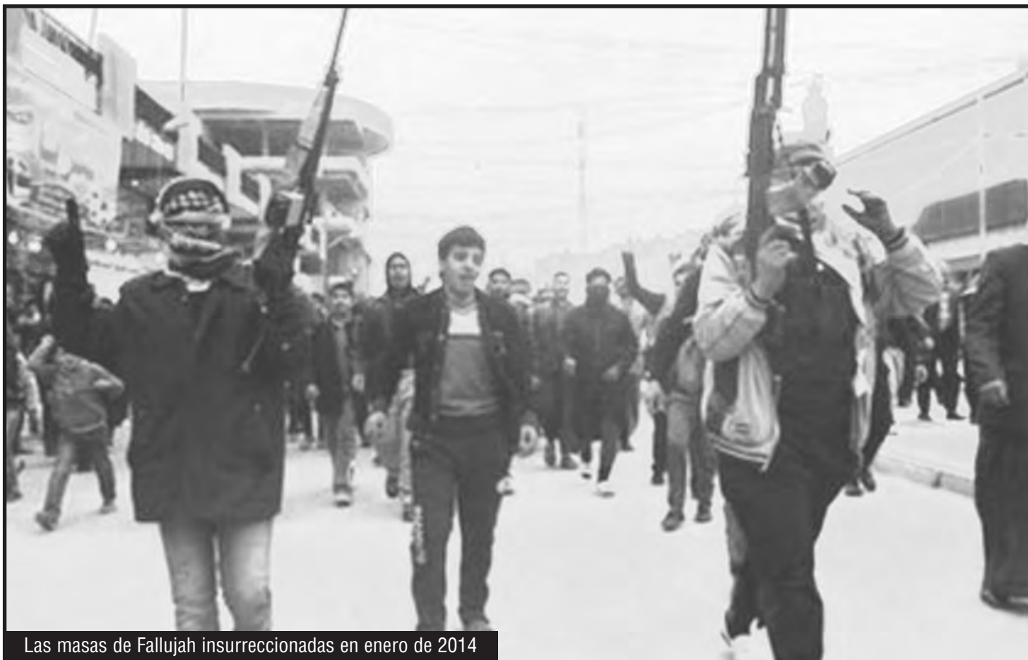
Las masas de Fallujah insurreccionadas en enero de 2014

Y mientras estas son masacradas, la burguesía que se ha montado sobre su lucha hace negocios. Porque son hombres de negocios de la burguesía sunnita los que controlan el ISIS. Ellos sólo negocian, y no tienen ningún problema en retirarse cuando esté firmado el acuerdo. Un ejemplo de esto fue Palmira en Siria, donde en marzo pasado el ISIS se retiró y le dejó a Bashar Al Assad el control de esa ciudad, que al ingresar impuso allí un terror 10 veces peor que el del ISIS. Ahora, en Fallujah, van más de 10 días de un enorme ataque y no han podido avanzar hacia la ciudad. Esto no es por el ISIS, sino porque las masas oprimidas son las que continúan combatiendo. A ellas es a las que las fuerzas contrarrevolucionarias necesitan aplastarlas.