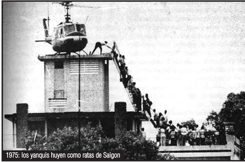
1975: los yanquis huyen como ratas de Saigón

maba con Deng Xiao Ping los pactos con Nixon que le entregaban el sudeste chino al imperialismo yanqui para que, asociado con los hijos de la burocracia en joint ventures, instalaran sus transnacionales y maquiladoras que fueron el punto de partida para una abierta restauración capitalista en China.