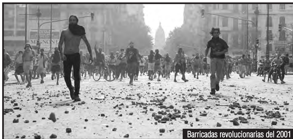
Barricadas revolucionarias del 2001

Desde los sectores que están en lucha, junto a las organizaciones obreras combativas, como la Federación de Aceiteros, el