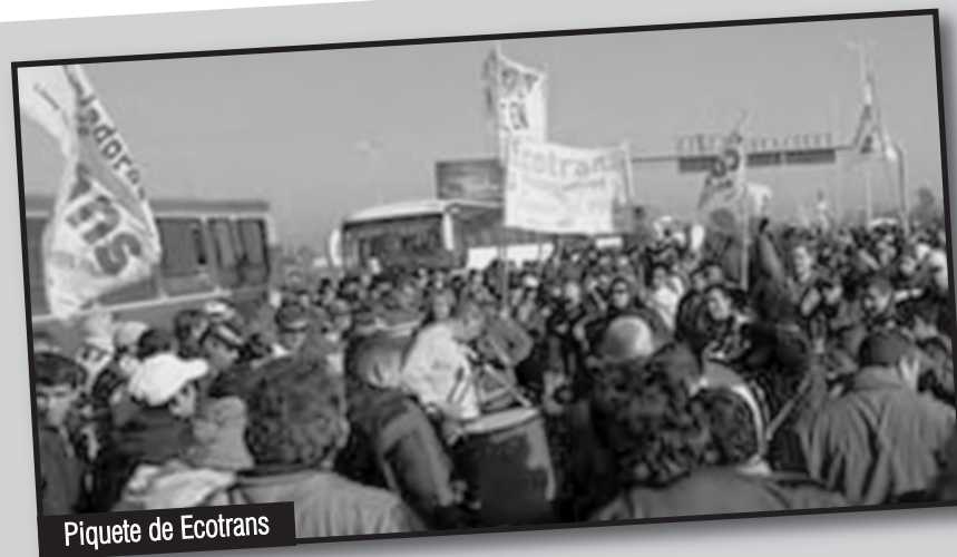
Piquete de EcoTrans

Ya están las fuerzas para derrotar la guerra que los capitalistas nos han declarado