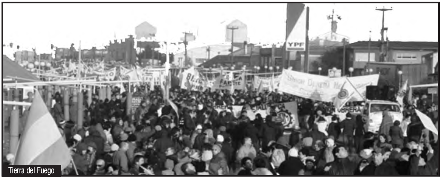
Tierra del Fuego

El gobierno de Macri avanza aquí también por el camino que le dejó tra-