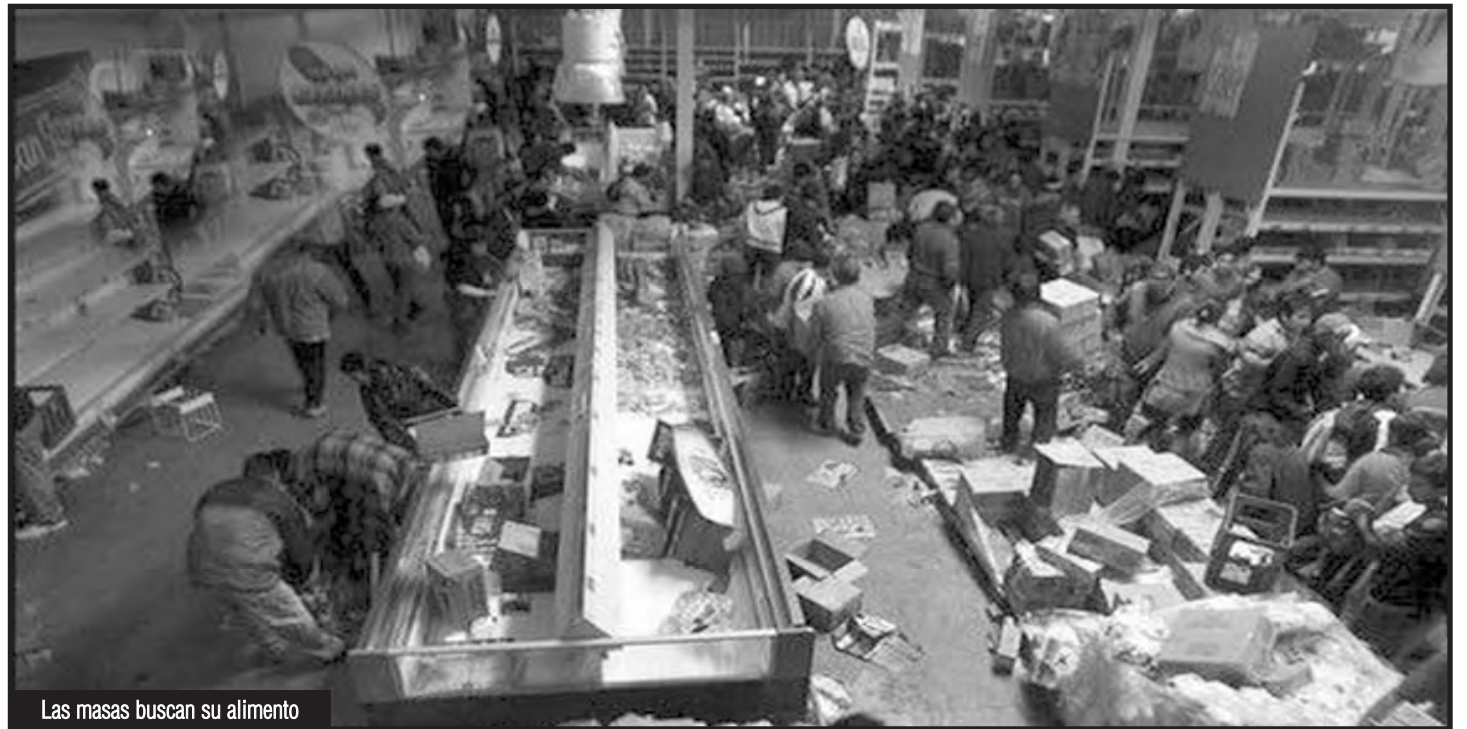
Las masas buscan su alimento

En la misma semana que la OEA se reunía de urgencia para conspirar, las masas trabajadoras de Caracas protagonizaron violentos saqueos y protestas contra el gobierno de Maduro, cansadas del hambre y la vida de penurias que les impusieron