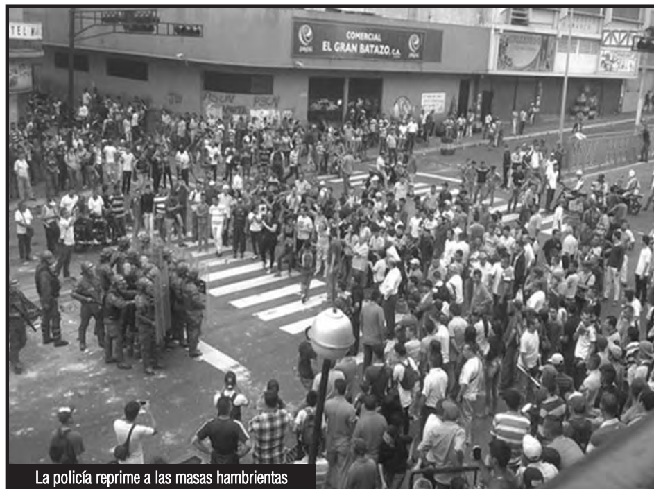
La policía reprime a las masas hambrientas

Los trabajadores deben tomar la solución de la crisis en sus manos... ¡No al pago de la deuda externa! ¡Expropiación sin pago y bajo control obrero de todos los bancos, de la cadena de comercialización de alimentos y todos los