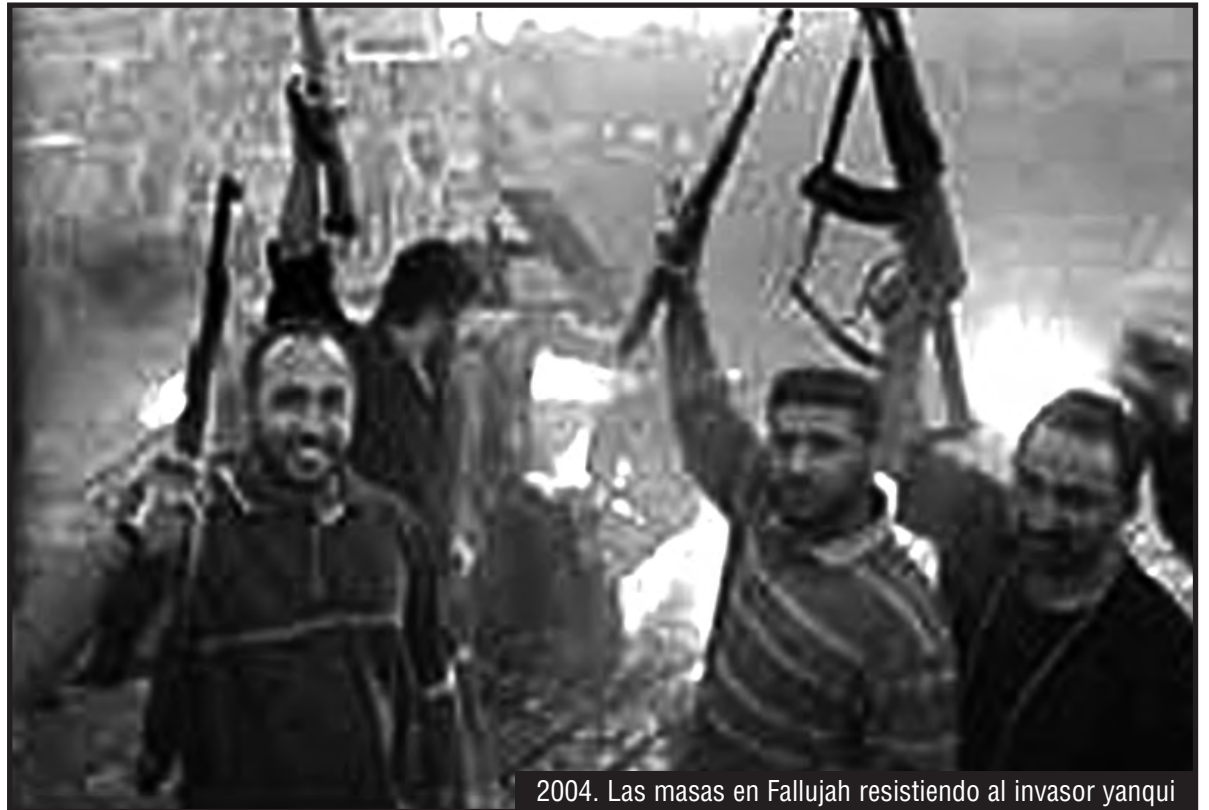
2004. Las masas en Fallujah resistiendo al invasor yanqui

En el 2004, cuando las tropas yanquis invadían Irak, Fallujah se plantó y resistió, impidiendo durante meses la entrada del ejército invasor. Fue el corazón de la resistencia contra la ocupación yanqui desde entonces. En el 2008, por el duro combate de la resistencia iraquí, y sobre todo porque la clase obrera norteamericana se había puesto de pie y luchaba contra la guerra, EEUU se ve obligado a retirar sus tropas de Irak. Inicia entonces el plan de retiro, pero para esto hizo un pacto con la burguesía chiita para que esta y sus guardias armadas ocupen el territorio iraquí como sus fuerzas gurras. La burguesía kurda también entró al acuerdo. Quedó así en Irak un régimen de un protectorado yanqui con títeres chiitas y kurdos en el gobierno y fuerzas armadas que son una extensión del ejército norteamericano.