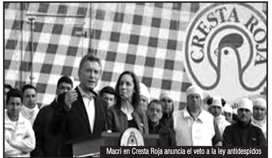
Macri en Cresta Roja anuncia el veto a la ley antidespidos

Los trabajadores necesitamos comprender que no estamos frente a un “ataque” más. Sino ante un plan esclavista de la burguesía de acoplar la economía argentina directamente bajo los dictámenes, negocios e intereses del imperialismo yanqui –sin ningún intermediario, sin libertad para que los países del subcontinente negocien por su cuenta, sin