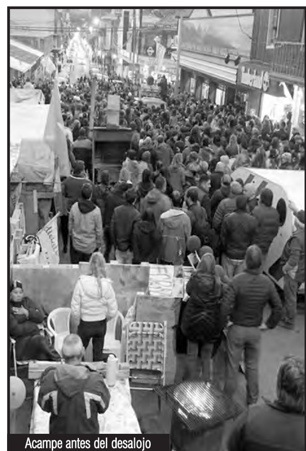
Acampe antes del desalojo

La clase obrera y los explotados tienen por delante un combate decisivo contra el gobierno de Macri y todos los políticos y jueces patronales entregadores de la nación, porque en esos miles de millones de dólares que fugan los bancos y las transnacionales, en los subsidios a las grandes petroleras y en los pagos de la fraudulenta deuda externa, en la enorme masa de plusvalía que las patronales le arrancan a la clase obrera... está la plata para mejorar las condiciones de vida de los explotados, comenzando por las mujeres obreras y la juventud que son tratados como mano de