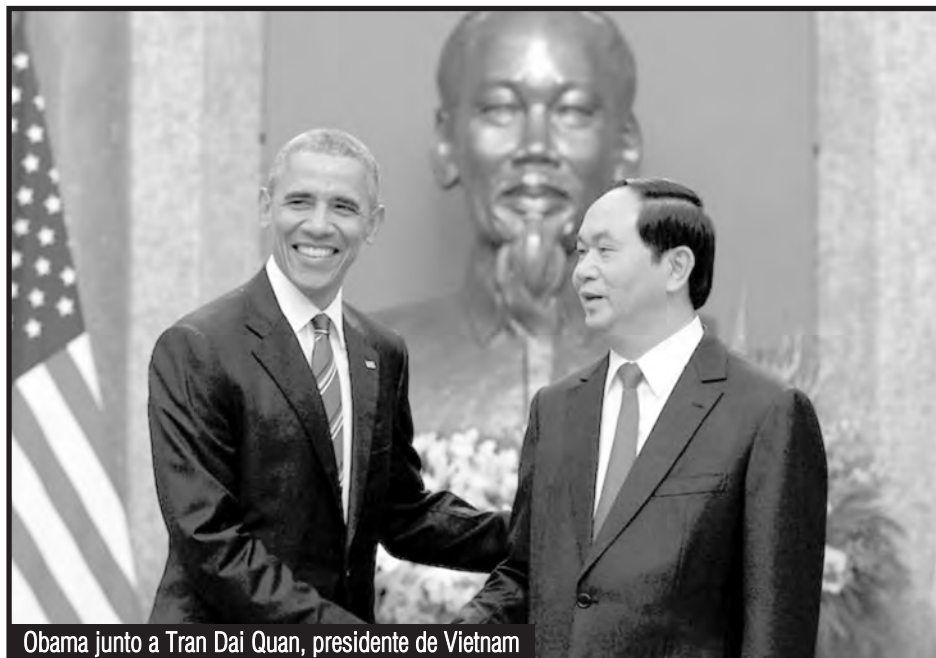
Obama junto a Tran Dai Quan, presidente de Vietnam

La revolución vietnamita y cubana tuvieron una enorme solidaridad activa por parte de toda la clase obrera mundial en los '60 y en los '70. Ellas fueron bandera de lucha revolucionaria de millones de jóvenes y trabajadores del mundo. El stalinismo, que jamás quiso que estas revoluciones llegaran tan lejos, ni bien se sacó de encima la presión revolucionaria de las masas, fue el más grande conspirador contra la victoria de las revoluciones socialistas en esos países. Es