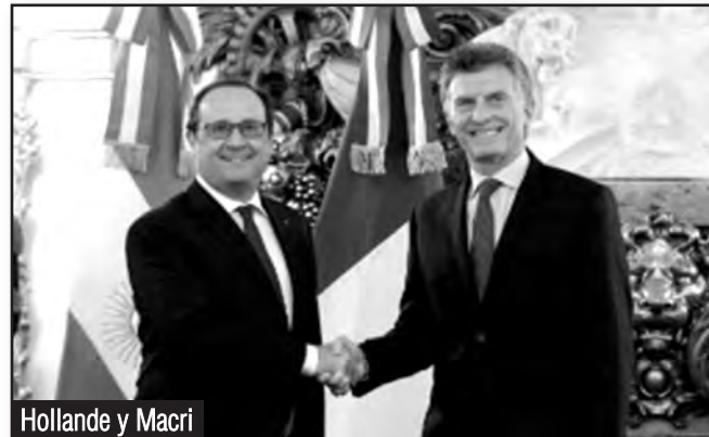
Hollande y Macri