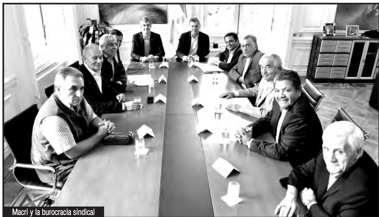
Macri y la burocracia sindical

En Tierra del Fuego se define el futuro inmediato del conjunto del movimiento obrero, pues si pasan las leyes antiobreras en esa provincia se profundizará el ataque que ya está en curso contra todos los explotados argentinos. Esta lucha y el combate contra las petroleras imperialistas y los "pagadores seriales" al FMI como Macri y los kirchneristas, es una pelea que la clase obrera debe encabezar a lo largo y ancho de todo el país. La base de los 22 gremios fueguinos en lucha está exhausta y clama ayuda, demanda en su auxilio que se sumen urgentemente más sectores de la clase obrera de la isla, de toda la Patagonia y del país. Ya no solamente se trata de ir con delegaciones a Tierra del Fuego, las cuales son siempre bienvenidas para recibir