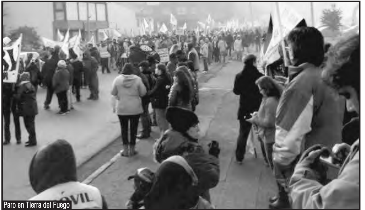
Paro en Tierra del Fuego

Por eso ya mismo desde las asambleas de base de todos los gremios debe salir una moción unitaria de lucha que contenga una salida obrera a la crisis y que le haga pagar los “platos rotos” a los capitalistas y su estado. Los docentes, los estatales, los jubilados, los obreros petroleros, portuarios, camioneros y metalúrgicos necesitan hoy más que nunca la unidad de sus filas para ponerle el pie en el pecho a la gorila y represora Bertone y a todos los gerentes de las ensambladoras y petroleras que nos han declarado la guerra. ¡Son ellos o nosotros! ¡Si ganan Bertone y los capitalistas, van a transformar a Tierra del Fuego en una cárcel como lo era a fines del siglo XIX y principio del siglo XX! Muchos vamos a tener que partir y abandonar la provincia, mientras los que puedan quedarse van a ser utilizados como obreros esclavos al servicio de la base militar que los yanquis buscan abrir al sur del continente para custodiar las ganancias de sus empresas y grandes bancos.