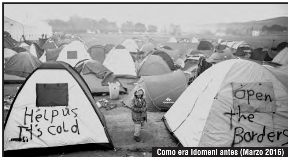
Como era Idomeni antes (Marzo 2016)

Al irse de Idomeni exclamaban: “¡Queremos comer, no somos animales, queremos ir a Alemania! ¿Dónde está la Merkel y la UE?” Los refugiados no se rinden y siguen peleando por vivir en condiciones humanas, puesto que como ellos denuncian, son tratados como animales.