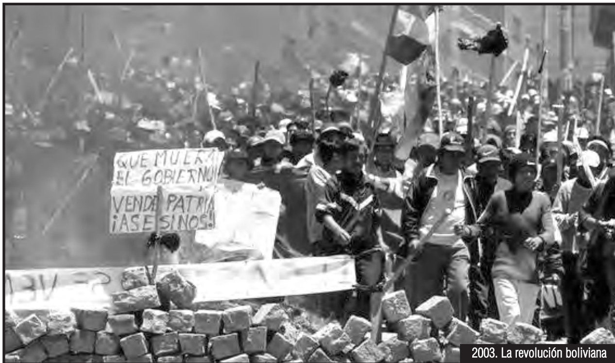
2003. La revolución boliviana

Mientras la patronal le quiere hacer caer su crisis fábrica por fábrica a los obreros, los trabajadores respondemos que no nos interesa la crisis de los capitalistas