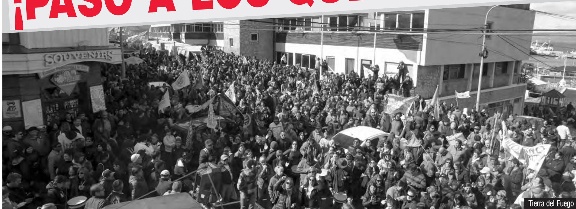
Tierra del Fuego