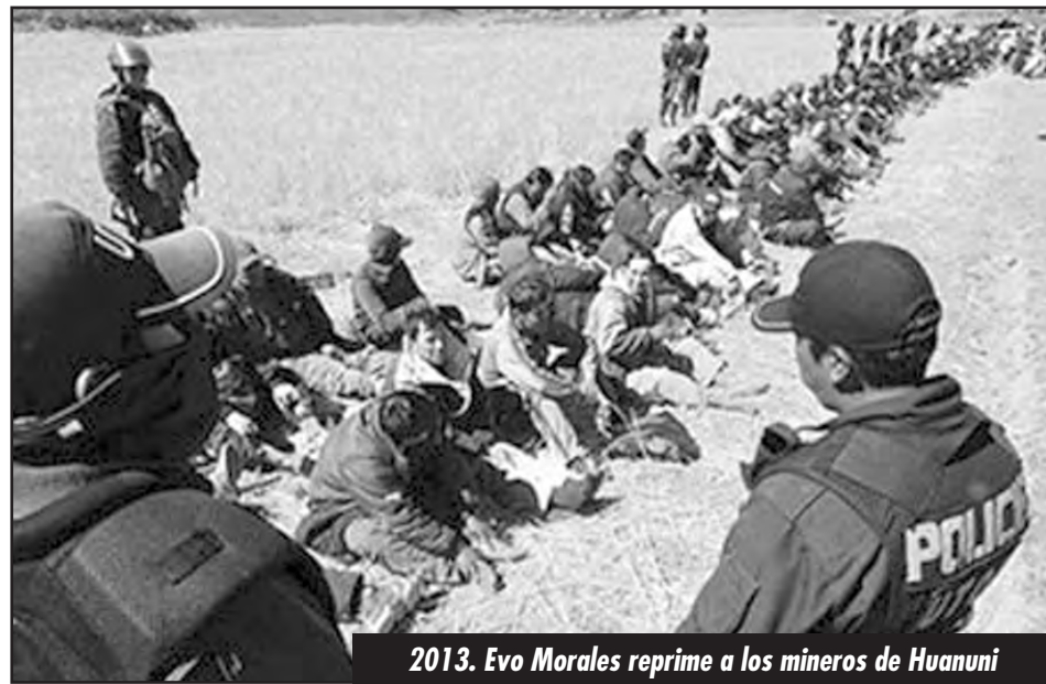
2013. Evo Morales reprime a los mineros de Huanuni

El movimiento obrero boliviano no se merece la dirección que tiene a su frente. Es al revés de lo que dice el POR que afirma que los mineros le "vendieron su alma al diablo", cuando hace años que el POR es el más grande sostenedor del capitalismo en Bolivia y el principal responsable de la traición de la revolución del '52, bajo la dirección del pablismo y demás liquidadores de la IV Internacional... eso sí, en nombre de la "dictadura del proletariado" para mejor engañar a la clase obrera. Ya hace rato que el POR perdió toda "alma" y