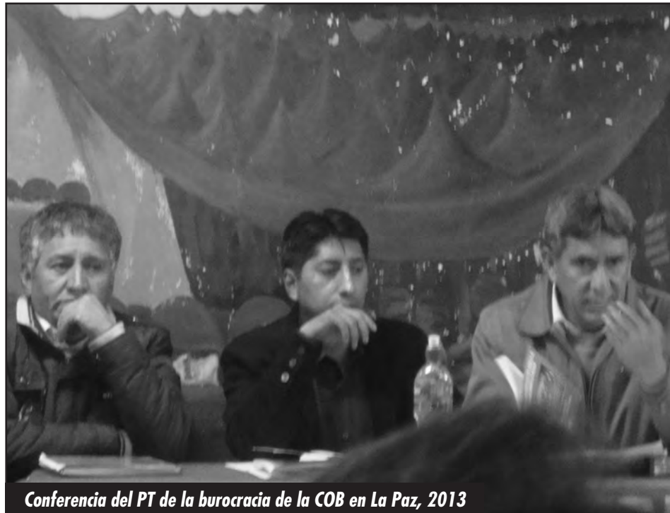
Conferencia del PT de la burocracia de la COB en La Paz, 2013

¿Y la LOR-CI no aparece por Huanuni? No, claro, tendría que explicar que los animadores de su PT de la COB están soste-