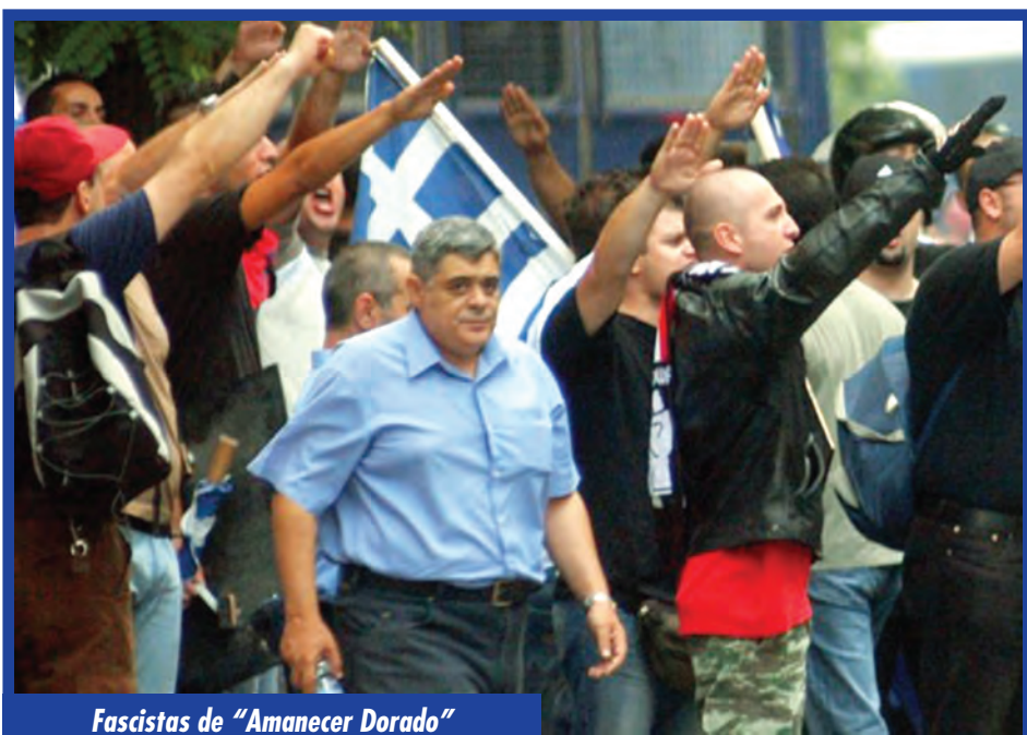
Fascistas de "Amanecer Dorado"