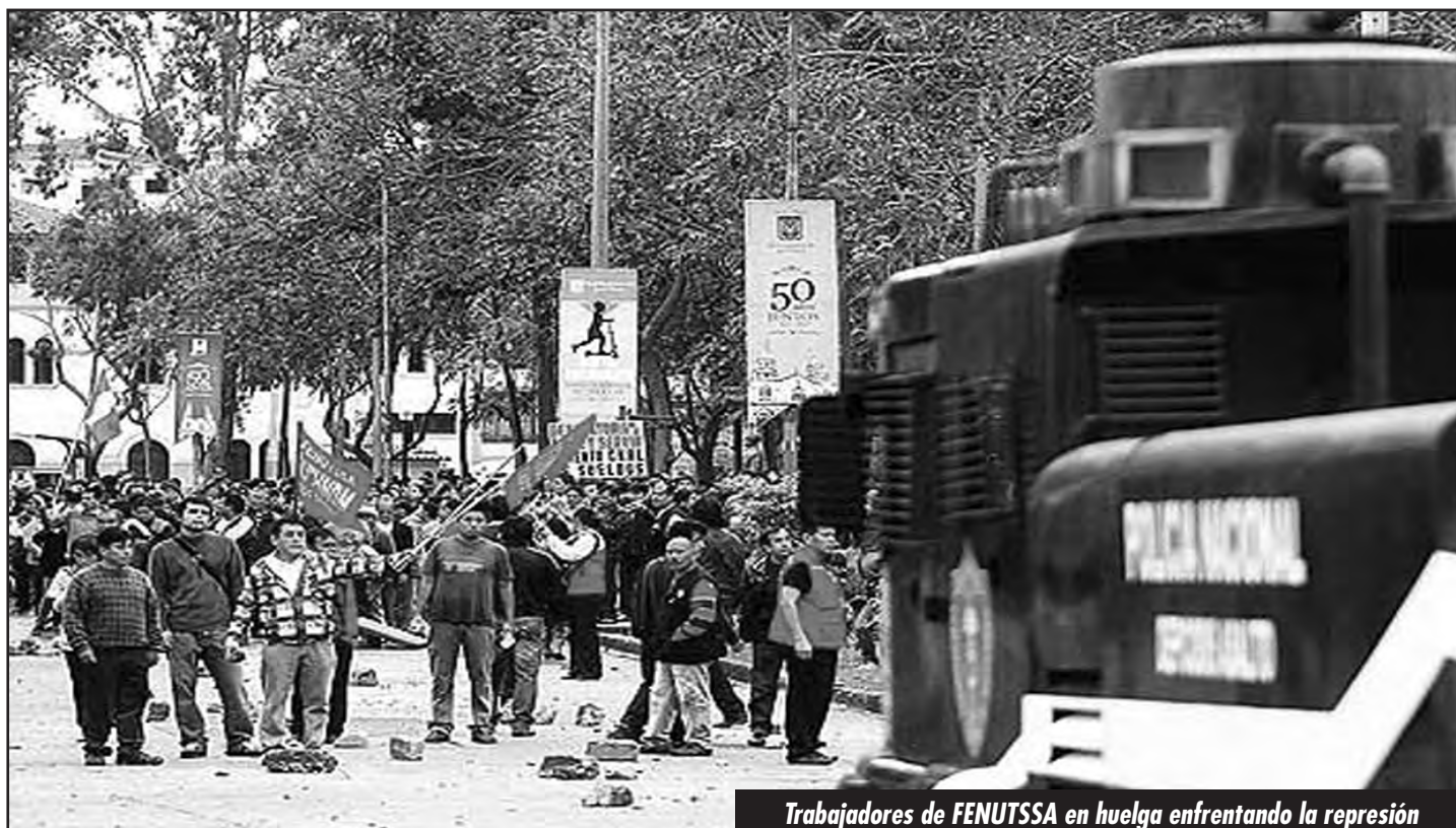
Trabajadores de FENUTSSA en huelga enfrentando la represión

A fin de octubre, en el próximo sueldo cobramos los días de huelga,