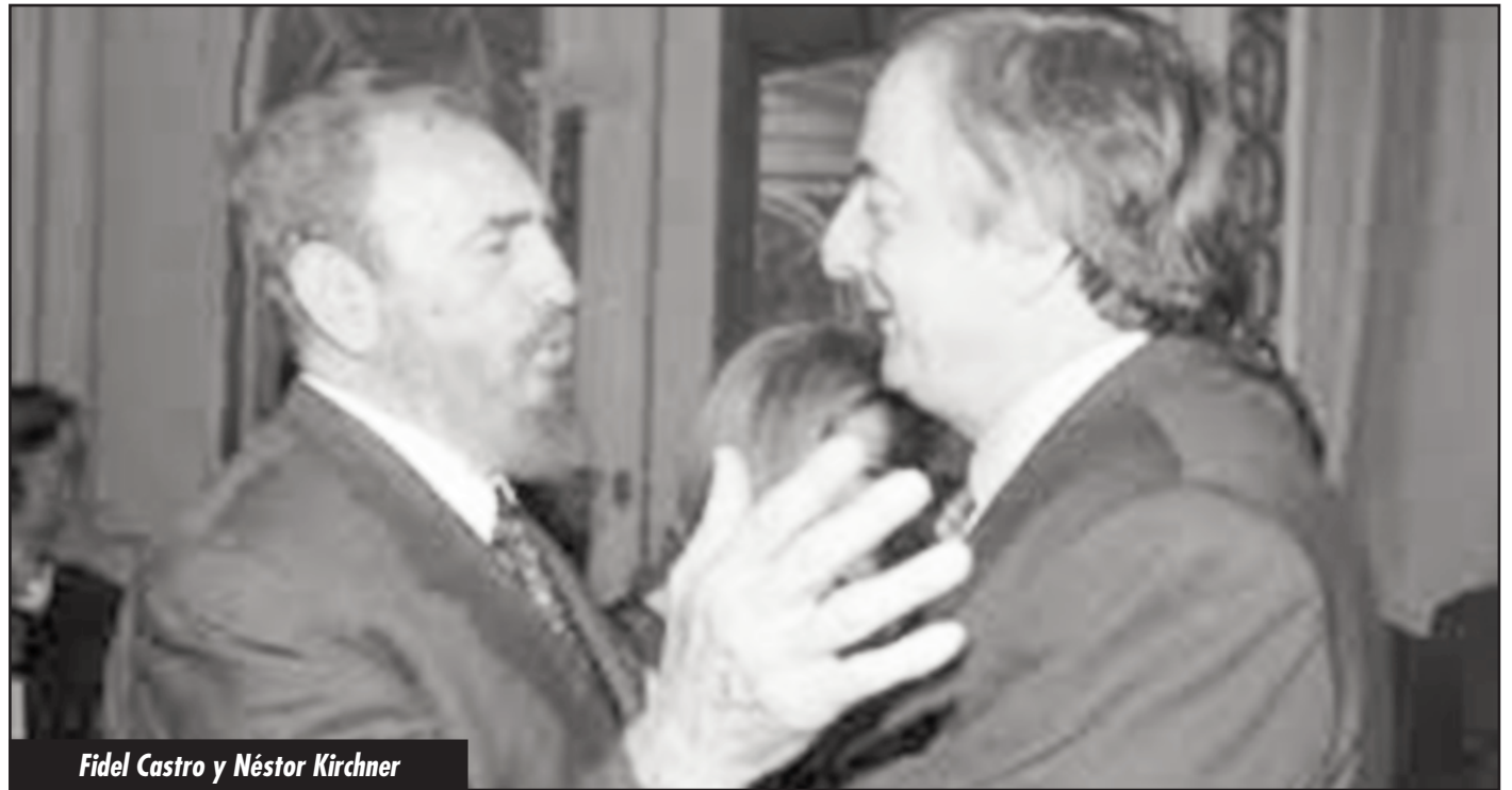
Fidel Castro y Néstor Kirchner

La misma Cuba ya no "reparte". Es entregada a los capitalistas y al imperialismo por los hermanos Castro. Con mercados regionales como el ALBA, la