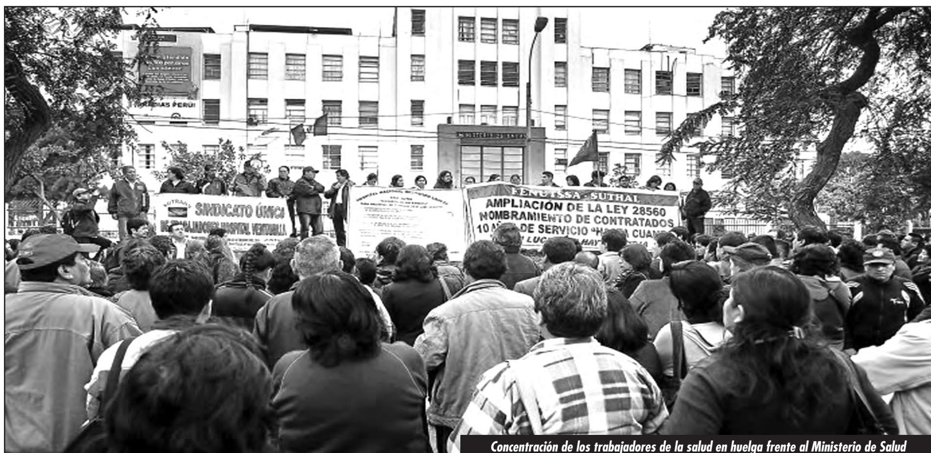
Concentración de los trabajadores de la salud en huelga frente al Ministerio de Salud

Como el acta firmada en el 2012 por la “vieja dirección” de la FENUTSSA, la actual directiva entregó el primer punto y el decisivo, junto al aumento de salario, por el cual salimos a la lucha: ¡Somos todos trabajadores de la salud! ¡Por la incorporación de los trabajadores administrativos en la Reforma de la Salud! ¡Contra el infame Plan Servir que nos amenaza con el despido permanente y salarios de miseria!