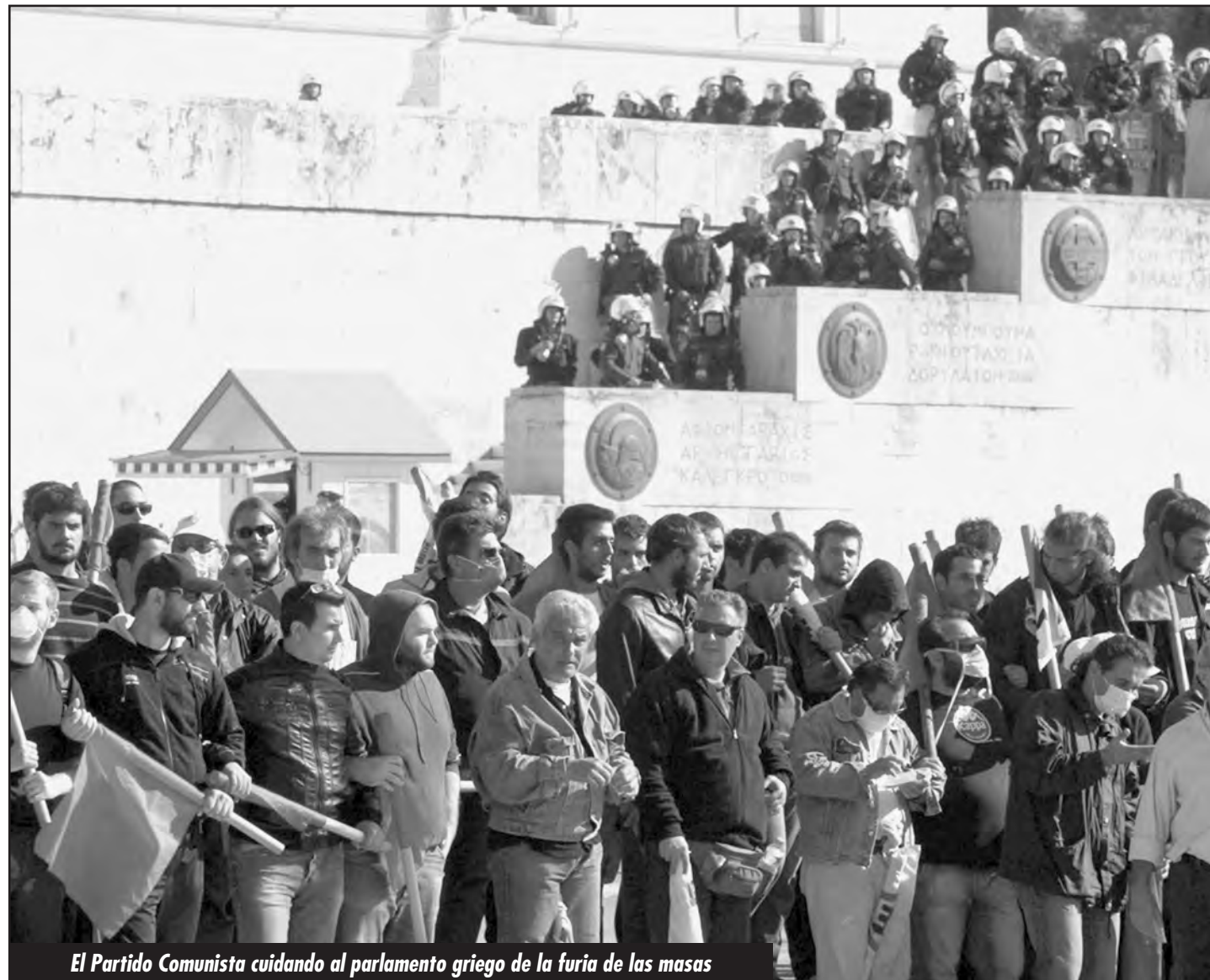
El Partido Comunista cuidando al parlamento griego de la furia de las masas

La lucha más inmediata es por la revolución socialista. No hay otro camino. Todo lo demás es una mentira. Un engaño. La clase obrera griega ha presen-