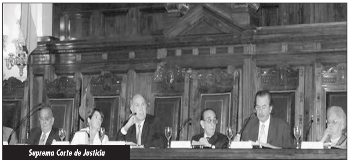
Suprema Corte de Justicia