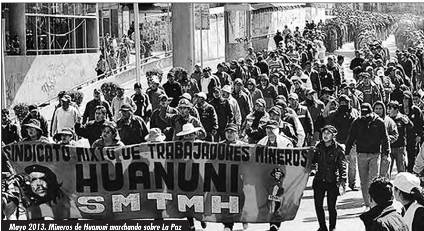
Mayo 2013. Mineros de Huanuni marchando sobre La Paz

Durante todo el 2011 los obreros fabriles de La Paz encabezaron un enorme levantamiento contra el gobierno de Morales y los traidores de la burocracia de la COB, que ya se venía gestando de años atrás. Justamente, contra Montes que dirigía la COB... La dirección de los fabriles viajó a un encuentro de organizaciones obreras latinoamericanas “combativas” en Brasil, convocado por Conlutas -Central Sindical dirigida por la LIT-. Allí los obreros fabriles fueron a plantearles a centenares de organizaciones obreras