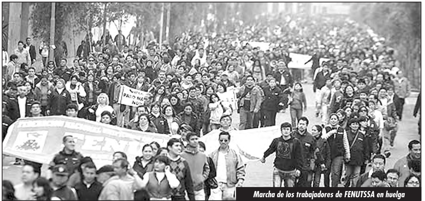
Marcha de los trabajadores de FENUTSSA en huelga