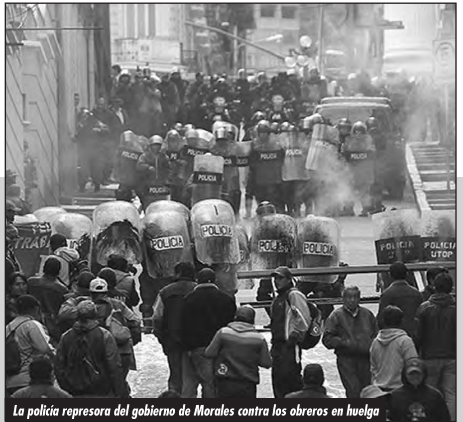
La policía represora del gobierno de Morales contra los obreros en huelga

Basta de burocracia colaboracionista, con las Tesis de Pulacayo hay que volver a poner en pie la COB revolucionaria del '52