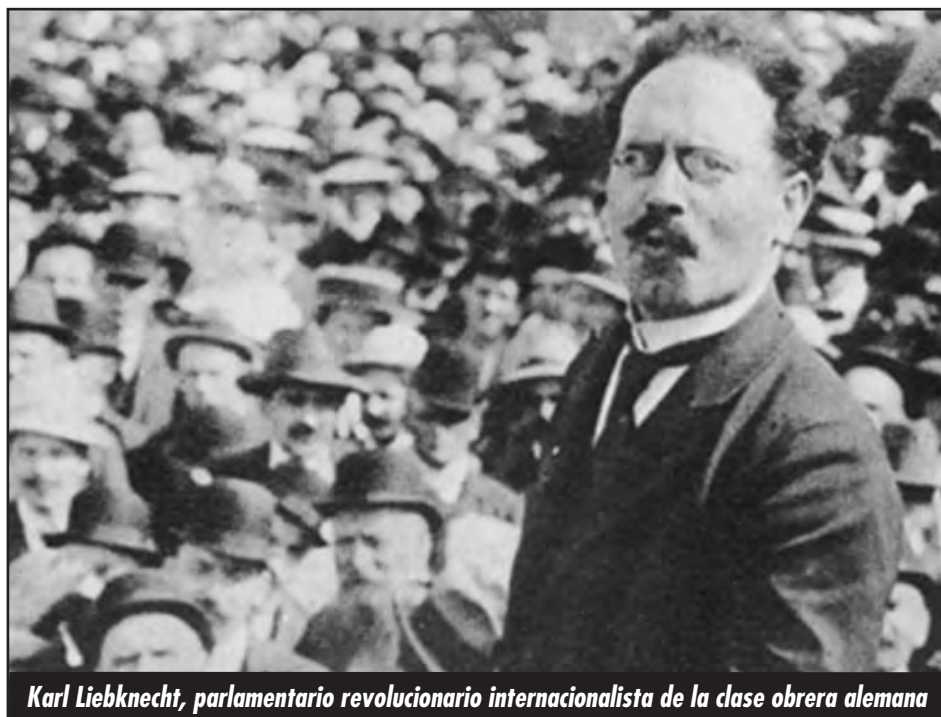
Karl Liebknecht, parlamentario revolucionario internacionalista de la clase obrera alemana

Por el contrario, los dirigentes políticos del Frente de Izquierda le han planteado a millones de explotados que en el parlamento se resolverán sus deman-