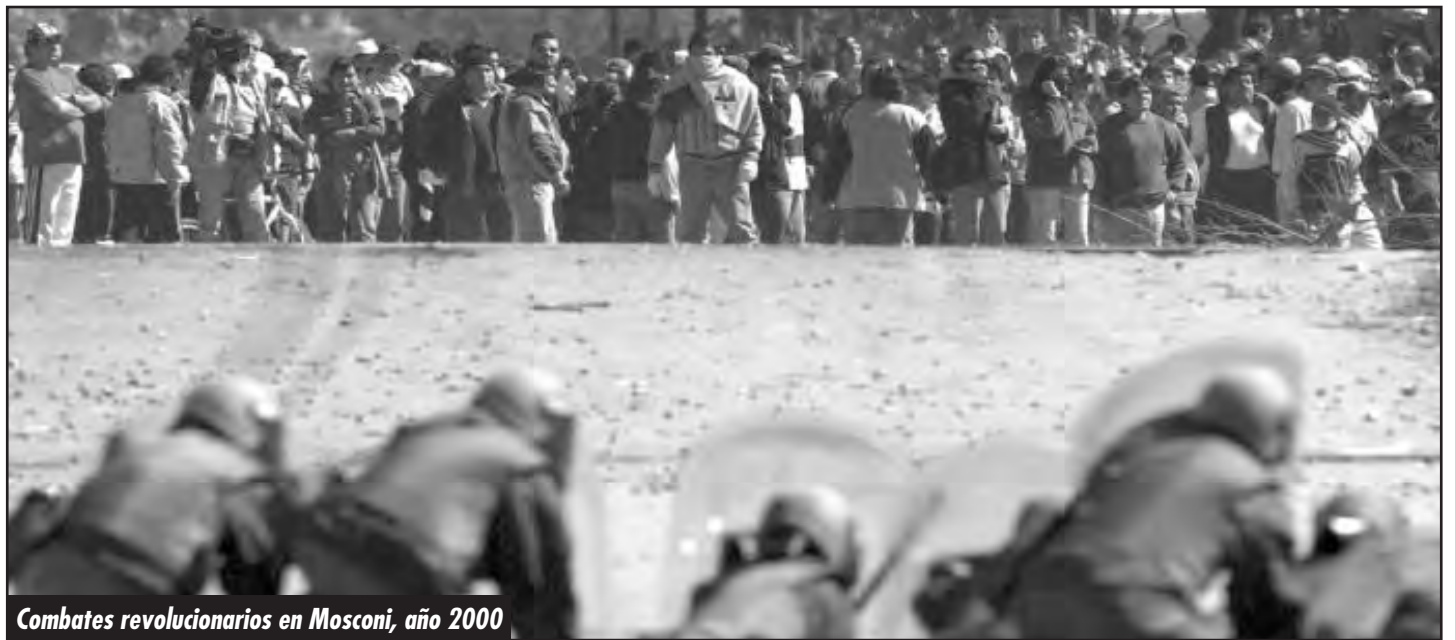
Combates revolucionarios en Mosconi, año 2000

“La fórmula política marxista, en realidad, debe ser la siguiente: Explicando