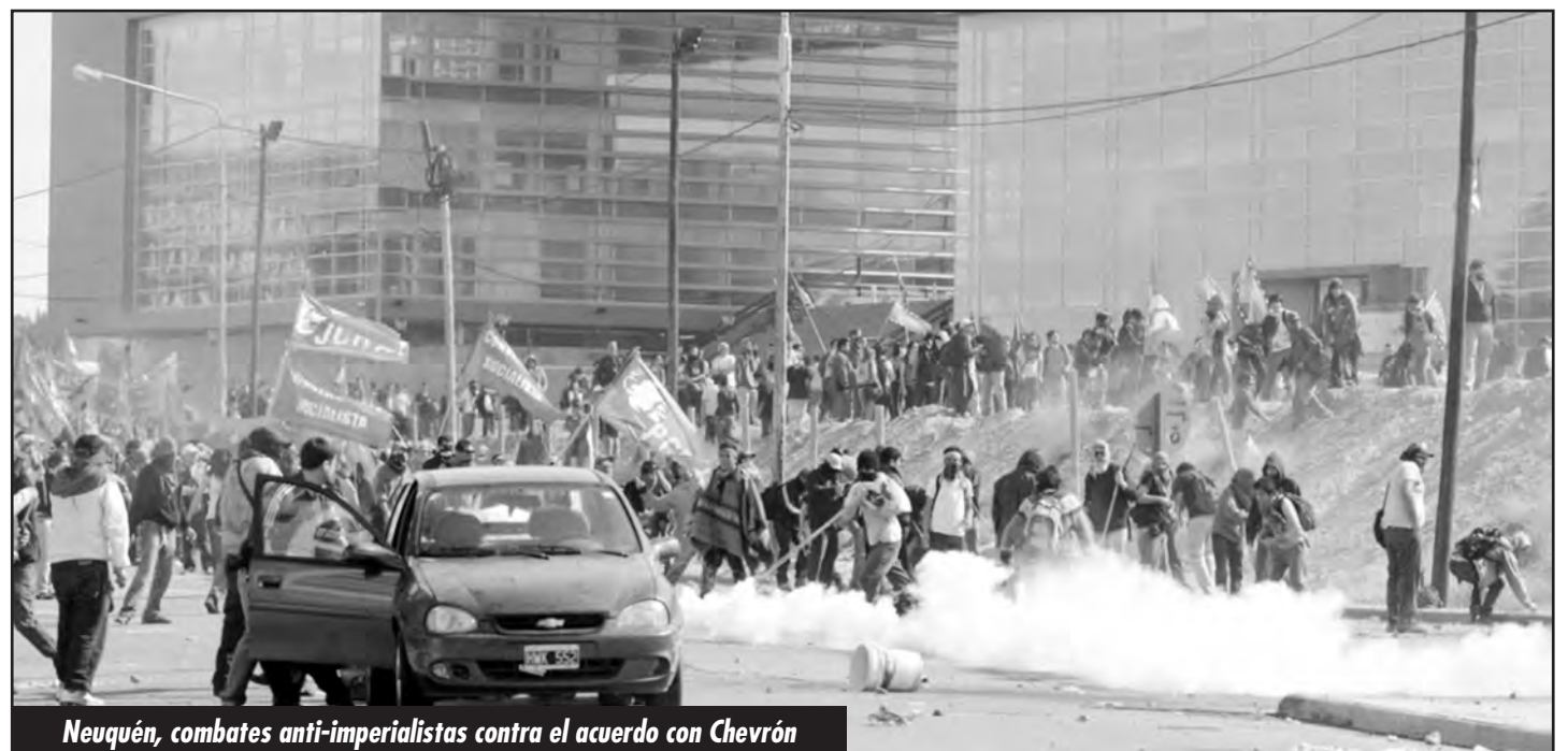
Neuquén, combates anti-imperialistas contra el acuerdo con Chevron

El Gobierno y el régimen de una nación saqueada por el imperialismo es el más totalitario que sus monopolios puedan tener a mano.