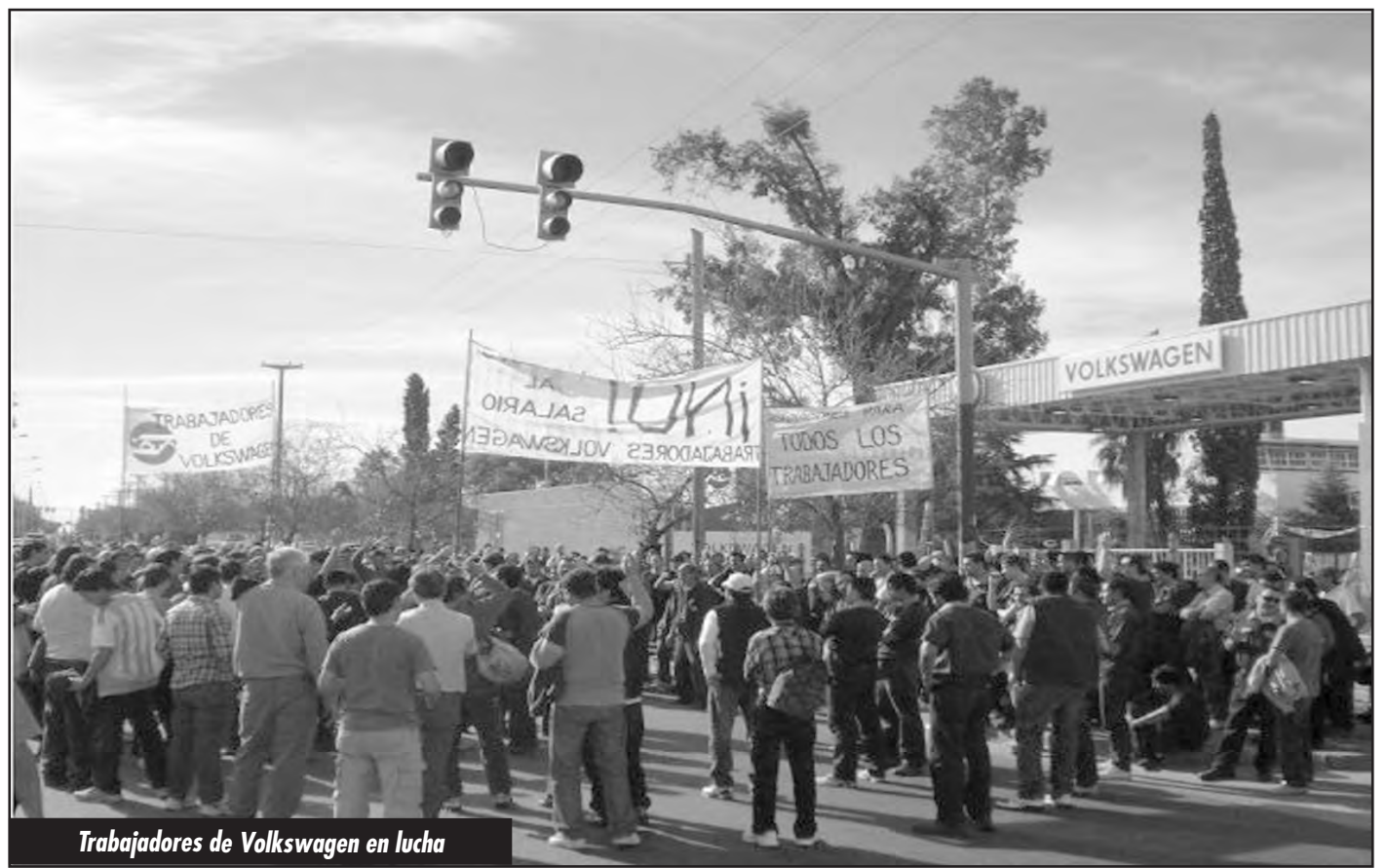
Trabajadores de Volkswagen en lucha

Es el momento de preparar las condiciones para pegarle una derrota estratégica a la burocracia sindical: ¡ELLOS, YA NO NOS REPRESENTAN!