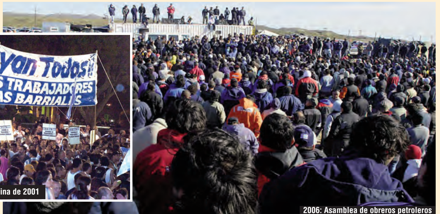
2006: Asamblea de obreros petroleros

Desde nuestros lugares de trabajo y estudio