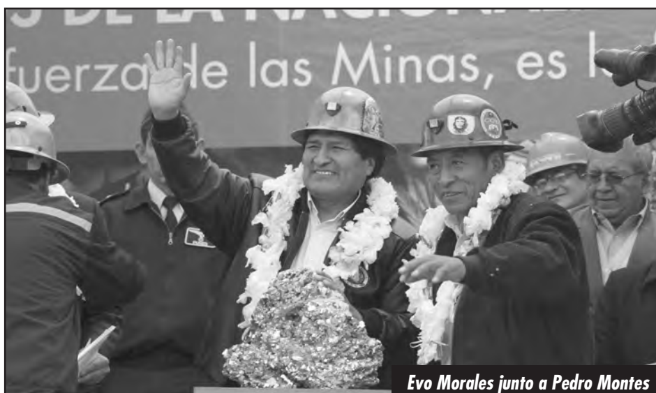
Evo Morales junto a Pedro Montes

Es más, la dirección de la COB (adulada y sostenida por izquierda por el POR, la LOR-CI y demás pequeñas sectas de renegados del trotskismo) terminó firmando la Ley de Pensiones del MAS contra la que se había organiza-