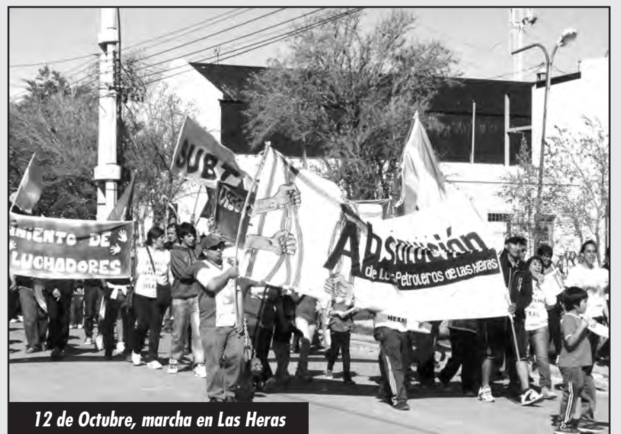
12 de Octubre, marcha en Las Heras

Rompieron el cerco y el aislamiento, se pusieron de pie enfrentando al Tribunal de la Venganza de las petroleras y GANARON LAS CALLES