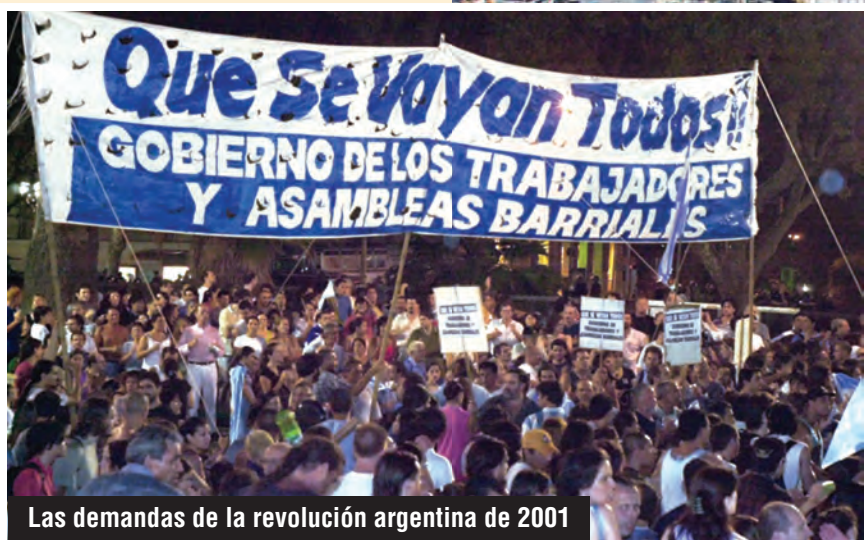
Las demandas de la revolución argentina de 2001

NO SE AGUANTA MAS LOS DE ARRIBA SE MERECEEN EL ¡PARO GENERAL!