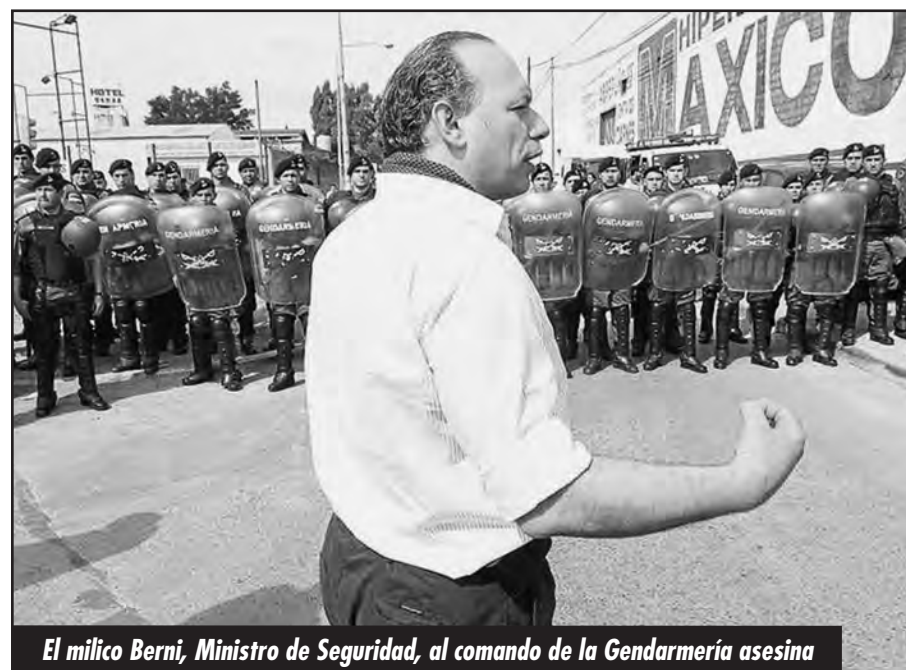
El milico Berni, Ministro de Seguridad, al comando de la Gendarmería asesina

Ellos dieron un paso, pero ahora, deben demostrar que ese paso es firme. Deben asentarlos. Deben imponer a los trabajadores, en las calles, un nuevo golpe a sus condiciones de vida y aunque aún están muy lejos de lograrlo, lo necesitan imperiosamente.