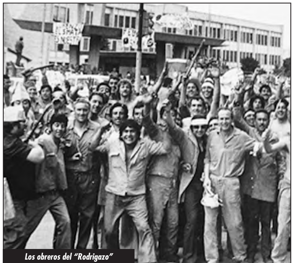
Los obreros del "Rodrigazo"

No podemos permitir que en Jujuy, la Milagros Salas siga manipulando a los trabajadores, que por un pedazo de tierra han muerto como perros a manos de los Blaquier. Bastaría con que el Polo