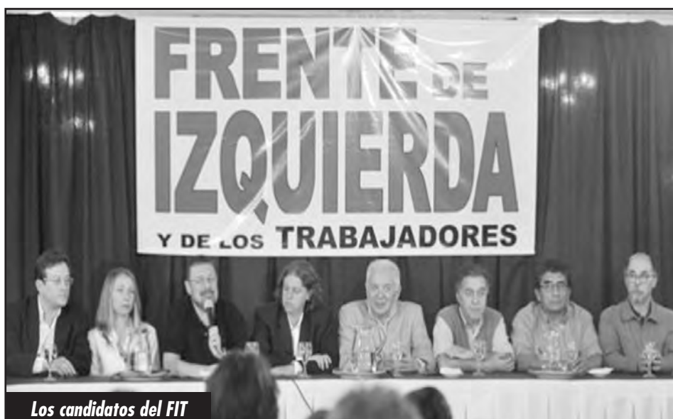
Los candidatos del FIT

¿Qué significa arbitraje político? ¿Cómo se reparten el botín las pandillas imperialistas? Ya vimos que eso se hace