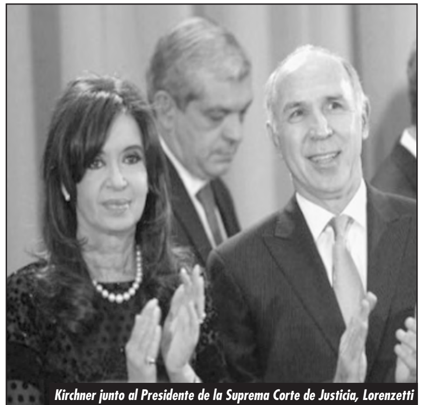
Kirchner junto al Presidente de la Suprema Corte de Justicia, Lorenzetti

¡HAY QUE EXPROPIAR SIN PAGO LAS TIERRAS DE LA OLIGARQUÍA PARA DARLE DE COMER BARATO AL PUEBLO Y TERMINAR CON EL HAMBRE!