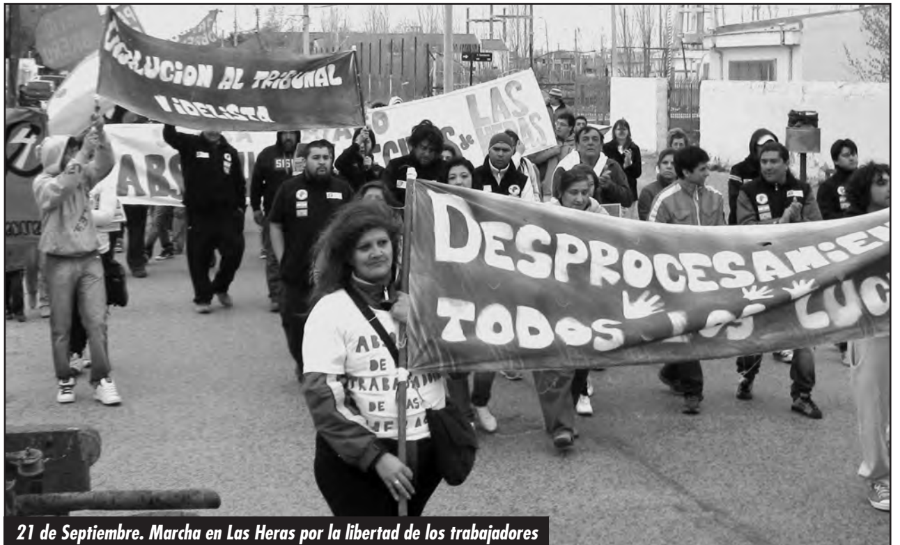
21 de Septiembre. Marcha en Las Heras por la libertad de los trabajadores

Estamos lejos (de las campañas que hacen correr