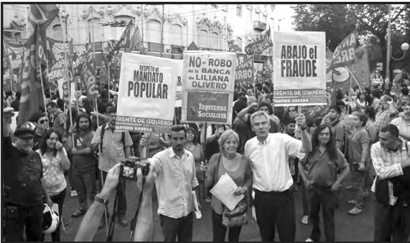
Marcha del FIT contra el fraude en Córdoba

¡CONGRESO OBRERO PROVINCIAL DE BASE! ¡PLAN DE LUCHA Y PARO GENERAL!