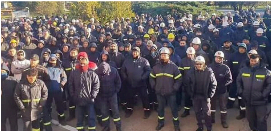
Asamblea de contratistas en junio de 2023