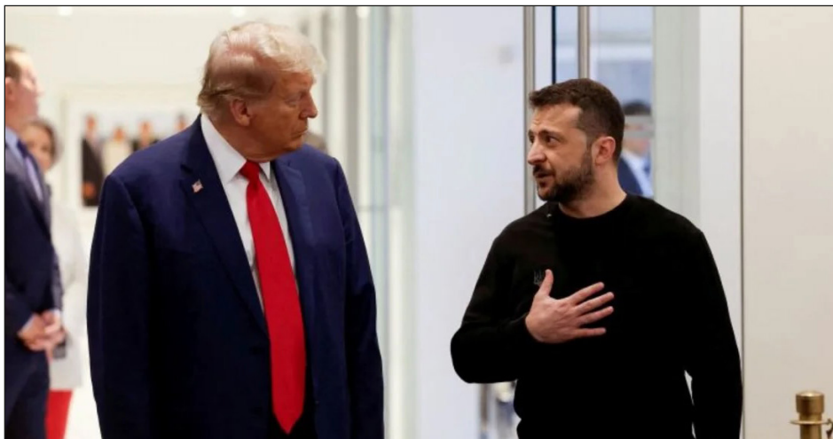
Trump y Zelensky

Para nosotros, Ucrania fue entregada como un peón para que Putin la masacre sin que llegue a ganar la guerra, por ello Biden y los imperialismos europeos "aliados", nunca enviaron a Ucrania el armamento necesario para repeler el avance de Putin sino solo hasta cierto punto, pero nunca el suficiente para derrotarlo ni expulsar al ocupante. Moscú ocupó, partió y la desangró la nación para que luego, estrangulada y entregada por la burguesía ucraniana y con la bota de Putin pisan-do el Donbass, Ucrania se encamine a quedar como una colonia tutelada.