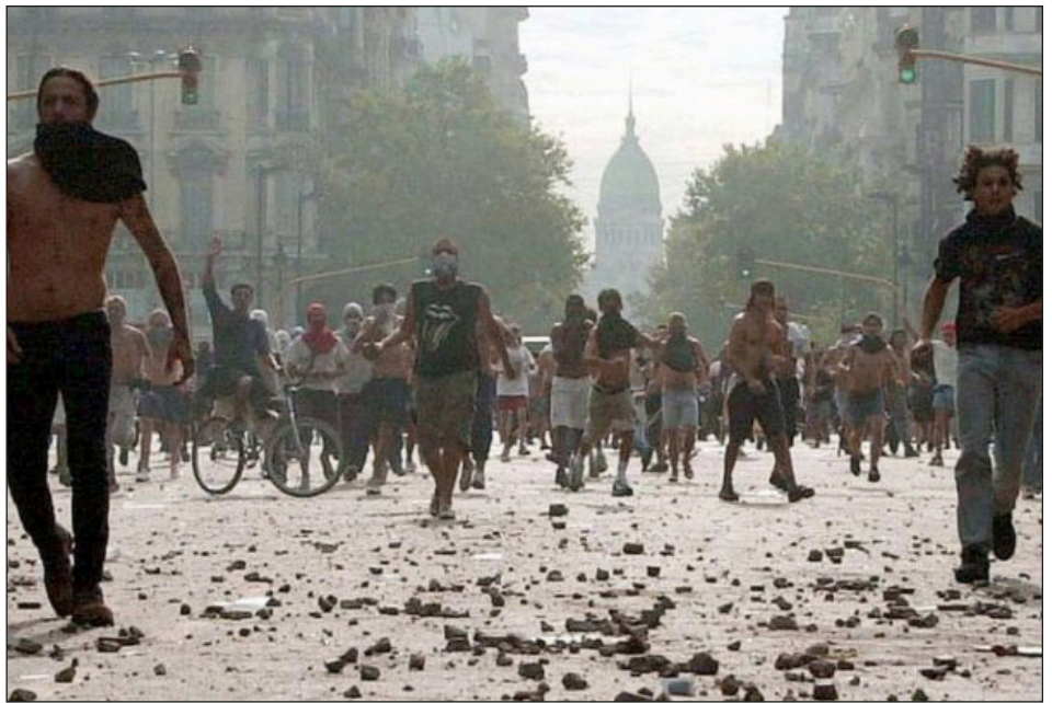
Argentina - 20 de diciembre de 2001: las masas tiran al gobierno de De la Rúa con el combate revolucionario en las calles

Las criptomonedas no son más que "una de las canastas donde ponen la cantidad de huevos que tienen". Es que tal cual dice el dicho, "los capitalistas nunca ponen todos los huevos en la misma canasta".