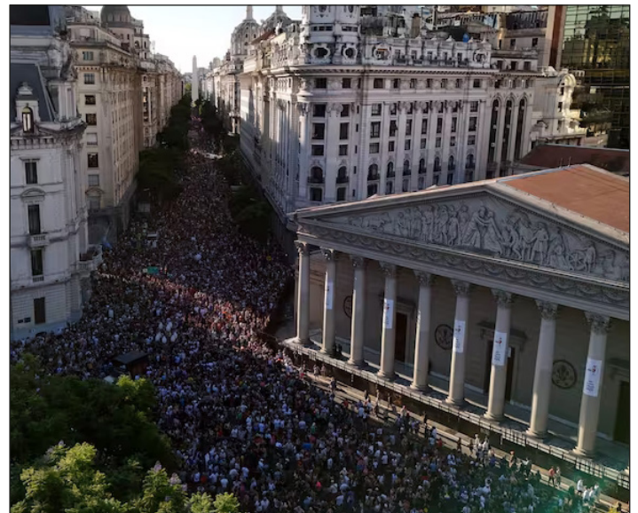
La masiva movilización del 1F en Buenos Aires