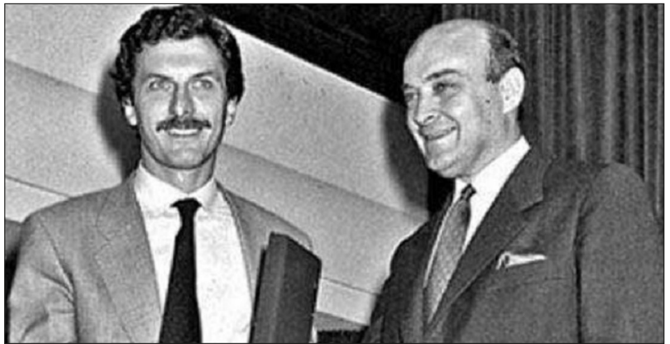
1982: Macri junto a Cavallo, presidente del Banco Central durante la dictadura militar, cuando estatizaron la deuda privada

Argentina pagó decenas de veces esos millones y los intereses, y aun así, esa deuda con el FMI y los acreedores privados asciende a dos veces ese valor millonario