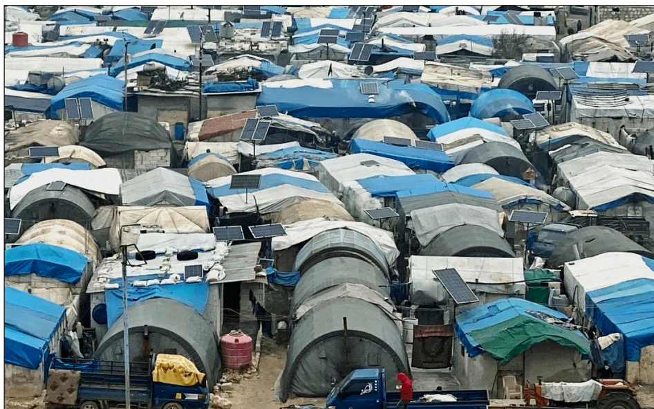
Campamento de desplazados sirios

Comité Redactor de “El Organizador Obrero Internacional”