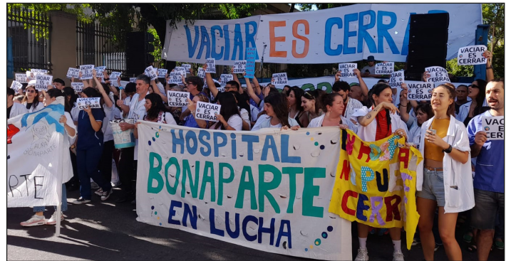
Trabajadores del Hospital Bonaparte en lucha

La izquierda que dirige e influencia gremios y comisiones internas arrancadas a la burocracia sindical lamentablemente se mantiene dentro de los márgenes de la ley de asociaciones profesionales. Le exige a la burocracia kirchnerista que luche cuando lo