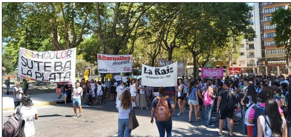
Febrero 2025. Movilización en La Plata por despido de maestras de apoyo

traidora y liberarse las manos para enfrentar esta brutal ofensiva sobre todos nuestros derechos y conquistas!