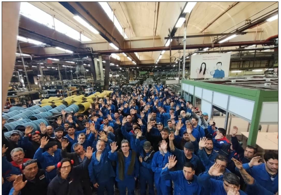
Asamblea en la planta de FATE

Mientras tanto, Crespo y la dirección de la Lista Negra del PO, esconden bajo la alfombra las demandas obreras en medio del ataque patronal. Y estamos más aislados que nunca, por fábrica. No pusieron en