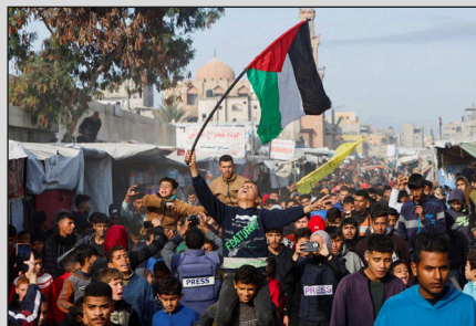
Manifestación de las masas palestinas en Gaza