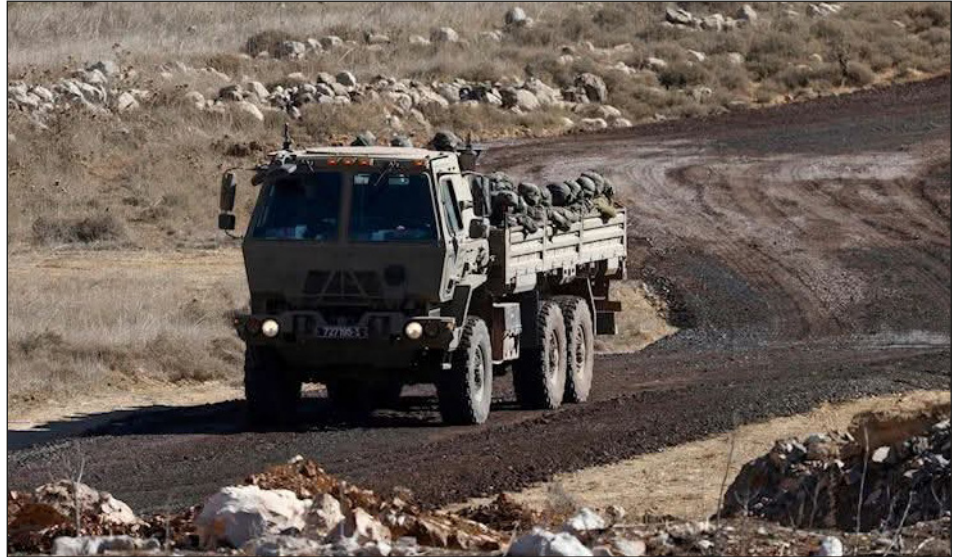
Blindado sionista en la ciudad siria de Abu Ghara

Encima le dieron “condolencias” a los colonos fascistas sionistas ante la acción de autodefensa de la resistencia palestina del 7 de octubre de 2023. ¡Traidores!