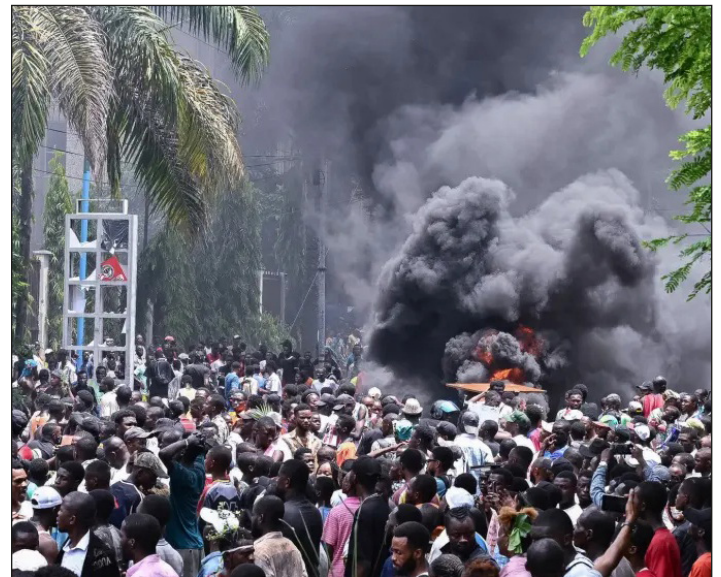
Las masas ganan las calles de Kinshasa, la capital del Congo, atacando las embajadas de las potencias imperialistas

Las distintas potencias imperialistas se disputan el control de estas enormes riquezas minerales del Congo impulsando verdaderos genocidios, masacres, guerras fratricidas y con-