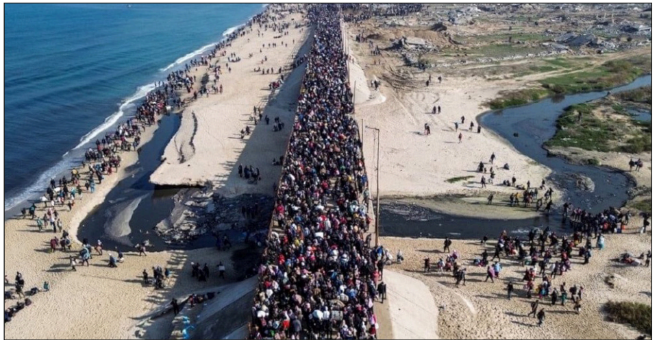
Las masas palestinas regresan al Norte de Gaza

Estamos ante una acción independiente de las masas palestinas que nadie previó. No estaba en los planes ni del imperialismo, ni del sionismo, ni de Hamas. Esto demuestra que fueron las masas las que combatieron con sus métodos de guerra civil resistiendo heroicamente ante el sionismo.