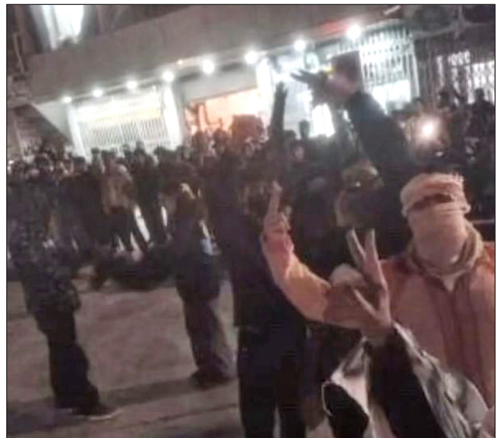
Protestas en la Plaza Central de Dhedasht

¡Expropiación de todos las cuentas y propiedades de los clérigos millonarios para no seguir viviendo como mendigos mientras ellos viven como reyes!