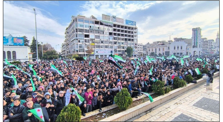
Diciembre de 2024: las masas siria en Hama celebran haber derrotado al fascista Al Assad

No queremos a sus secretarías ni secretarios, lo queremos a usted acá en el mismísimo terreno.