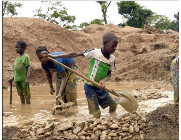
Niños esclavos en las minas del Congo

Hay que terminar con esas burguesías cipayas y sus regímenes antiobreros para imponer una República Negra Obrera y Campesina en la República Democrática del Congo y en Ruanda , y junto a nuestros hermanos sublevados en Mozambique y las masas de Níger, Somalia, Senegal, Kenia, Zimbabwe, Sudáfrica, Nigeria, Chad, Mali, Burkina Faso etc. conquistar una Federación de Repúblicas Negras Obreras y Campesinas del Centro y Sur de África que es la única que podrá sacar al continente negro de décadas y décadas de martirio y postración impuestos por el imperialismo y sus gobiernos lacayos.