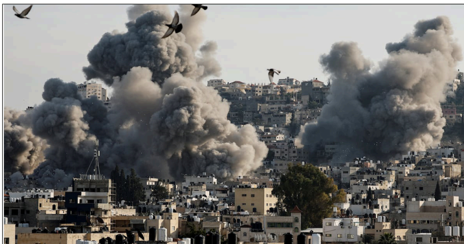
Bombardeos sionistas sobre Jenin, Cisjordania

Es decir, se trata de otra enorme acción de masas que pelean por su tierra contra el ocupante sionista como pueden y con lo que tienen, y para hacerlo