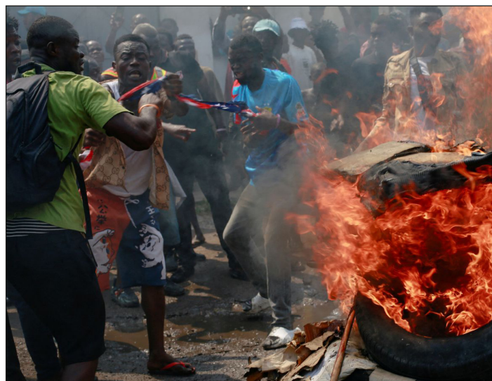
Las masas antiimperialistas del Congo incendian neumáticos y prenden fuego banderas norteamericanas

El obrero negro en África, en EEUU y allí donde fue sacado como esclavo, peleó y pelea. Fue y es valiente. Combatió en África del Sur y todo el continente negro, en heroicas luchas de liberación que fueron expropiadas por la burguesía negra que sostiene a los países de África como colonias y semicolonias, rodeadas en un mar de obreros negros hambrientos. Pelea y peleó en EEUU, conmoviendo al imperialismo yanqui de sus cimientos, como sucedió en los combates por las vidas negras importan contra el gobierno de Trump ayer, y actuó como vanguardia de lucha en todos los combates decisivos del proletariado norteamericano.