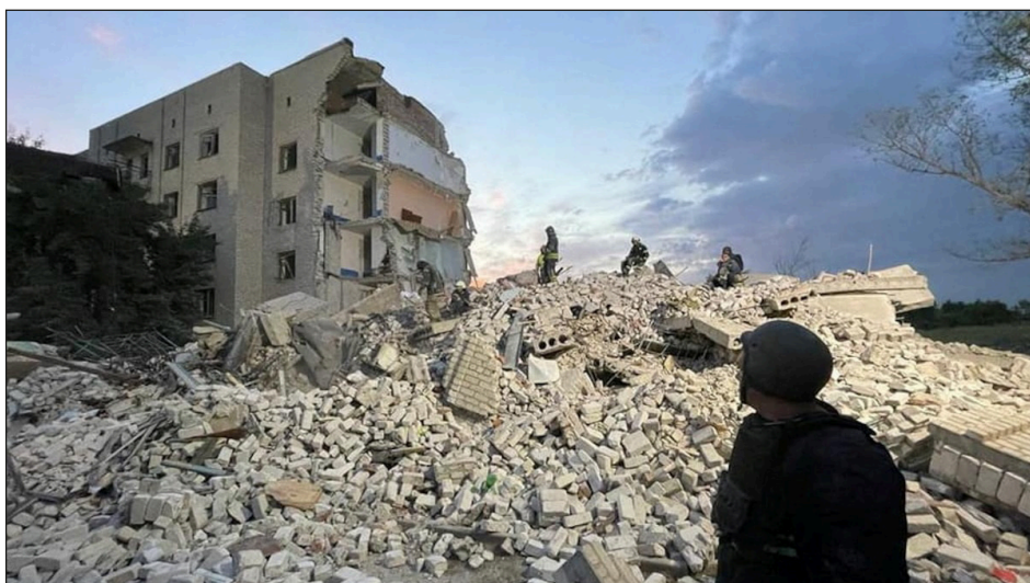
Devastación en Chasiv Yar, distrito de Bakhmut, en el este de Ucrania

Les enviamos nuestro fraternal saludo desde aquí y es nuestro deseo que se encuentren bien. Queremos enviarles en esta nota nuestros comentarios sobre las posiciones que ustedes nos hicieron llegar el mes pasado sobre la situación actual de Ucrania. En primer lugar queremos reiterarles que vuestra posición y el intercambio y fraternal debate con ustedes constituye a nuestro entender un aporte muy valioso para el proletariado internacional y es sin dudas la búsqueda del camino a la victoria de la nación ucraniana. Por lo tanto, hemos distribuido vuestra carta a todos nuestros camaradas y la hemos publicado en nuestra web y redes sociales.