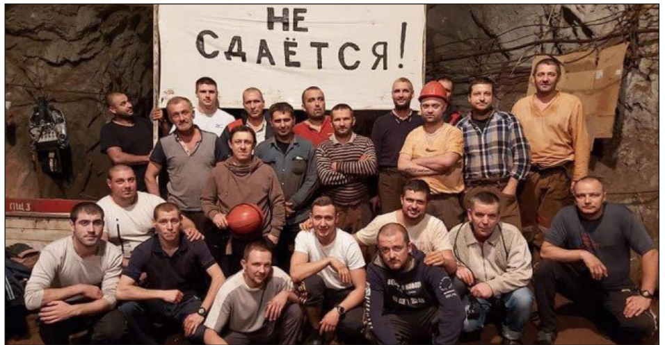
Mineros de las minas de hierro de Kryvyi Rih-Ucrania en huelga en 2020

Compartimos con ustedes que la nación ucraniana ha sido sometida no solo a los bombarzos de Moscú, a la invasión, al desastre y la muerte, sino que este sufriamiento ha sido redoblado por un enorme aislamiento . A nuestro entender, en este aislamiento fue decisivo el cercos que las direcciones que se reclaman de la clase obrera internacional le han impuesto a la clase obrera ucraniana . Porque en el corazón mismo de Europa, la clase obrera ha asistido a este escarnio al pueblo ucraniano sin que haya sido convocada a detenerlo, a no embarcar las armas que se dirigían a masacrar a sus hermanos de Ucrania, ni a enviar pertrechos, medicinas, colectas e incluso trabajadores que fueran a defender la nación frente al ocupante como se hizo durante la guerra civil española en los años 30. Por el contrario, fueron estas direcciones, con el stalinismo a la cabeza, quienes promulgaron a Putin como el aliado de los pueblos, que estaba “enfrentando a la OTAN” en Ucrania. Con estas mentiras y engaños llevaron en particular al proletariado europeo a la inacción ante la masacre. Lo mismo sufrimos en carne propia en Siria, cuando sostuvieron al chagal Al Assad y Putin y su masacre contra