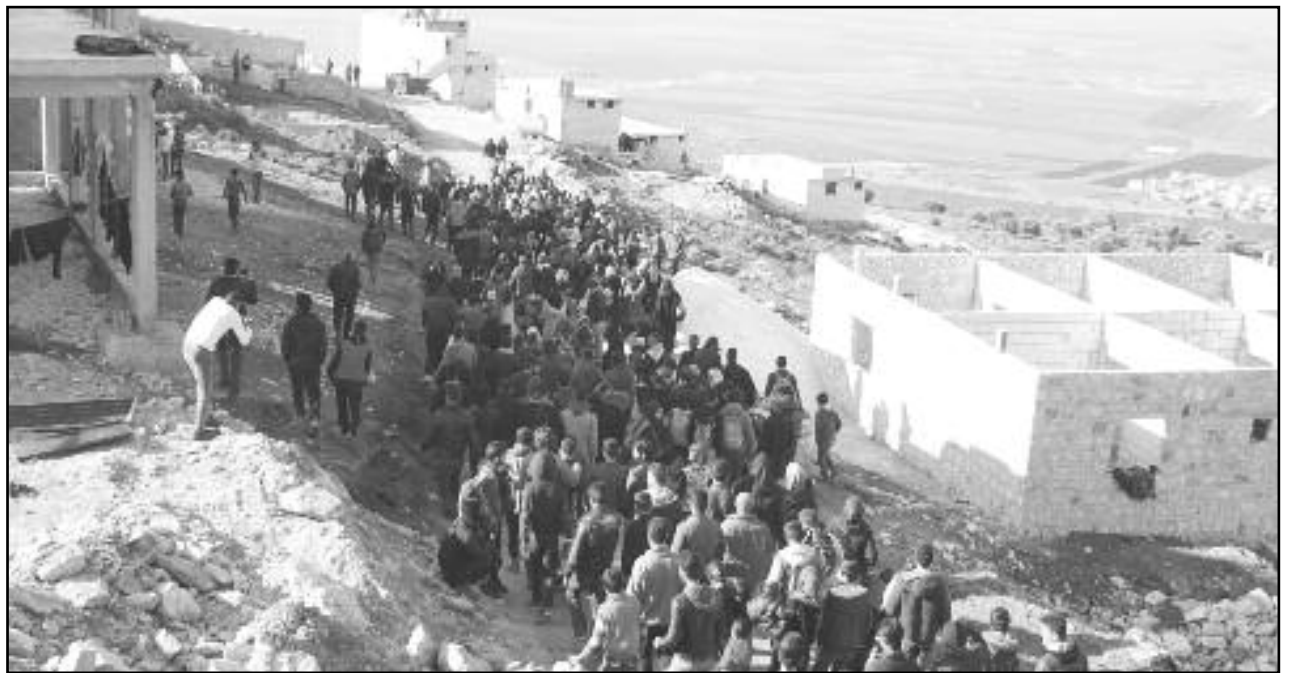
Miles de exiliados se movilizan a las fronteras

Son lágrimas de cocodrilo porque durante estos 9 años se dedicaron a decir que las masas sublevadas eran tan reaccionarias como el fascista Al Assad. Se dedicaron a pre-