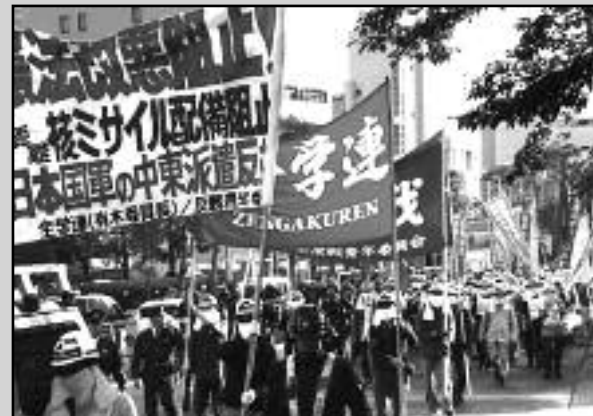
Movilización de los marxistas revolucionarios de la JRCL-RMF y la juventud Zengakuren de Japón

Estamos luchando en Japón contra las ofensivas reaccionarias del gobierno liderado por Shinzo Abe, el servidor de Trump número uno del mundo. Este gobierno está llevando a cabo la ofensiva histórica de revisar la actual Constitución de Japón para podar el artículo que dice "renuncia a la guerra" y agregar un artículo para otorgarle al Primer Ministro "poderes de emergencia" similares a los nazis. Abe también está empeñado en construir una alianza militar con armas nucleares con el imperialismo estadounidense. Contra esta ofensiva llevada adelante por este gobierno neofascista, nosotros los JRCL estamos luchando resueltamente, junto con los trabajadores combativos y los valientes estudiantes de Zengakuren, mientras denunciamos el abandono y el sofocamiento de las luchas por parte de los líderes centrales del Partido Comunista Japonés y los aristócratas obreros de la confederación sindical Rengo. En la protesta en curso contra la construcción de una nueva base militar estadounidense en la isla de Oki-