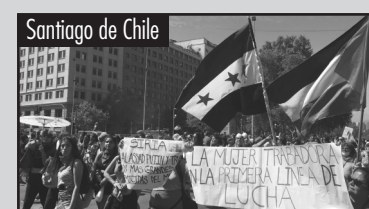
Ver pág. 21

Acciones en apoyo a las masas de la revolución siria en su 9º aniversario