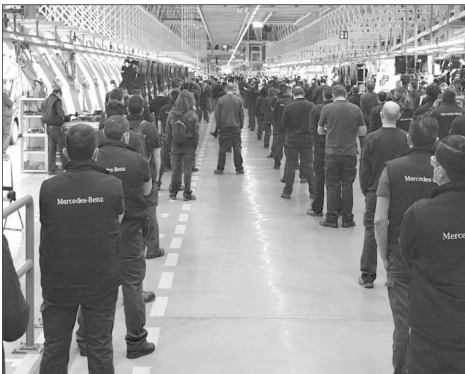
Los obreros de Mercedes Benz en el Estado Español se niegan a trabajar