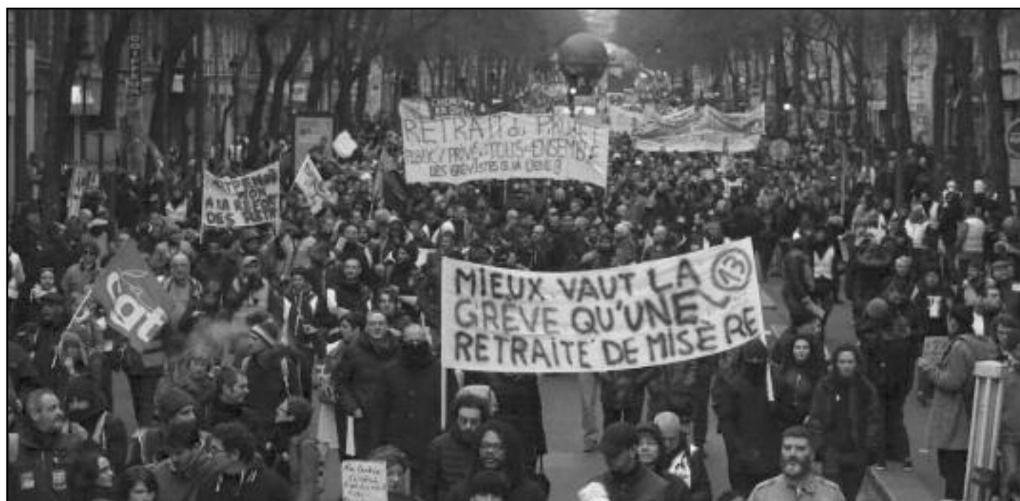
28/12/2019: manifestación en París

En lugares estratégicos como las usinas de electricidad, en la recolección de residuos, en las refinerías, los trabajadores se negaron a brindar los servicios de emergencia, pese a la oposición de la burocracia. Esto demuestra que a cada paso los obreros chocan con la dirección que tienen a su frente. Es por ello que en enero un sector de transporte en huelga entró a