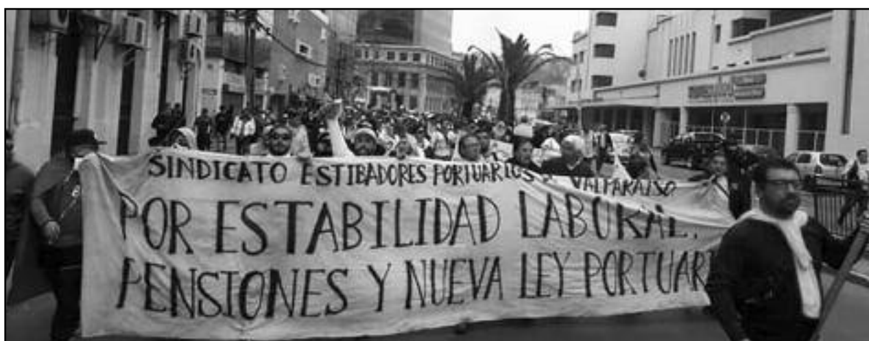
Portuarios de Valparaíso durante la huelga general del 12/11

Ya el 11/3 vimos cómo los pacos asesinos dejaron marchar a los "pacíficos" de la burocracia sindical y el PC frente a La Moneda, mientras reprimían a los luchadores de vanguardia, los "violentos", que se niegan a abandonar las calles. Queda claro que más someten a las masas al plebiscito y más aíslan a la avanzada de combate del pueblo de Chile, como la juventud rebelde. Para terminar de disciplinarlos, ya se alistan los "pacos de rojo" del PC, como quinta columna de la patronal, desfilando por La Alameda.