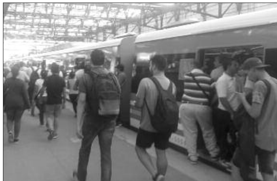
El transporte colapsado

De la mano de Trump, el imperialismo yanqui viene a recolonizar en América Latina