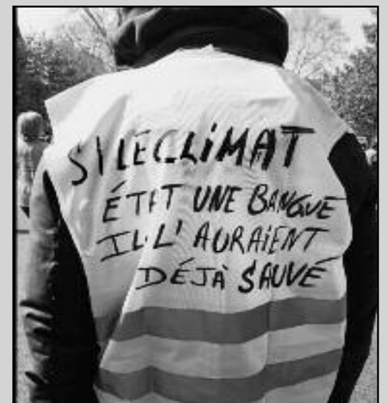
"Si el clima fuera un banco, ya lo habrían salvado"

El movimiento de Chalecos Amarillos, a un día de las elecciones municipales, nuevamente en las calles hicieron sentir su bronca y odio, hartos de no haber conseguido ninguna de sus sentidas demandas; demuestran que su batalla continúa.