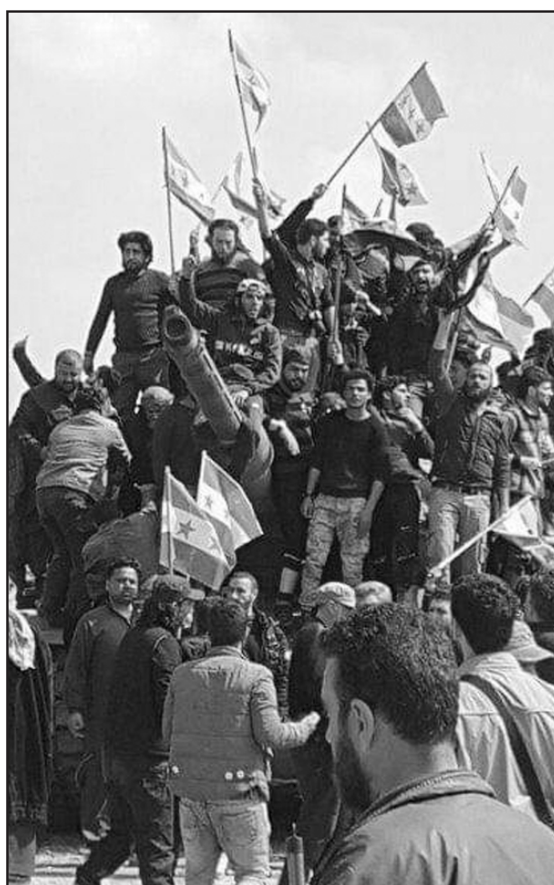
Cientos de manifestantes tomaron la ruta

Las masas en Idlib se enfrentan al pacto de partición de Erdogan, Putin, Al Assad y Trump, como los de Sochi de 2018-2019, en los cuales Al Assad y Putin masacraban a mansalva con una ofensiva genocida, que funcionaba como una "pistola en la sien" de las masas sirias para que luego entre Turquía como "el protector" solo para imponerles la rendición y que acepten el pacto. Ellos vienen funcionando juntos desde la conferencia de Ginebra para derrotar la revolución siria. Pero no pudieron imponer sus