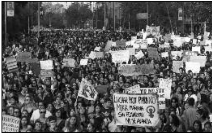
Movilización el 8M

Sobran condiciones para que el 9/3 sea el inicio de la huelga general revolucionaria indefinida hasta que caiga Piñera, el régimen pinochetista y su plebiscito fraudulento. Pero ese día solo algunos sectores ultra-minoritarios de profesoras, funcionarias del estado y trabajadoras de la salud lograron salir a la huelga, junto a los secundarios que realizaron fugas masivas de los liceos para participar de esta acción de lucha. Las minas, los puertos, las fábricas y la amplísima