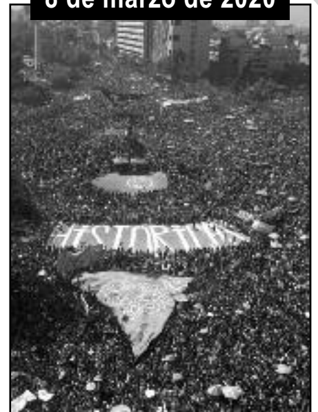
Santiago, 8M: cientos de miles se movilizan al grito de "¡Piñera asesino igual que Pinochet!"

ahora vayamos por todos ellos! ¡Huelga general revolucionaria hasta que caiga Piñera! ¡Boicot al plebiscito de la Concertación y los generales pinochetistas!