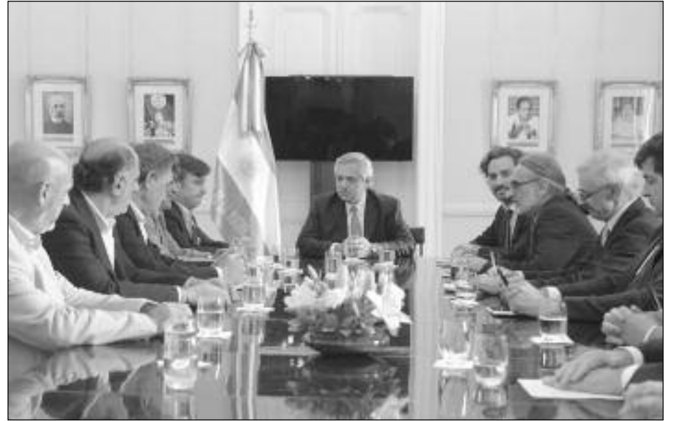
Reunión del Consejo Económico y Social

Después de que Fernández nos devaluara un 30% el salario con un dólar a $80, la burocracia sindical entregó las paritarias. La burocracia kirchnerista de la UOM y CTERA firmaron un aumento del 11 y 13%. El kirchnerista Pignanelli de SMATA acordó con General Motors prorrogar las suspensiones con reducción salarial por 10 meses más,