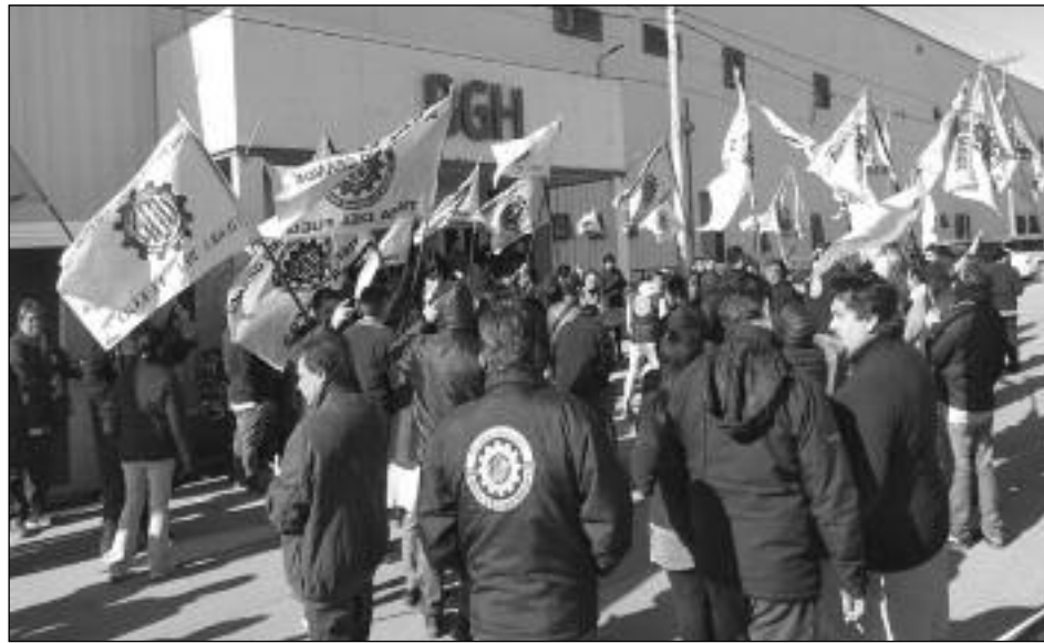
Metalúrgicos de Tierra del Fuego paralizan las plantas

¡Ahí están los fondos para garantizar un plan de obras públicas, bajo control de los sindicatos y las organizaciones obreras, para construir viviendas, instalar cloacas y garantizar agua potable y condiciones de higiene para los explotados!