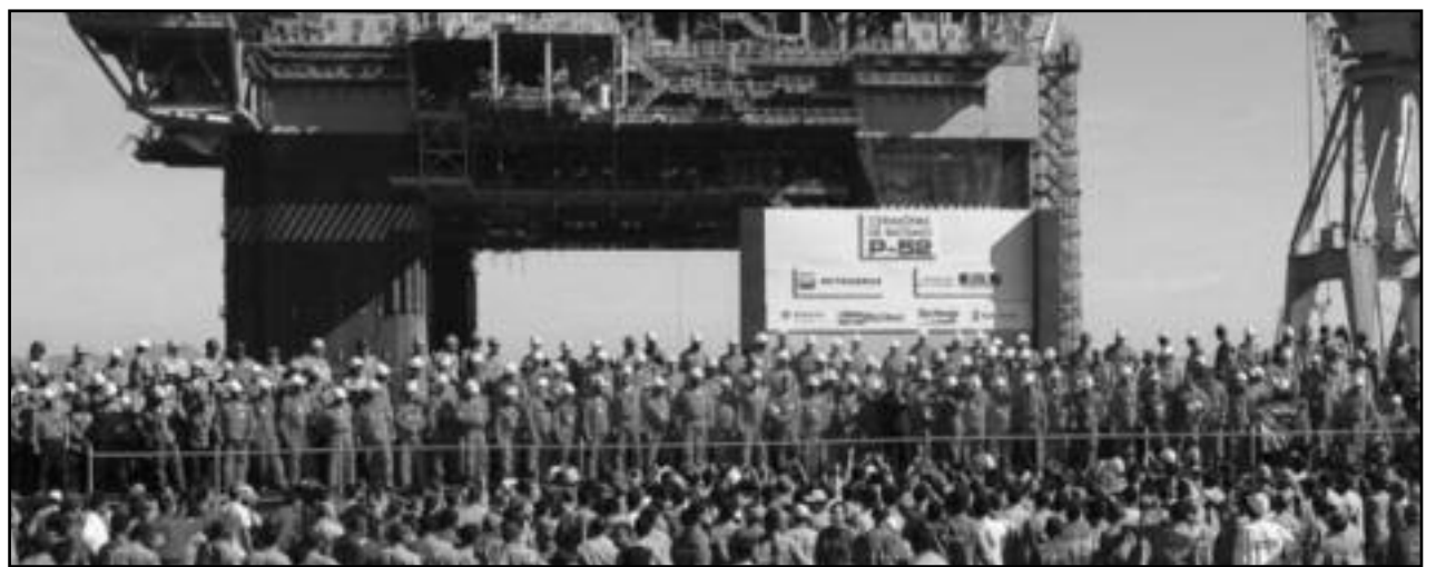
Febrero, 2020: los obreros petroleros en huelga

El gobierno se venía asentando hasta ahora en la tregua dada por la burocracia sindical que ató las manos de la clase