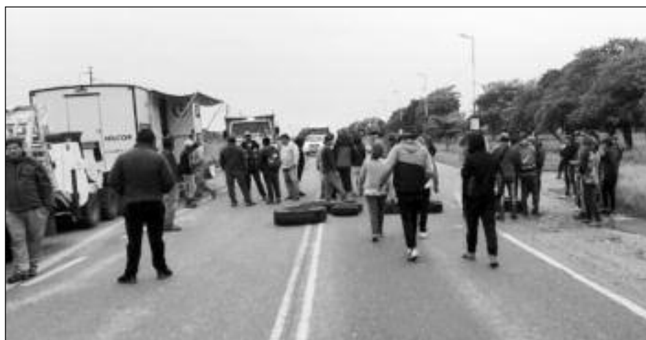
Corte en la ruta 34, paso Cornejo, Tartagal

Lu: Claro. Los más jóvenes se quedan muertos y me miran, porque no conocen, aun-