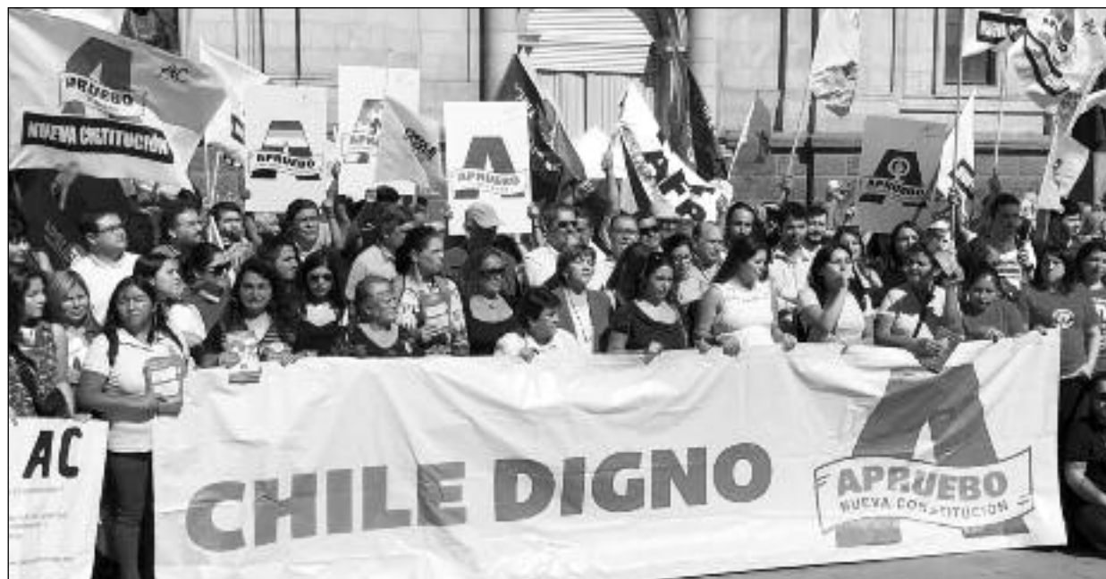
El comando "Chile Digno" del PC y sectores del Frente Amplio haciendo campaña por el "Apruebo"

La izquierda parlamentaria busca justificar semejante política hablando de "enfrentar a la derecha". Pero los momios, los milicos y el propio Piñera jamás podrían haber impuesto esta salida que viene a salvarlos, porque estaban arrinconados por el combate de masas. A este plebiscito lo están imponiendo la ex Concertación, el PC, el Frente Amplio y las burocracias sindicales y estudiantiles de la Mesa de Unidad Social. Ellos son los que desde octubre vienen sosteniendo a Piñera y con este plebiscito vienen a garantizar que termine su mandato de 4 años. ¡Con el plebiscito