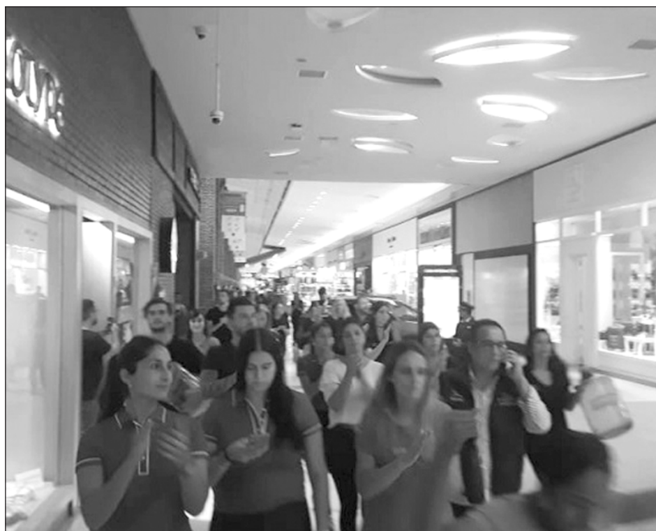
Protestas de los trabajadores de los shoppings