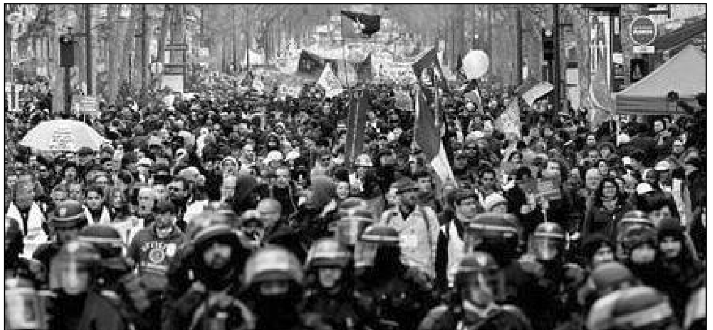
29-01-2020. Marcha en París

En estos organismos de lucha, votemos comités de autodefensa para defendernos de la brutal represión de este gobierno.