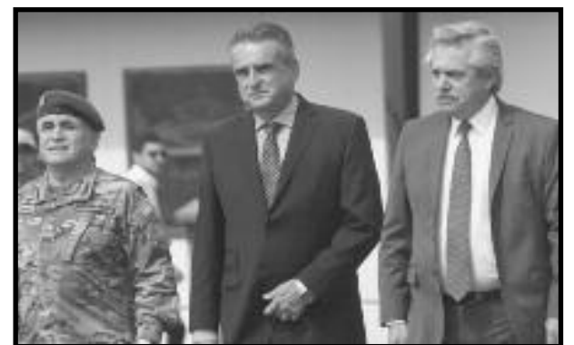
El Ministro de Defensa Agustín Rossi y Alberto Fernández

Denunciamos que sin derrotar a la casta de jueces burguesa de este régimen infame y los políticos de los partidos patronales cómplices de la dictadura, jamás habrá castigo a los milicos genocidas.