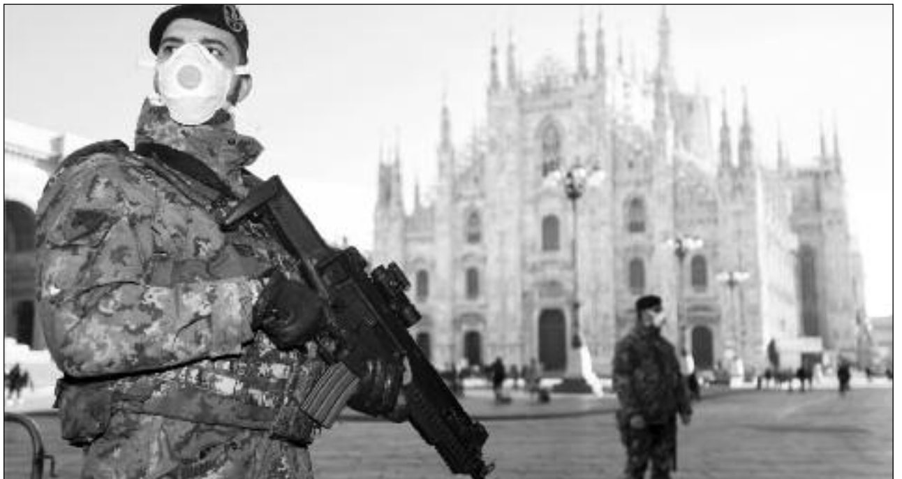
Italia militarizada con la excusa del coronavirus

Todas sus reuniones y resoluciones tuvieron el objetivo de no parar la producción ni el comercio para seguir explotándonos sin importarles nuestras vidas. ¡A ellos