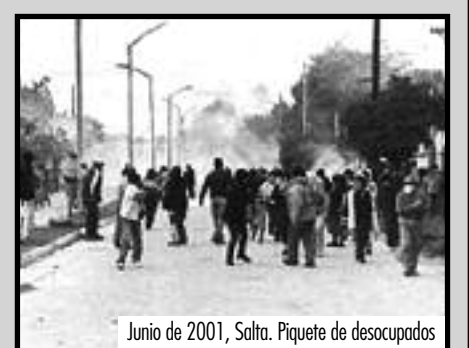
Junio de 2001, Salta. Piquete de desocupados

La clase obrera hoy por hoy está peleando sola porque los dirigentes se