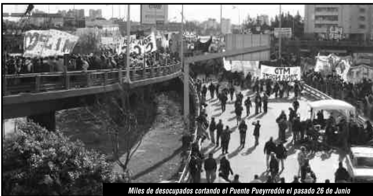
Miles de desocupados cortando el Puente Pueyrredón el pasado 26 de Junio

"Que se vayan todos y no quede ni uno solo"