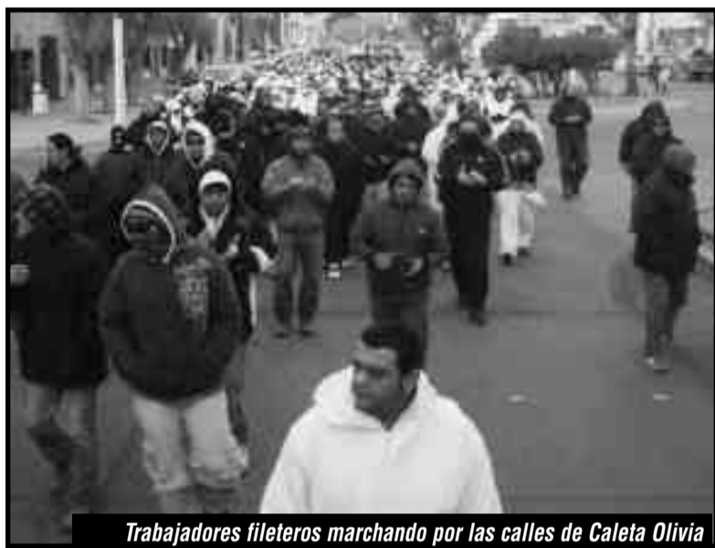
Trabajadores fileteros marchando por las calles de Caleta Olivia

El 1 de julio marcharon por las calles de Caleta Olivia 2000 obreros fileteros de las cooperativas “El Dorado” y “20 de noviembre” junto a los marineros y estibadores de la Flota amarilla, reclamando por subsidios, ya que la producción se encuentra parada por falta de materia prima a causa del enorme saqueo de los recursos naturales del mar por parte los monopolios imperialistas de la pesca en los últimos veinte años.