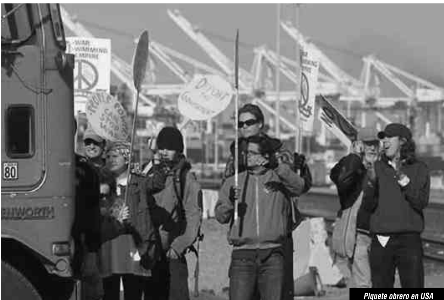
Piquete obrero en USA

No luchar contra la “demagogia” burguesa significa no enfrentar al gobierno “socialista” y “democrático” de Papanou en Grecia, que es el que comanda el más terrible ataque contra la clase obrera. Por eso las direcciones reformistas llevaron todas las energías revolucionarias de los explotados a una lucha de presión para que la Goldman Sachs, el Bundesbank y demás parásitos imperialistas y sus gobiernos “no apliquen su plan contra los trabajadores”. La vida dio un veredicto sobre esta política. Después de 6 huelgas generales en Grecia, por no avanzar a poner en pie los soviets, centralizando y desarrollando los organismos de lucha que las masas pusieron en pie, conquistar el armamento del proleta-