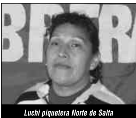
Luchi piquetera Norte de Salta