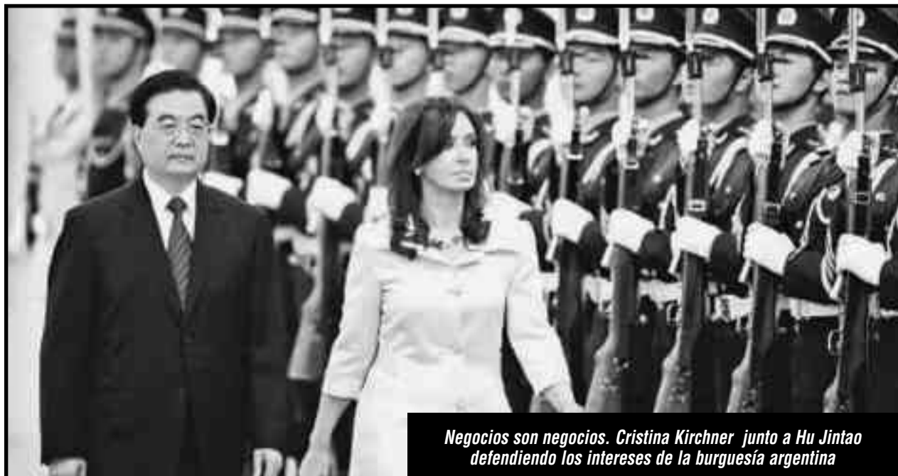
Negocios son negocios. Cristina Kirchner junto a Hu Jintao defendiendo los intereses de la burguesía argentina

Así la burguesía prepara las condiciones para derro-