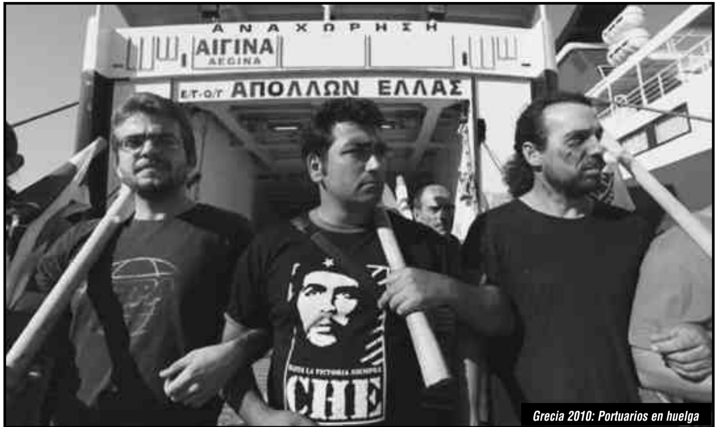
Grecia 2010: Portuarios en huelga

CONCLAT, se ha llevado adelante una reunión histórica de centralización de fuerzas que en nombre del combate por el “socialismo”, llevan a la vanguardia obrera combativa al callejón sin salida de la política de colaboración de clases, para sostener al frente popular y estrangular el combate revolucionario y antiimperialista de las masas. Pero este encuentro, como el de mayo en Madrid, ya tiene un nuevo exponente en EE.UU., donde hoy bajo el auspicio de los mandelistas de Socialist Action, la ISO, con la participación del SWP de Inglaterra, realizan un tour político por EEUU de costa a costa, para centralizar al conjunto de los renegados del trotskismo en Norteamérica para garantizar la ofensiva masacradora del carnicero Obama en Afganistán y el resto del planeta y sobre su propio proletariado. Tantas reuniones, casi mensuales de las direcciones reformistas en distintos puntos del planeta, demuestran que la burguesía imperialista recurre a todos sus agentes para que la salven de su crisis y de los combates revolucionarios del proletariado. Pero también son una muestra de que el imperialismo necesita adormecer a las masas para aplicarles duras y feroces derrotas y redoblar su ataque sangriento contra las masas explotadas del mundo.