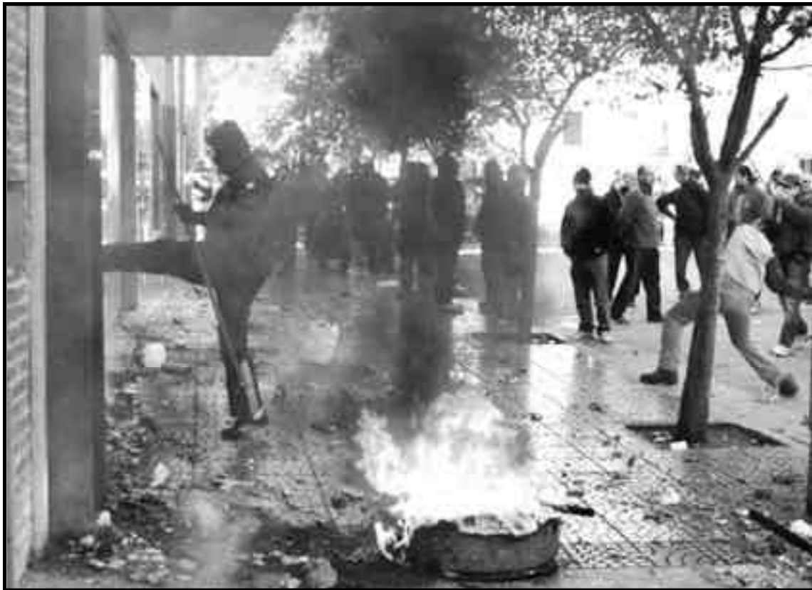
Córdoba. Trabajadores de la UOM se rebelan contra la burocracia sindical para imponer sus demandas

En ese mismo momento en que la patronal tiraba su crisis al conjunto de los trabajadores, los obreros de Paraná Metal, en Villa Constitución, no se co-