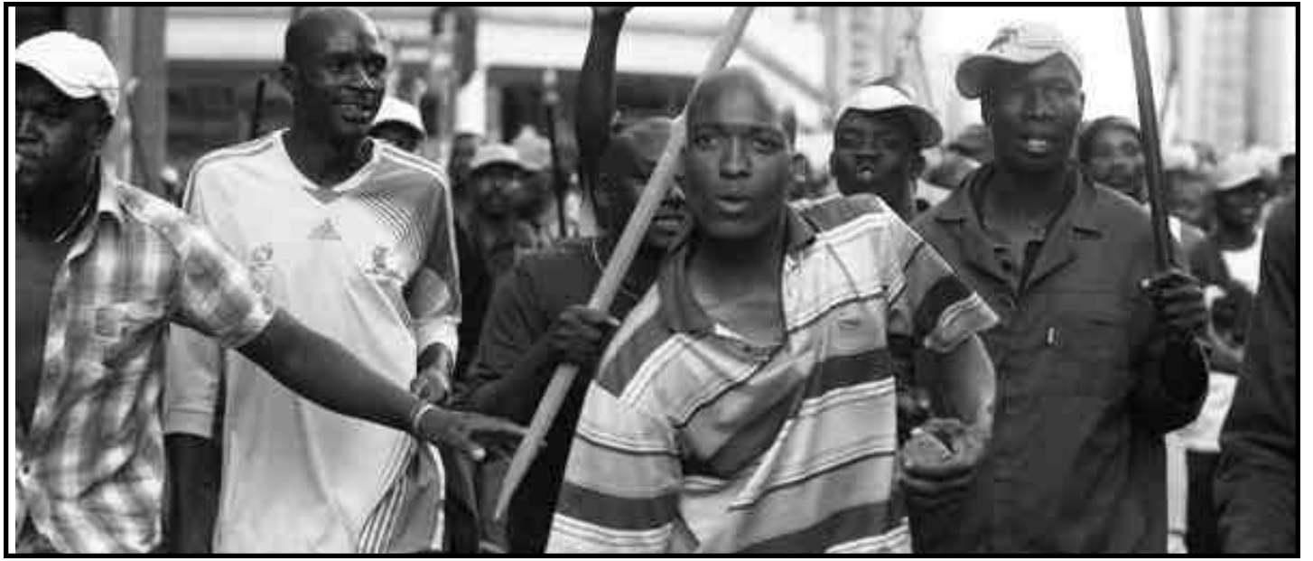
Piquete de huelga de los trabajadores del transporte en Sudáfrica

Durante décadas, estas corporaciones internacionales han sacado más de 200 mil millones de Rands del país cada año. Desde 1996 han hecho aún mucho más ganancias que las que hicieron bajo el régimen represivo del National Party (que gobernó Sudáfrica desde 1948 hasta 1994, bajo el régimen del Apartheid). Bajo el disfraz de "el amplio fortalecimiento económico negro" una pequeña élite del amabhulu omnyama se ha hecho millonaria de la noche a la mañana, mientras las masas mueren de hambre, congelándose en chozas o en cajas de hormigón. Algunos dirigentes de la alianza son propietarios de agencias de trabajo que están brutalizando a los trabajadores. Muchos dirigentes sindicales han invertido el dinero de los trabajadores en la privatización la asistencia médica, en empresas de pesca (mientras los pequeños pescadores pasan hambre), en Sasol - South African Coal, Oil and Gas Corporation- (a pesar que había resoluciones de los trabajadores para nacionalizarla); muchos dirigentes sindicales promueven los acuerdos de largo plazo que reducen el salario real y trabajan duro para desactivar la presente ola de huelgas y protestas de la clase obrera. Ellos entregan miles millones del dinero de los trabajadores para "salvar" a los capitalistas. Muchos de los dirigentes sindicales son ellos mismos la correa de transmisión de la crisis mundial capitalista sobre los hombros de la clase obrera. La principal correa de trans-