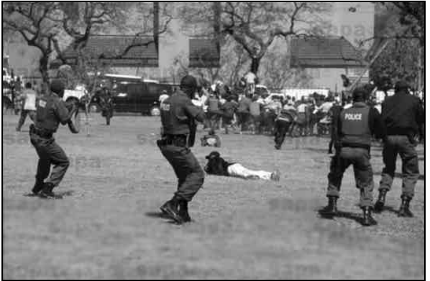
Soldados en huelga son reprimidos por la policía

En el 2002, el gobierno de Sudáfrica hizo un documento llamado HR 2010. En este plan el gobierno intentaba limitar la edad de los rangos más bajos a 28 años; mientras que aquellos de los rangos altos que no estaban siendo promovidos (ascendidos) constantemente, serían despedidos. Los más altos rangos (los más altos de todos) estarían bajo contratos de 4 a 15 años y habría una "cacería de talento". En otras palabras, se traerían a los tipos más fascistas, con experiencia en aniquilar levantamientos. El porcentaje de negros sería del 64%, 10% de mestizos, 0,75% de indúes y 24% de blancos. El porcentaje de la población de blancos es menor al 10%. Esto significa que muchos de los asesinos del régimen represor previo puedan encontrar su casa dentro del nuevo ejército, junto con alguna "habilidad especial" posible del imperialismo norteamericano. 10.000 nuevos reclutas serían traídos anualmente durante dos años para el servicio militar, y sólo los más pro capitalistas serían retenidos. Este plan pretende deshacerse de los elementos más progresivos al interior del ejército y seguramente de muchos de los ex miembros de fuerzas de liberación. El plan es crear un ejército mercenario profesional, equipado para reprimir cualquier levantamiento local de la clase obrera. Pero para poder hacerlo, primero tienen que aplastar y derrotar a los dos sindicatos al interior del ejército.