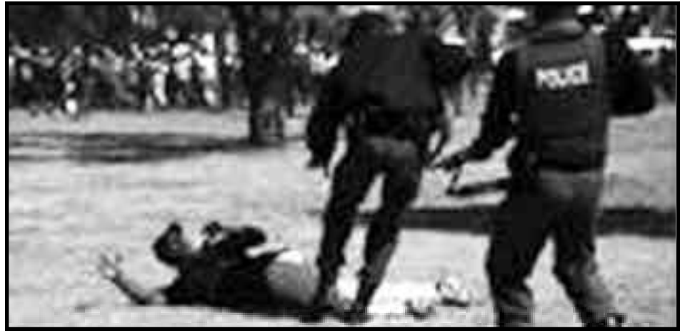
Represión policial a los soldados en huelga

Hay una segunda gran lección que necesitamos aprender y es que en estos