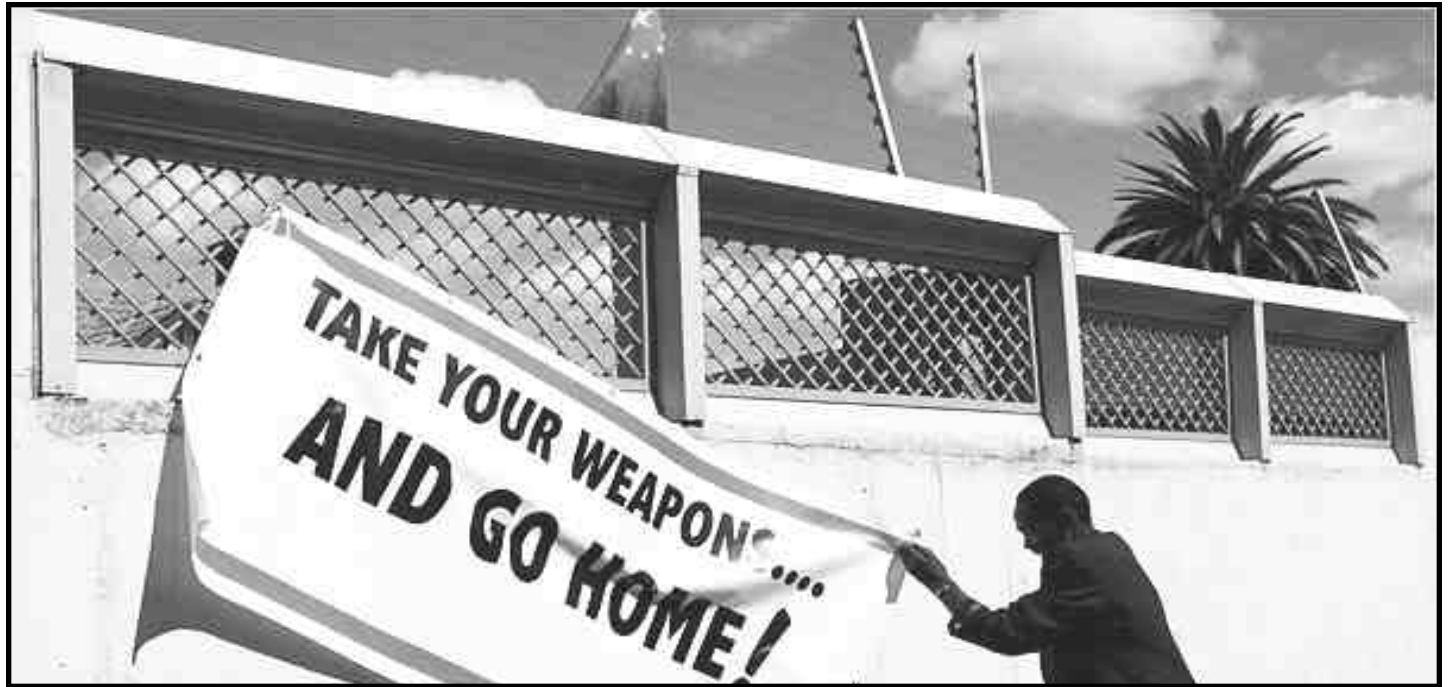
Frente a la represión policial los trabajadores del transporte en huelga despliegan la bandera con el lema: "¡Tomen sus armas y vuelvan a su casa!"

Los ministros del PCSA, incluyendo Ngakula y Kassrils, supervisaron, como miembros del Comité de armas del estado, ventas de armas por la mitad del monto total al ejército norteamericano durante el período de invasión del imperialismo norteamericano a Irak y su ocupación subsiguiente. Los ministros del