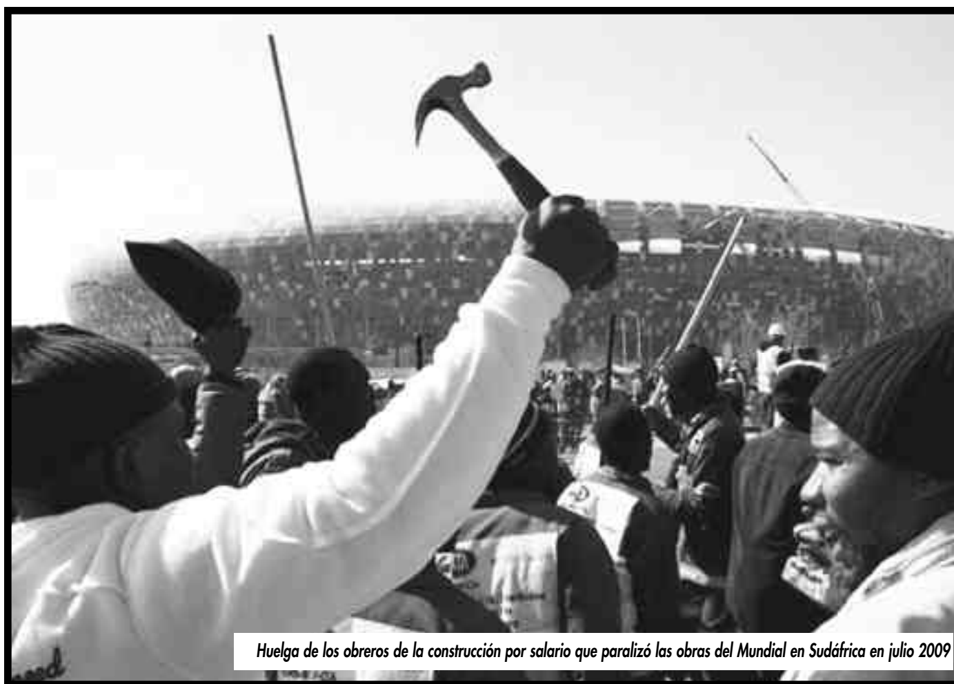
Huelga de los obreros de la construcción por salario que paralizó las obras del Mundial en Sudáfrica en julio 2009

El gobierno del Congreso Nacional Africano y los esclavistas blancos se desenmascaran como continuidad del Apartheid