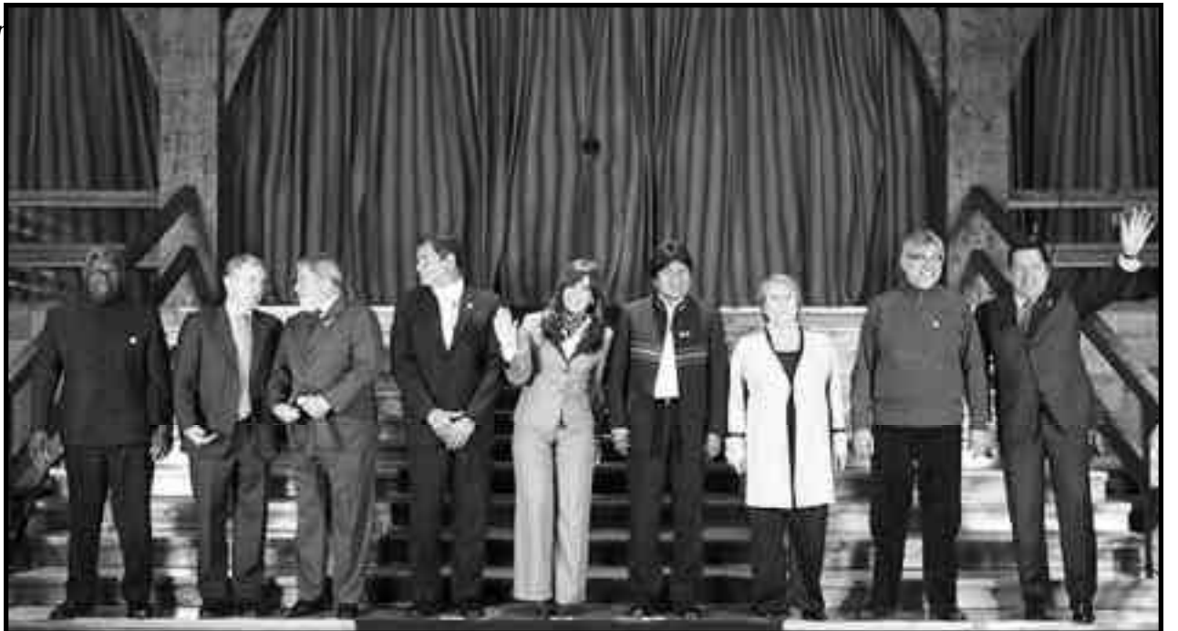
Cumbre Unasur. Los presidentes de América Latina se juntan para salvarle los negocios al imperialismo

Mientras Obama se pinta la cara de democrático, prepara el terreno para recuperar todos los negocios perdidos a manos del imperialismo francés, alemán, japonés y español, con su intento de imponer una Honduras contrarrevolucionaria como cabecera de playa para su dominio militar de América Central y una Colombia donde operarán las bases militares más importantes del