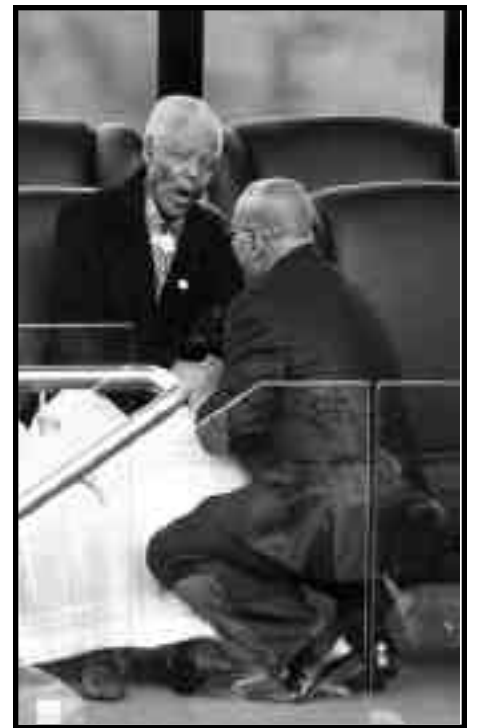
Nelson Mandela y Zuma presidente de Sudáfrica

poner fin al desempleo y por una escala móvil de horas;