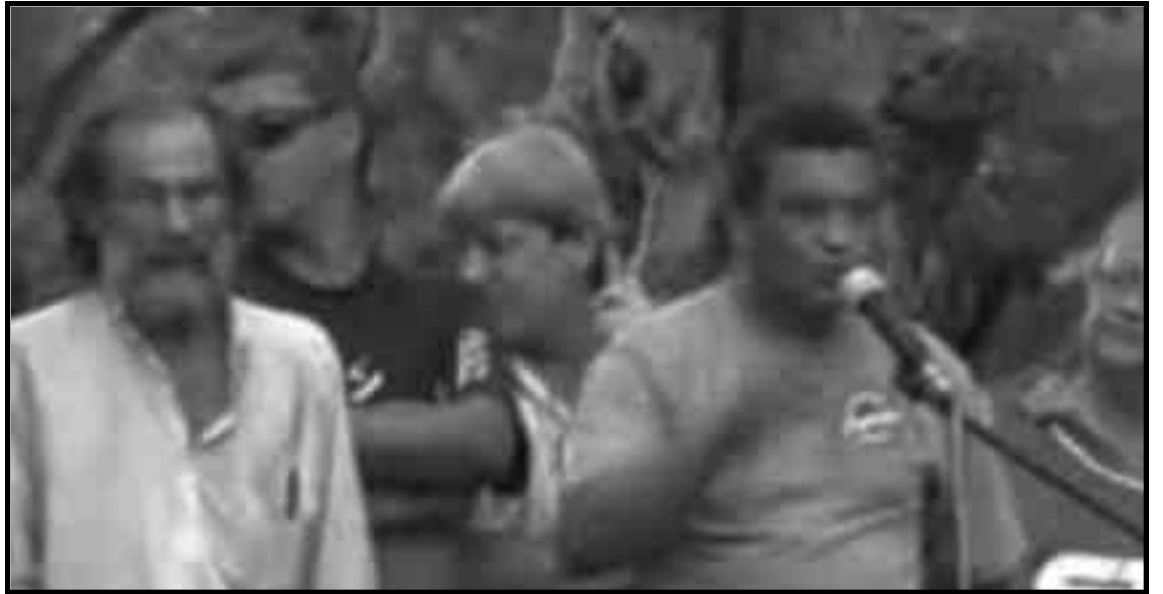
Metcom. Representantes de Conlutas (Brasil), CTA (Arg.) concentran sus fuerzas para derrotar a los obreros de metalúrgicos

Esta es la reconversión, con el REPRO (Reconversión pro-