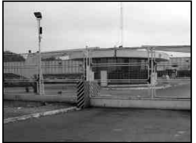
Fargo. Planta de Moreno donde se llevo adelante la lucha

podía seguir peleando, ya que Fargo era una empresa muy poderosa y que tenía muchos amigos en el gobierno y por lo tanto no se le podía ganar, que la lucha era de la vereda para adentro y había que esperar hasta octubre (eran los primeros días de agosto), para elegir una nueva comisión interna para poder pelear por sus reivindicaciones. Fue así que se firmó un acta en el Ministerio de Trabajo, donde la patronal se “comprometía” a no tomar represalias ni perseguir a los trabajadores. Desde Democracia Obrera,