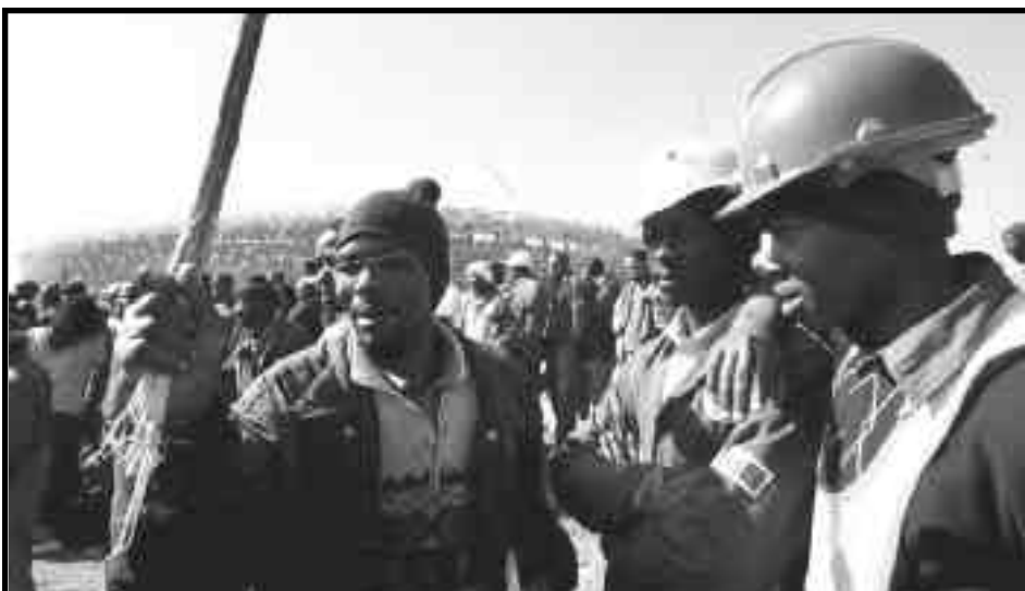
Huelga de los trabajadores de la construcción en Julio de 2009

Workers International Vanguard League Secretariado de Coordinación Internacional de la FLTI