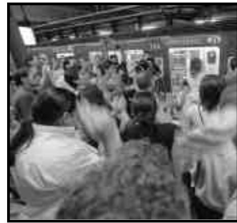
Subtes. Trabajadores Línea B paralizando la línea los que resisten contra los despidos y que luchan por aumento salarial y por trabajo digno para todos.

sindical y así terminar con todo lo que conseguimos con las jornadas revolucionarias de diciembre de 2001. La patronal viene por todo, porque necesita para salir de su crisis, profundizar el ataque y garantizar sus planes de esclavitud a todo el movimiento obrero. Esto se juega la patronal en Terrabusi y Subte, pero se chocó con una fuerte resistencia que concentra todas las demandas del movimiento obrero. Así, en las profundidades del subte, en medio del paro tronaba el grito de: ¡Subte y Terrabusi un sólo corazón! , ese es el sentir de la base obrera, el de la unidad de los trabajadores. Por ello, es de vida o muerte que concretemos esa unidad, porque esto es lo que ansían miles de trabajadores que ya están sufriendo el ataque patronal, con despidos, carestía de la vida, etc. ¡Viva la lucha de los trabajadores de Terrabusi y el Subte! ¡Hay que parar el ataque patronal! ¡Basta de pelear divididos! ¡Abajo la burocracia sindical de la CGT y CTA! ¡Abajo las conciliaciones obligatorias! ¡Abajo el pacto social! . La demanda de escala móvil de salarios y horas de trabajo esta a la orden del día para unificar junto a los obreros de Terrabusi y a todos