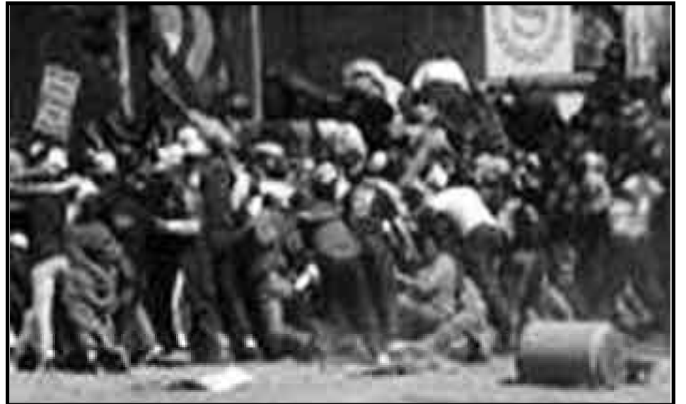
Movilización de los soldados en huelga

¡Hermanos! Ustedes están viviendo bajo condiciones de tiranía de los esclavistas. La burguesía sudafricana quiere que ustedes hagan el trabajo sucio en VUESTRO continente de sus amos impe-