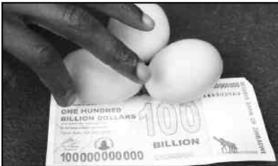
Zimbabwe. 100.000% de inflación y 92% de desocupación.