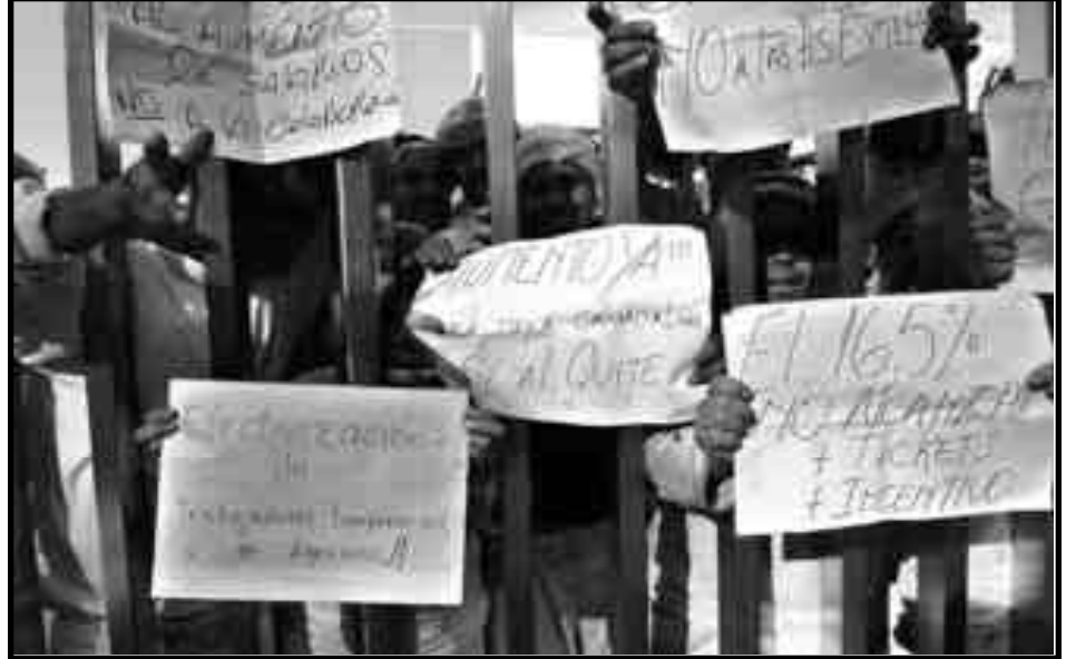
Terrabusi. Los trabajadores despedidos enfrentando el ataque patronal.

Z: Desde mi punto de vista, los compañeros de la Comisión Interna y los compañeros más activistas cometieron un grave error, pensaron que con la exigencia a Daer de que se ponga a la cabeza para defender a los trabajadores despedidos y Daer “se puso a la cabeza de defender los despedidos” pero los defendió como los defienden ellos que son comprados para que defiendan los intereses de los patrones y no de los obreros. Ahora el traidor de Daer recorre