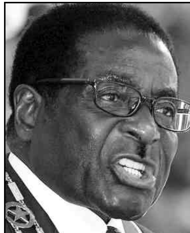
Robert Mugabe, representante del MDC, presidente de Zimbabwe

Apoyando las fuerzas pro-imperialistas como el MDC en Zimbabwe y no