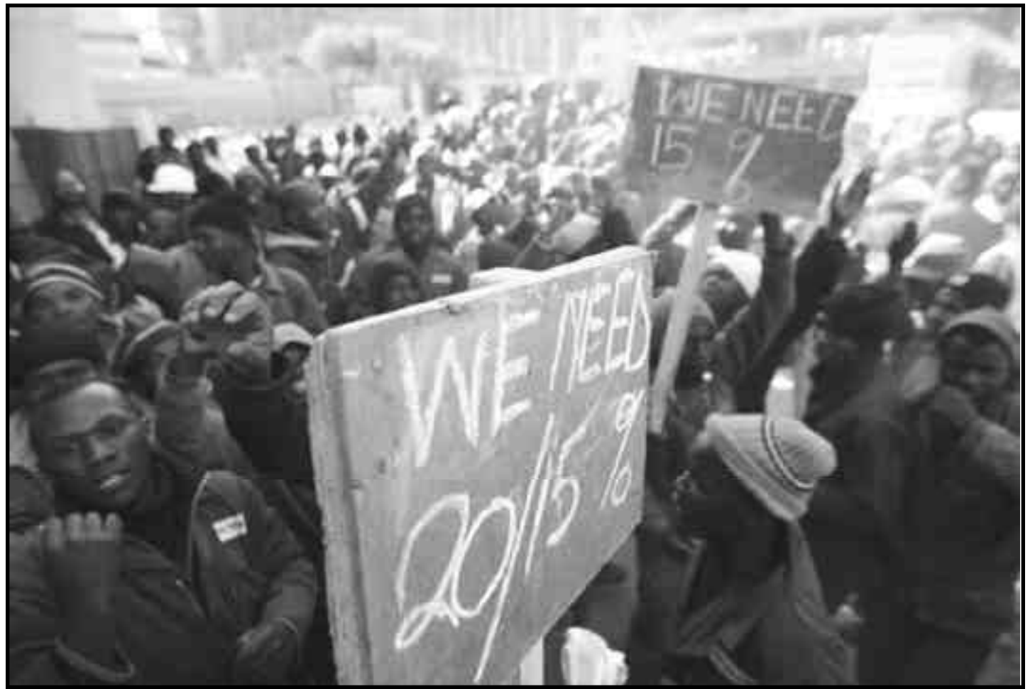
Huelga de los obreros de la construcción que paralizaron todas las obras por aumento de salarios en Sudáfrica

golpes fascistas contra la clase obrera de parte del imperialismo capitalista, mediante Mugabe, se han intensificado. Mientras tienen lugar las invasiones seleccionadas a tierras por parte de la base campesina rica de Mugabe, sus tropas cuidan las granjas comerciales, las fábricas, los negocios y las minas en manos del imperialismo. La respuesta del Comité de Coordinación Nacional (NCC) de la ISOZ frente al estallido fascista fue poner la fe en la iglesia: "podríamos comenzar con rezos en las iglesias locales designadas luego continuar con marchas y protestas desde las iglesias dirigidas por los pastores y la dirección del movimiento" (la declaración del Comité de Coordinación Nacional-NCC- del 11.06.05, Harare).