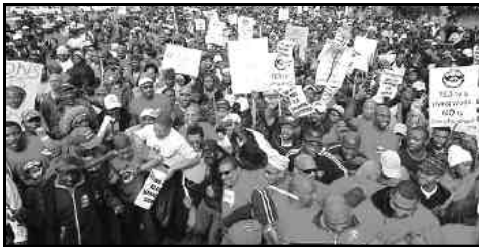
Masiva movilización de los explotados sudáfricanos por salarios dignos

El Sactwu invirtió millones del dinero de los trabajadores en HCL, que hoy posee el 70% del grupo Seardel. Esta propiedad mayoritaria no salvó a la compañía textil Frame (parte de Seardel) donde 1400 trabajadores perdieron sus trabajos y las maquinas de ultima generación están siendo vendidas a los monopolios internacionales. HCL tuvo que pedir préstamos