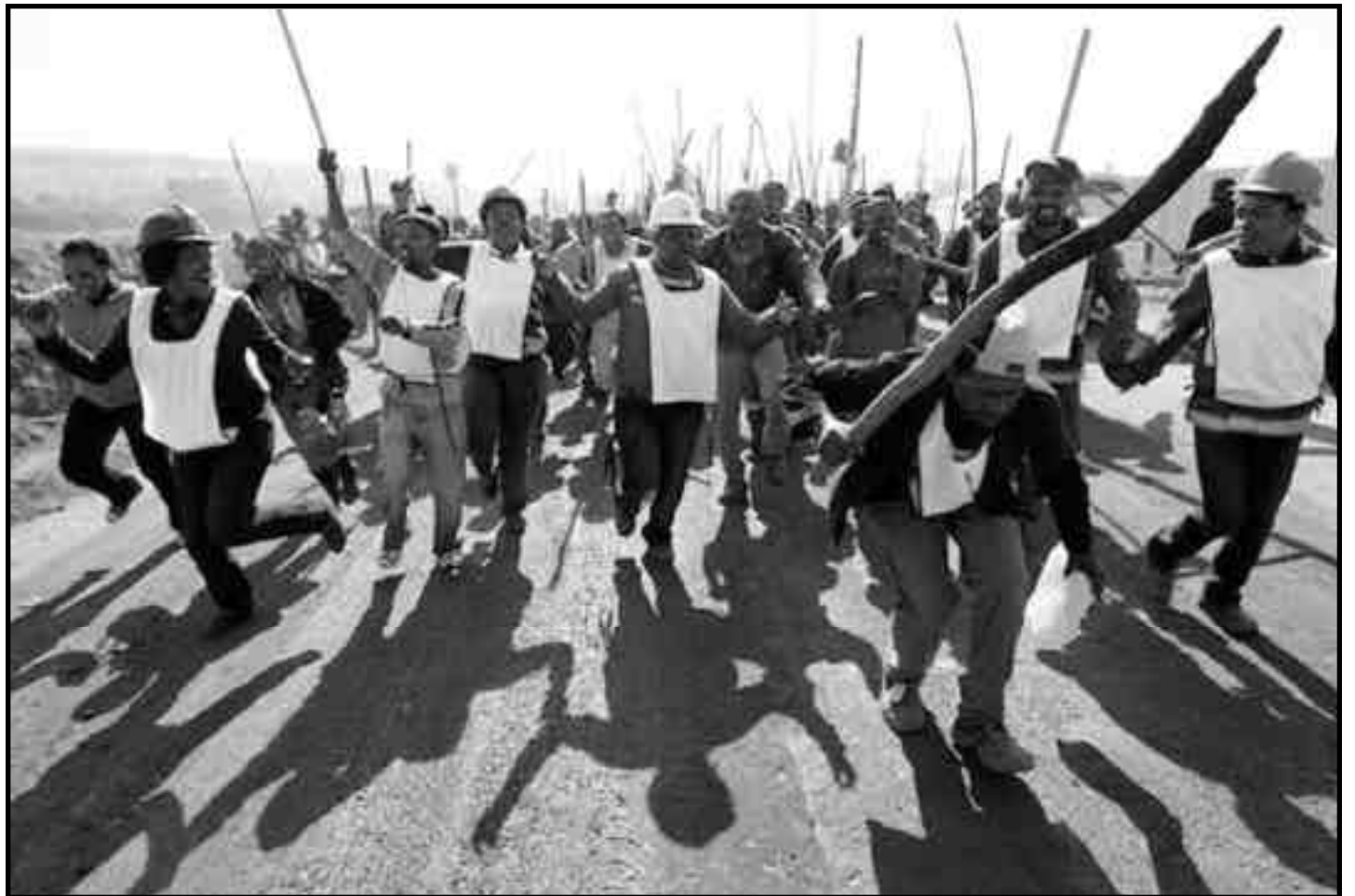
Movilización de los obreros de la construcción en huelga