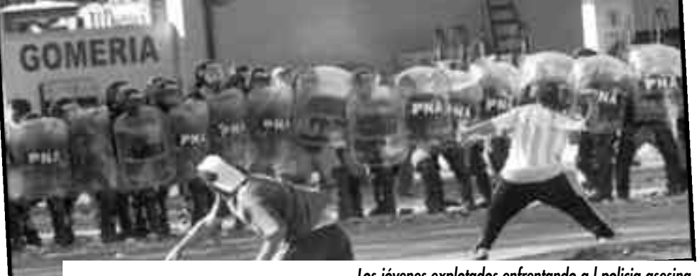
Los jóvenes explotados enfrentando a la policía asesina

Sus patrullas policiales en los barrios obreros, con sus autos sin patente que todas las noches circulan por nuestras calles, que cagándonos a palos intentan impedir que levantemos la cabeza, nos reprimen, nos asesinan y a la vez mantienen sus negocios con los tranzas que trabajan para ellos, concentrando sus fuerzas contra la juventud trabajadora. Por la tele nos acusan de borrachos y drogadictos y nos marcan