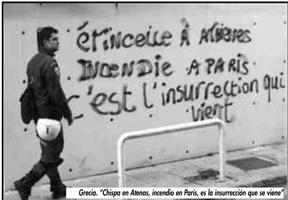
Grecia. “Chispa en Atenas, incendio en París, es la insurrección que se viene”

Esta política de la izquierda reformista, le significó a la clase obrera Argentina en los últimos años, la derrota de lo más combativo del proletariado como fuera Las Heras, SOIP de Mar del Plata, Casino, Dana, Mafissa por dar tan solo algunos crudos testimonios, todos llevados a la derrota por la izquierda reformista que le cubrió la espalda a la burocracia sindical llevando a los trabajadores a confiar en el Ministerio esclavista de Trabajo, en la justicia burguesa, dividiendo las luchas sector por sector, haciendo pasar las derrotas por triunfos, para terminar siendo la