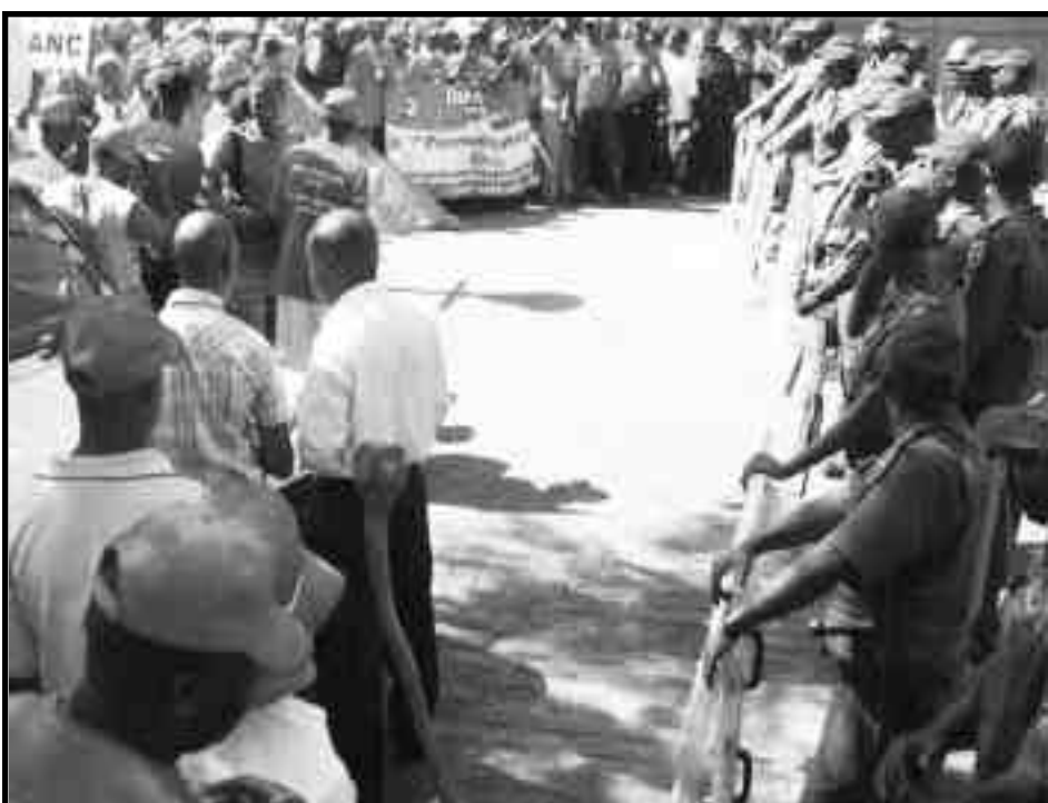
Trabajadores del transporte en huelga

PD: No se dejen engañar por las fuerzas reaccionarias como los dirigentes clericales, que ahora a las 5 de la mañana, "descubren" que los obreros y soldados están sufriendo. Ellos y las ONGs están allí para intentar pacificar a los esclavos (nosotros), no para hacer revueltas contra la explotación de los "amos".