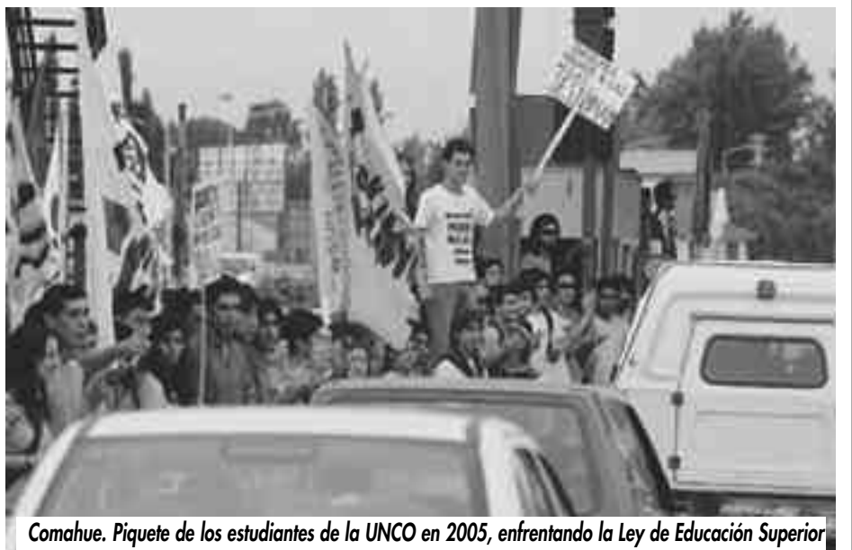
Comahue. Piquete de los estudiantes de la UNCO en 2005, enfrentando la Ley de Educación Superior

E: la verdad que nos tenemos que organizar mejor, por que por ahí quedamos medios dispersos a veces. Aunque estos tipos que supuestamente representan los intereses de los estudiantes, se juegan a que no salga nunca nada, entonces la movida es pasarlos por encima, no queda otra. Por que con esta gente a la cabeza no se puede pelear. Hay que correrlos a un costado y si no pasarlos por arriba y organizarse con todos los que quieran pelear pero en serio.