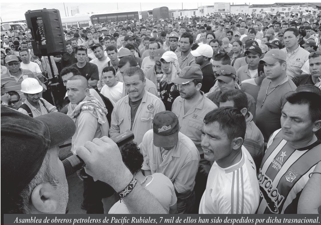
Asamblea de obreros petroleros de Pacific Rubiales, 7 mil de ellos han sido despedidos por dicha trasnacional.