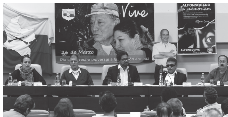
Delegación de las FARC, en las reuniones del diálogo en la Habana

No ha sido para nada casual que Castro le dijera a la resistencia en colombiana que no puede triunfar, que no se puede hacer en Colombia una “nueva Cuba”(1) es que su objetivo, lejos de que Colombia sea una nueva Cuba es transformar a Cuba –el único estado obrero en América, llevándolo primero a un grado extremo de descomposición por la política restauracionista de la bu-