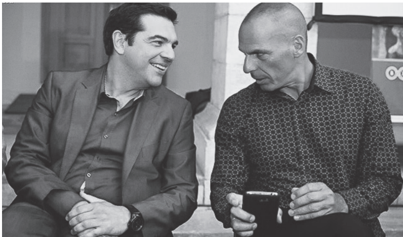
Tsipras y su ministro de economía.

“héroes de los explotados del mundo”. Este año los guardaron debajo de la alfombra. Ni los hicieron aparecer. Es que son impresentables, luego de que hicieran el “trabajo sucio” a cuenta del imperialismo.