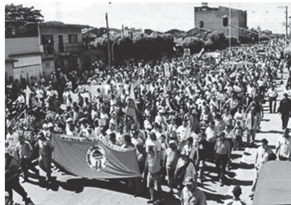
Marcha petroleros de la USO en Barrancabermeja de cuenta corriente, pasando -3.4% del PIB en 2013 a ser -5.5% del PIB en 2020.

Se proyecta así, para el 2015 un déficit fiscal de $ 90 billones de pesos por año, como también un aumento de la deuda externa por la devaluación del peso (la deuda externa colombiana supera a febrero de 2015 los 100 mil millones de dólares) e incremento del déficit