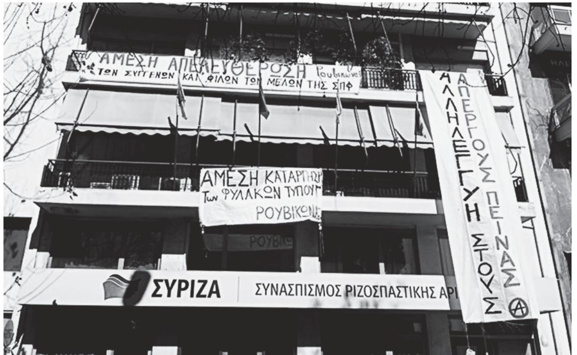
Local del partido Syriza tomado por la juventud. Banderas pidiendo por la libertad de los jóvenes presos en huelga de hambre

En Grecia, Syriza debe mantener este ataque a la juventud y a los trabajadores porque es el anteúltimo gobierno “de izquierda” aliado a la Goldman Sach y a la City de Londres que, como ayer el de Papandreu, ha venido a engañar a las masas para aplicar los peores planes mientras el capital financiero griego con la mano derecha sostiene a los fascistas de Amanecer Dorado, a los que le libera su dirigente de la prisión.