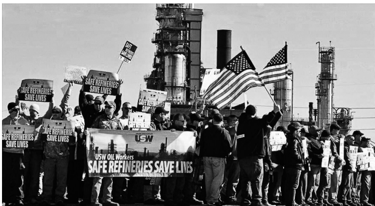
Obremos petroleros norteamericanos en huelga desde el 1° de febrero.

¡VIVA EL ENORME PARO NACIONAL DE LOS TRABAJADORES PETROLEROS DE EEUU! ¡ASÍ SE LUCHA! ¡ASÍ SE ENFRENTA A LAS TRASNACIONALES! Lea declaración completa en www.flti-ci.org