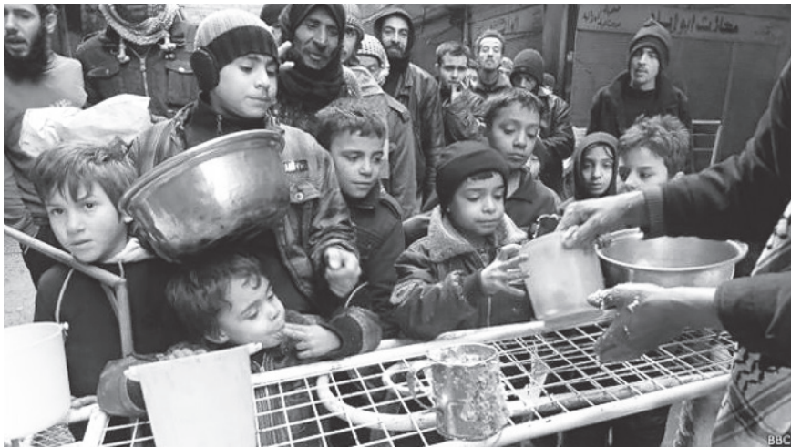
Niños palestinos de Yarmouk reciben agua y comida

a las masas sirias, a la Plaza Tahrir, a las masas de Bahrein... Todavía hay periodistas que se presentan como “intelectuales cultos” que dicen imbecilidades como que “la crisis yemení es un choque de dos potencias por el control de Medio Oriente, entre Irán y Arabia Saudita”... Una estupidez, si no fuera un engaño para evitar que la clase obrera mundial distinga a sus aliados, los explotados, combatiendo en el Magreb y Medio Oriente.