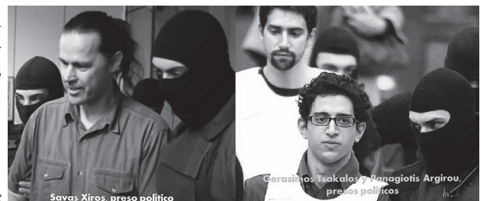
Jóvenes griegos presos políticos

La clase obrera alemana es la gran aliada de los obreros griegos. Si los derrotan a éstos, le irá muy mal a la clase obrera alemana. A ésta ya le han quitado las 36 horas semanales y le han reducido el salario. Si aplastan Grecia, mañana profun-