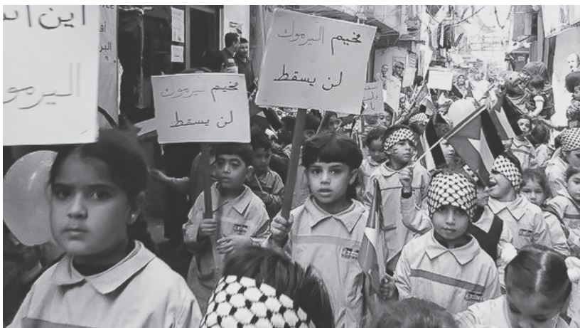
Movilización en Sabra y Shatila en apoyo a sus hermanos de Yarmouk

¡Paremos el genocidio al pueblo palestino en Yarmouk y de todas las masas sirias!