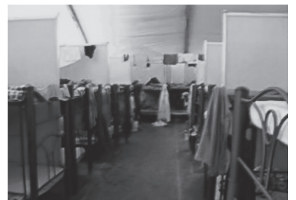
Dormitorio de los obreros petroleros de Pacific Rubiales

Lamentablemente, la tragedia que está viviendo la clase obrera y el pueblo pobre colombiano es la consecuencia de los pactos