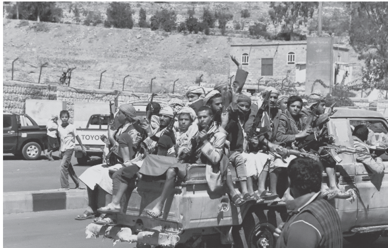
Obreros y campesinos yemeníes armados enfrentan al imperialismo y a las burguesías lacayas de Obama de la región

El FSM se ha encargado de que este grito de lucha con el cual las masas identifican a su enemigo se disipe, que se destruya, que no exista más. Por eso sostienen, mintiéndole a las masas, que el estado sionista-fascista de Israel puede reconocer una nación que ocupa –como es Palestina– sin oprimirla, aplastarla y masacrarla. Significa que EEUU no es el enemigo de las masas. EEUU, para ellos, “trae la democracia” para que las “primaveras” florezcan. Les lavan la cara a los carniceros imperialistas de Wall Street que comandan las más brutales masacres contra las masas del Magreb y Medio Oriente y en todo el mundo.