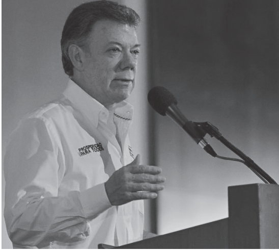
J.M. Santos, el lacayo de Obama

mete contra la prestación social de las pensiones, a. Eliminar definitivamente el régimen de prima media que hoy administra Colpensiones y entregarle esos recursos a los fondos privados, que ya administran más de $150 billones. b. Aumentar la edad de pensión de las mujeres de 57 a 62 años e igualarlas a los 65 años, (más 1300 semanas cotizadas) lo cual es absolutamente discriminatorio con las mujeres y que en la práctica significa acabar con esa prestación social que incrementará la pobreza y la desatención de los adultos mayores y niños. c. Aprobar que existan pensiones por debajo del actual salario mínimo lo que causará exorbitantes ganancias para el capital financiero que administra los fondos de pensiones, es decir la banca privada. 5. Facultades extraordinarias al presidente de la República para reestructurar las entidades del Estado. Estas facultades, aunado a los recortes al presupuesto del PND en $90 billones y de los gastos de personal para 2015 en $6 billones, siempre las han utilizado todos los anteriores gobiernos para privatizar lo poco que queda, reducir y liquidar entidades y dependencias y en consecuencia despidos masivos, e imponer un régimen de contratación, tercerización y de las OPS (Órdenes de Prestación de Servicios).