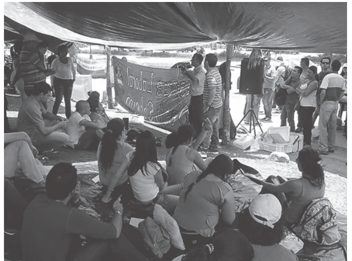
Trabajadores(as) despedidos del ICP, en la carpa montada en las afueras del Instituto Colombiano del Petróleo

¡La clase obrera colombiana se va a poner