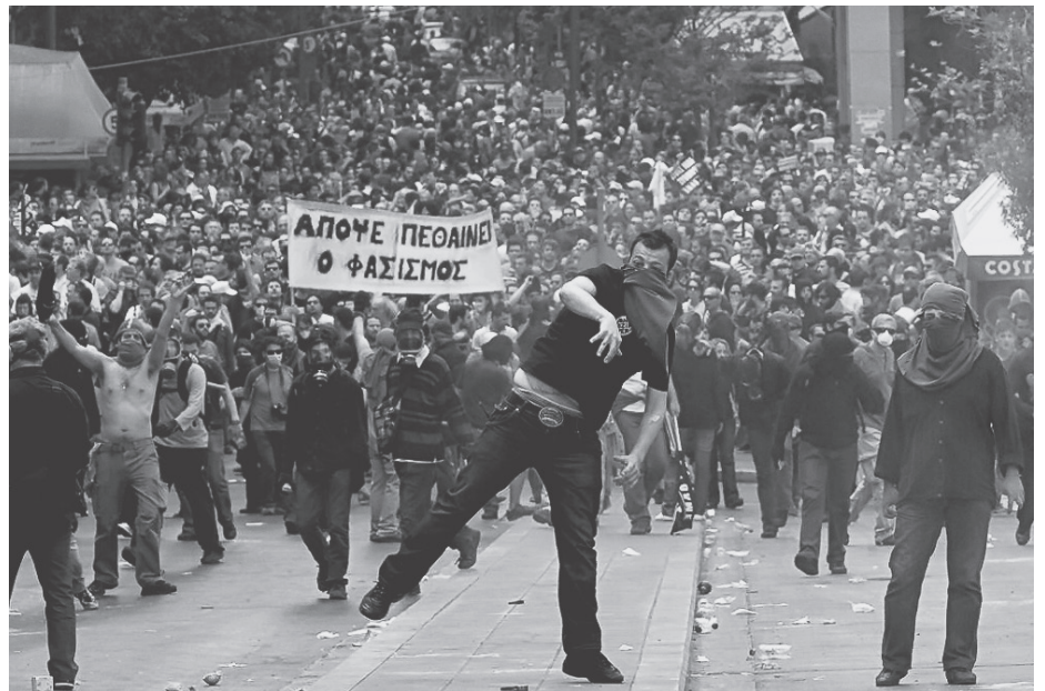
Movilización de las masas griegas en el 2010

√ Los gobiernos de las transnacionales griegas y de su capital financiero, como ayer el de derecha de Nueva Democracia o el “socialista” de Papandreu o el “izquierdista” de Syriza de hoy no pueden enfrentar ni a la UE, ni al FMI, ni al Bundesbank, ni a Wall Street porque son parte de ellos; son parte de sus directorios y su gerenciamiento.