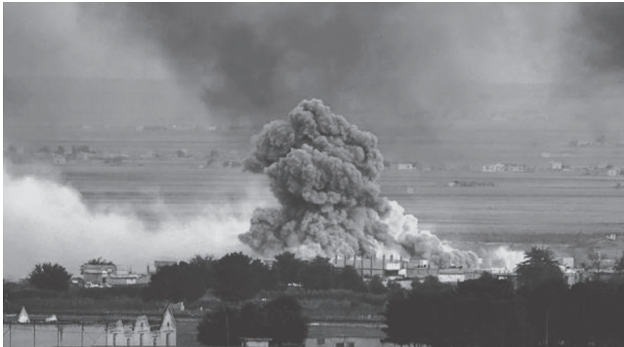
Bombardeo de la aviación de genocida Al Assad sobre Yarmouk

del mundo musulmán enfrentan y resisten a los gobiernos que sostienen al estado sionista-fascista de Israel, como el perro Bashar y los generales de Egipto que firmaron el pacto de Camp David de reconocimiento del estado de Israel en 1979. Ni hablar de los jeques de la monarquía asesina saudita, simples marionetas a sueldo de la British Petroleum, la Shell y la Exxon. Es que la banda de las petroleras imperialistas son los verdaderos jefes del sionismo que ocupa la nación palestina y los que sostienen a todos los regímenes antiobremos del mundo árabe y musulmán.