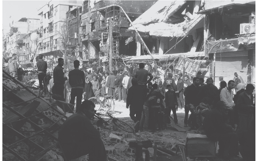
Los explotados palestinos observan entre los escombros a Yarmouk destruida