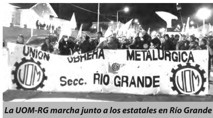
La UOM-RG marcha junto a los estatales en Río Grande

La Unión de Gremios, que llama a un nuevo paro provincial este 26 de mayo, tiene toda la autoridad ganada en su combate para desde el acampe llamar ya mismo a un