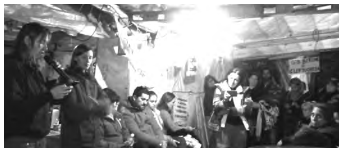
Ushuaia: los docentes leen la carta en el acampe

Esta lucha la damos en el sindicato seccional Matanza, en nuestras escuelas,