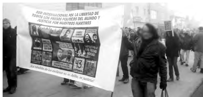
Bandera de la "Red Internacional..." en Ushuaia

Congreso Obrero Nacional de Lucha con delegados de todas las organizaciones obreras combativas y sectores que resisten el ataque de la patronal y el gobierno , en donde conquistemos un plan de lucha unificado ¡Delegaciones de todas las organizaciones obreras y estudiantiles combativas para poner en pie dicho Congreso y conquistar la Huelga General! Las organizaciones obreras combativas, como la Federación de Aceiteros y el sindicato del neumático SUTNA, deben encabezar este llamamiento junto a la Unión de Gremios.