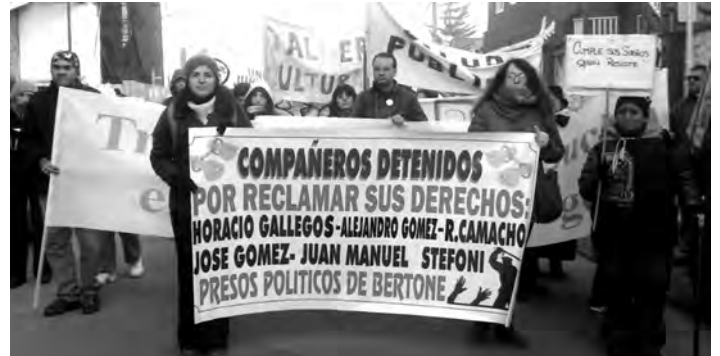
Ushuaia: La bandera de los compañeros que estuvieron detenidos encabezaba la marcha del 18 de Mayo

argentino. Por eso han concentrado todas las fuerzas de sus instituciones para dejarla aislada y derrotarla. Ya lo han intentado con los matones de la burocracia sindical de camioneros, con la represión de la policía (la misma que asesinó a Víctor Choque en el año 1995) y con la justicia encarcelando y procesando a los dirigentes de la lucha que se suman a los 33 compañeros ya condenados.