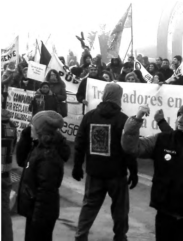
Paro y marcha del 18 de Mayo