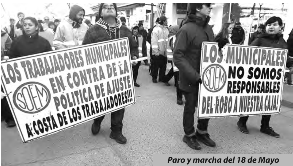
Paro y marcha del 18 de Mayo

Estatal C: - “Es que lo que sufrimos nosotros lo van a sufrir todos, el impuestazo, el tarifazo y los despidos. Y las rebajas en las jubilaciones es para todos y nos van a aplicar el impuesto a las ganancias. Esto no se aguanta más y se viene con todo. Nosotros ya pasamos más de 80 días de acampe. Hay que hacer algo contundente, no solo los 23 gremios que estamos acá, sino que la UOM, portuarios, los del transporte, comercio, se tienen que sumar ¿y del resto del país que esperan? La iniciativa de sacar con trabajadores estatales y privados un paro nacional es importante, pero para que se sienta que estamos en disconformidad con todas las medidas que está tomando el gobierno tanto provincial como nacional ”.