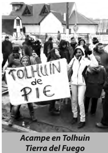
Acampe en Tolhuin Tierra del Fuego

E l pasado 20 de mayo los docentes realizaban una marcha en Termas de Río Hondo, en lucha por sus demandas de aumento salarial, blan-