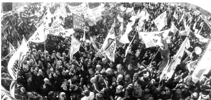
Paro de petroleros en Comodoro Rivadavia

Para seguir en su plan de ataque a los trabajadores, el gobierno de Macri, con su gabinete de CEOS, junto a todos los partidos patronales, necesitan derrotar la lucha de los trabajadores de Tierra del Fuego. Saben que se ha transformado en una lucha testigo de todo el movimiento obrero