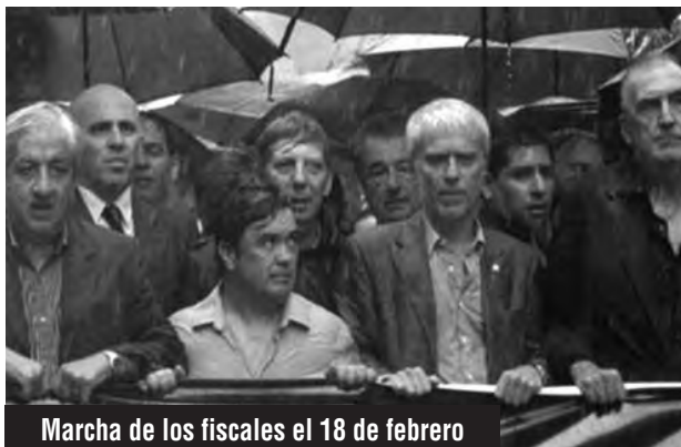
Marcha de los fiscales el 18 de febrero