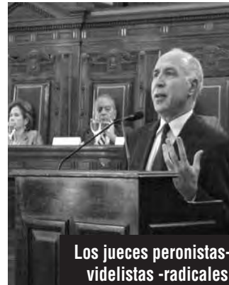
Los jueces peronistas-videlistas -radicales

NO PUEDE HABER OLVIDO: a los obreros petroleros de Las Heras los encarcelaron, torturaron y condenaron a cárcel y cadena perpetua: LOS JUECES Y FISCALES VIDELISTAS al mando de los banqueros, las petroleras y las transnacionales.