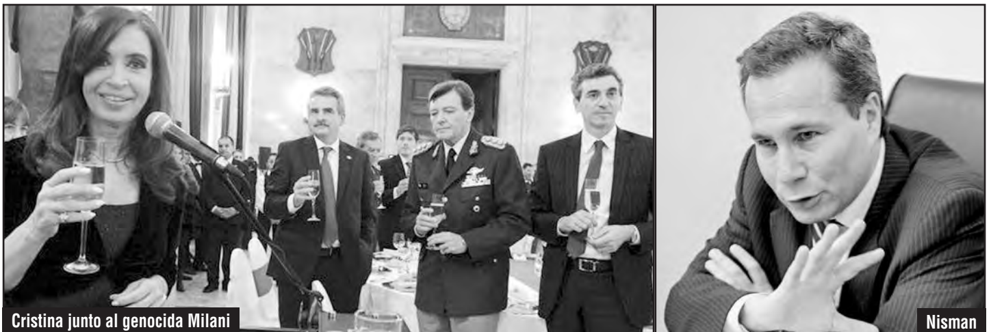
Cristina junto al genocida Milani

Guerra de los servicios de inteligencia videlistas bajo el mando de los jueces y fiscales y los políticos corruptos