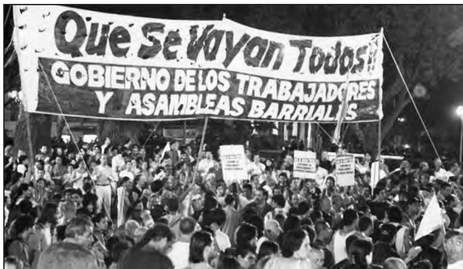
Asamblea Interbarrial Nacional en Parque Centenario 2002

De manos de la burguesía cipaya socia del imperialismo sólo se profundizará el hambre, la miseria, el saqueo de la nación y el ataque a todas las libertades democráticas, donde los que realmente pondremos los muertos, los presos y los condenados somos los trabajadores