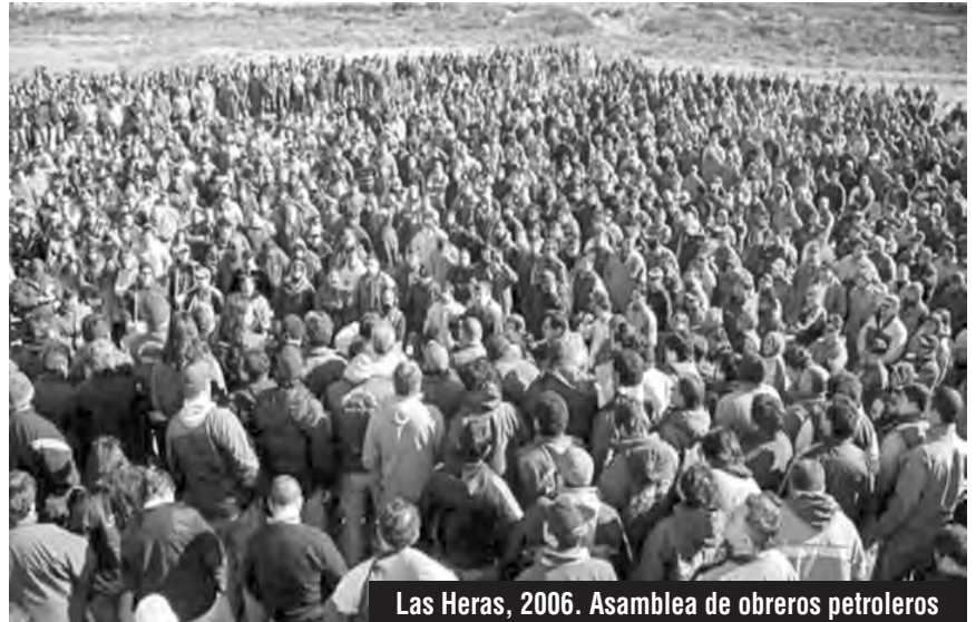
Las Heras, 2006. Asamblea de obreros petroleros

En la Argentina de Wall Street, de la CIA, de los terroristas de la Mossad, de las transnacionales imperialistas... los únicos que ponemos los muertos por decenas de miles somos la clase obrera ¡Que la lucha por el botín entre los explotadores la resuelvan entre ellos! ¡Ellos saben quiénes son sus sicarios y sus servicios!