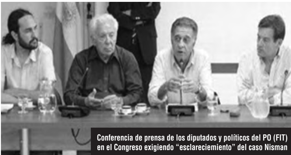
Conferencia de prensa de los diputados y políticos del PO (FIT) en el Congreso exigiendo "esclarecimiento" del caso Nisman

¡Basta de dividir a los que luchan! ¡Hay que poner en pie un verdadero frente de los trabajadores!