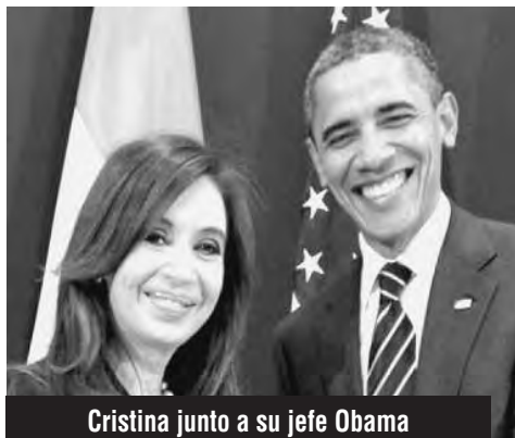
Cristina junto a su jefe Obama

Massa, Carrió, Macri, Binner y demás políticos patronales, junto a la Suprema Corte de Justicia y el genocida Milani, en ese parlamento dirigido por los piratas de Wall Street, ovacionaron de pie a la Kirchner que llamó a hacer efectiva la condena contra los compañeros de Las Heras.