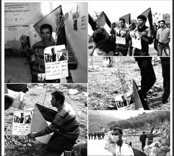
Dicimbre 2014 en PALESTINA: El Día Global por los Presos Políticos, en Nablus

También desde nuestra Comisión de Trabajadores Condenados, Familiares y Amigos de Las Heras, hemos realizado un llamado a todas las organizaciones obreras y estudiantiles y las que pelean contra los estados asesinos y por la libertad de los presos políticos del mundo para realizar una Jornada Internacional con mítines y acciones en las calles, para este 24 al 26 de marzo .