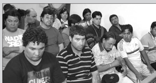
Petroleros condenados de Las Heras