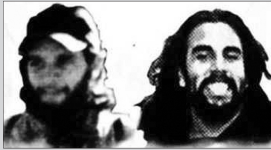
Maximiliano Kosteki y Darío Santillán