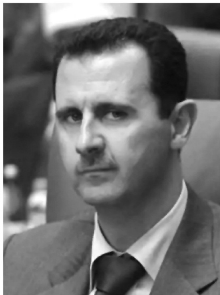
Bashar Al Assad