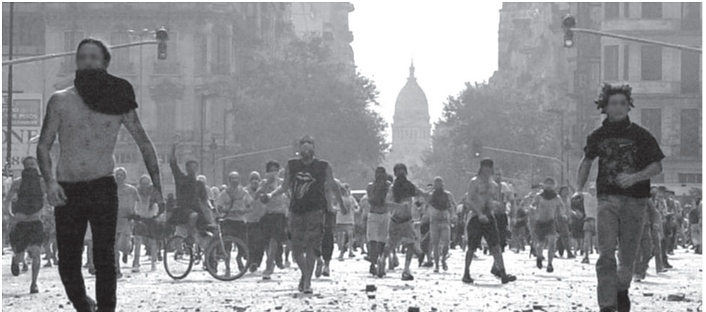
Argentina diciembre 2001. Comienza la revolución

Hay que retomar el camino del 2001... ¡Que se vayan todos, que no quede ni uno solo!