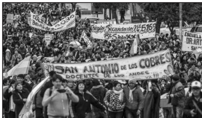
Docentes autoconvocados de Salta en lucha por salario

¡Hay que romper con el FMI, expropiar a la oligarquía y nacionalizar sin pago y bajo control obrero los bancos y las transnacionales!