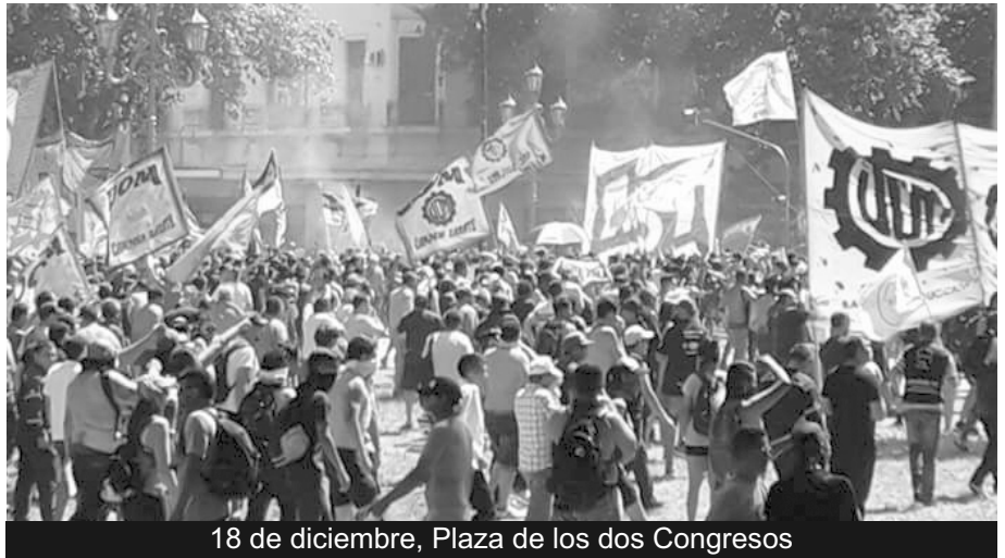
18 de diciembre, Plaza de los dos Congresos