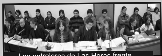
Los petroleros de Las Heras frente al tribunal que los condenó