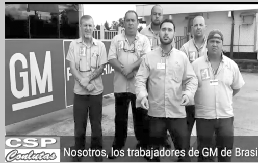
Nosotros, los trabajadores de GM de Brasil