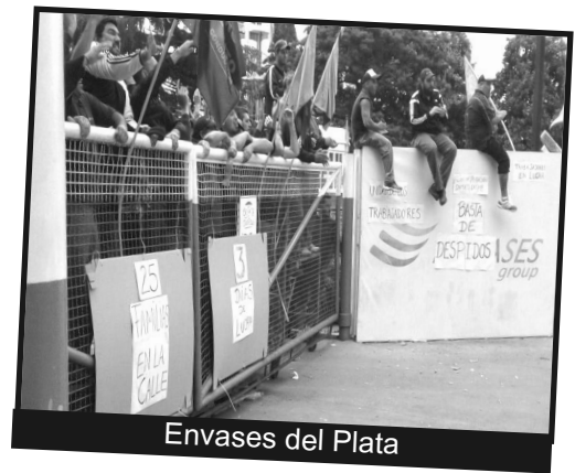
Envases del Plata

llamamos a todos los metalúrgicos de las seccionales con las que estuvimos enfrentando los planes esclavistas de Macri, los patrones y el triunvirato el 18 de diciembre, y a los que están luchando en centenares de fábricas del país, a que demos juntos esta pelea porque ¡La UOM es de los trabajadores, no de los patrones! ¡La UOM para los laburantes, sin burócratas vendidos ni atorrantes!